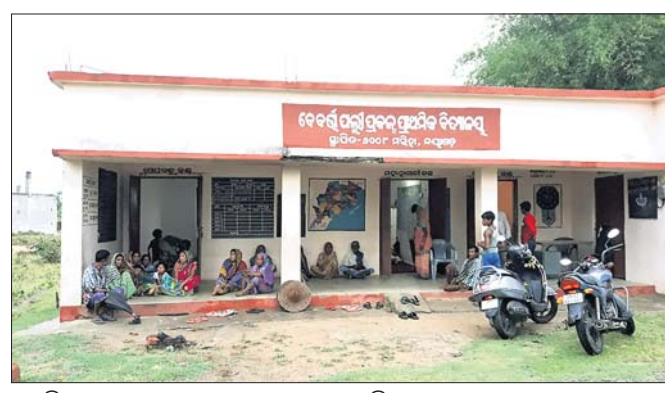
ଏକ ବିଦ୍ୟାଳୟରେ ଲୋକମାନେ ଆଶ୍ରୟ ନେଇଛନ୍ତି।