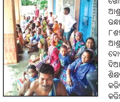
ଆଶ୍ରୟସ୍ଥଳୀରେ ଥିବା ଲୋକମାନେ।

ଫନୀ ପ୍ରଭାବରୁ ଲୋକଙ୍କ ଧନ, ଜୀବନ ସୁରକ୍ଷା ପାଇଁ ବୋଲଗଡ଼ ବ୍ଲକ ପ୍ରଶାସନ ପକ୍ଷରୁ ବ୍ୟାପକ ପ୍ରସ୍ତୁତି କରାଯାଇଛି। ବିପଜ୍ଜନକ ଘରେ ଆଶ୍ରୟ ନ ଦେଇ ସୁରକ୍ଷିତ ଆଶ୍ରୟ ସ୍ଥଳ ଓ କୋଠାଘରକୁ ସ୍ଥାନାନ୍ତର ପାଇଁ ବୁଧବାର ତାଳବାଜି ଯନ୍ତ୍ର ଯୋଗେ ଲୋକମାନଙ୍କୁ ସଜାଗ କରାଯାଇଥିଲା। ଗୁରୁବାର ରୁକ୍ତ ବିଭିନ୍ନ ସ୍ଥାନରେ ଥିବା ୩୫ଟି