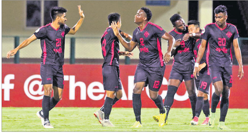
ଗୋଲ ଖୋର କରିବା ପରେ ନିନର୍ତ୍ତା ପଞ୍ଜାବ ଦଳର ଖେଳାଳିମାନେ ଖୁସି ମନାଉଛନ୍ତି ।

ଏସପିଏ କପ୍‌ର କଳିଙ୍ଗ ଷ୍ଟାଡ଼ିୟମରେ ରୁଧିରୀ ଅନୁଷ୍ଠିତ ନିନର୍ତ୍ତା ପଞ୍ଜାବ ଓ ମନଙ୍ଗ ମିଶ୍ରଆଇଡି ମ୍ୟାଚ ୨-୨ ଗୋଲରେ ଡ୍ର ରହିଛି । ଫଳରେ ଘରୋଇ ଗ୍ରାଉଣ୍ଡରେ ୨ ଥର ଅଗ୍ରଣୀ ନେବା ସତ୍ତ୍ୱେ ନିନର୍ତ୍ତା ପୁରା ୩ ପଏଣ୍ଟ ହାସଲ କରି ପାରିନାହିଁ ।