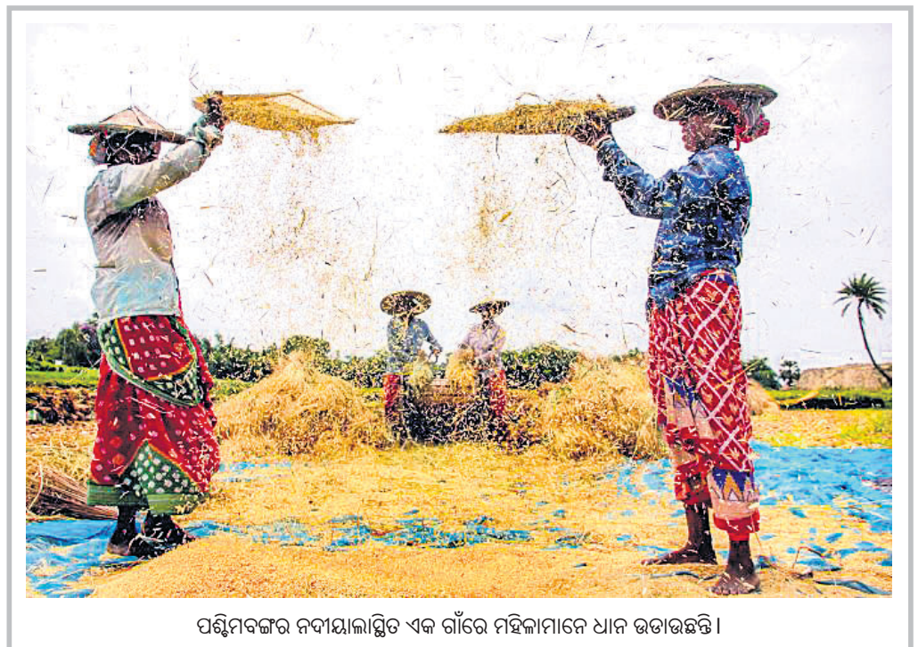
ପଶୁମତଙ୍ଗର ନବାୟାଲୁଗିତ ଏକ ଗାଁରେ ମହିଳାମାନେ ଧାନ ଭତାଉଛନ୍ତି।

ପ୍ରତିଷ୍ଠିତ ହୋଇଛି। ଏହା ପ୍ରଧାନମନ୍ତ୍ରୀ ନରେନ୍ଦ୍ର ମୋଦିଙ୍କ ବହିର୍ବ୍ୟାପାର ନୀତିର ଏକ ବଡ଼ ସଫଳତା। ଗାନ୍ଧୀ ବହିର୍ବ୍ୟାପାର ମନ୍ତ୍ରଣାଳୟ ପକ୍ଷରୁ ଏକ ବିବୃତିରେ କୁହାଯାଇଛି ଯେ, ଆଝାରଙ୍କ ବିରୋଧରେ ଭାରତ ନୂଆ ପ୍ରମାଣ ଦେବା ପରେ ଦେଶ ତାକୁ ଅନୁଧ୍ୟାନ କରିଛି ଏବଂ ପ୍ରସ୍ତାବକୁ ବିରୋଧ କରିନାହିଁ।