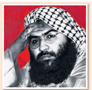
ସଫଳତାର ଶ୍ରେୟ ନେବାକୁ ଭାଜପାର ଉଦ୍ୟମ