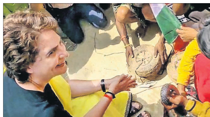
ଲକ୍ଷ୍ମୀ, ୨୫ (ପି.ଟି.)

କଂଗ୍ରେସ ସାଧାରଣ ସମ୍ମାନ ପ୍ରିୟଙ୍କା ଗାନ୍ଧୀ ଭଦ୍ରାଙ୍କୁ ବ୍ୟକ୍ତିତ୍ୱର ଏକ ନୂଆ ଦିଗ ସାମ୍ନାକୁ ଆସିଛି। ଉପାଧ୍ୟକ୍ଷ ତଥା ମା' ସୋନିଆ ଗାନ୍ଧୀଙ୍କ ସଂସଦୀୟ ଆସନ ରାଜ୍ୟରେ ଲୁଚାଇ ରଖିବା ପ୍ରଚାରରେ ଆଝାର ଏହାକୁ ସାମ୍ନା କରି ପ୍ରଚାରରେ ପୁଞ୍ଜି ଭାବେ ବ୍ୟବହାର କରିଛି।