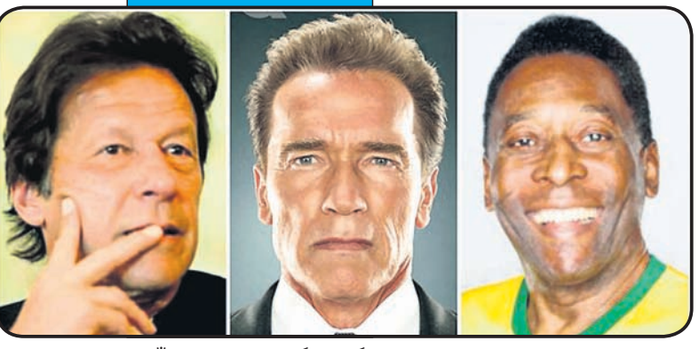
ଇମ୍ରାନ ଖାଁ, ଆନେଲ୍ଡ ସ୍ପାର୍ଟନେଗେର, ସେଚେ