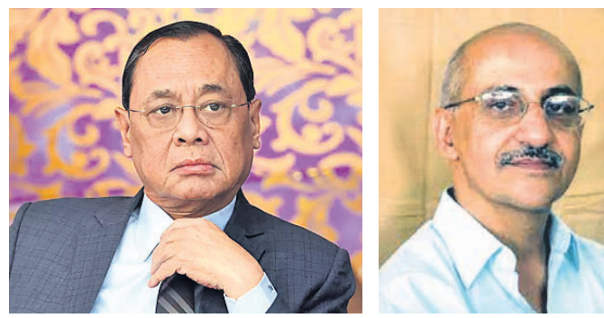
ଜଷ୍ଟିସ ରଞ୍ଜନ ଗୋଗୋଇ