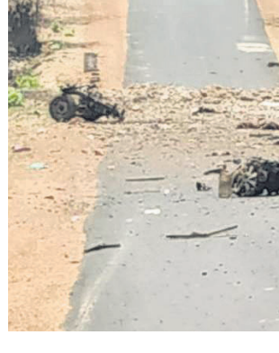
କୈସ୍‌ଲ କରିଛନ୍ତି। ଅନ୍ୟପକ୍ଷରେ ମାଓବାଦୀ ଦମନରେ ବିଫଳତା ପାଇଁ ଗୁହ ମନ୍ତ୍ରଣାଳୟ ଦାୟିତ୍ୱରେ ଥିବା ମୁଖ୍ୟମନ୍ତ୍ରୀ ଦେବେନ୍ଦ୍ର ଫଡ଼ନବିସ୍ ଜପ୍ତା ଦିଅନ୍ତୁ ବୋଲି ଏନସିପି ଅଧ୍ୟକ୍ଷ ଶରଦ ଖାତ ସୃଷ୍ଟି ହେବା ସହ ଗାଡ଼ିଟି ସମ୍ପୂର୍ଣ୍ଣ ନଷ୍ଟ ହୋଇଯାଇଥିଲା।

ଆତଙ୍କବାଦୀ ଆକ୍ରମଣରେ ୧୫ ଯୋଲିସ ଶହୀଦ ହୋଇଥିବାବେଳେ ସେମାନଙ୍କୁ ନେଇ ଯାଉଥିବା ଗାଡ଼ିର ଡ୍ରାଇଭର ମଧ୍ୟ ନିହତ ହୋଇଛନ୍ତି।