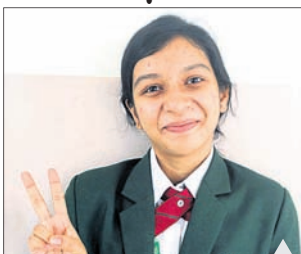
ସବିଶେଷ ତଥ୍ୟ: ପୃଷ୍ଠା-୩

ସିବିଏସ୍‌ର ଦ୍ୱାଦଶଶ୍ରେଣୀ ପରୀକ୍ଷା ଫଳ ପ୍ରକାଶ ଶାଲିନୀ ଓଡ଼ିଶା ଚପ୍ପର