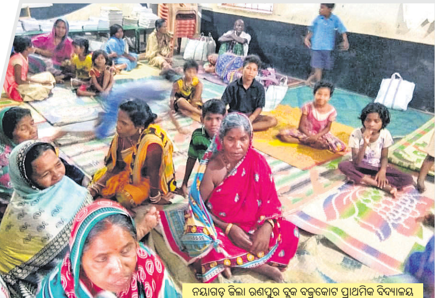
ନୟାଗଡ଼ ଜିଲ୍ଲା ରଣପୁର ବ୍ଲକ୍ ବଜ୍ରକୋଟ ପ୍ରାଥମିକ ବିଦ୍ୟାଳୟ ଆଶ୍ରୟସ୍ଥଳୀରେ ରହିଥିବା ମହିଳା, ପୁରୁଷ ଓ ଶିଶୁ ।