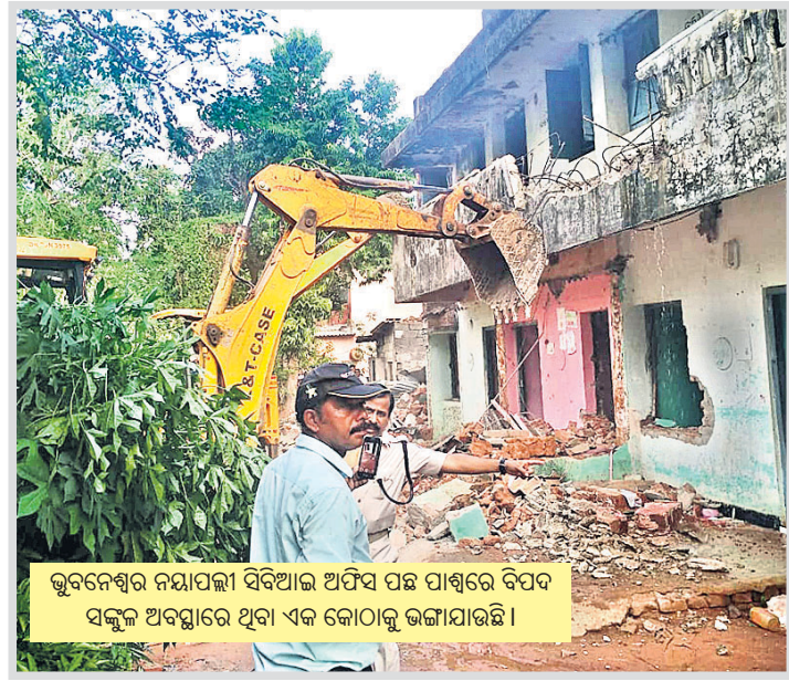
ଭୁବନେଶ୍ୱର ନୟାପଲ୍ଲୀ ସିବିଆଇ ଅଫିସ ପଛ ପାଖରେ ବିପଦ ସଙ୍କଳ ଅବସ୍ଥାରେ ଥିବା ଏକ କୋଠାକୁ ଭଙ୍ଗାଯାଇଛି ।