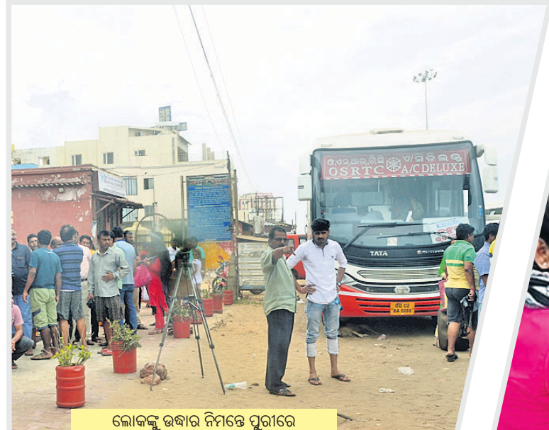
ଲୋକଙ୍କୁ ଉଦ୍ଧାର ନିମନ୍ତେ ପୁରୀରେ ପହଞ୍ଚିଥିବା ଓଏସ୍ଆର୍ଟିସି ବସ ।