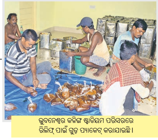
ଭୁବନେଶ୍ୱର କଳିଙ୍ଗ ଷ୍ଟାଡ଼ିୟମ ପରିସରରେ ରିଲିଫ୍ ପାଇଁ ଗୁଡ଼ ପ୍ୟାକେଟ୍ କରାଯାଇଛି ।