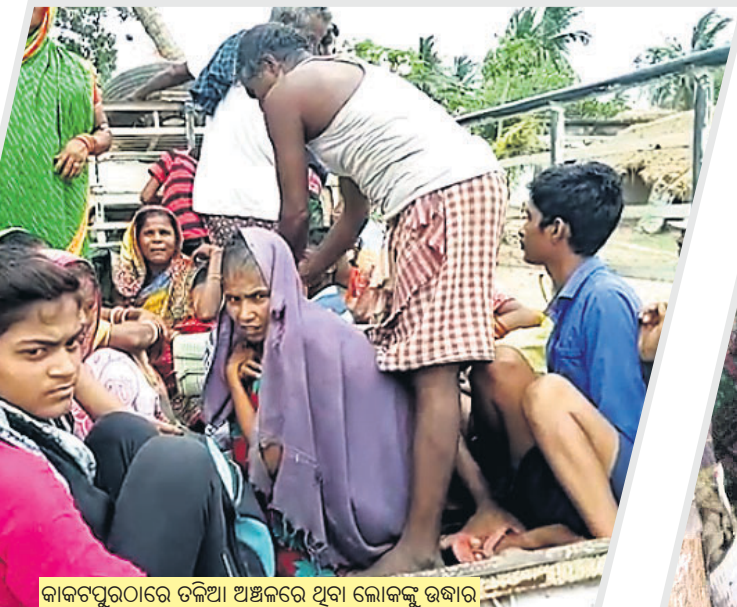
କାକଟପୁରଠାରେ ଚଳିଆ ଅଞ୍ଚଳରେ ଥିବା ଲୋକଙ୍କୁ ଉଦ୍ଧାର କରାଯାଇ ସୁରକ୍ଷିତ ସ୍ଥାନକୁ ନିଆଯାଇଛି ।