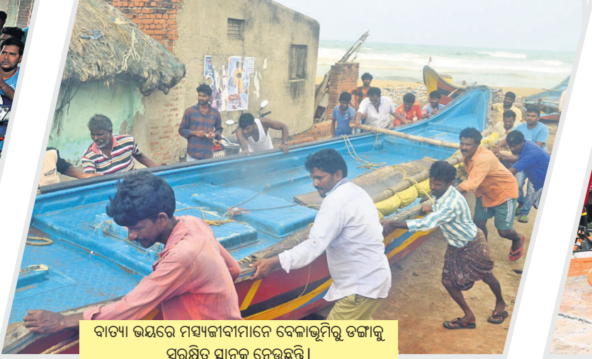
ବାତ୍ୟା ଭୟରେ ମାସ୍ୟକାମୀମାନେ ବେଳାଭୂମିରୁ ତଙ୍ଗାକୁ ସୁରକ୍ଷିତ ସ୍ଥାନକୁ ନେଉଛନ୍ତି ।