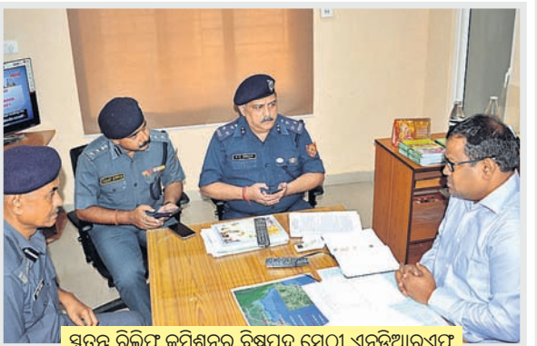
ସ୍ୱତନ୍ତ୍ର ରିଲିଫ୍ କମିଶନର ବିଷୁପଦ ସେଠା ଏନ୍ଡିଆରୁଏଟ୍ ଅଧିକାରୀଙ୍କ ସହ ଆଲୋଚନା କରୁଛନ୍ତି ।