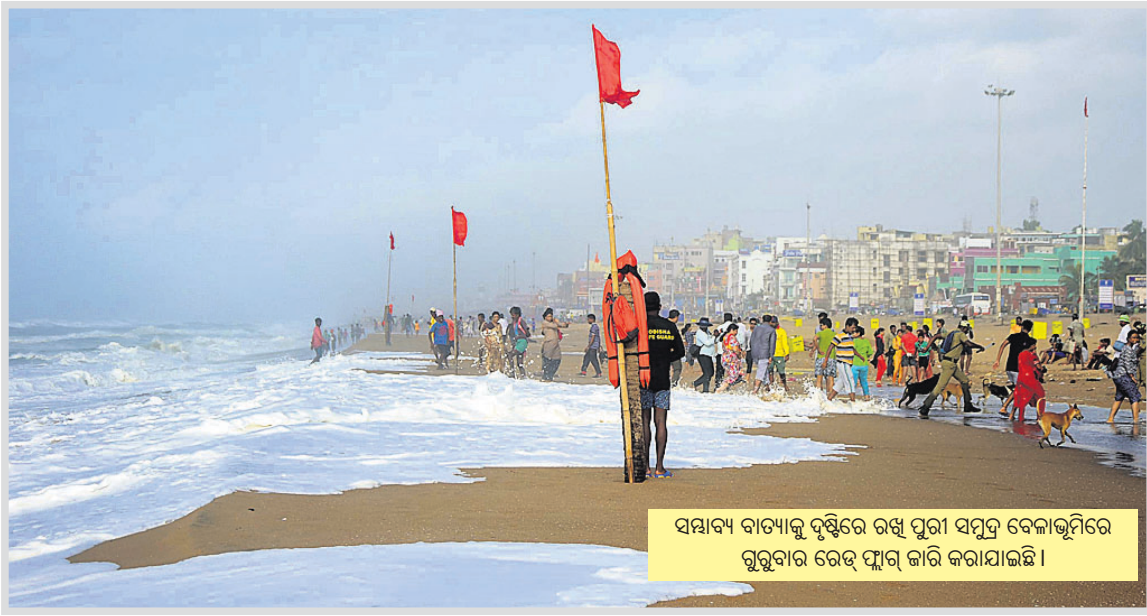
ସମ୍ଭାବ୍ୟ ବାତ୍ୟାକୁ ଦୃଷ୍ଟିରେ ରଖି ପୁରୀ ସମୁଦ୍ର ବେଳାଭୂମିରେ ଗୁରୁବାର ରେଡ୍ ଫ୍ଲାଗ୍ କାରି କରାଯାଇଛି ।