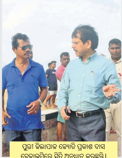
ପୁରୀ ଜିଲ୍ଲାପାଳ ଜ୍ୟୋତି ପ୍ରକାଶ ଦାସ ବେଳାଭୂମିରେ ସ୍ଥିତି ଅନୁଧ୍ୟାନ କରୁଛନ୍ତି ।