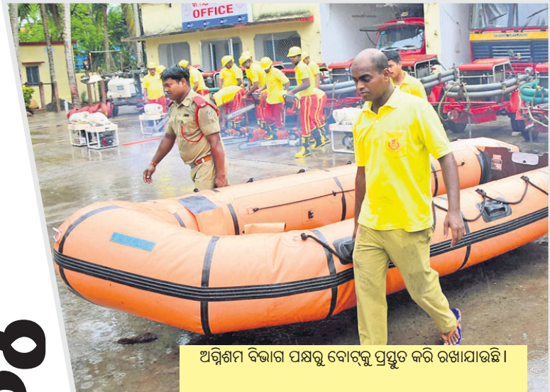
ଅଗ୍ନିଶମ ବିଭାଗ ପକ୍ଷରୁ ବୋର୍ଡ଼ ପ୍ରସ୍ତୁତ କରି ରଖାଯାଇଛି ।

୩୦ ବର୍ଷ ପରେ ଅସମୟରେ ପୁଣି ଥରେ ବାତ୍ୟାର କରାଳ ରୂପ ଦେଖିବାକୁ ଯାଉଛନ୍ତି ରାଜ୍ୟବାସୀ। ବାତ୍ୟା ‘ଫନା’ ଉପକୂଳ ଓଡ଼ିଶାର ପୁରୀ ନିକଟରେ ଶୁକ୍ରବାର ପୂର୍ବାହ୍ନରେ ସ୍ଥଳଭାଗ ଛୁଇଁବ ବୋଲି ପାଣିପାଗ ବିଭାଗ ପକ୍ଷରୁ ଅନୁମାନ କରାଯାଇଛି। ଏଥିପାଇଁ ଲୋକଙ୍କ ମନରେ ଭୟ ସୃଷ୍ଟି ହୋଇଛି। ଅପରପକ୍ଷରେ ବାତ୍ୟାକୁ ମୁକାବିଲା କରିବା ସହ ଜିରୋ କାନ୍ଥୁଆଲର୍ଟ ଉପରେ ସରକାର ଗୁରୁତ୍ୱ ଦେଇଛନ୍ତି। ତଳିଆ ଅଞ୍ଚଳରେ ରହୁଥିବା ଲକ୍ଷାଧିକ ଲୋକଙ୍କୁ ଉଦ୍ଧାର କରିବା ସହ ସେମାନଙ୍କୁ ସୁରକ୍ଷିତ ସ୍ଥାନକୁ ସ୍ଥାନାନ୍ତର କରାଯାଇଛି । ଏପରିକି ବାତ୍ୟା ପ୍ରଭାବିତ ଲୋକଙ୍କ ନିକଟରେ ରିଲିଫ୍ ଯେପରି ଠିକ୍ରେ ପହଞ୍ଚିପାରିବ ସେଥିପାଇଁ ସବୁ ପ୍ରକାର ବ୍ୟବସ୍ଥା କରାଯାଇଛି। ବାତ୍ୟାକୁ ନେଇ ଲୋକମାନେ ଭୟ ନ କରିବାକୁ ସରକାର ନିବେଦନ କରିଛନ୍ତି ।