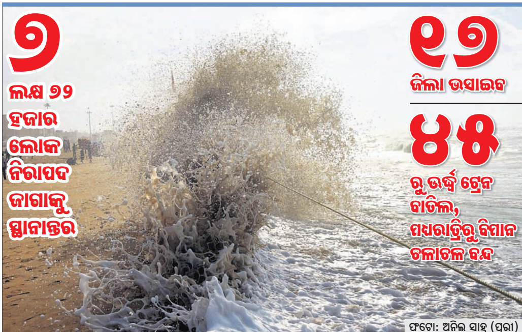
ପୁରୀ ବେଳାଭୂମି ଉପରକୁ ମାଡ଼ି ଆସିଥିବା ଭୟଙ୍କର ସାମୁଦ୍ରିକ କୁଆର।

ପଶ୍ଚିମ କେନ୍ଦ୍ରୀୟ ବଙ୍ଗୋପସାଗରରେ ସୃଷ୍ଟି ହୋଇଥିବା ସାମୁଦ୍ରିକ ଝଡ଼ 'ଫନୀ' ଅତି ଭୟଙ୍କର ବାତ୍ୟା (ଏକ୍ସଟ୍ରିମ୍‌ଲି ଭେରି ସିଭିଲ୍‌ର ସାଇକ୍ଲୋନିକ୍ ଷ୍ଟର୍ମ)ରେ ପରିଣତ ହୋଇଛି। ଏହା ୧୭ କି.ମି. ବେଗରେ ଉପକୂଳ ଆଡ଼କୁ ମାଡ଼ି ଆସୁଛି। ପାଣିପାଗ ବିଭାଗରୁ ମିଳିଥିବା ସୂଚନା ଅନୁଯାୟୀ ବାତ୍ୟା ଶୁକ୍ରବାର ପୂର୍ବାହ୍ନ ୮ଟାରୁ ୧୦ଟା ମଧ୍ୟରେ ପୁରୀ ଉପକୂଳ ଛୁଇଁବ। ସ୍ଥଳଭାଗ ଛୁଇଁବାବେଳେ ବାତ୍ୟାର ବେଗ ଘଣ୍ଟା ପ୍ରତି ୧୭୫ରୁ ୧୮୫ କିଲୋମିଟର ଏବଂ ବେଳେବେଳେ ୨୦୫ କିଲୋମିଟରକୁ ଚେପିବ ବୋଲି ପୂର୍ବାନୁମାନ କରାଯାଇଛି। ତପଲାର ରାଜାର ଦ୍ୱାରା ବାତ୍ୟାର ପ୍ରତ୍ୟେକ ଗତିବିଧି ଉପରେ ତୀକ୍ଷ୍ଣ ନଜର ରଖାଯାଇଛି। ରୁରୁବାର ମଧ୍ୟରାତ୍ରି ପୁଣି ଝଡ଼ ପୁରୀଠାରୁ ଦକ୍ଷିଣ-ଦକ୍ଷିଣ ପଶ୍ଚିମ ଦିଗରେ ୨୮୦ କିଲୋମିଟର ଏବଂ ଦକ୍ଷିଣ-ଦକ୍ଷିଣ ପୂର୍ବ ଦିଗାଘାଟାଗଣାଠାରୁ ୧୨୦ କିଲୋମିଟର ଦୂରରେ କେନ୍ଦ୍ରୀୟତ ହୋଇଛି। ଏହା ଆହୁରି ଶକ୍ତିଶାଳୀ ହୋଇ