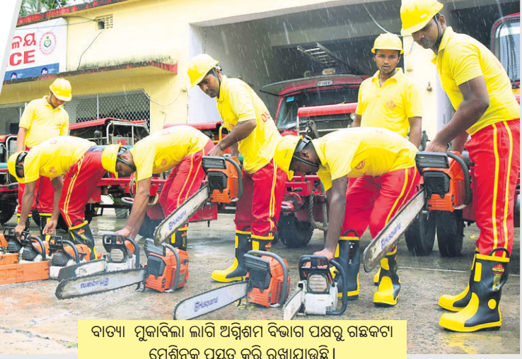
ବାତ୍ୟା ମୁକାବିଲା ଲାଗି ଅଗ୍ନିଶମ ବିଭାଗ ପକ୍ଷରୁ ଗଛକଟା ମେଶିନକୁ ପ୍ରସ୍ତୁତ କରି ରଖାଯାଇଛି ।