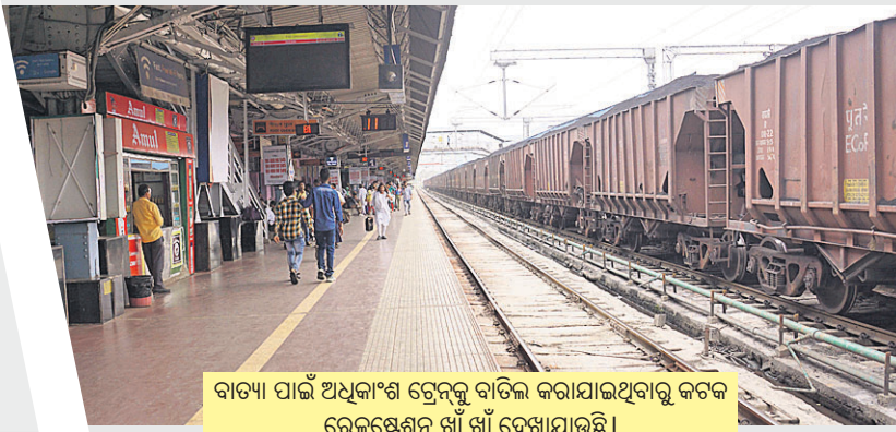
ବାତ୍ୟା ପାଇଁ ଅଧିକାଂଶ ଟ୍ରେନ୍ସକୁ ବାତିଲ କରାଯାଇଥିବାରୁ କଟକ ରେଳଷ୍ଟେଶନ ଖାଁ ଖାଁ ଦେଖାଯାଇଛି ।