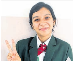
ସବିଶେଷ ତଥ୍ୟ: ପୃଷ୍ଠା-୩

ସିବିଏସ୍‌ଲ ଦ୍ୱାଦଶଶ୍ରେଣୀ ପରୀକ୍ଷା ଫଳ ପ୍ରକାଶ ଶାଲିନୀ ଓଡ଼ିଶା ଚପ୍ପର