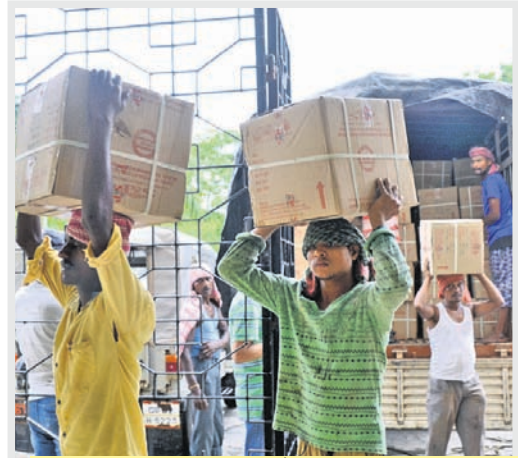
ବାତ୍ୟା ପ୍ରଭାବିତ ଲୋକଙ୍କ ପାଇଁ ଆସିଥିବା ରିଲିଫ୍ ସାମଗ୍ରୀକୁ ଭୁବନେଶ୍ୱର କଳିଙ୍ଗ ଷ୍ଟାଡ଼ିୟମ ପରିସରରେ ରଖାଯାଇଛି ।