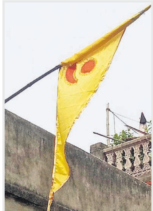
ଗୁରୁବାର ସକାଳେ ନୀଳଚକ୍ରରେ ଲାଗିଥିବା ବାମା ଉଡ଼ିଯାଇ ସ୍ଥାନୀୟ ବାସେଇଆର ଏକ କୋଠାରେ ଲାଗିଛି ।