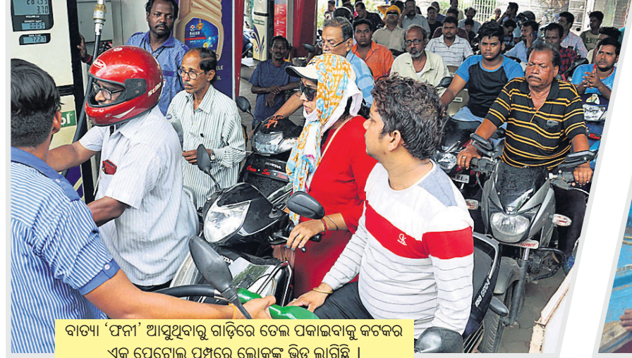
ବାତ୍ୟା ‘ଫନା’ ଆସୁଥିବାରୁ ଗାଡ଼ିରେ ତେଲ ପକାଇବାକୁ କଟକର ଏକ ପେଟ୍ରୋଲ ପମ୍ପରେ ଲୋକଙ୍କ ଭିଡ଼ ଲାଗିଛି ।