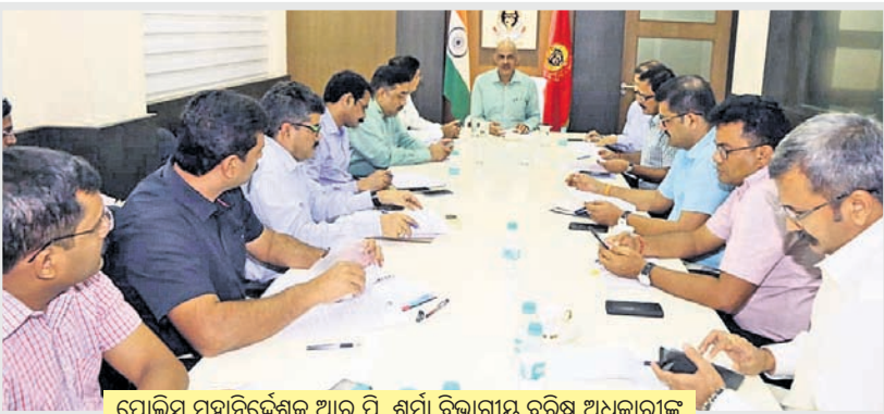
ପୋଲିସ ମହାନିର୍ଦ୍ଦେଶକ ଆର୍.ପି. ଶର୍ମା ବିଭାଗୀୟ ବରିଷ୍ଠ ଅଧିକାରୀଙ୍କ ସହ ବାତ୍ୟା ମୁକାବିଲା ନେଇ ଆଲୋଚନା କରୁଛନ୍ତି ।