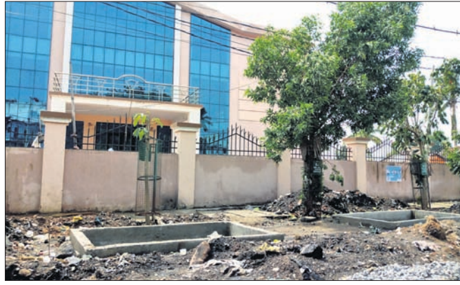
ହିଲପାଟଣା ବିଜୁ ପଟ୍ଟନାୟକ ସଂସ୍କୃତି ଭବନ ଆଗରେ ତଷ୍ଟିଦିନ ସ୍ଥାପନ ପାଇଁ ଖୋଳାଯାଇଥିବା ଗାତ ।