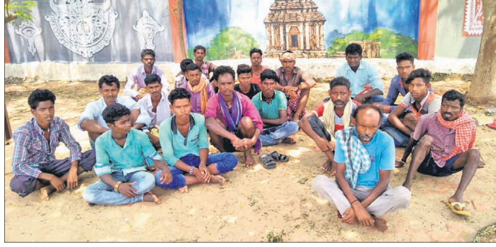
ପ୍ରାପ୍ୟ ପାଇ ନ ଥିବା ଶ୍ରମିକମାନେ ।