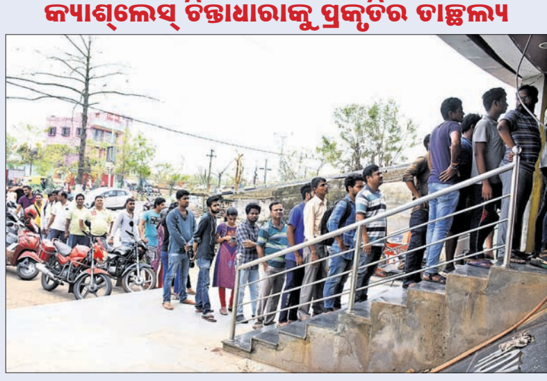
କ୍ୟାଣ୍ଟିନେଟ୍ ଚିକ୍ଷାଧାରୀଙ୍କୁ ପ୍ରକୃତିର ତାହଲ୍ୟ ବାତ୍ୟା ପରେ ଇଣ୍ଟରନେଟ୍ ସେବା ନ ଥିବାରୁ ପ୍ରାୟ ଏଟିଏମ୍ ଅଚଳ। କାଁ ଭାଁ ଚାଲୁଥିବା ଏଟିଏମ୍ ସାମ୍ନାରେ ନଗର ଲୋକ ପ୍ରବଳ ଭିଡ଼। ଭୁବନେଶ୍ଵର ପଡ଼ିଆ ଅଞ୍ଚଳରେ ରବିବାର ଏଭଳି ଦୃଶ୍ୟ ଦେଖିବାକୁ ମିଳିଛି। କ୍ରେଡିଟ୍ ଓ ଡେବିଟ୍ କାର୍ଡଧାରୀ ସହରବାସୀ ଏବେ ନଗର ଅର୍ଥର ଆବଶ୍ୟକତା ଭଲଭାବେ ଅନୁଭବ କରୁଛନ୍ତି।

ଭୁବନେଶ୍ଵର, ୫୫(ବୁଧବେ) ବାତ୍ୟା 'ଫନୀ'କୁ ୩ ଦିନ ପୂରିଗଲା। ଏବେ ବି ଚାରିଆଡ଼େ ହାହାକାର। ବିପର୍ଯ୍ୟୟ ବିଦ୍ୟୁତ୍ ଓ ପାନୀୟ ଜଳ ଯୋଗାଣ ପରିସ୍ଥିତିକୁ ସଜିନ କରି ଦେଇଛି। ଧନକୀର୍ତ୍ତନ ପୁରୁଣା ନେଇ ଲୋକମାନେ ଆଶଙ୍କାରେ ରାତି ବିତାଉଛନ୍ତି। ବିଦ୍ୟୁତ୍ ଓ ପାନୀୟ ଜଳ ଭଳି କରୁଣା ଆବଶ୍ୟକତା ଲୋକମାନଙ୍କ ନିକଟରେ କେବେପୂର୍ଣ୍ଣା ପହଞ୍ଚା ଯାଇପାରିବ ତାହା ମଧ୍ୟ ଆକଳନ କରାଯାଇପାରୁ ନାହିଁ। ବାତ୍ୟା ପ୍ରଭାବିତ ଅଞ୍ଚଳରେ ବ୍ୟାଙ୍କିଙ୍ଗ୍ ବ୍ୟବସ୍ଥା ଭୁଗ୍ନିତ ପଡ଼ିଛି। ଏଟିଏମ୍ ଅଚଳ ହୋଇପଡ଼ିଥିବାରୁ ଲୋକମାନେ ଜରୁରୀ ସାମଗ୍ରୀ ଜିଣି ପାରୁନାହାନ୍ତି। ପିଇବା ପାଣି ମୃଦେ ପାଇଁ