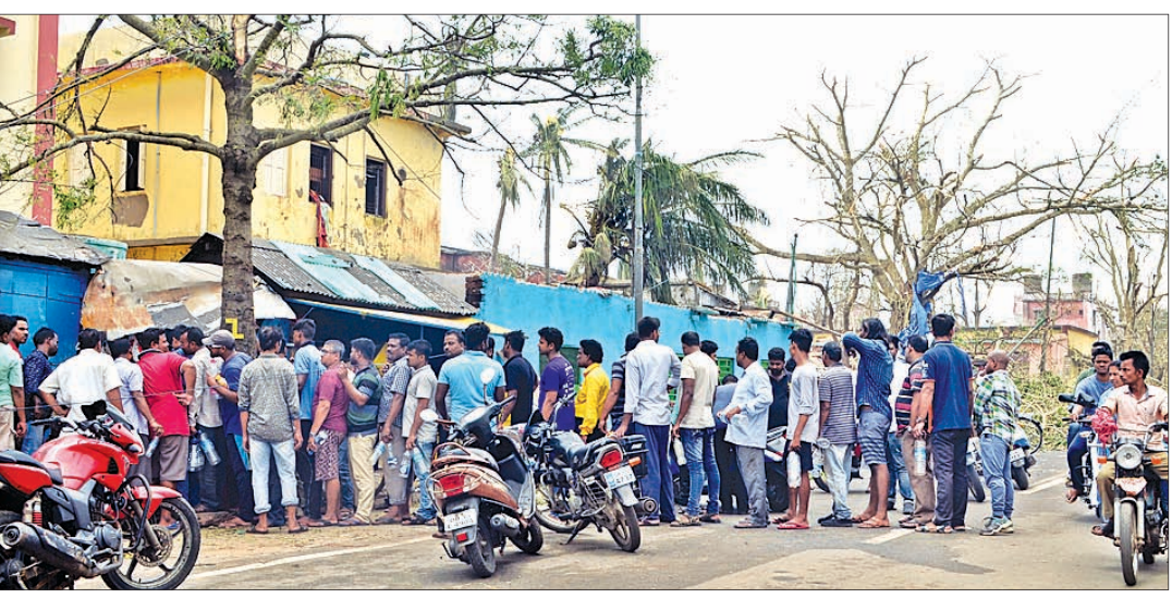
ପୁରୀ ସିଟି ରୋଡରେ ଖୋଲା ବଜାରରୁ ପେଟ୍ରୋଲ କିଣିବା ପାଇଁ ଲୋକଙ୍କ ଲମ୍ବା ଧାଡ଼ି।

ଭୁବନେଶ୍ୱର, ୫୫(ସ୍ପେଶାଲ) ବାଟ୍ୟା ଫର୍ମା ପ୍ରଭାବରେ ପୁରୀ, କଟକ ଓ ଖୋର୍ଦ୍ଧା ଜିଲ୍ଲାରେ ବ୍ୟାପକ କ୍ଷୟକ୍ଷତି ହୋଇଛି।