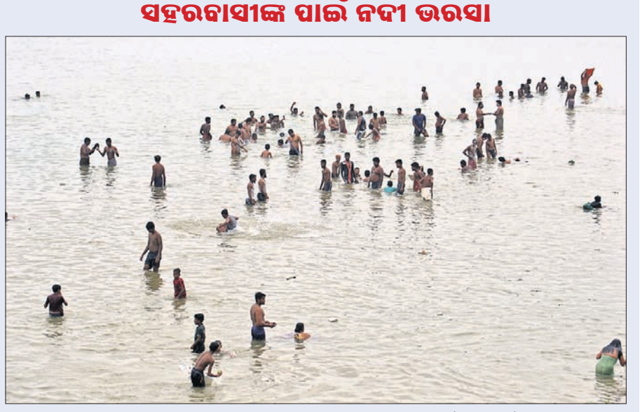
ସହରବାସୀଙ୍କ ପାଇଁ ନଦୀ ଭରସା ବାତ୍ୟାରେ ବିଦ୍ୟୁତ୍ ସେବା ପ୍ରଭାବିତ ହେବା ଯୋଗୁ ଲୋକମାନେ ନିତ୍ୟକର୍ମ ପାଇଁ ନଦୀ ପୁଞ୍ଜି। କଟକର ଯୋଡ଼ା ଆନିକଟ ମହାନଦୀ ତଟର ଦୃଶ୍ୟ।

ପୂରା ଓ ଭୁବନେଶ୍ଵରରେ ଲୋକମାନେ ତହନବିକଳ ହେଉଛନ୍ତି। ବାଲୁକା ପାଣି ପାଇଁ ଘଣ୍ଟା ଘଣ୍ଟା ଧରି ଲମ୍ବା ଲାଇନ୍ରେ ଟ୍ୟାଙ୍କରକୁ ଅପେକ୍ଷା କରିବାକୁ ପଡୁଛି। ଏପରି କି ପାଣି ପାଇଁ କେତେକ ଘ୍ନାନରେ ମାର୍ଗପଥର ଖବର ମଧ୍ୟ ଆସୁଛି। ଲୋକଙ୍କ ନିତ୍ୟକର୍ମ, ଗାଧୋଇବା ଓ ଶୌଚ ପାଇଁ ଅନେକ ଲୋକ ନିକଟସ୍ଥ ନଦୀ ଓ ପୋଖରୀ ଉପରେ ନିର୍ଭର କରୁଥିବା ଦେଖିବାକୁ ମିଳୁଛି। ଜନସ୍ଵାସ୍ଥ୍ୟ ବିଭାଗର