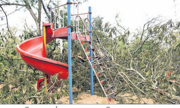
ନନ୍ଦନକାନନ ଟିକିହେଡ଼ ପାର୍କରେ ହୋଇଥିବା କ୍ଷୟକ୍ଷତି ।