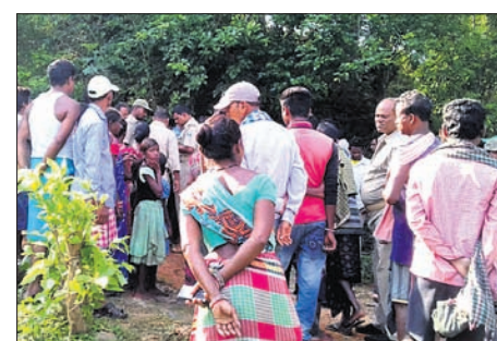
ହାତୀ ଆକ୍ରମଣ କରିଥିବା ସ୍ଥାନରେ ଲୋକ ଓ ବନ ବିଭାଗ କର୍ମଚାରୀ ।