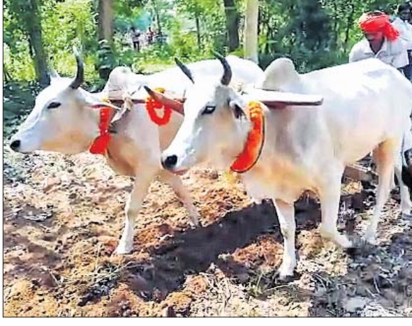
ଜଣେ ଚାଷୀ ବିଲରେ ହଳ କରୁଛନ୍ତି।