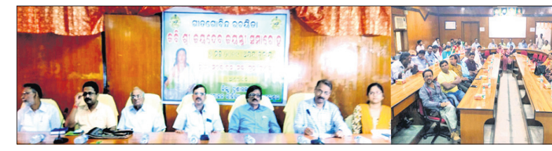
ଜୟଦେବ ଜୟନ୍ତୀ ପାଳନ ଅବସରରେ ଉପସ୍ଥିତ ଅତିଥି ।