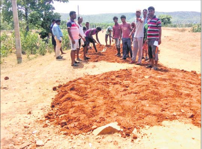
ଗ୍ରାମବାସୀ ମିଳିମିଶି ରାସ୍ତା ନିର୍ମାଣ କରୁଛନ୍ତି।

କେନ୍ଦୁଝର ଜିଲ୍ଲା ଝୁମୁରା ବ୍ଲକ୍‌ର ଗ୍ରାମାଞ୍ଚଳରେ ଗ୍ରାମ୍ୟ ଉନ୍ନୟନ ବିଭାଗ ଦ୍ଵାରା ନିର୍ମିତ ରାସ୍ତା, ନିର୍ମାଣାଧୀନ ଥିବା ରାସ୍ତା, ଅଧାପତ୍ତରିଆ ହୋଇ ବର୍ଷ ବର୍ଷ ଧରି ପଡି ରହିଥିବା ରାସ୍ତାଗୁଡ଼ିକରେ ବାରମ୍ବାର ଅଭିଯୋଗ ପରେ ଏବେ ନହବେତା ଏବଂ ଖେଣ୍ଡରା ପଞ୍ଚାୟତରେ ଥିବା ୫କି.ମି. ରାସ୍ତାକୁ ସର୍ବୋଚ୍ଚ କରାଯାଇ ଆବୌ ନିର୍ମାଣ କରାଯାଇ ନ ଥିବା ନେଇ ଅଭିଯୋଗ ହୋଇଛି। ଶେଷରେ ଗ୍ରାମବାସୀ ଅସନ୍ତୋଷ ବ୍ୟକ୍ତ କରି ନିଜସ୍ଵ ଉଦ୍ୟମରେ ରାସ୍ତା ନିର୍ମାଣ କରିବାକୁ ଲାଗି ପଡିଛନ୍ତି। ସୁତରା ଯୋଗ୍ୟ, ଝୁମୁରା ବ୍ଲକ୍‌ର ଖେଣ୍ଡରା ଏବଂ ନହବେତା ପଞ୍ଚାୟତ ଅଧୀନରେ ରହିଥିବା ନହବେତା ଶିବ ମନ୍ଦିର ଛକ ପାର୍ଶ୍ଵକୁ କଳ୍ପତାପୋତି ପାଟି ପର୍ଯ୍ୟନ୍ତ (ଫକୀରପୁର ଗ୍ରାମ୍ୟ ରାସ୍ତା ଦେଇ) ୫କି.ମି ରାସ୍ତା ଅତି ଦୟାନୀୟ ଅବସ୍ଥାରେ ରହିଛି। ଏହା ମାଟିରାସ୍ତା ହୋଇଥିବାବେଳେ ରାସ୍ତା ସାରା ଖାଲଖାଲରେ ଭର୍ତ୍ତି। ଚିକିତ୍ସ ବର୍ଷା ହେଲେ