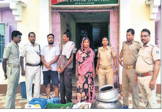
ଜବତ ମଦ ସହ ଗିରଫ ଅଭିଯୁକ୍ତ ।