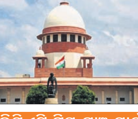
ଭିତ୍ତିପିଏଟି ସ୍ମୃତି ଯାଞ୍ଚ ପ୍ରତିମକୋର୍ଟଙ୍କ ଦ୍ୱାରା ହୋଇଥିଲେ ୨୧ ଦଳ

ଭିତ୍ତିପିଏଟି ସ୍ମୃତି ଯାଞ୍ଚ ମାମଲାରେ ୨୧ ବିରୋଧୀ ଦଳ ନେତାଙ୍କ ପକ୍ଷରୁ ଦାବୀ ରିଭ୍ୟୁ ପିଟିଗାନକୁ ସୁପ୍ରିମକୋର୍ଟ ମଙ୍ଗଳବାର ଖାରଜ କରିଦେଇଛନ୍ତି। ପ୍ରତି ବିଧାନସଭା ନିର୍ବାଚନମଣ୍ଡଳରୁ ୫ଟି ସ୍ମୃତି ଭିତ୍ତିପିଏଟି ସ୍ମୃତି ଯାଞ୍ଚ କରିବା ଲାଗି ସୁପ୍ରିମକୋର୍ଟ ଗତମାସ ୮ରେ ନିର୍ବାଚନ କମିଶନ (ଇସି)ଙ୍କୁ ନିର୍ଦ୍ଦେଶ ଦେଇଥିଲେ।