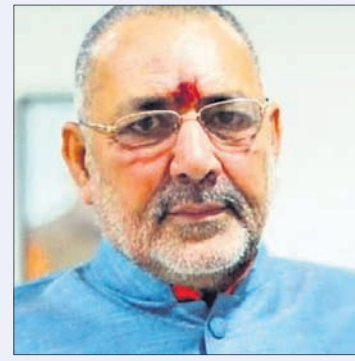
ଆଦର୍ଶ ଆଚରଣ ବିଧି ଉଲ୍ଲଂଘନ ମାମଲା