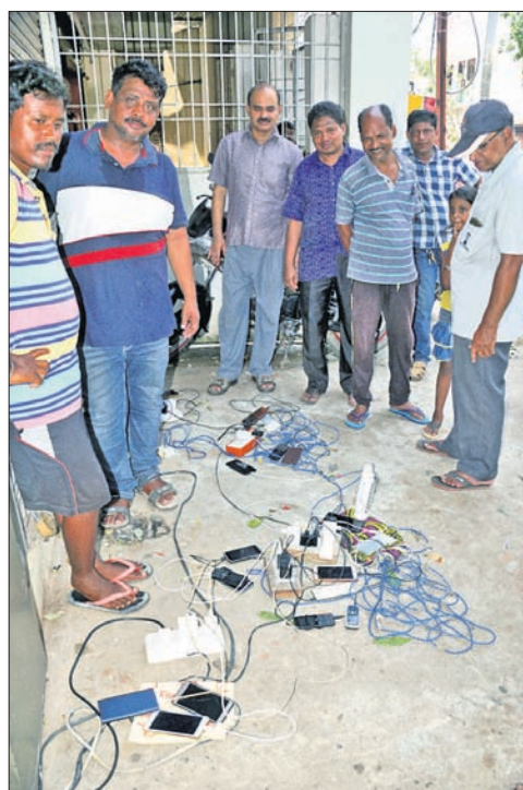
‘ଫନୀ’ ପ୍ରଭାବରେ ବିଦ୍ୟୁତ୍ ବ୍ୟବସ୍ଥା ବିପର୍ଯ୍ୟୟ ହୋଇପଡ଼ିଥିବା ବେଳେ କଟକ ସିଡିଏ ସେକ୍ଟର-୯ ଅଞ୍ଚଳର ଲୋକମାନେ ମଙ୍ଗଳବାର ଜେନେରେଟର ସାହାଯ୍ୟରେ ମୋବାଇଲ୍ ଫୋନ୍ ଚାର୍ଜ୍ କରୁଛନ୍ତି।