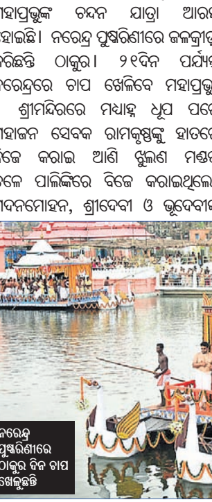
କରୋଳ ପୁଷ୍କରିଣୀରେ ଠାକୁର ବିନ ଚାପ ଖେଳୁଛନ୍ତି