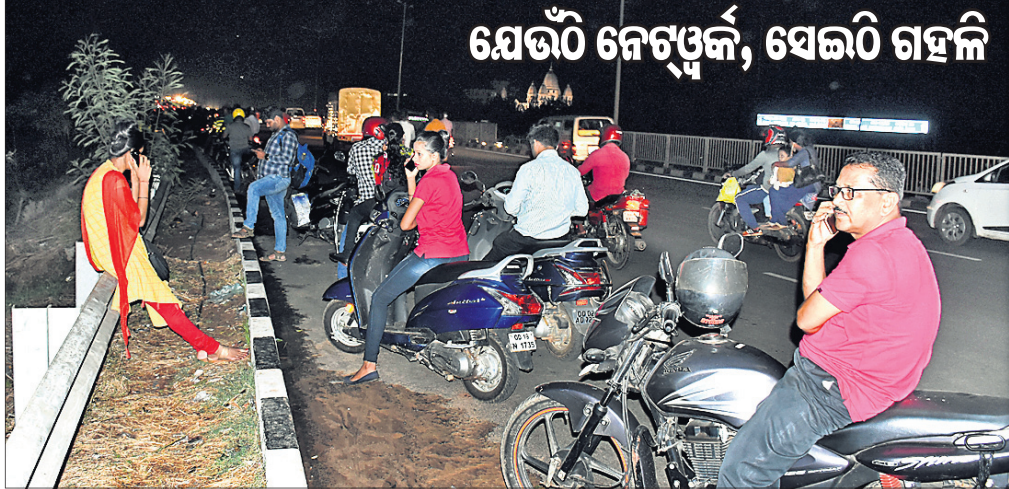
ଭୁବନେଶ୍ୱର ରପ୍ତାନୁପତ୍ତ ଓଭରବ୍ରିଜ୍‌ରେ ରହି ମୋବାଇଲରେ କଥା ହେଉଥିବା ଲୋକମାନେ। ବାତ୍ୟା ପରେ ରୁକୁଚର ପ୍ରଭାବିତ ହୋଇଛି ମୋବାଇଲ ଫୋନ୍ ନେଟୱାର୍କ। ମଙ୍ଗଳବାର ପୁଣି ରାଜଧାନୀରେ କେତେକ ଅଞ୍ଚଳରେ ହିଁ ଉପଲବ୍ଧ ରହୁଛି ନେଟୱାର୍କ।

ବାତ୍ୟା ପ୍ରଭାବିତ ଅଞ୍ଚଳରେ ମହାମାରୀକୁ ରୋକିବା ତଥା କନସାଧାରଣଙ୍କୁ କରୁନିକାଳୀନ ସ୍ୱାସ୍ଥ୍ୟସେବା ଯୋଗାଇଦେବା ଲାଗି ସ୍ୱତନ୍ତ୍ର ନାଭାଲ୍ ମେଡିକାଲ ଟିମ୍ ନିୟୋଜିତ ହୋଇଛନ୍ତି। ଏଥିପାଇଁ ବିଭିନ୍ନ ସ୍ଥାନରେ ୪ ମେଡିକାଲ୍ କ୍ୟାମ୍ପ ମଧ୍ୟ ଖୋଲାଯାଇଛି। ଆଇଏନ୍‌ଏସ୍ ଚିଲିକାର କୁଇକ୍ ଆକ୍ସନ୍ ଟିମ୍ ଗଛକଟା ଓ ରାସ୍ତାସଫା ଭଳି କାର୍ଯ୍ୟରେ ନିୟୋଜିତ ରହିଛି। ନ୍ୟାଭି ପକ୍ଷରୁ ବାତ୍ୟାର ସମ୍ମୁଖୀନ ଲାଗି ପଞ୍ଚିତେରୀ, ତେନାଳ, ଭୁବନେଶ୍ୱର, ପାରାଦୀପ, ବିଶାଖାପାଟଣା, ହଳଦିଆ ଓ କୋଲକାତାରେ କରୁନିକାଳୀନ ଟିମ୍‌ରେ ବସି ବିଭିନ୍ନ ବିଷୟରେ ଆଲୋଚନା କରାଯାଇଛି। ଇଞ୍ଚିଆନ୍ କୋଷ୍ଟଗାର୍ଡ୍ ୪ ଉପକୂଳ ରାଜ୍ୟ ସହ କଥାବାର୍ତ୍ତା କାରି ରଖିଥିବା ବେଳେ ରିଲିୟଫ୍ ଓ ଉଦ୍ଧାର କାର୍ଯ୍ୟ ସମ୍ପର୍କରେ ପୁଞ୍ଜୀକୃତ୍ୱ ଆଲୋଚନା କରୁଛି।