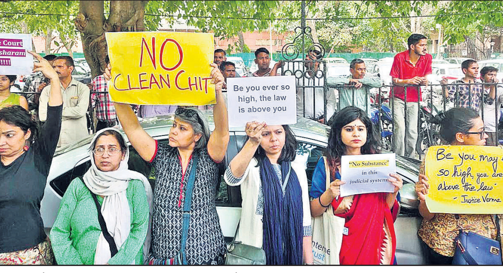
ସୁପ୍ରିମକୋର୍ଟ ବାହାରେ ବିକ୍ଷୋଭରେ ମହିଳା ଆଇନଜୀବୀ ଓ କର୍ମୀ।

ସୁପ୍ରିମକୋର୍ଟ ବାହାରେ ବିକ୍ଷୋଭରେ ମହିଳା ଆଇନଜୀବୀ ଓ କର୍ମୀ। ସୁପ୍ରିମକୋର୍ଟଙ୍କ ଦ୍ୱାରା ଗଠିତ ଇନ୍-ହାଉସ୍ ତଦନ୍ତ କମିଟି ଅଭିଯୋଗର ଅନୁଧ୍ୟାନ କରି ଏହା ଭିତ୍ତିକ୍ଷାନ ବୋଲି କହିବା ସହ ଜଷ୍ଟିସ୍ ଗୋଗୋଇଙ୍କୁ କ୍ରିମିନାଲ ଦେଇଥିଲା। ଏହାର ପ୍ରତିବାଦରେ ମହିଳା ଆଇନଜୀବୀ ଓ ସମାଜକର୍ମୀ ସୁପ୍ରିମକୋର୍ଟ ବାହାରେ ବିକ୍ଷୋଭ ପ୍ରଦର୍ଶନ କରିଥିଲେ। ୩ ପୁରୁଷ ଏବଂ ୫୨ ମହିଳା ବିକ୍ଷୋଭକାରୀଙ୍କୁ ଗିରଫ କରାଯାଇ ମହିଳାମାନଙ୍କୁ ଆନାକୁ ନିଆଯାଇଥିବା ଜଣେ ବରିଷ୍ଠ ପୋଲିସ୍ ଅଧିକାରୀ ସୂଚନା ଦେଇଛନ୍ତି। ଜଷ୍ଟିସ୍ ବୋଦ୍ଡେଙ୍କ ଅଧିକାରରେ ଜଷ୍ଟିସ୍ ଇନ୍ଦୁ ମାଲହୋତ୍ରା ଏବଂ ଇନ୍ଦିରା ବାନାର୍ଜୀଙ୍କୁ ନେଇ ଗଠିତ