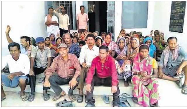
ବଡ଼ପୁରୁରି ଓ ଧାନମଣ୍ଡଳ ପଞ୍ଚାୟତବାସୀ ଧାରଣାରେ ବସିଛନ୍ତି।