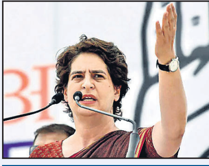
ମୋଦିଙ୍କୁ ପ୍ରିୟଙ୍କାଙ୍କ ଚେତାବନୀ

ବାପାଙ୍କୁ ତାଙ୍କ ସହଯୋଗୀମାନେ ମିଶ୍ଟର କିନ୍ଦାସି ବୋଲି କହୁଥିଲେ। କିନ୍ତୁ ତାଙ୍କ ଜୀବନ ଭ୍ରଷ୍ଟାଚାରୀ