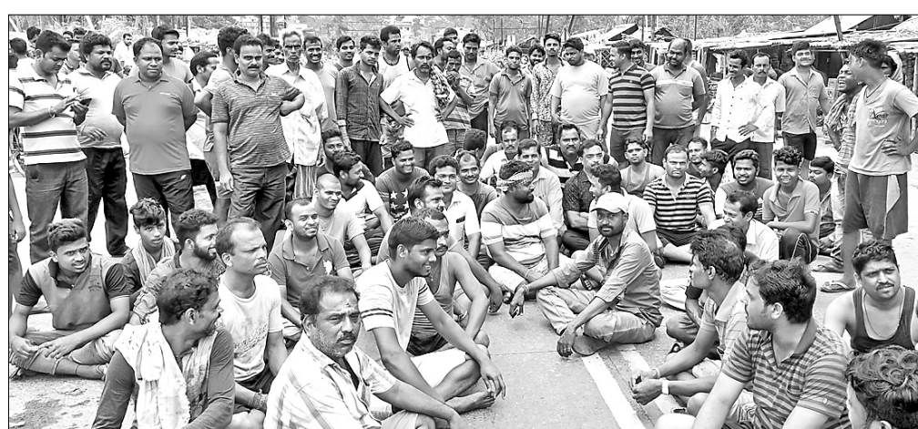
ଉନ୍ମତ୍ତ ଲୋକେ କଟକ-ପାରାଦୀପ ରାସ୍ତା ଅବରୋଧ କରିଛନ୍ତି।