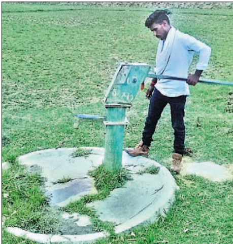
ଗ୍ରାମରେ ଥିବା ଏକମାତ୍ର ଅଳ ନଳକୁପ।