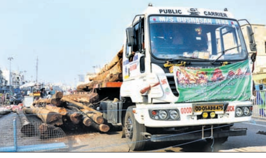
ଗୋଡ଼ର ଖସିପଡ଼ିଥିବା କାଠ।

ପୁରୀ ଅପ୍ରିଲ, ୧୧/୫: ଚଳିତ ବର୍ଷ ରଥ ନିର୍ମାଣର ପ୍ରଥମ ଦୁର୍ଘଟଣା ଘଟିଛି। ଶନିବାର ରଥକାଠ ପଡ଼ି କଣେ ଯୁବକଙ୍କ ଗୋଡ଼ ଭାଙ୍ଗିଯାଇଛି।