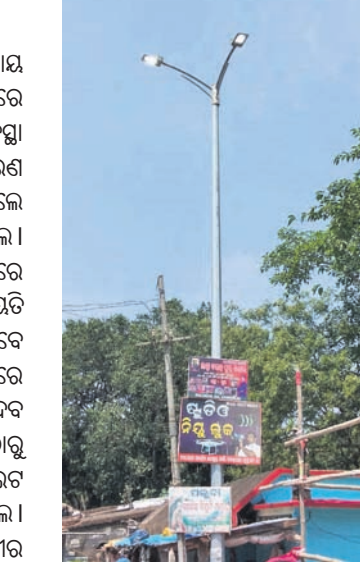
ଲାଇଟ୍ ବନ୍ଦ କରିବା ଦାୟିତ୍ୱରେ ଥିବା କର୍ମଚାରୀ ଏହା ବନ୍ଦ କରୁ ନ ଥିବାରୁ ଦିନ ତମାମ ଲାଇଟ୍ ଜଳି ରହୁଛି। ତେବେ ପ୍ରଶାସନ ପକ୍ଷରୁ ଦୃଷ୍ଟି ଦିଆଯିବାକୁ ସ୍ଥାନୀୟ ଲୋକେ ଦାବି କରିଛନ୍ତି।