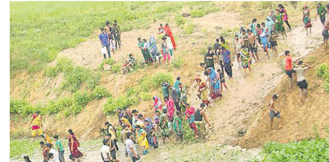
ବାରନାଳକଣ୍ଠପୁରସ୍ଥିତ ଶନି ମନ୍ଦିରରେ ଜଳାଭିଷେକ ପାଇଁ ଗୋବତୀ ନଦୀ ଚମ୍ପାବାଗ ଘାଟରେ ଶ୍ରଦ୍ଧାଳୁଙ୍କ ଭିତ୍ତ।

ତେରାବିଶ ରୁକର ବିଭିନ୍ନ ସ୍ଥାନରେ ଥିବା ଶନିଶୁରଙ୍କ ପୀଠରେ ଶନିବାର ଜଳାଭିଷେକ ଅନୁଷ୍ଠିତ ହୋଇଯାଇଛି। ଏହିଉପଲକ୍ଷେ ପ୍ରାତଃସ୍ନାନପୂର୍ବକ ଆରତ୍ୟ ହୋଇଥିଲା। ଏ ନେଇ ବ୍ଲକ ଅଧୀନ ନହଙ୍ଗ ପଞ୍ଚାୟତ ବାରନାଳକଣ୍ଠପୁର ଗ୍ରାମସ୍ଥିତ ଶନିଶୁରଙ୍କ ପୀଠରେ ଶ୍ରଦ୍ଧାଳୁଙ୍କ ଭିତ୍ତ ଲାଗି ରହିଥିଲା। ମଙ୍ଗଳ ଆରତି ପରେ ଗୋବତୀ ନଦୀ ଚମ୍ପାବାଗ ଘାଟରେ ସହସ୍ରାଧିକ ଶ୍ରଦ୍ଧାଳୁ ନଦୀକୁ ପାଣି ଆଣି ଶନିଶୁରଙ୍କୁ ଜଳାଭିଷେକ କରିଥିଲେ। ସେହିପରି ନଦୀଘାଟରେ ମହିଳା ଓ ପୁରୁଷମାନଙ୍କ ପାଇଁ ଅଲଗା ବ୍ୟାରିକେଡ୍ ବ୍ୟବସ୍ଥା କରାଯାଇଥିଲା। ଏଥିସହ ଶ୍ରଦ୍ଧାଳୁଙ୍କ ନିମନ୍ତେ ଶନିଶୁରଙ୍କ ମନ୍ଦିର କମିଟି ପକ୍ଷରୁ ଏକ ସୂତନା କେନ୍ଦ୍ର ଖୋଲାଯାଇଥିଲା। ଭିତକୁ ଦୃଷ୍ଟିରେ ରଖି ସ୍ଥାନୀୟ ଅଗ୍ରଣୀ ସୁଦ ପରିଷଦ ପକ୍ଷରୁ ଶୁଖିଲା ରନ୍ଧା କରାଯିବା ସହ ଜଳଛତ୍ର ପ୍ରଦାନ କରାଯାଉଥିଲା।