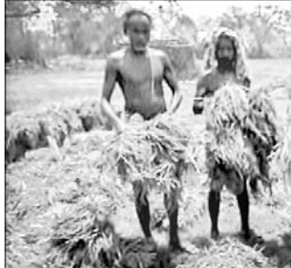
ମାରୁତିକର ଗାଁରେ ତାଳଡିନ ଧାନ ଫସଲ ନଷ୍ଟ ହୋଇଯାଇଛି।