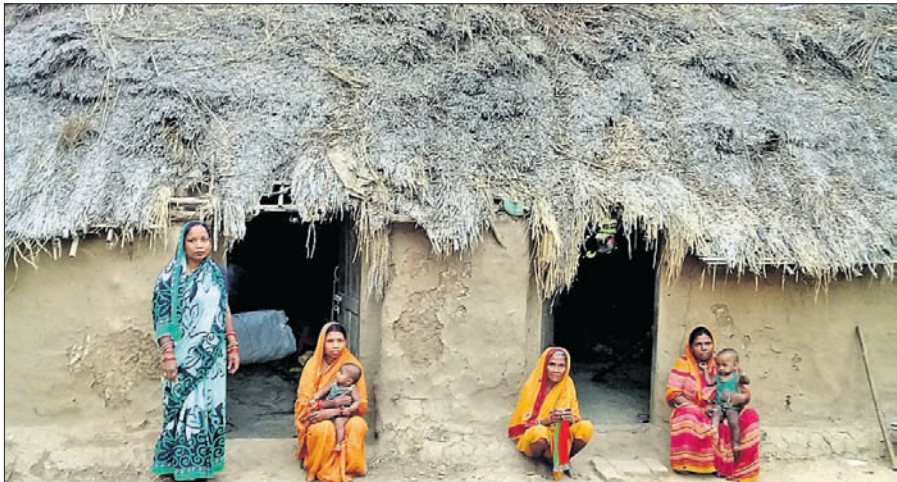
ବାଡ଼୍ୟାରେ କ୍ଷତିଗ୍ରସ୍ତ ସାରେଇକୁଳ (ବାଝୁଆ)ଠାରେ ବସବାସ କରୁଥିବା ବିପଦ ପରିବାର।

ଫନା ପ୍ରଭାବରେ ଉପକୂଳ ଜିଲ୍ଲା ଜଗତସିଂହପୁରରେ ବ୍ୟାପକ କ୍ଷତି ହୋଇଛି। ବିଶେଷ କରି ଏହି ଜିଲ୍ଲାର ନାଉଗାଁ ବ୍ଲକ୍ ଅଧିକ ପ୍ରଭାବିତ ହୋଇଛି। ବହୁ କମ୍ପାନୀର ଭାଙ୍ଗିଯାଇଥିବା ଉନେକ ପରିବାର ଏକ ପ୍ରକାର ବାସହରା ହୋଇଛନ୍ତି। ଏହି ବ୍ଲକ୍ ଶିଖର ପଞ୍ଚାୟତର ସାରେଇକୁଳ(ବାଝୁଆ)ଠାରେ ବସବାସ କରୁଥିବା ଅନେକ ଗରିବ ଲୋକ ବାଡ଼୍ୟାରେ କ୍ଷତିଗ୍ରସ୍ତ ହୋଇଛନ୍ତି। ୧୨ ପରିବାର ବିଶିଷ୍ଟ ବାଝୁଆର ଏହି ସାହିରେ ୧୫ରୁ ଊର୍ଦ୍ଧ୍ୱ ଲୋକ ବସବାସ କରନ୍ତି। ସେମାନେ ଦିନ ମଜୁରିଆ ଭାବେ ପରିବାର ଚଳାନ୍ତି। ଏହି ପଢ଼ାକୁ ଠିକ ଭାବେ ଖଞ୍ଜେ ରାସ୍ତା ହୋଇପାରିନାହିଁ। ଲୋକମାନେ ବର୍ଷାଦିନେ ଅଖ୍ୟ ଏପାଣିରେ ପଶି ଯିବାଆସିବା କରନ୍ତି। ଫନା ଆସିବା ପୂର୍ବରୁ ବ୍ଲକ୍ ପ୍ରଶାସନ ପକ୍ଷରୁ ସମସ୍ତ ବାଡ଼୍ୟା ଆଗ୍ରୟତାକୁ ଗୁଣାନ୍ତର କରାଯାଇଥିଲା କିନ୍ତୁ ସେଠାରେ ୨୪ ଘଣ୍ଟା ପର୍ଯ୍ୟନ୍ତ ସେମାନଙ୍କୁ କୌଣସି ଖାଦ୍ୟ ପ୍ରଦାନ କରାଯାଇ ନ ଥିବା ଅଭିଯୋଗ ହୋଇଛି। ବାଡ଼୍ୟା ପରେ ଘରକୁ ଫେରିବା ପରେ ପାନାଘଟକ ସମସ୍ୟା ଦେଖାଦେଇଥିଲା। ଏହି ୧୨ ପରିବାର ନିର୍ଭର କରୁଥିବା ଏକମାତ୍ର