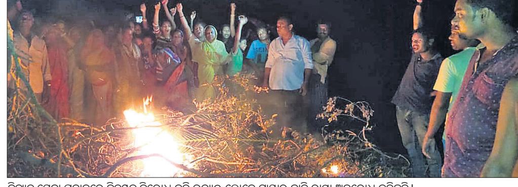
ବିଦ୍ୟୁତ୍ ସେବା ପ୍ରଦାନରେ ବିଳମ୍ବକୁ ବିରୋଧ କରି ଉତ୍ତ୍ୟକ୍ତ ଲୋକେ ଗାୟାର ଜାଳି ରାସ୍ତା ଅବରୋଧ କରିଛନ୍ତି।