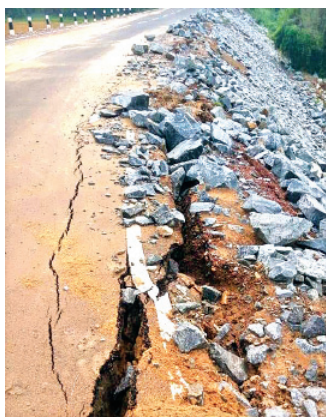
ଧର୍ମଶାଳା ନିର୍ବାଚନସ୍ଥଳୀର ଅନେକ ପ୍ରକଳ୍ପ ମୁଖ୍ୟମନ୍ତ୍ରୀଙ୍କ ଦ୍ୱାରା ଉଦ୍ଘାଟନ ହେବାକୁ ଯାଉଥିବା ସ୍ୱରୂପା ମିଳିବା ପରେ ସମ୍ପୂର୍ଣ୍ଣ ଠିକାଦାର ବିଭାଗୀୟ ମୁଖ୍ୟ ରାସ୍ତା ମାଧ୍ୟମରେ ଶେଷ କରିବାକୁ ଧର୍ମିଆ ନଦୀବନ୍ଧ ଉଦ୍ଘାଟିତ ହୋଇଛି।

ଧର୍ମଶାଳା, ୧୧୫୫(ଡି.ଏନ.ଏ.) ଧର୍ମଶାଳା ବ୍ଲକ ୧୬ ନଂ. ଜାତୀୟ ରାଜପଥ ଗୋକର୍ଣ୍ଣେଶ୍ୱରଠାରୁ କଦମପାଳ ପର୍ଯ୍ୟନ୍ତ ୨୦୦ ମିଟର ପର୍ଯ୍ୟନ୍ତ ୨ ପାର୍ଶ୍ୱରେ ଫାଟ ସୃଷ୍ଟି ହୋଇଥିବା ଉନ୍ନତକରଣ କାର୍ଯ୍ୟ ୨ମାସ ହେବ ଶେଷ ହୋଇ ମୁଖ୍ୟମନ୍ତ୍ରୀଙ୍କ ଦ୍ୱାରା ଉଦ୍ଘାଟିତ ହୋଇଥିଲା।