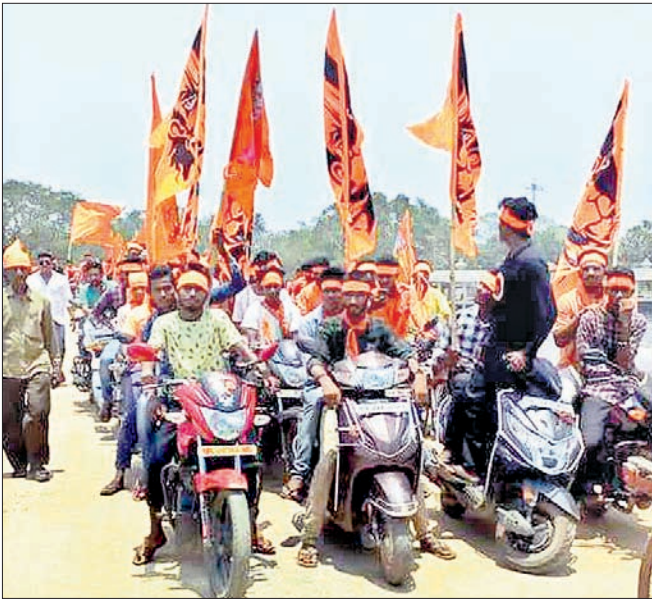
ଶ୍ରୀରାମ ସେବାସଂଘ ପକ୍ଷରୁ ବାହାରିଥିବା ଶୋଭାଯାତ୍ରା ।

ଯାଜପୁର ଟାଉନ୍, ୧୧୫ (ଡି.ଏଚ୍.ଏ.) ଯାଜପୁର ସହରରେ ଶନିବାର ଶ୍ରୀରାମ ସଚେତନତା ଶୋଭାଯାତ୍ରା ଅନୁଷ୍ଠିତ ହୋଇଥିଲା । ଫଳରେ ରାମ ନାମ ଧ୍ୱନିରେ କମ୍ପି ଉଠିଥିଲା । ସମଗ୍ର ସହରରେ ଶ୍ରୀରାମ ସେବାସଂଘ ପକ୍ଷରୁ ଶହଶହ ଯୁବକାଂଶୁ ଏକାଠି ହୋଇ ଶୋଭାଯାତ୍ରାରେ ପାଠ ଦେଉଛନ୍ତି । ଶ୍ରୀରାମ ସେବାସଂଘ ପକ୍ଷରୁ ଶହଶହ ଯୁବକାଂଶୁ ଏକାଠି ହୋଇ ଶୋଭାଯାତ୍ରାରେ ପାଠ ଦେଉଛନ୍ତି ।