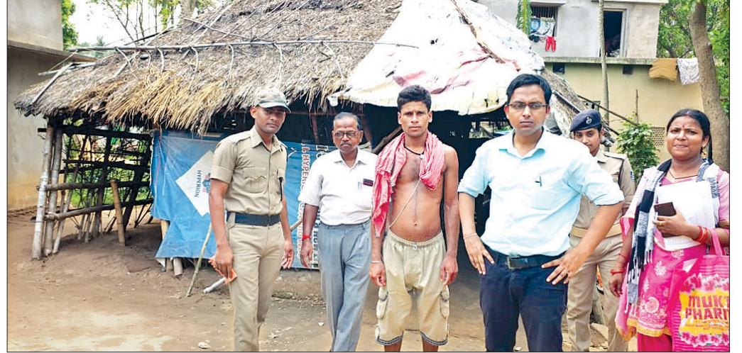
ତହସିଲଦାର ବାଟ୍ୟା ଅଞ୍ଚଳ ପରିଦର୍ଶନ କରୁଛନ୍ତି ।