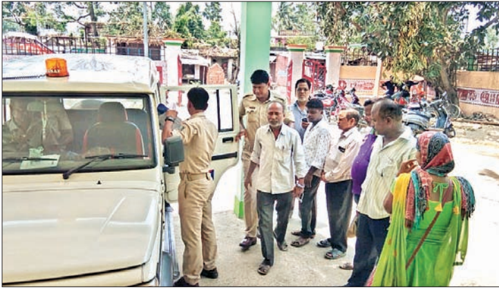
ଅଭିଯୁକ୍ତଙ୍କୁ କୋର୍ଟଚାଲାଇ କରାଯାଉଛି।

ଘଟଣାର ତଦନ୍ତ କରି ଫେରିଛନ୍ତି। ପୁରୀ ଅନୁସାଧା ଫନା ବାଦ୍ୟାର କ୍ଷୟକ୍ଷତି ଆକଳନ ପାଇଁ ପ୍ରାତିପୁର ଆରୁଆଇ ଅନାଗା ସମାଜ ଓ ତାଙ୍କ ଅଧିକାରୀଙ୍କୁ ପ୍ରମୋଦ ନାଥଶର୍ମା ବୁଧବାର ବିଜ୍ଞାନପୁର ଚହସିଲ ଅନ୍ତର୍ଗତ ଉତ୍ତରକୁଳ ପଞ୍ଚାୟତର ପାଇକପଡ଼ା ଯାଇଥିଲେ। ଆରୁଆଇ ତାଙ୍କ