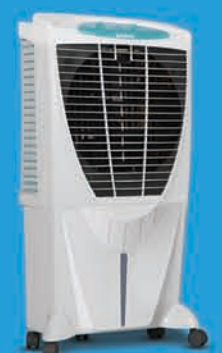
WINTER 80XL ₹ 14,999