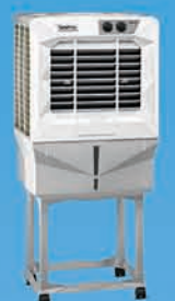
JUMBO 41DB ₹ 9,499