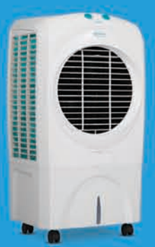
SIESTA 70XL ₹ 13,499