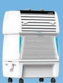
TOUCH 20 ₹ 7,499