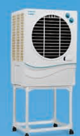
JUMBO 41 ₹ 8,999