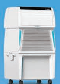
TOUCH 35 ₹ 10,499