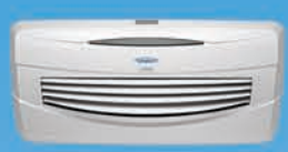
CLOUD ₹ 14,999