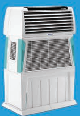
TOUCH 110 ₹ 19,999