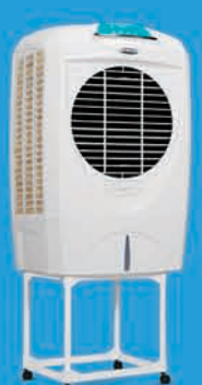
SUMO i ₹ 12,499