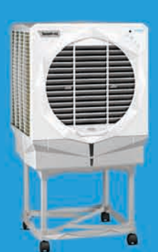
JUMBO 61i ₹ 12,999