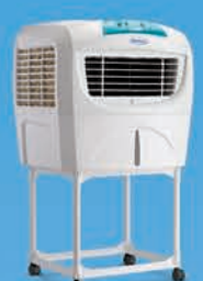
SUMO JR ₹ 8,499