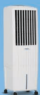
DIET 22i ₹ 10,299