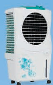
ICE CUBE 27 ₹ 6,599