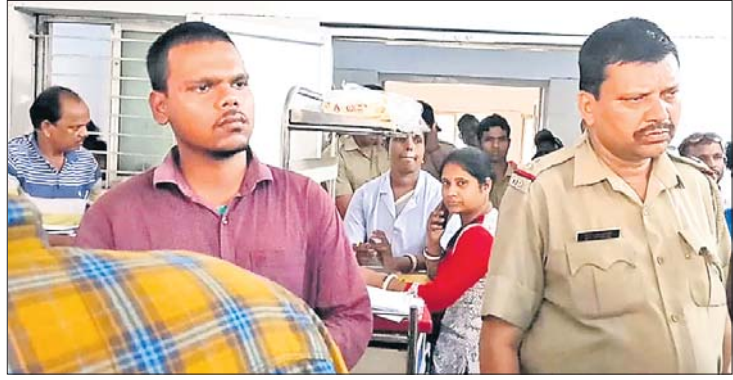
ଜିଲା ମୁଖ୍ୟଚିକିତ୍ସାଳୟର ଭେଷଜ ବିଭାଗରେ ପୋଲିସ ପହଞ୍ଚି ଉତ୍ତେଜିତ ଲୋକଙ୍କୁ ବୁଝାଶୁଣା କରୁଛି ।