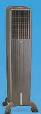
DIET 50i BLACK ₹ 12,799