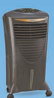
HICOOL i BLACK ₹ 11,499