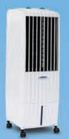
DIET 12T ₹ 6,799