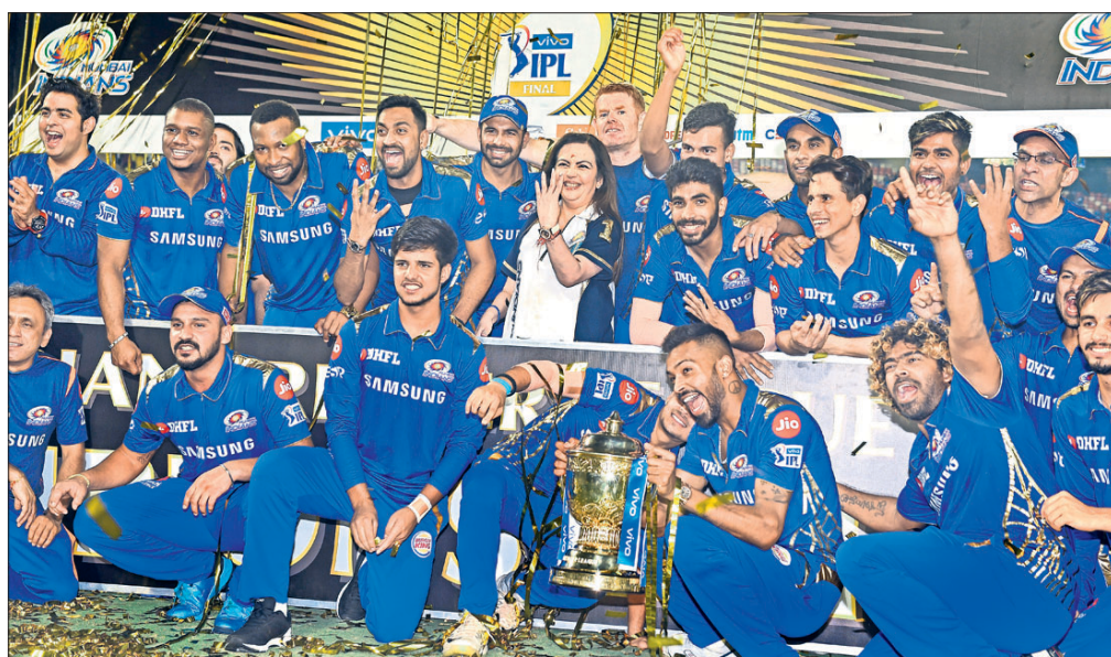
ମାଲିକାଣୀ ନାଟା ଅଧ୍ୟାୟକ ସହ ଆଇପିଏଲ୍ ଚାମ୍ପିୟନ ମୁମ୍ବାଇ ଇଣ୍ଡିଆନ୍ସ ଖେଳାଳିମାନେ।