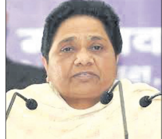
ମାୟାବତୀ କହିଛନ୍ତି, ପ୍ରଧାନମନ୍ତ୍ରୀଙ୍କ ପାଖକୁ ସ୍ଵାମୀ ଯିବା ଦେଖି ଭାଜପାର ମହିଳା ନେତା ଓ କର୍ମୀ

ପ୍ରଧାନମନ୍ତ୍ରୀ ନରେନ୍ଦ୍ର ମୋଡି ରାଜନୈତିକ ସ୍ଵାର୍ଥ ପାଇଁ ନିଜ ସ୍ଵୀକ୍ଷୁ ଛାଡ଼ିଦେଇଛନ୍ତି। ଏଥିଲାଗି ଭାଜପାର ମହିଳାମାନେ ସେମାନଙ୍କ ସ୍ଵାମୀ ମୋଡିଙ୍କୁ ଭେଟିବାକୁ ବୋଲି ଚାହୁଁଛନ୍ତି। କାରଣ ସେମାନେ ମଧ୍ୟ ସ୍ଵାମୀ ପରିତ୍ୟକ୍ତ ହୋଇପାରନ୍ତି ବୋଲି ଆଶଙ୍କା କରୁଛନ୍ତି। ବହୁଜନ ସମାଜ ପାର୍ଟି (ବିଏସ୍ପି) ସୁପ୍ରିମୋ ମାୟାବତୀ ଏକ ବିକୃତିରେ ଏଭଳି ବିକୃତ ମତବ୍ୟ ଦେଇଛନ୍ତି।