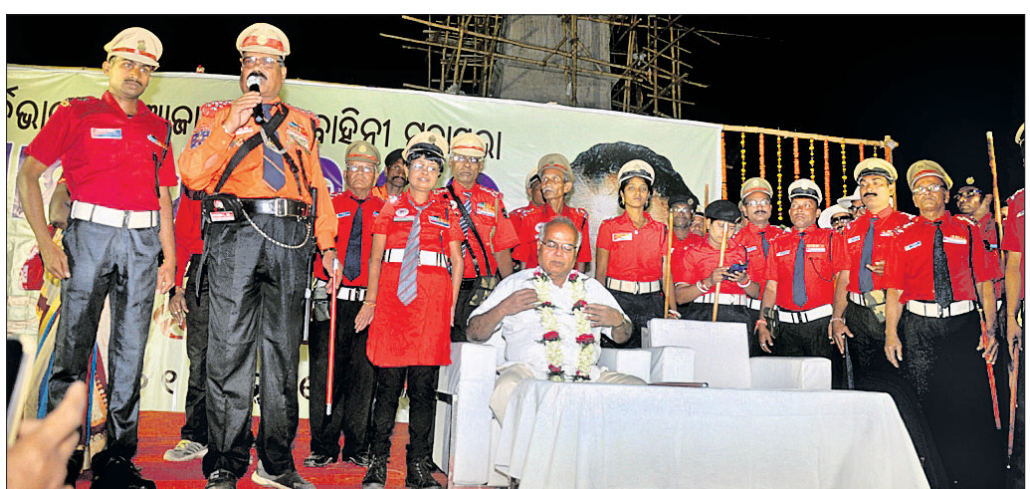
ଫନୀ ଦୁର୍ଗତଙ୍କୁ ସହାୟତା କରିବା ପାଇଁ ପ୍ରସ୍ତୁତ ଥିବା ଠେଙ୍ଗା ବାହିନୀ ସଦସ୍ୟ ।