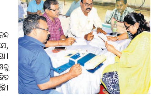
ସୂଚନା ଭବନ ପରିସରରେ ଥିବା ଗୀତଗୋବିନ୍ଦ ସଦନରେ ରିଟର୍ନ ଅଫିସରମାନେ ଭୋଟଗଣତି ତାଲିମ ନେଉଛନ୍ତି।

ନିର୍ଦ୍ଦେଶ ମୁତାବକ ନିର୍ବାଚନ କମିଶନଙ୍କ ପରାମର୍ଶ ଅନୁଯାୟୀ ପ୍ରତ୍ୟେକ ବିଧାନସଭା ନିର୍ବାଚନ ମଞ୍ଚଳର ସର୍ବନିମ୍ନ ୫ଟି ବ୍ଲକ୍ରେ ଉଚ୍ଚିତ୍ୱ ସହିତ ଭିଜିପିଏଟି (ଭୋଟର ଭେରିଫିକାସନ୍ ପେପର ଅଫିସ୍ ଟ୍ରେଲ) ସ୍ଥିତ ମଧ୍ୟ ଗଣନା କରାଯିବ। ଉଭୟ ଲୋକ ସଭା ଓ ବିଧାନସଭା ସକାଶେ ଭୋଟ ଗଣନା ପାଇଁ ୬ଟି ଟେବୁଲ୍ କରାଯିବ। କେଉଁ ବ୍ଲକ୍ରେ ଭିଜିପିଏଟି ସ୍ଥିତ ଗଣନା କରାଯିବ ତାହାର ଲିଷ୍ଟ ନିର୍ଦ୍ଦେଶ ଦେଇଛି। ଗୋଟିଏ ଭିଜିପିଏଟି ସ୍ଥିତ ଗଣନା ପାଇଁ ପ୍ରାୟ ୧ ଘଣ୍ଟା ସମୟ ଲାଗି ପାରେ। ଉଚ୍ଚିତ୍ୱ ଗଣନା ପରେ ସେହି ମେଣ୍ଟିନକୁ ଖୁଲ୍ଲୁଖୁଲ୍ଲୁ ନିଆଯିବ। ପୁଣି ଭିଜିପିଏଟି ସ୍ଥିତ ଗଣନା କରାଯିବ। ଉଚ୍ଚିତ୍ୱ ଏବଂ ଭିଜିପିଏଟିଏ ଏକା ସାଙ୍ଗରେ ଗଣନା କରାଯିବ ନାହିଁ। ଗୋଟିଏ ପରେ ଗୋଟିଏ ଗଣନା ହେବ। ଫଳରେ ୪ଟି ଭିଜିପିଏଟି ଗଣନା ପାଇଁ ୪ ଘଣ୍ଟା ସମୟ ଲାଗି ପାରେ। ସରକାରୀ ଭାବେ ପ୍ରଥମ ପର୍ଯ୍ୟାୟ ଫଳାଫଳ ଘୋଷଣା ୪ ଘଣ୍ଟା ଲାଗି ପାରେ ବୋଲି ସିଦ୍ଧି ଉପରେ ଅଧ୍ୟକ୍ଷ ଗରମ ହେଉଥିବାରୁ ପ୍ରତ୍ୟେକ ଗଣନା କେନ୍ଦ୍ରରେ ଶୀତଳାପା ନିୟନ୍ତ୍ରିତ ବ୍ୟବସ୍ଥା କରାଯିବ। ଭୋଟ ଗଣନା କାର୍ଯ୍ୟରେ ନିୟୋଜିତ ହେବା ଲାଗି ୧୧ଟି ଜିଲ୍ଲାର ୨୯ ଜଣ ରିଟର୍ନ ଅଫିସରଙ୍କୁ ତାଲିମ ପ୍ରଦାନ କରାଯାଉଛି। ସେହି ଜିଲ୍ଲାଗୁଡ଼ିକ ହେଲା କଟକ, ଖୋର୍ଦ୍ଧା, ଗଞ୍ଜାମ, କୋରାପୁଟ, ମୟୂରଭଞ୍ଜ, ବଲାଙ୍ଗୀର, କଳାହାଣ୍ଡି, ସୁନ୍ଦରଗଡ଼, କେନ୍ଦୁଝର, ବାଲେଶ୍ୱର ଏବଂ ଜଗତସିଂହପୁର।