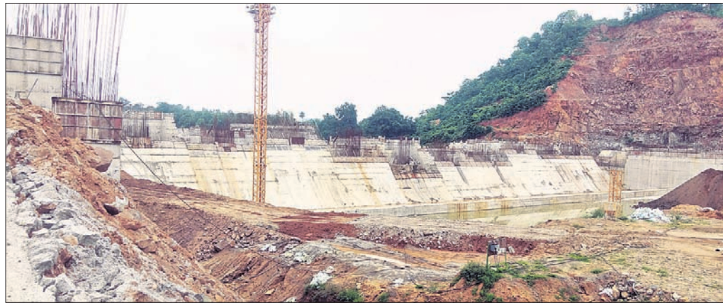
ଅର୍ଦ୍ଧନିର୍ମିତ ଲୋୟର ସୁକ୍ତେଲ ଜଳସେଚନ ପ୍ରକଳ୍ପର ସ୍ଥଳଖଣ୍ଡ ।

ବଲାଙ୍ଗୀର ଜିଲ୍ଲାର ଲୋୟର ସୁକ୍ତେଲ ଜଳସେଚନ ପ୍ରକଳ୍ପର ତ୍ୟାମ ନିର୍ମାଣ କାର୍ଯ୍ୟ ୮ ମାସ ହେଲା ବନ୍ଦ ପଡ଼ିଛି । ଏହି ତ୍ୟାମର ନିର୍ମାଣ କାମ ପୂର୍ଣ୍ଣ କେବେ ଆରମ୍ଭ ହେବ ସେନେଇ କାହାରି ପାଖରେ ଭରଣ ନାହିଁ । ଏବେ ପରିସ୍ଥିତି ଏପରି ଜଟିଳ ହୋଇଛି ଯେ ବହୁ ପ୍ରତ୍ୟକ୍ଷିତ ଏହି ପ୍ରକଳ୍ପ ବନ୍ଦ ହେବାର ଆଶଙ୍କା ସୃଷ୍ଟି ହୋଇଛି । ୨୧୭.୧୩ କୋଟି ଟଙ୍କା ବ୍ୟୟ ବରାଦରେ ଆରମ୍ଭ ହୋଇଥିବା ଏହି ପୂଜ ପ୍ରକଳ୍ପକୁ ୨୦୦୧ ମସିହାରେ ମୁଖ୍ୟମନ୍ତ୍ରୀ ନବୀନ ପଟ୍ଟନାୟକ ଶିଳାମ୍ୟାସ କରିଥିଲେ । ହେଲେ ବିଭିନ୍ନ କାରଣରୁ ଏହି ପ୍ରକଳ୍ପ ନିର୍ମାଣ କାର୍ଯ୍ୟ ବିଳମ୍ବ ହୋଇଛି । ଦୀର୍ଘ ୧୮ ବର୍ଷ ପରେ ବି ଉକ୍ତ ପ୍ରକଳ୍ପ ଝୁଲୁ ଅବସ୍ଥାରେ ରହିଛି । ବ୍ୟୟ ଅଟକଳ ବି ଏବେ ଆଶାତୀତ ଭାବେ ବୁଝି ପାରିଲେ । ୨୦୦୯ ମସିହାରେ ଏହି ପ୍ରକଳ୍ପର ସଂଶୋଧିତ ବ୍ୟୟ ଅଟକଳ ୧୦୪୧.୮୧ କୋଟି ଟଙ୍କାକୁ ମଞ୍ଜୁରୀ ମିଳିଥିଲା । ତେବେ ସଂଶୋଧିତ ବ୍ୟୟ ଅଟକଳ ପରେ ବି ଏହି ପ୍ରକଳ୍ପର ଆଶାତୀତ ଅସ୍ଥିତି ହୋଇପାରି ନ ଥିଲା । ଏହାପରେ ୨୦୧୫ରେ ଏହି ପ୍ରକଳ୍ପର ବ୍ୟୟ ଅଟକଳକୁ ବୃତ୍ତୀୟ ଥର ପାଇଁ ପରିବର୍ଦ୍ଧିତ କରାଗଲା । ବ୍ୟୟ