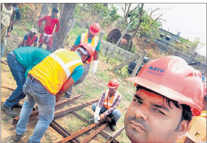
କାର୍ଯ୍ୟରେ ନିଯୋଜିତ ଭିସା କର୍ମଚାରୀ ।