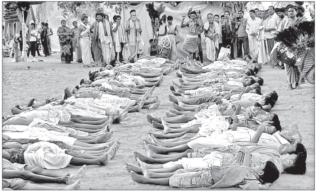
ମାନସିକଧାରୀ ମେରୁ ପଡ଼ିଆରେ ଅଧିଆ ପଡ଼ିଛନ୍ତି।

ସୁବର୍ଣ୍ଣପୁର ଜିଲ୍ଲା ବାମନହାରାଜପୁର ଉପଖଣ୍ଡ ଉଲୁଆ ବ୍ଲକ ଅଧୀନ କାଦୋଦର ଗ୍ରାମର ପ୍ରସିଦ୍ଧ ଦଣ୍ଡଯାତ୍ରା ଉଦ୍‌ଯାପିତ ହୋଇଯାଇଛି। ତୈତ୍ତି ମାସ ପ୍ରାରମ୍ଭରେ ବାହାରିଥିବା ଏହି ପାରମ୍ପରିକ ଶୋହଳ ସୁଆଙ୍ଗ ଦଣ୍ଡଯାତ୍ରାର ଅନ୍ତିମ ପର୍ବ (ମେରୁ ଉତ୍ସବ)ରେ ମାନସିକଧାରୀ, ଭଲ ଏବଂ ଶୁଭାଳୁଙ୍କ ସହିତ ବହୁ ସଂଖ୍ୟାରେ ସଂସ୍କୃତିପ୍ରେମୀ ସାମିଲ ହୋଇଥିଲେ। ଅଞ୍ଚଳର ଅନ୍ୟାନ୍ୟ ସ୍ଥାନରେ ୧୪ରୁ ୨୧ ଦିନ ପର୍ଯ୍ୟନ୍ତ ଦଣ୍ଡଯାତ୍ରା ଅନୁଷ୍ଠିତ ହେବାସହ ବିଷୁବ ସଂକ୍ରାନ୍ତି ତିଥିରେ ମେରୁ ପର୍ବ ଅନୁଷ୍ଠିତ ହୋଇଥାଏ। କିନ୍ତୁ କେବଳ କାଦୋଦର ଦଣ୍ଡଯାତ୍ରା ଦୀର୍ଘ ୪୫ ଦିନ ବ୍ୟାପୀ ଆୟୋଜିତ ହେବାର ଏକ ଅନନ୍ୟ ପରମ୍ପରା ରହିଛି।