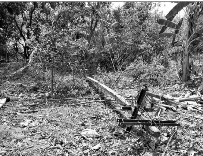
ପଦ୍ମପୁର ଗାଁରେ ଝଡ଼ରେ ଭାଙ୍ଗି ପଡ଼ିଥିବା ବିକ୍ରି କିଣ୍ଡା ।

ଖଡ଼ିଆଳ ବ୍ଲକ ■ ବିଦ୍ୟୁତ୍ ଖୁଣ୍ଟ ଉପୁଡ଼ିପଡ଼ିଛି, ଯନ୍ତ୍ରପତିରା ତାଣ୍ଡବ ନଷ୍ଟ ■ ଲୋକଙ୍କୁ ଘାରିଛି ଫନା ଭୟ ■ ପ୍ରଶାସନ ପାଖରେ ଟାଣିପାନ୍ତି ନାହିଁ