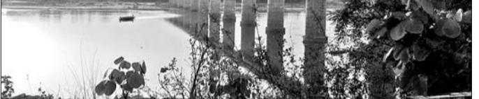
ତେଲନଦୀରେ ନିର୍ମିତ ପୋଲ ।