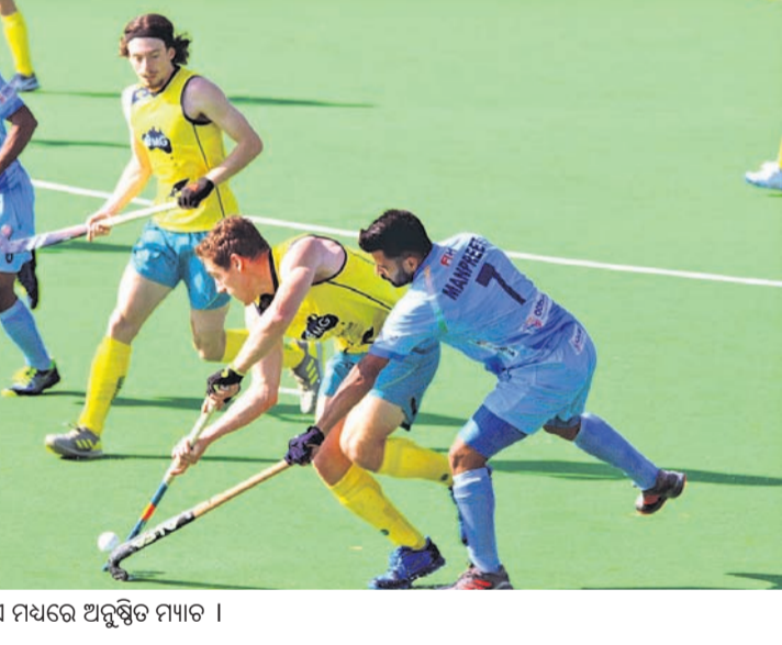
ଭାରତ ଓ ଅଷ୍ଟ୍ରେଲିଆ-ଏ ମଧ୍ୟରେ ଅନୁଷ୍ଠିତ ମ୍ୟାଚ ।