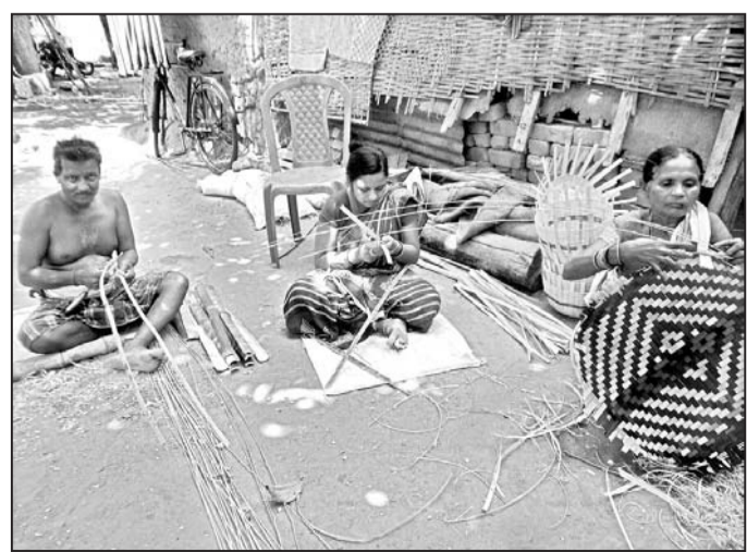
ଭୁଲ୍ ତିଆରିବାର ଲାଗି ଝନେ କାରିଗର ପାତିଆ କରୁଛନ୍ତି ।

ବରପାଲି, ୧୩୧୫ (ଡି.ଏନ.ଏ): ସମସ୍ତଙ୍କ ଜିନିଷପାତି ଲୁଚୁଛି ସୁହରହେ । ବିହାରପଡ଼, ପୁରୀପାଠକେ ଛାଡ଼ିଦେଲେ ଲୋକ୍ ବାଉଁଶ ସାମାନଙ୍କ ବୃତ୍ତିରବାର ନାହିଁ । କାଁ କାଁ ଗାଁଗାଁରେ ଲୋକ୍ ଇ ବାଉଁଶ ତିଆରି ଭୁଗା, ଚୁପାର, ଭୁଲ୍ ଗାଁ ବେତାର କରୁଛନ୍ତି । ସେମାନଙ୍କୁ ବାଉଁଶ ଚୁପାର ବାସନ୍ଦର ଦୂରୀକୃତ କରିବା ପାଇଁ ଦାବି କରାଯାଇଛି । ଦିନୁଦିନକେ ବାଉଁଶ କାରିଗର ଲୋକ୍ ପାଏବାକେ ବସନ୍ଦ । ଇଆଡେ ଖଞ୍ଜଳ ଆଇନ୍ କଡ଼ାଡ଼ି ହେବାର ଲାଗି କାରିଗରମାନେ ବୁଦ୍ଧିଧୀରେ ବାଉଁଶ ନାହିଁ ବାସନ୍ଦ । ସେମାନେ ଲାଗି ବାଉଁଶ କାରିଗର ପାତିଆ କରୁଛନ୍ତି ।