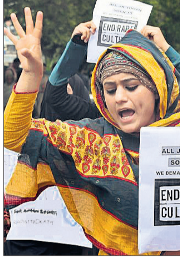
ବଳାହାର ପ୍ରତିବାଦରେ ଦିଲ୍ଲୀରେ ମହିଳାମାନେ ବିକ୍ଷୋଭ କରୁଛନ୍ତି।