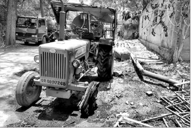
ନିଆଁ ଲାଗି ପୋଡ଼ିଯାଇଥିବା ଗ୍ରାହର ।

ଭବାନୀପାଟଣା ପୌର ସଂସ୍ଥା ଗଣ୍ଡା ପାକ ପଛପଟେ ଥିବା କାଞ୍ଜିହାଉସମ୍ମିତ ଗୋଦାମ୍ରେ ସେମିଟାରେ ଅପରାହ୍ଣରେ ନିଆଁ ଲାଗିଯାଇଛି । ଫଳରେ ଲକ୍ଷାଧିକ ଟଙ୍କା ମୂଲ୍ୟର ଯାନବାହନ ଓ ଅନ୍ୟାନ୍ୟ ସାମଗ୍ରୀ ପୋଡି ନଷ୍ଟ ହୋଇଯାଇଛି । ଏହା ଅତ୍ୟଧିକ ଗୁଡ଼ିଚାପ ଓ ପ୍ରବଳ ଗରମ ଯୋଗୁ ନିକଟରେ ଥିବା ବିଦ୍ୟୁତ୍ ତାରରେ ସର୍ତ୍ତକିଟ ନିଆଁ ଲାଗିଥିବା ସନ୍ଦେହ କରାଯାଉଥିବା ବେଳେ ଆଉ କିଛି ଏହା ଯୋଜନାବଦ୍ଧ ଭାବେ ଏହା କରାଯାଇଛି ବୋଲି ଅଭିଯୋଗ ହେଉଛି । ଅପରାହ୍ଣ ପ୍ରାୟ ଏକ ଘଣ୍ଟାରେ ହଠାତ୍ ଭବାନୀପାଟଣା ପୌର ସଂସ୍ଥା ଗଣ୍ଡାପାକ ପଛପଟେ ଥିବା କାଞ୍ଜିହାଉସମ୍ମିତ ଗୋଦାମ୍ ଠାରେ ନିଆଁ ଲାଗିଥିଲା । ନିଆଁ ଲାଗିବା ଦେଖି ସ୍ଥାନୀୟବାସୀ ଅଗ୍ରାଣ୍ଟମାନେ ବିଭାଗକୁ ଖବର ଦେବା