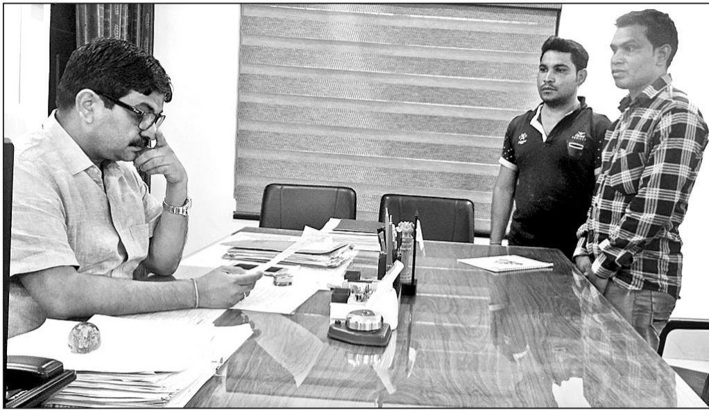
ସାମାଜିକ ବାସନ୍ଦ ହୋଇଥିବା ପରିବାର ସଦସ୍ୟ ଜିଲ୍ଲାପାଳଙ୍କୁ ଭେଟୁଛନ୍ତି ।