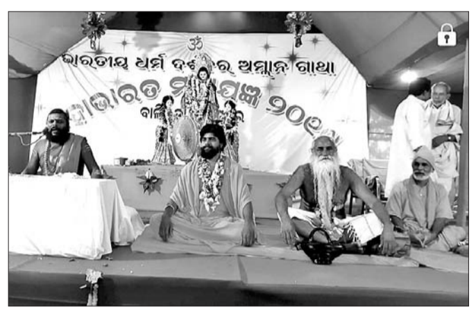
ବାଲିଛତା ମହାଭାରତ ମହାଯଜ୍ଞର ପ୍ରବଚନ କାର୍ଯ୍ୟକ୍ରମ ।

ରିଷିଡ଼ା, ୧୩୫ (ଡି.ଏନ.ଏ.)- ବିରାଟ ପର୍ବ ଭିନ୍ନ ଭିନ୍ନ ଦିବସରେ ନାଟକଗୁଡ଼ିକ ପରିବେଷଣ କରାଯାଇଥାଏ । ରବିବାର ରାତିରେ କିଟକ ବଧ ରାଧାକୃଷ୍ଣ ସାଂସ୍କୃତିକ ଅନୁଷ୍ଠାନ ତରଫରୁ ଚଳିଥିବା ଚନ୍ଦନ ଯାତ୍ରା ଯୋଗବାର ଉଦ୍‌ଯାପିତ ହୋଇଯାଇଛି । ଅକ୍ଷୟ କୁନି କଳାକାରମାନଙ୍କ ଅଭିନୟ ସମଗ୍ରକୁ ତୃତୀୟାଠାରୁ ଚାଲିଥିବା ମହାଭାରତର