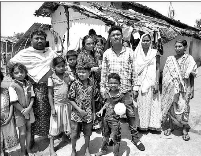
ପଦ୍ମପୁର ଗାଁର ପ୍ରଭାବିତ ପରିବାର ଲୋକ ।

ରାଜ୍ୟରେ ସାମୁଦ୍ରିକ ଝଡ଼ ଫନାର ତାଣ୍ଡବ ଲୀଳା ରାଜ୍ୟବାସୀଙ୍କୁ ଥରାଇଦେଇଥିବାବେଳେ ରାଜ୍ୟର ବିଭିନ୍ନ ଜାଗାରେ ଏବେବି ଝଡ଼ ତୋଫାନ ହେଲେ ଲୋକେ ଭୟରେ ଥରି ରୁହନ୍ତି । ଉଦ୍‌ଯାପିତ ବିଭିନ୍ନ ରୀତିରେ ନୂଆପତ୍ରା ଜିଲ୍ଲା ଖଡ଼ିଆଳ ବ୍ଲକ ବିଭିନ୍ନ ଅଞ୍ଚଳରେ ପ୍ରବଳ ଝଡ଼ତୋଫାନ ଲୋକଙ୍କ ଅବସ୍ଥାକୁ ବୋଧଦାୟକ ଦେଖାଛି । ବିଶେଷ କରି ଏଠିକାର ଭୋକପୁର ଗ୍ରାମପଞ୍ଚାୟତ ଅଞ୍ଚଳ ପଦ୍ମପୁର ଗାଁରେ ବିଭାଷିକା ଲୋକଙ୍କ ନିଦ ହଜାଇ ଦେଇଛି । ଏହି ଗାଁରେ ବ୍ୟାପକ କ୍ଷୟକ୍ଷତି ହୋଇଥିବା ପ୍ରାଥମିକ ଆକଳନକୁ ଜଣାପଡ଼ିଛି । ଯଦିବା ରାଜ୍ୟ ସରକାରଙ୍କ ଆଲର୍ଟ ଯୋଗୁ ଲୋକେ ସତର୍କ ହୋଇ ରହିଥିଲେ । ଦିନ ତମାମ ଜିଲ୍ଲାରେ ମେଲୁଆ ପାଗ ରହିଥିବାବେଳେ ଝଡ଼ଦେଖାଯାଇଥିଲା । ଖଡ଼ିଆଳ ବ୍ଲକ କାର୍ଯ୍ୟାଳୟଠାରୁ ମାତ୍ର ୨ କି.ମି. ଦୂର ପଦ୍ମପୁର ଗାଁର ଚିତ୍ର କିନ୍ତୁ ଭିନ୍ନ ଥିଲା । ଗାଁରେ ମାତ୍ର ୫/୧୦ ମିନିଟ ମଧ୍ୟରେ ଝଡ଼ତୋଫାନ ସବୁ ବିଗାଡି ଦେଇଥିଲା । ପ୍ରବଳ ବେଗରେ ଆସିଥିବା ଝଡ଼ରେ ଗାଁ ତଥା ନିକଟସ୍ଥ ସମସ୍ତ ବିଦ୍ୟୁତ୍ ଖୁଣ୍ଟ ଉପୁଡ଼ିପଡ଼ିଥିବାବେଳେ ବଡ଼ ବଡ଼ ଗଛ ତେର ସହ ଉପୁଡ଼ିପଡ଼ିଛି । ଗାଁ ଯୋଗେଇ ପାଖେ, ଘରରେ