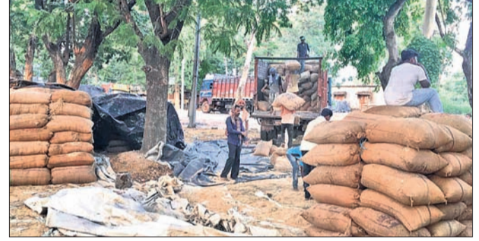
ବରଗଡ଼ ଜିଲ୍ଲା ଗୋଡ଼ଭାଗା ମଣ୍ଡିରେ ସଂଗୃହୀତ ଧାନ ମିଳୁ ନେବା ପାଇଁ ଉଠାଯାଇଛି ।