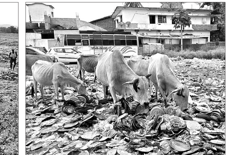
ନୂଆପଡ଼ା ଜିଲ୍ଲା ଖଡ଼ିଆଳ ଏକସିଏର କଲ୍ୟାଣ ମଣ୍ଡଳ-୨ ନିକଟରେ ଅଭିଆ ଆବର୍ତ୍ତନା ପରିଥିବା ବେଳେ ଗୋରୁ ଖାଉଛନ୍ତି ।