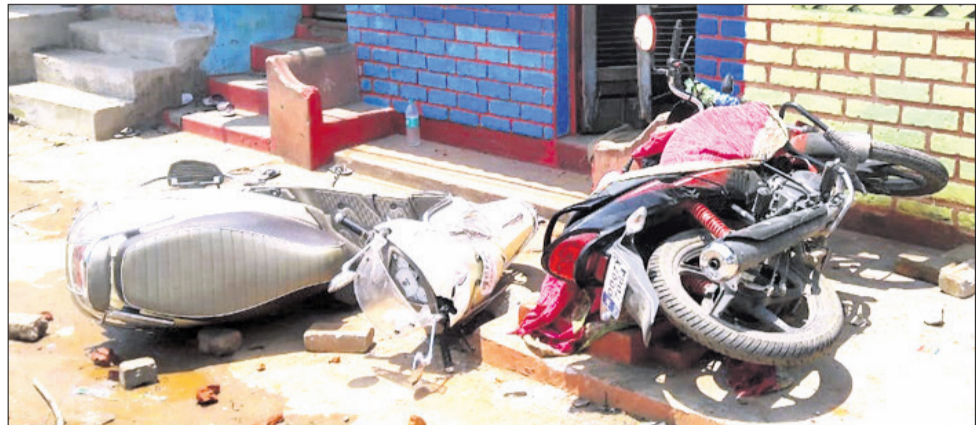
ଗୋଷ୍ଠୀ ସଂଘର୍ଷ ବେଳେ ଲକ୍ଷ୍ମୀଦେବୀ ହୋଇ ପଡ଼ିଥିବା ଗାଡ଼ି ।