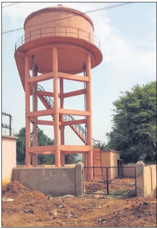
ବିଦ୍ୟୁତ ସଂଯୋଗ ଅଭାବୁ ଅଚଳ ପଡ଼ିଥିବାର ନୃତ୍ୟ ପାଏନ୍ ପ୍ରକଳ୍ପ।

ବିଦ୍ୟୁତ ବିନା ଖରା ଚାଟି ବହୁଲେ, ଇଚ୍ଚାର ସଂଗେ ଅନେକ ଜାଗାରେ ପିଇଲା ପାଏନ୍ ଦରକାର ବି ବଢ଼ିଚାଲିଛି। ହେଲେ ବିଭାଗୀୟ ଅବହେଳାର ଲାଗି ବଲାଙ୍ଗୀର ଜିଲ୍ଲା ଖପ୍ରାଖୋଳ ବ୍ଲକ ଅଧୀନ ମାଲପଡ଼ା ପଡ଼େଟ୍ ଅଧୀନ ଜଳପାକେଲ ଗାଁବାସୀ ପିଇଲା ପାଏନ୍ ଲାଗି ନାନା ସମସ୍ୟାର ସାମନା କରୁଥିବା ଅଭିଯୋଗ ହେଉଛି।