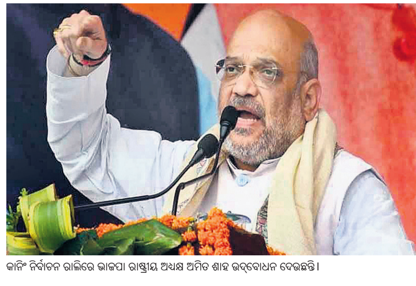
କାନ୍ଦି ନିର୍ବାଚନ ରାଜିନୀତି ସୋମବାର ରାଷ୍ଟ୍ରୀୟ ଅଧ୍ୟକ୍ଷ ଅମିତ ଶାହ ଉଦ୍‌ବୋଧନ ଦେଉଛନ୍ତି ।