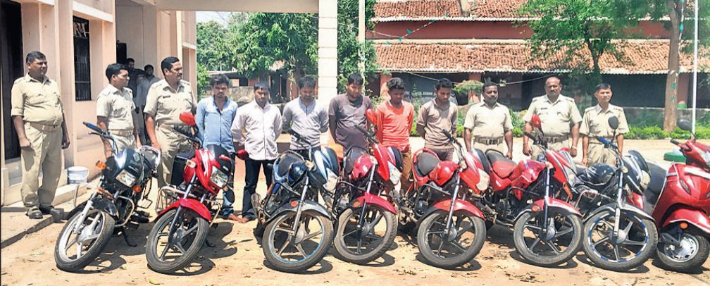
ପୋଲିସ ଦ୍ଵାରା ଗରଫ ଅଭିଯୁକ୍ତ ୬ ବଡ଼ ବାଇକ ଟ୍ୟାକ୍ସର ।