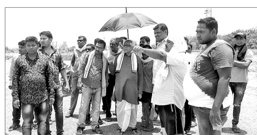
ଦେଓଗାଁ ଯୋଗାଯୋଗ ମାଟି ଉନ୍ନତକରଣ କାର୍ଯ୍ୟକ୍ରମ ନିମ୍ନ ପରିଦର୍ଶନ କରୁଛନ୍ତି।