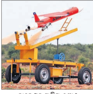
ବାଲେଶ୍ୱର ଅଧିକ, ୧୩୫

ପ୍ରତିରକ୍ଷା ଉଦ୍ଦେଶ୍ୟରେ ଓ ଉନ୍ନତ ସଂସ୍ଥା (ଡିଆର୍ଡିଓ) ଦ୍ୱାରା ଚାଲିପୁରସ୍ଥିତ ଆଇଟିଆର(ଇଣ୍ଟେରିନ୍ ଟେଷ୍ଟ ରେଞ୍ଜ)ରୁ ସୋମବାର ‘ଅଭ୍ୟାସ’ ଡ୍ରୋନ୍ର ସଫଳ ପରୀକ୍ଷଣ କରାଯାଇଛି । ହାଇ-ସ୍ପିଡ୍ ଏକ୍ସପେଡେଣ୍ଟ ଏରିୟଲ୍ ଗାର୍ଗେଟ (ହିସ) ନାମରେ ପରିଚିତ ଏହି ଡ୍ରୋନ୍ରେ ଏକ ଛୋଟ ଗ୍ୟାସ୍ ଟର୍କାଇନ୍ ଇଞ୍ଜିନ ସଂଯୁକ୍ତ ରହିଛି । ଏହାର ଉଚ୍ଚାଗକୁ ବିଭିନ୍ନ ରାତାର ଏବଂ ପୃଷ୍ଠା-୪