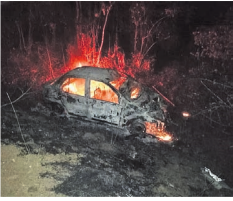
ସୋନପୁର-ସମ୍ବଲପୁର ମୁଖ୍ୟରାସ୍ତାର ଏସ୍.ପତ୍ରାପାଲି ଛକ ନିକଟରେ ଘଟିଥିବା ବୁର୍ଲାଟଣା ପରେ ଜଳୁଥିବା ଗାଡ଼ି ।