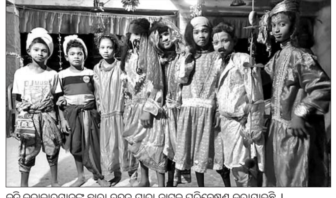
କୂଳି କଳାକାରମାନଙ୍କ ଦ୍ୱାରା ତିଆରି ହୋଇଥିବା ପରିବେଷଣ କରାଯାଇଛି ।

ଗଣତି ସ୍ଥାନରେ ପାନୀୟ ଜଳ ବ୍ୟବସ୍ଥା ଓ ପରିମଳ ବ୍ୟବସ୍ଥା ପାଇଁ ଭବାନୀପାଟଣା ମ୍ୟୁନିସିପାଲିଟି ନିର୍ବାହୀ ଅଧିକାରୀ ଓ ପିଏସଡି ନିର୍ବାହୀ ଯତ୍ନାତ୍ମକ ନିର୍ଦ୍ଦେଶ ଦିଆଯାଇଛି । ଗ୍ରାହଣ ପ୍ରବାହକୁ ଦୃଷ୍ଟିରେ ରଖି ନିର୍ବାଚନ କମିଶନଙ୍କ ନିର୍ଦ୍ଦେଶକ୍ରମେ ସମସ୍ତ ଗଣତି କେନ୍ଦ୍ରରେ ଏସି ଲଗାଯିବ । ଗଣତି ପାଇଁ ୩୭୦ ଜଣ କର୍ମଚାରୀ ନିଯୋଜିତ ହେବାକୁ ଥିବା ବେଳେ ଆନୁଷ୍ଠାନିକ କାର୍ଯ୍ୟ ପାଇଁ ସମୁଦାୟ ୫୦୦ ରୁ ଅଧିକ କର୍ମଚାରୀଙ୍କୁ ଦାୟିତ୍ୱ ପ୍ରଦାନ କରାଯାଇଛି । ଗଣତି କେନ୍ଦ୍ରକୁ ମୋବଇଲ ନେବାକୁ ବାରଣ କରାଯାଇଛି । ବର୍ତ୍ତମାନ ଝୁଙ୍ଗାଗୁମରେ ତିନି ଆକିଆ କଡ଼ା ସୁରକ୍ଷା ବ୍ୟବସ୍ଥା କରାଯାଇଛି । ପ୍ରଥମ ଆକିଆରେ ରାଜ୍ୟ ପୋଲିସ୍ କର୍ମଚାରୀ, ଦ୍ୱିତୀୟ ଆକିଆରେ ରାଜ୍ୟ ରିଜର୍ଭ ପୋଲିସ୍ କର୍ମଚାରୀ ଓ ତୃତୀୟ ଆକିଆରେ ସିଆରପିଏସ୍ ବାଗାଲିଅନଙ୍କୁ ଦାୟିତ୍ୱ ଦିଆଯାଇଛି । ନିର୍ବାଚନ ଭୋଟ ଗଣତିକୁ ଆଖି ଆଗରେ ରଖି ଇଞ୍ଜିନିୟରିଂ କଲେଜ ପରିସରକୁ କଡ଼ା ସୁରକ୍ଷା ବ୍ୟବସ୍ଥା କରାଯାଇଛି ।