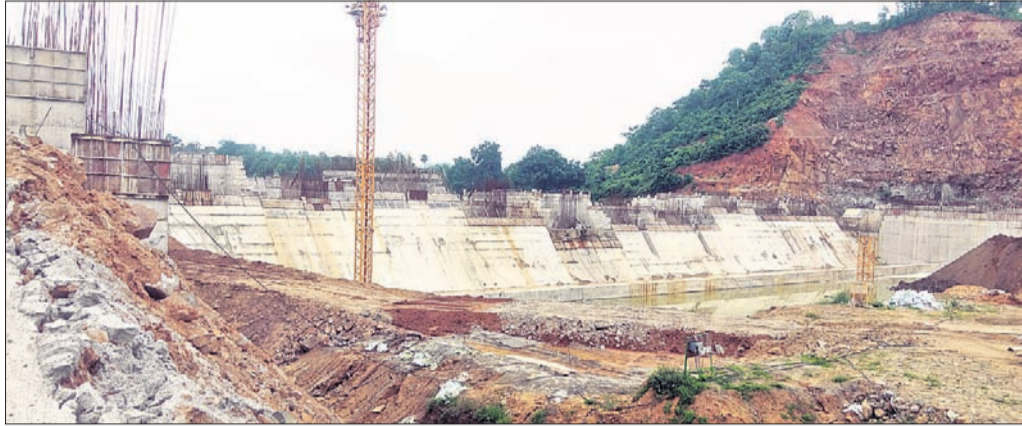
ଅର୍ଦ୍ଧନିର୍ମିତ ଲୋୟର ସୁକ୍ତେଲ ଜଳସେଚନ ପ୍ରକଳ୍ପର ସ୍ଥିଳାବଳୀ

ବଲାଙ୍ଗୀର ଜିଲାର ଲୋୟର ସୁକ୍ତେଲ ଜଳସେଚନ ପ୍ରକଳ୍ପର ତ୍ୟାଗ ନିର୍ମାଣ କାର୍ଯ୍ୟ ୮ ମାସ ହେଲା ବନ୍ଦ ପଡ଼ିଛି। ଏହି ତ୍ୟାଗ ନିର୍ମାଣ କାର୍ଯ୍ୟ ପୂର୍ଣ୍ଣ ହେବ ପରେ ଏହାକୁ ପୁଣି କେବେ ଆରମ୍ଭ ହେବ ସେନେଇ କାହାରି ପାଖରେ ଭରଣ ନାହିଁ।