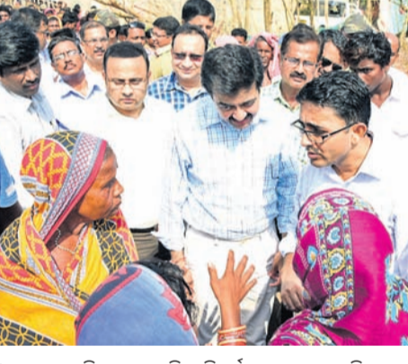
ପୁରୀ ସହରରୁ ବଳିଆପଞ୍ଚା ବସ୍ତ୍ର ପରିବର୍ତ୍ତନ ଅବସରରେ ବିପନ୍ନଙ୍କୁ ସମସ୍ୟା ସମ୍ପର୍କରେ ପଚାରି ବୁଝୁଛନ୍ତି କେନ୍ଦ୍ରୀୟ ଚିମ୍ ସମ୍ପର୍କିତ ଅଧିକାରୀ

ବାତ୍ୟା 'ଫନା' କ୍ଷତିଗ୍ରସ୍ତ ପାଇଁ ରାଜ୍ୟ ସରକାର ୧୬୦୦ କୋଟି ଟଙ୍କାର ପ୍ୟାକେଜ ଘୋଷଣା କରିବା ପରେ ୧୧ଜଣ ଆକ୍ରମଣ ଚିମ୍ ବାତ୍ୟା ପ୍ରଭାବିତ ଅଞ୍ଚଳ ବୁଲି ଛୁଟି ଅନୁଧାନ କରିବା ସହ କ୍ଷତିଗ୍ରସ୍ତ ଆକଳନ କରୁଛନ୍ତି।