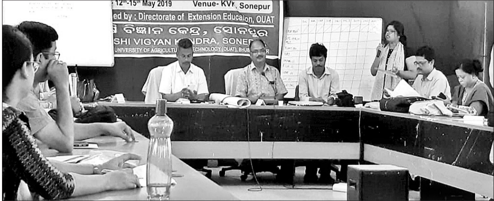
କର୍ମଶାଳାରେ ସୁବର୍ଣ୍ଣପୁର ଡିପ୍ୟୁଟି, ଓୟୁଏସିର ସ୍ପଷ୍ଟ ନିର୍ଦ୍ଦେଶକ ଓ କେଳିକେଳ ବିଜ୍ଞାନିକ କୁମ୍ଭ ମଞ୍ଚସାଥୀ ।

ସୋନପୁର, ୧୩୫(ଡି.ପ୍ର.): ସୁବର୍ଣ୍ଣପୁର ଜିଲ୍ଲା ବେଳ ମହାନଦୀ, ତେଲମୁଣ୍ଡା ଓ ଅଜନଦୀ ଭଳି ଅନେକ କ୍ଷେତ୍ରରେ ନଦୀ ପ୍ରବାହିତ ହେଉଥିଲେ ହେଁ ଏଠାକାର ତାପମାତ୍ରା ଅତ୍ୟଧିକ ଉଚ୍ଚ ଥିବାରୁ ଜଙ୍ଗଲ ବଢ଼ିଲେ ତାପମାତ୍ରା କମିବ । ଜଙ୍ଗଲ ସମ୍ପଦର ସୁବିନିଯୋଗ ଓ ବାଉଁଶ ଚାଷ ଦ୍ଵାରା ସାଧାରଣ ଗ୍ରାମୀଣ ପରିବାରର ଜୀବନ ଚାଳିକାର ଉନ୍ନତି ହେବ ।