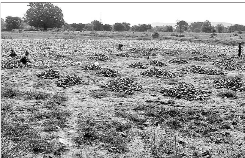
ପ୍ରବଳ ଖରା ସତ୍ତ୍ୱେ ସ୍ଥାନୀୟ ଝିଲମିଲ ଗାଁର ଶ୍ରମିକମାନେ କେନ୍ଦ୍ରପତ୍ର ଗୋଦାନ ନିକଟରେ ବାମ କରୁଛନ୍ତି ।