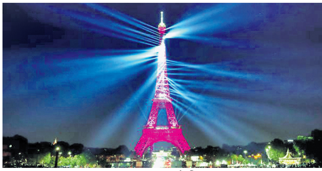
ପ୍ରାଚୀନ ରାଜଧାନୀ ପ୍ୟାରିସର ଉଚ୍ଚତମ ଲଫେଲ୍ ଟାୱରକୁ ଗୁରୁବାର ୧୩୦ ବର୍ଷ ଛୁଇଁଛି। ଏହି ଅବସରରେ ଲେଜର୍ ଶୋ ସହିତ ଏହାର ପ୍ରତିଷ୍ଠା ଉତ୍ସବ ପାଳନ କରାଯାଇଛି।