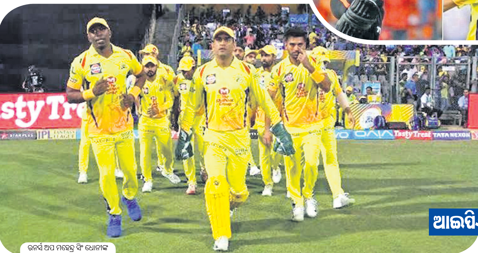
ରନସ୍ ଅପ ମହେନ୍ଦ୍ର ସିଂ ଧୋନୀଙ୍କ ଚେନାଲ ସୁପର କିଙ୍ଗ୍ସ ଦଳ

କିଶନ ଡିକକ୍ ୫୯୯, ଆଣ୍ଡ୍ରୁ ରସେଲ ୫୧୦, କ୍ରିସ୍ ଗେଲ୍ ୪୯୦, ଜିମ୍ ବେୟାରଣ୍ଡେ ୪୪୫ ରନ କରିଛନ୍ତି। ଭାରତୀୟ ବ୍ୟାଟ୍ସମ୍ୟାନଙ୍କ ମଧ୍ୟରେ ଲୋକେଶ ରାହୁଲ ୧୪ଟି ମ୍ୟାଚ୍ରେ ୫୯୩, ଶିଖର ଧାଞ୍ଜନ ୧୬ଟି ମ୍ୟାଚ୍ରେ ୫୨୧, ରଷ୍ଟଭ ପନ୍ଥ ୧୬ଟି ମ୍ୟାଚ୍ରେ ୪୮୮, ବିରାଟ କୋହଲି ୧୪ଟି ମ୍ୟାଚ୍ରେ ୪୬୪, ଶ୍ରେୟାସ୍ ଆୟର ୧୬ଟି ମ୍ୟାଚ୍ରେ ୪୬୩ ରନ୍ ସଂଗ୍ରହ କରିଛନ୍ତି। ସମ୍ପୂର୍ଣ୍ଣ ଚୁନିନେଇଥିବା ମୋଟ ୬ଟି ଶତକ ହାସଲ କରାଯାଇଥିବାବେଳେ