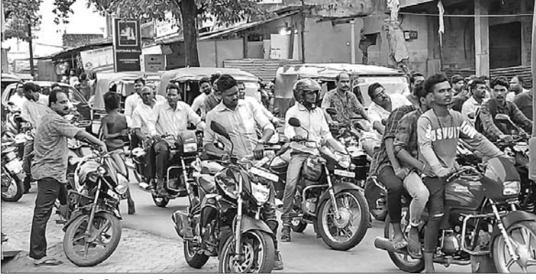
ରାସ୍ତାରେ ଅଟକି ରହିଥିବା ଗାଡ଼ିମୋଟର।

ଯାତାଯାତ ବେଳେ ଉଭୟ ପାର୍ଶ୍ଵରେ ଦୀର୍ଘ ସମୟ ଧରି ଅନ୍ୟ ଛୋଟବଡ଼ ଗାଡ଼ିମୋଟର ଅଟକି ରହିଛି। ଅନ୍ୟପକ୍ଷରେ ରାଜକିଆରେ ସ୍ଥାୟୀ ଅଟେ ରହିବା ସହ ବିଭିନ୍ନ ସ୍ଥାନକୁ ଯାତାଯାତ କରୁଛି। ଏଥିଯୋଗୁ ମଧ୍ୟ ଅନେକ ସମୟରେ ସମସ୍ୟା ଉତ୍ପନ୍ନ ହୁଏ। ଏ ନେଇ ବିଭିନ୍ନ ବୈଠକ ହେଉ ଅବା ଆମ ପୋଲିସ୍ ସମିତି ବୈଠକରେ ଅଭିଯୋଗ ହୋଇଛି। ଅନେକ ଥର ବିଭିନ୍ନ ପଦକ୍ଷେପ ନିଆଯାଇଥିଲେ ମଧ୍ୟ ତାହା ଠିକ ଭାବେ କାର୍ଯ୍ୟକାରୀ କରା ନ ଯିବା ଯୋଗୁ ସମସ୍ୟା ସୃଷ୍ଟି ହୁଏ।