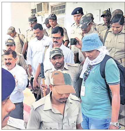
ରାୟ ପରେ ମାଓବାଦୀ ନେତା ସବ୍ୟସାଚୀଙ୍କୁ ଜେଲ ହାଜତକୁ ନିଆଯାଇଛି।

୧୯ କୋର୍ଟରେ ବିଚାର ହୋଇଥିଲା। ମୋଟ ୧୬ ଜଣ ସାକ୍ଷୀଙ୍କ ବୟାନକୁ ଆଧାର କରି