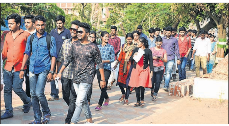
ପରୀକ୍ଷା ଦେଇ ଭୁବନେଶ୍ୱର ଯୁନିଟ୍-୮ ଡିଏଭି ପବ୍ଲିକ୍ ସ୍କୁଲ ପରୀକ୍ଷା କେନ୍ଦ୍ରକୁ ଛାତ୍ରୀଛାତ୍ରମାନେ ଫେରୁଛନ୍ତି।

ଭୁବନେଶ୍ୱର, ୧୮୫ (ଭୁବନେଶ୍ୱର) ଓଡ଼ିଶା ମୁକ୍ତ ପ୍ରବେଶିକା ପରୀକ୍ଷା (ଓଜେଇଇ) ଶନିବାର ଅନୁଷ୍ଠିତ ହୋଇଥିଲା। ରାଜ୍ୟର ୨୦ ସହରର ୫୩ଟି କେନ୍ଦ୍ରରେ ପ୍ରାୟ ୩୦ହଜାର ଛାତ୍ରୀଛାତ୍ର ଅଫ୍ଲାଇନ୍‌ରେ ଏହି ପରୀକ୍ଷା ଦେଇଛନ୍ତି। ଭୁବନେଶ୍ୱର ପରୀକ୍ଷା କେନ୍ଦ୍ରରେ ପ୍ରାୟ ୧୨୦୦ ଛାତ୍ରୀ ଓ ୧୨୦୦ ଛାତ୍ର ଅଫ୍ଲାଇନ୍‌ରେ ଏହି ପରୀକ୍ଷା ଦେଇଥିଲେ। ପ୍ରଥମ ସିଟ୍ ସକାଳ ୯ଟାରେ ୧୨୦୦ ଛାତ୍ରୀ ଓ ୧୨୦୦ ଛାତ୍ର ଅଫ୍ଲାଇନ୍‌ରେ ଏହି ପରୀକ୍ଷା ଦେଇଥିଲେ। ସେହିପରି ଦ୍ୱିତୀୟ ସିଟ୍ ୨ଟାରେ ୪୮୦ ଛାତ୍ରୀ ଓ ୪୮୦ ଛାତ୍ର ଅଫ୍ଲାଇନ୍‌ରେ ଏହି ପରୀକ୍ଷା ଦେଇଥିଲେ। ତୃତୀୟ ସିଟ୍ ୯ଟାରେ ୧୨୦୦ ଛାତ୍ରୀ ଓ ୧୨୦୦ ଛାତ୍ର ଅଫ୍ଲାଇନ୍‌ରେ ଏହି ପରୀକ୍ଷା ଦେଇଥିଲେ। ଭୁବନେଶ୍ୱର ପରୀକ୍ଷା କେନ୍ଦ୍ରରେ ପ୍ରାୟ ୧୨୦୦ ଛାତ୍ରୀ ଓ ୧୨୦୦ ଛାତ୍ର ଅଫ୍ଲାଇନ୍‌ରେ ଏହି ପରୀକ୍ଷା ଦେଇଥିଲେ। ପ୍ରଥମ ସିଟ୍ ସକାଳ ୯ଟାରେ ୧୨୦୦ ଛାତ୍ରୀ ଓ ୧୨୦୦ ଛାତ୍ର ଅଫ୍ଲାଇନ୍‌ରେ ଏହି ପରୀକ୍ଷା ଦେଇଥିଲେ। ସେହିପରି ଦ୍ୱିତୀୟ ସିଟ୍ ୨ଟାରେ ୪୮୦ ଛାତ୍ରୀ ଓ ୪୮୦ ଛାତ୍ର ଅଫ୍ଲାଇନ୍‌ରେ ଏହି ପରୀକ୍ଷା ଦେଇଥିଲେ। ତୃତୀୟ ସିଟ୍ ୯ଟାରେ ୧୨୦୦ ଛାତ୍ରୀ ଓ ୧୨୦୦ ଛାତ୍ର ଅଫ୍ଲାଇନ୍‌ରେ ଏହି ପରୀକ୍ଷା ଦେଇଥିଲେ।