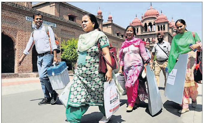
ଅନୁତସରର ଏକ ଭୋଟ ଗ୍ରହଣ କେନ୍ଦ୍ରକୁ ଯୋଗି କର୍ମଚାରୀ ଯାଉଛନ୍ତି।

ରବିବାର ସପ୍ତମ ତଥା ଅନ୍ତିମ ପର୍ଯ୍ୟାୟ ମତଦାନ ସହ ୨୦୧୯ ଲୋକ ସଭା ନିର୍ବାଚନ ଶେଷ ହେବାକୁ ଯାଉଛି। ଏପ୍ରିଲ ୧୧ରୁ ୭ ପର୍ଯ୍ୟାୟରେ ସପ୍ତଦଶ ଲୋକ ସଭା ଲାଗି ନିର୍ବାଚନ ଅନୁଷ୍ଠିତ ହୋଇଥିଲା। ଏଥର ନିର୍ବାଚନରେ ବିଭିନ୍ନ ଦଳ ମଧ୍ୟରେ କଡ଼ ଟକ୍କର ହୋଇଥିଲା। ଷ୍ଟାର ପ୍ରଚାରକମାନେ ବିଭିନ୍ନ ଅଞ୍ଚଳକୁ ଘନଘନ ଗସ୍ତ କରି ସେମାନଙ୍କ ଦଳ ସପକ୍ଷରେ ପ୍ରଚାର କରିଥିଲେ। ନିର୍ବାଚନ ଶେଷ ହେବା ସହ ଦୀର୍ଘଦିନ ଧରି ଏହାକୁ ନେଇ ଲୋକଙ୍କ ମଧ୍ୟରେ ଲାଗି ରହିଥିବା ଉତ୍ତୋଳନ ଅବସାନ ଘଟିବାକୁ ଯାଉଛି।