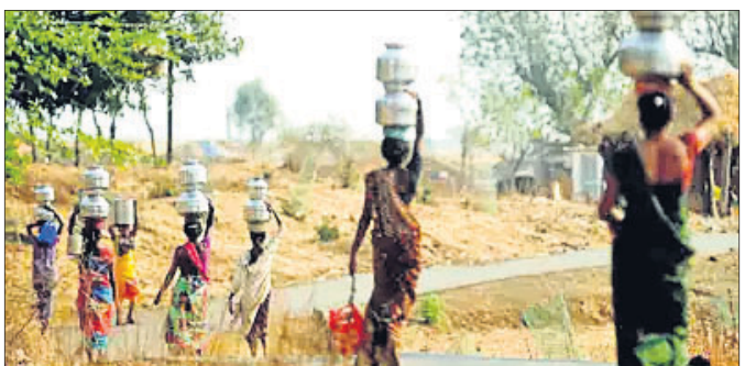
ଅଞ୍ଚଳ ଅଧିକ ପ୍ରଭାବିତ ହେବ। 'ପ୍ୟୁଚର ପ୍ରୋଜେକ୍ଟସ୍' ଅଫ୍ ହିନ୍ଦ୍ ଫ୍ରେଜ୍‌ସ୍ ଓଭର ଇଣ୍ଡିଆ ପ୍ରମ୍ ସିଏମ୍‌ଆଇପିଏ ମତେଲ୍' ଶୀର୍ଷକ ଏହି ରିପୋର୍ଟ ଅନ୍ତର୍ଗତ। ପତ୍ରିକା 'କୁଲମେଟ୍ ଓଭର ଇଣ୍ଡିଆ' ପ୍ରମ୍ ସିଏମ୍‌ଆଇପିଏ ପ୍ରକାଶ ପାଇଛି।

ଭାରତରେ ୨୦୨୦ରୁ ୨୦୬୪ ପର୍ଯ୍ୟନ୍ତ ଏଲ୍ ନିନେୟା ପ୍ରଭାବ ରହିବ। ଫଳରେ ଗ୍ରୀଷ୍ମ ପ୍ରବାହ ବଢ଼ିବ ବୋଲି ଇଣ୍ଡିଆନ୍ ଇନ୍‌ଷ୍ଟିଚ୍ୟୁଟ୍ ଅଫ୍ ଟ୍ରିପିକାଲ ମେଟିଓରୋଲୋଜି (ଆଇଆଇଟିଏମ୍)ପକ୍ଷରୁ ପ୍ରକାଶିତ ଏକ ରିପୋର୍ଟରେ ଦର୍ଶାଯାଇଛି। ଏହାଦ୍ୱାରା ମୂଳିକାର ଆର୍ଦ୍ରତା ହ୍ରାସ ପାଇବ। ଫଳରେ ଗାଈ ଉପରେ ନକାରାତ୍ମକ ପ୍ରଭାବ ପଡ଼ିବାର ଆଶଙ୍କା ରହିଛି। ଏଥିପାଇଁ ସମ୍ପର୍କ ଭାରତ ତଥା ଉପକୂଳ