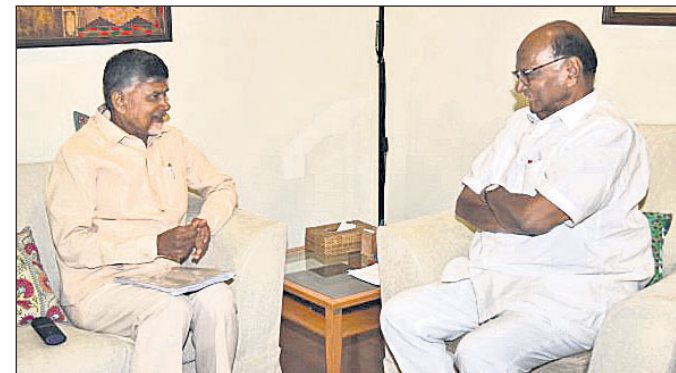
ଏନ୍‌ସିପି ନେତା ଶରଦ ପାଠ୍ଟାରଙ୍କ ସହ ଚନ୍ଦ୍ରାବାବୁ ନାଇଡୁ।

ଭାଜପା ପୁଣିଥରେ ପୂର୍ଣ୍ଣସଂଖ୍ୟାଗରିଷ୍ଠତା ସହ କ୍ଷମତାକୁ ଫେରିବ ବୋଲି ପ୍ରଧାନମନ୍ତ୍ରୀ ନରେନ୍ଦ୍ର ମୋଦି ଦକ୍ଷେତ୍ରି ପ୍ରକାଶ କରିବା ପରେ ରାଜନୈତିକ ମହଲରେ ହତଚଳିତ ସୃଷ୍ଟି ହୋଇଛି। ଏହାର ଦିନକ ପରେ ବିରୋଧୀ ଦଳଗୁଡ଼ିକ ପୁଣିଥରେ ମେଝ ଗଠନ କରି ମୋଦିଙ୍କୁ କ୍ଷମତାରୁ ଦୂରେଇ ରଖିବାକୁ ଉଦ୍ୟମ ଆରମ୍ଭ କରିଛନ୍ତି। ଚିତିପି ମୁଖ୍ୟ ତଥା ଆନ୍ତ୍ରପ୍ରଦେଶ ମୁଖ୍ୟମନ୍ତ୍ରୀ ଏନ୍. ଚନ୍ଦ୍ରାବାବୁ ନାଇଡୁ ଏହି ପରିପ୍ରେକ୍ଷାରେ କଂଗ୍ରେସ ଅଧକ୍ଷ ରାହୁଲ ଗାନ୍ଧୀ, ଏନ୍‌ସିପି ନେତା ଶରଦ ପାଠ୍ଟାର, ସମାଜବାଦୀ ପାର୍ଟି ଅଧକ୍ଷ ଅଖିଳେଶ୍ ଯାଦବ ପ୍ରମୁଖଙ୍କୁ ଭେଟି ନିର୍ବାଚନ ପରବର୍ତ୍ତୀ ମେଝ ଗଠନ ସମ୍ପର୍କରେ ଆଲୋଚନା କରିଛନ୍ତି। ସପ୍ତମ ପର୍ଯ୍ୟାୟ ମତଦାନର ଦୁଇଦିନ ପୂର୍ବରୁ ପ୍ରଧାନମନ୍ତ୍ରୀ ଖବରଦାତା ସମ୍ମିଳନୀରେ ନିଜ ସରକାରର ସଫଳତା ବଖାଣିଥିଲେ। ଏହି ଅବସରରେ ସେ ପୁଣିଥରେ ସରକାର ଗଠନ ନେଇ ଦୃଢ଼ୋଚ୍ଛି ବାଢ଼ିଥିଲେ। ହେଲେ