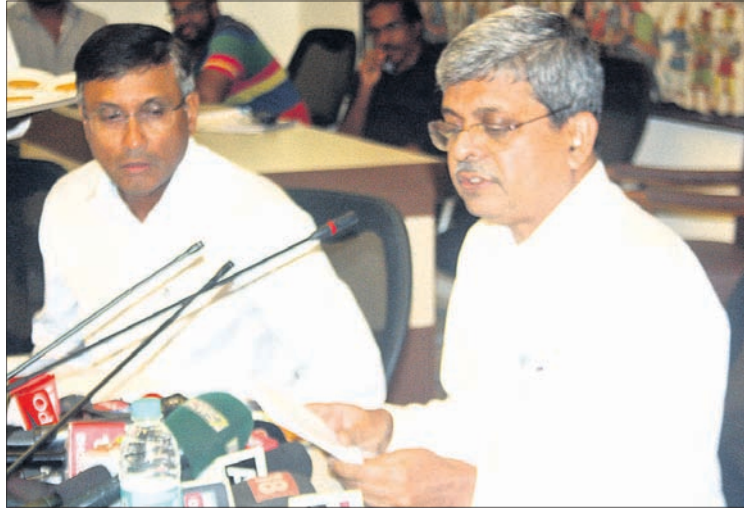
ମୁଖ୍ୟ ଶାସନ ସଚିବ ଆଦିତ୍ୟ ପ୍ରସାଦ ପାଢ଼ୀଙ୍କ ସହ ଭଲଭଲ କମିଶନର ଅଧିକ କୁମାର ତ୍ରିପାଠୀ।

ମୁଖ୍ୟମନ୍ତ୍ରୀ ନବୀନ ପଟ୍ଟନାୟକଙ୍କ ନେତୃତ୍ଵାଧୀନ ସରକାରଙ୍କ ଶେଷ କ୍ୟାବିନେଟ୍ ବୈଠକ ଶନିବାର ସଚିବାଳୟରେ ଅନୁଷ୍ଠିତ ହୋଇଛି। ସାମୁଦ୍ରିକ ଝଡ଼ ଫନୀ ଦ୍ଵାରା ପ୍ରଭାବିତ ପୁରୀ ଏବଂ ଅନ୍ୟାନ୍ୟ ଅଞ୍ଚଳ ପାଇଁ ବ୍ୟବସ୍ଥାର ସମୀକ୍ଷା ସହ ବିଭିନ୍ନ ନିୟମରେ କୋହଳ କରାଯାଇଛି।