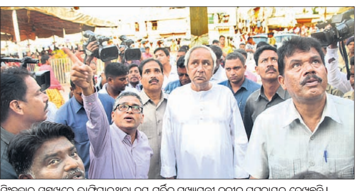
ସିଂହଦ୍ୱାର ସମ୍ମୁଖରେ ଭାଙ୍ଗିଯାଇଥିବା କଣ୍ଠ ମୂର୍ତ୍ତିକୁ ମୁଖ୍ୟମନ୍ତ୍ରୀ ନବୀନ ପଟ୍ଟନାୟକ ଦେଖିଛନ୍ତି ।