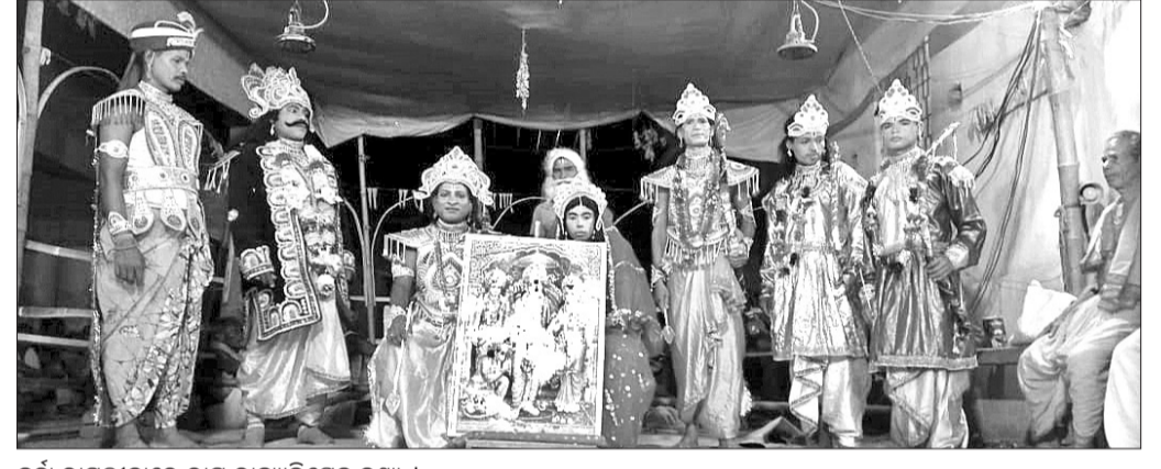
ଚୂର୍ଣ୍ଣା ରାମଲୀଳାରେ ରାମ ରାଜ୍ୟାଧିଷ୍ଠକ ଦୃଶ୍ୟ ।

ଉଲୁଣ୍ଡା, ୧୯୮୫(ଡି.ଏନ.ଏ.): ସୁବର୍ଣ୍ଣପୁର ଜିଲ୍ଲା ଉଲୁଣ୍ଡା ବ୍ଲକ୍‌ରେସମଲାର ପଞ୍ଚାୟତ ଅନ୍ତର୍ଗତ ଖୁଲୁଣ୍ଡାପାଲି ଗ୍ରାମରେ ଚାଲିଥିବା ଅଷ୍ଟପ୍ରହର ନାମଘଞ୍ଜ ଶନିବାର ପୂର୍ଣ୍ଣହୃଦ୍ ସହ ସମ୍ପନ୍ନ ହୋଇଛି ।