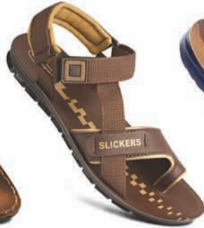
Model No.: 8603 MRP: ₹279.00