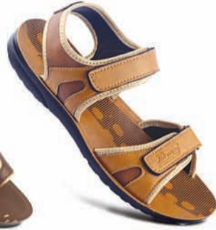
Model No.: 8885 MRP: ₹329.00