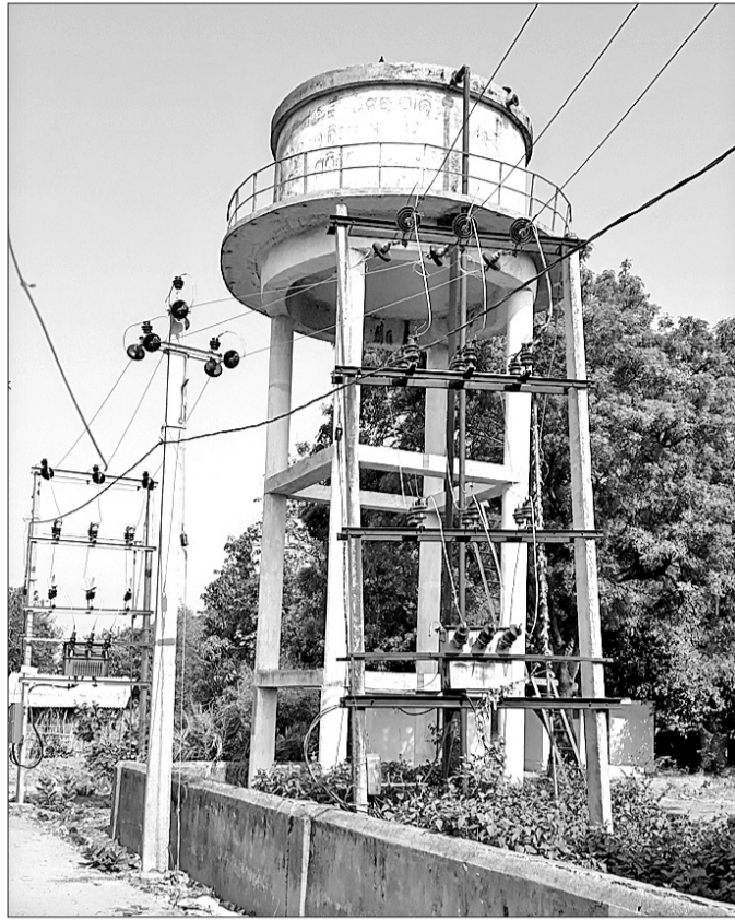
ଅଟଳ ଜଳଯୋଗାଣ ପ୍ରକଳ୍ପ ।

ଦୀର୍ଘ ୬ମାସରୁ ଅଧିକ ସମୟ ହେଲା ଜଳଯୋଗାଣ ପ୍ରକଳ୍ପ ଅଟଳ ହୋଇଥିବାରୁ ସୁବର୍ଣ୍ଣପୁର ଜିଲ୍ଲା ବାରମହାରାଜପୁର ବ୍ଲକ୍ ଅନ୍ତର୍ଗତ ଅମରପାଲି ଗ୍ରାମରେ ଦେଖାଦେଇଛି ଜଳ ସଂକଟ ।