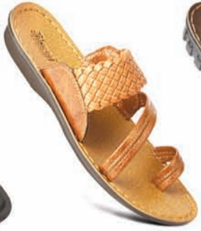
Model No.: 6821 MRP: ₹299.00