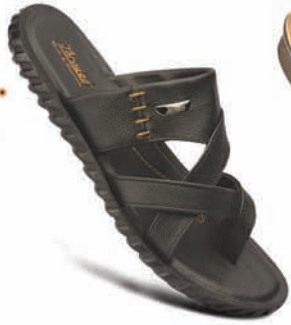
Model No.: 6901 MRP: ₹339.00