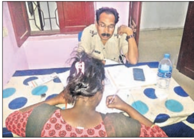
ଗୋବିନ୍ଦପୁର ଥାନାରେ ପୀଡ଼ିତା ଅଭିଯୋଗପତ୍ର ଲେଖୁଛନ୍ତି।