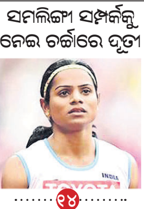
ସମଲିଙ୍ଗ ସମ୍ପର୍କକୁ ନେଇ ଚର୍ଚ୍ଚାରେ ପୁଣି

ଆମେରିକୀୟ ପେସାଦାର ବକ୍ସର ଡେଓଷ୍ଟେ ପ୍ରୀତ୍ୟୁକ୍ତ ପ୍ରୀଲି ବକ୍ସ କାଉନସିଲ (ଡକ୍ୟୁରିସି) ହେଭିଓଷ୍ଟେ ଟାଇଟଲ ବଜାୟ ରଖିଛନ୍ତି।