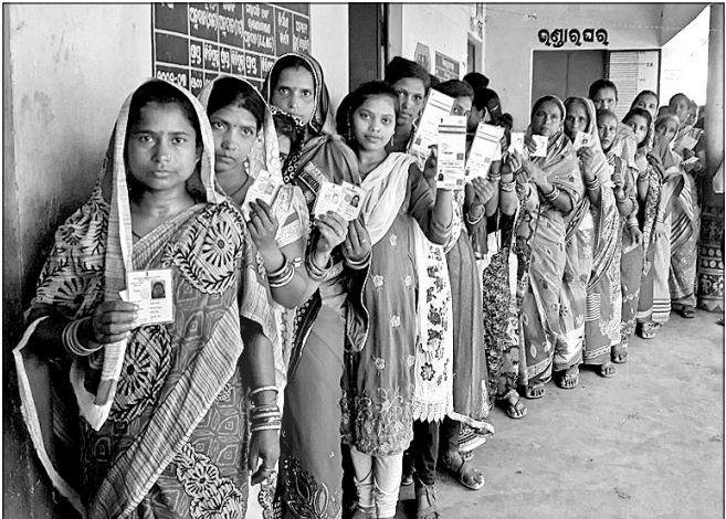
ମାହାଙ୍ଗାର ଏକ ବୁଥରେ ମତଦାନ କରିବାକୁ ଆସିଥିବା ମହିଳା ଓ ପୁରୁଷ ଭୋଟରମାନେ ଲମ୍ବାଧାଡ଼ିରେ ଛିଡା ହୋଇଛନ୍ତି ।

ଲଲିତଗିରିରେ ବୁଦ୍ଧ ଜୟନ୍ତୀ ଲଳିତଗିରି, ୧୯୮୫(ସ.ପ୍ର.): ମାହାଙ୍ଗା ବୁକ ଅଞ୍ଚଳର ଲଳିତଗିରିରେ ବିଭିନ୍ନ ଅନୁଷ୍ଠାନ ପକ୍ଷରୁ ବୁଦ୍ଧ ଜୟନ୍ତୀ ପାଳିତ ହୋଇଛି ।