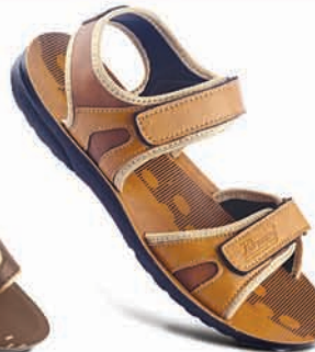
Model No.: 8885 MRP: ₹329.00