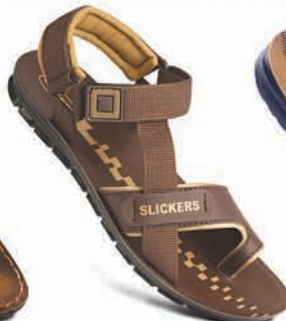
Model No.: 8603 MRP: ₹279.00