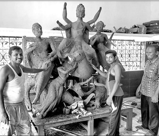
କାରିଗରମାନେ ମୂର୍ତ୍ତି ନିର୍ମାଣ କରୁଛନ୍ତି ।

ମୂର୍ତ୍ତି ନିର୍ମାଣରେ ଲାଗିପଡ଼ିଛନ୍ତି । ୨୬ରୁ ମଦନମୋହନଙ୍କ ନଗର ପରିକ୍ରମା ଆରମ୍ଭ ହୋଇ ୨୮ରେ ଚନ୍ଦନ ପୋଖରୀରେ ମାଛଭିକ୍ଷା ପର୍ବ ଅନୁଷ୍ଠିତ ହେବ ।