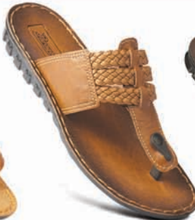
Model No.: 6200 MRP: ₹339.00