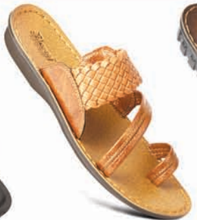
Model No.: 6821 MRP: ₹299.00