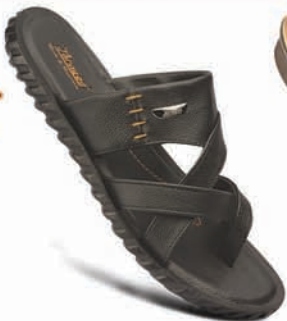
Model No.: 6901 MRP: ₹339.00