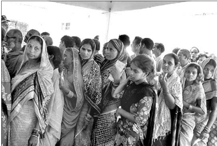
ଆଠଗଡ଼ର ଏକ ବୁଥରେ ମହିଳାମାନେ ଭୋଟଦେବାକୁ ଧାଡ଼ିବାହି ଛିଡା ହୋଇଛନ୍ତି ।