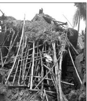
ବାତ୍ୟାରେ ଭାଙ୍ଗିଯାଇଥିବା ଘର । ପଡ଼ିଥିବାର ଅଭିଯୋଗ ଉଠିଲାଣି । ବିପନ୍ନମାନଙ୍କୁ ତଦନ୍ତ ରିପୋର୍ଟରେ ବ୍ୟକ୍ତ କରିଛନ୍ତି । ଆଉ ଆଇ ଠିକ୍ରେ ସର୍ତ୍ତ କରା ନ ଯିବାରୁ ବିପନ୍ନମାନେ ଅସହାୟତା ଦେଇଛନ୍ତି ।

ଖୋର୍ଦ୍ଧା ଜିଲ୍ଲା ବେଗୁନିଆ ବ୍ଲକ ବୋତଲପା, ହାରାପୁର, ହଳ, ସିକୋ, ଶରତଭଙ୍ଗା, ଗଡ଼ପାଣ୍ଡା, ଗୋବିନ୍ଦପୁର ଓ ଦେଉଳି ଆଦି ୮ଟି ପଞ୍ଚାୟତରେ ବାତ୍ୟା ଫନା ବ୍ୟାପକ କ୍ଷୟକ୍ଷତି କରିଥିଲା । ଏଠାରେ ବହୁ ଘର ଭାଙ୍ଗିଯିବାବେଳେ ଚାଳ, ଚାଉଳ ଓ ଆଜବେଷ୍ଟସ ଛପର ଉଡ଼ିଯାଇଛି । ସେହିପରି ବହୁକୁଳୁକାଳ ମୃତ୍ୟୁ ହୋଇଛି । ତେବେ ଘରଭଙ୍ଗା ସର୍ତ୍ତ ନେଇ ସ୍ଥାନୀୟ ଅଧିକାରୀଙ୍କ ବିପନ୍ନ ଅସହାୟତା ବ୍ୟକ୍ତ କରିଛନ୍ତି । ଆଉଆଇ ଠିକ୍ରେ ସର୍ତ୍ତ କରୁ ନ ଥିବାରୁ ବହୁ ବିପନ୍ନ ବାଦ୍