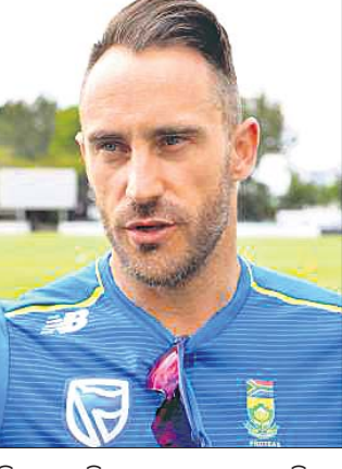
ବିଶ୍ୱକପ୍ଗୁଡ଼ିକରେ ଆୟୋଜନ ନିଜକୁ ଅନ୍ୟମାନଙ୍କଠାରୁ ସ୍ୱତନ୍ତ୍ର ମନେକରି ସୁପରମ୍ୟାନ ଭଳି କରି ଦେଖାଇବାକୁ ଚାହୁଁଥିଲୁ, ଯାହାର ପରିଣାମ ଆମକୁ ଭୋଗିବାକୁ ପଡ଼ିଥିଲା। କିନ୍ତୁ ଏଥର

ମେ ୩୦ ତାରିଖରୁ ଇଂଲଣ୍ଡରେ ଆରମ୍ଭ ହେବାକୁଥିବା ଆଇସିସି ବିଶ୍ୱକପ୍ରେ ସ୍ୱାଭାବିକ ଖେଳିବା ଲାଗି ଦଳର ଖେଳାଳିମାନଙ୍କୁ ପରାମର୍ଶ ଦେଇଛନ୍ତି ଦକ୍ଷିଣ ଆଫ୍ରିକା କ୍ରିକେଟ ଅଧିନାୟକ ଫାୟ୍ ଡୁ ପ୍ଲେସି। ପୂର୍ବ ବିଫଳତାକୁ ଭୁଲିଯିବାକୁ ହେବ। ସୁପରମ୍ୟାନ ଭଳି ଚମତ୍କାରିତା ଦେଖାଇବା ଚେଷ୍ଟାକୁ ବିରତ ରହିବା ଉଚିତ ବୋଲି ସେ କହିଛନ୍ତି। ଡୁପ୍ଲେସି ତାଙ୍କର ତୃତୀୟ ଆଇସିସି ଦିନିକିଆ ବିଶ୍ୱକପ୍ ଖେଳିବାକୁ ଯାଉଛନ୍ତି। ଦକ୍ଷିଣ ଆଫ୍ରିକା ଦଳ ଏପର୍ଯ୍ୟନ୍ତ ଥରେ ହେଲେ ବିଶ୍ୱକପ୍ ଫାଇନାଲରେ ପ୍ରବେଶ କରିପାରିନାହିଁ। ଦଳ ତାରିଖରେ ସେମିଫାଇନାଲ ପର୍ଯ୍ୟାୟରୁ ବିଦାୟ ନେଇଛି। ଡୁ ପ୍ଲେସି କହିଛନ୍ତି, ପୂର୍ବ