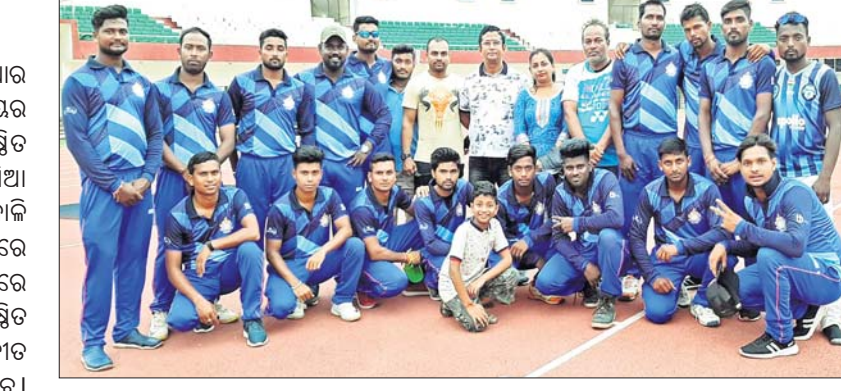
ଜାତୀୟ ସିନିୟର ଟେନିସ କ୍ରିକେଟ ପାଇଁ ମନୋନୀତ ଓଡ଼ିଶା ଦଳ ।