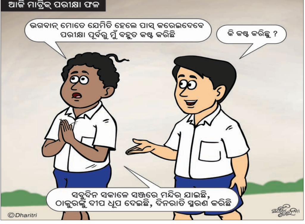
ଆଜି ମାତ୍ରିକ ପରୀକ୍ଷା ଫଳ

ଭବାନୀପାଟଣା, ୨୦୧୮(ବି.ଏନ.ଏ.): କଳାହାଣ୍ଡି ଜିଲ୍ଲା ଭବାନୀପାଟଣା ଅଞ୍ଚଳର ରାମପୁର ମୁଖ୍ୟ ରାସ୍ତା କର୍ମାଞ୍ଚିତ ଅଭିଯୋଗ ସଂଲଗ୍ନ ପେରୁମ୍ପାଣ୍ଡି ଛକ ନିକଟ ଏକ ଆୟତ ଗଠନ ଗତ ରବିବାର ରାତିରେ ୨ଟି ମାଓବାଦୀ ପୋଷ୍ଟର ଲଗାଯାଇଥିଲା । ଲୋକେ ଏହା ଦେଖି କର୍ମାଞ୍ଚିତ ଫାଣ୍ଡି ଅଧିକାରୀଙ୍କୁ ସୂଚନା ଦେଇଥିଲେ । ପୋଲିସ୍ ସେହି ପୋଷ୍ଟର କଟକ କରି ତଦନ୍ତ ଆରମ୍ଭ କରିଛି । ଏହି ପୋଷ୍ଟରରେ ସାମୁଦ୍ରିକ ବାତ୍ୟା ଫନା ପ୍ରାକୃତିକ ନୁହେଁ, ଏହା କୃତ୍ରିମ । ଏହି ବାତ୍ୟା ଓଡ଼ିଶାବାସୀଙ୍କ ପାଇଁ ମହାବିପତ୍ତି ଆଣି ଦେଇଛି । ବାତ୍ୟା ପାଇଁ ପ୍ରାକୃତିକ ସମ୍ପତ୍ତିକୁ ବ୍ୟବହାର କରିବାକୁ ଗୋଷ୍ଠୀ ଗଠନ କରିବାକୁ ପ୍ରୋତ୍ସାହିତ ଓ ତାଙ୍କୁ ନିରାପଣ ପ୍ରତିପାଳିତ ଦଲାଇ ନେତା ଦାୟା ବୋଲି ଉଲ୍ଲେଖ ରହିଛି । ବିକାଶ ନାଁରେ ଲୋକଙ୍କୁ ବିନାଶର ଭିତରକୁ ଠେଲି ଦିଆଯାଉଛି । ବିକାଶ ନାମରେ ଶାଣିତ ଦିନରେ ଏଭଳି ପୁଞ୍ଜିପତିକ ପ୍ରଭାବ ଯୋଗୁ ଅନେକ ସାମୁଦ୍ରିକ ବାତ୍ୟା ସୃଷ୍ଟି ହେବ । ଜନସାଧାରଣ ଏହାପ୍ରତି ସଚେତ ହେବେ । ତେଣୁ ତୁରନ୍ତ ସାଧାରଣ ଜନତା ପୁଞ୍ଜିପତିକ ଲୁଚେଇ ନାହିଁ । ବିରୋଧ କରିବା ସମୟ ଆସିଛି ବୋଲି ଉକ୍ତ ପୋଷ୍ଟରରେ ଉଲ୍ଲେଖ ରହିଛି । ଏହି ସାମୁଦ୍ରିକ ବାତ୍ୟା ଫନା ପାଇଁ ସରକାରଙ୍କୁ ଦାୟା କରାଯାଇଛି । ଏହି ବାତ୍ୟା ପ୍ରଭାବରେ ପ୍ରାଣ ହରାଇଥିବା ଅସହାୟଙ୍କ ପରିବାରକୁ କ୍ଷତିପୂରଣ ଦାବୀକୁ ୨୦ ଲକ୍ଷ ଟଙ୍କା ଓ ଘର ଭାଙ୍ଗିଦିଆଯିବ ନିରାଶ ଲୋକଙ୍କୁ ଘର ନିର୍ମାଣ ପାଇଁ ୨ ଲକ୍ଷ ୫୦ ହଜାର ଟଙ୍କା ଯୋଗାଣ ଦେବାକୁ ପୋଷ୍ଟରରେ ଦାବି କରାଯାଇଛି ।