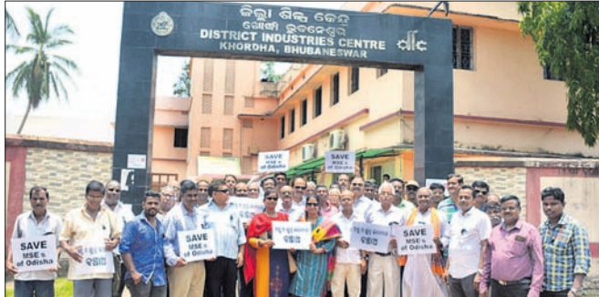
ଜଗତ୍‌ପୁରରେ ପାଣି ଓ ବିଦ୍ୟୁତ୍ ସମସ୍ୟାକୁ ନେଇ ଏମ୍‌ଏସ୍‌ଏମ୍‌ଜି ବିଭାଗ ସଚିବଙ୍କ ସହ ଆଲୋଚନା ବେଳେ ଶିଳ୍ପୋଦ୍ୟୋଗୀଙ୍କୁ ପୋଲିସ୍ ମାଡ଼ ପ୍ରତିବାଦରେ ସାମାଜିକ କର୍ମୀଙ୍କୁ ଭେଟିବା ପାଇଁ ଉଦ୍ଦେଶ୍ୟରେ ଡିଆଇସି ଅଫିସ୍ ସମ୍ମୁଖରେ ଶିଳ୍ପୋଦ୍ୟୋଗୀଙ୍କ ବିଶୋଭା ।

କରୁଥିବା ଅଧିକାରୀ ଆର୍ଡିଏଫ୍ କାର୍ଡର ଫଟୋ ଏବଂ ପରୀକ୍ଷାର୍ଥୀଙ୍କୁ ଦେଖିବା ପରେ ତାଙ୍କ ମନରେ ସନ୍ଦେହ କାତ ହୋଇଥିଲା । ଏ ନେଇ ସେ ଇନ୍‌ଜିନିୟରିଂ ଏବଂ ଖଣ୍ଡଗିରି ପୋଲିସ୍‌କୁ ଜଣାଇଥିଲେ । ପୋଲିସ୍ ପହଞ୍ଚି ଖୋଜିତାଡ଼ କରିବାକୁ ସମ୍ମତ ହୋଇଥିଲା । ଫଳରେ ଆଦର୍ଶଙ୍କୁ ପୋଲିସ୍ ଗିରଫ କରିଥିଲା । ଏହାପରେ ତନାଘନା କରି ବିଭିନ୍ନ ସ୍ତରରେ ପରୀକ୍ଷା ଦେଉଥିବା ଆଉ ଶିକ୍ଷକଙ୍କୁ ଧରିଥିଲା ପୋଲିସ୍ । ଏ ନେଇ ଘାଟିକିଆ ଅଞ୍ଚଳରେ ଥିବା ଏକ ଗୋଷ୍ଠି ହାଉସରେ ପୋଲିସ୍ ଚଢ଼ାଉ କରି ସର୍ବଶେଷ ତଥ୍ୟ ହାସଲ କରିବା ସହ ଏହି ଗ୍ୟାଙ୍ଗରେ ସମ୍ପୃକ୍ତ ଅନ୍ୟ ସଦସ୍ୟମାନଙ୍କୁ ଧରିବା ପାଇଁ ଉଦ୍ୟମ ଜାରି ରଖିଛି ।