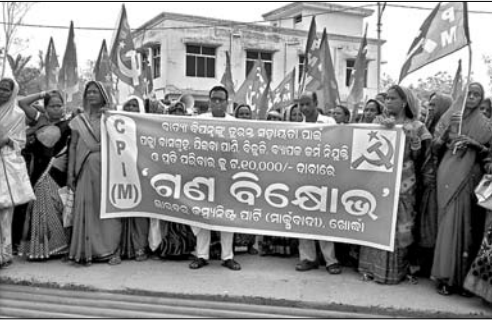
ସିପିଆଇ (ଏମ) ପକ୍ଷରୁ ଗଣବିକ୍ଷୋଭ ।