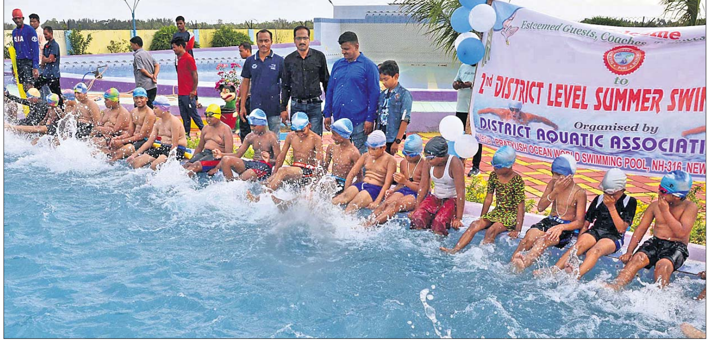
ପୁରୀର ଓଡ଼ିଶା ପାର୍କରେ ଅନୁଷ୍ଠିତ ଗ୍ରୀଷ୍ମକାଳୀନ ସରଗଣ ଶିବିରରେ ପିଲାମାନଙ୍କୁ ପ୍ରଶିକ୍ଷଣ ଦିଆଯାଉଛି ।

ଆମକୁ ଭିନ୍ନ ନୀତି ଆପଣେଇବାକୁ ପଡ଼ିବ। ଦଳର ଆବଶ୍ୟକତାକୁ ନେଇ ପ୍ରତ୍ୟେକଙ୍କୁ ବ୍ୟକ୍ତିଗତ ଭାବେ ଶ୍ରେଷ୍ଠ ପ୍ରଦର୍ଶନ କରିବାକୁ ହେବ। ମୋ ନିକଟରେ ଥିବା ଅଭିଜ୍ଞତା ଖେଳାଳିମାନଙ୍କ ଉପରୁ ଚାପ ହଟାଇବା କ୍ଷେତ୍ରରେ ସହାୟକ ହେବ ବୋଲି ୩୪ ବର୍ଷୀୟ ଡୁ ପ୍ଲେସି କହିଛନ୍ତି। ସୁପରମ୍ୟାନ, ଡୁ ପ୍ଲେସିଙ୍କ ସମେତ ଦକ୍ଷିଣ ଆଫ୍ରିକା ଦଳର ୭ ଜଣ ଖେଳାଳି ୨୦୧୫ ବିଶ୍ୱକପ୍ ଖେଳିଛନ୍ତି। ଏହି ସଂସ୍କରଣରେ ଦକ୍ଷିଣ ଆଫ୍ରିକା ରନସିଏସ୍ ହୋଇଥିବା ନ୍ୟୁଜିଲାଣ୍ଡଠାରୁ ସେମିଫାଇନାଲରେ ପରାଜିତ ହୋଇଥିଲା। ଲକ୍ଷ୍ନର କେନିଙ୍ଗଟନ ଓଭାଲଠାରେ ମେ ୩୦ତାରିଖରେ ବିଶ୍ୱକପ୍ର ଉଦ୍ଘାଟନା ମ୍ୟାଚରେ ଦକ୍ଷିଣ ଆଫ୍ରିକା ଆୟୋଜକ ଇଂଲଣ୍ଡ ସହ ମୁକାବିଲା କରିବ।