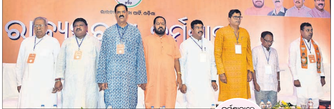
କର୍ମଶାଳାରେ ଯୋଗଦେଉଥିବା ଭାଜପା ନେତା ଓ ପ୍ରାର୍ଥୀମାନେ ।

ଭୁବନେଶ୍ୱର, ୨୦୧୮(ବୁଧବେ) ରାଜ୍ୟର ସମସ୍ତ ଲୋକ ସଭା ଏବଂ ବିଧାନସଭା ଭାଜପା ପ୍ରାର୍ଥୀମାନଙ୍କୁ ନେଇ ଘାମନା ଏକ ହୋଟେଲରେ ରାଜ୍ୟସ୍ତରୀୟ କର୍ମଶାଳା ଆୟୋଜିତ ହୋଇଛି । ଏହି କର୍ମଶାଳାରେ ନିର୍ବାଚନ ଗଣତି ପଦ୍ଧତିର ବୈଷୟିକ ଦିଗ ଉପରେ ଆଲୋଚନା ହୋଇଛି । ବୁଲ୍ କେନ୍ଦ୍ରମନ୍ତ୍ରୀ କୁଏଲ ଓରାମ ଓ ଧର୍ମେନ୍ଦ୍ର ପ୍ରଧାନଙ୍କ ସହ ଦଳର ରାଜ୍ୟ