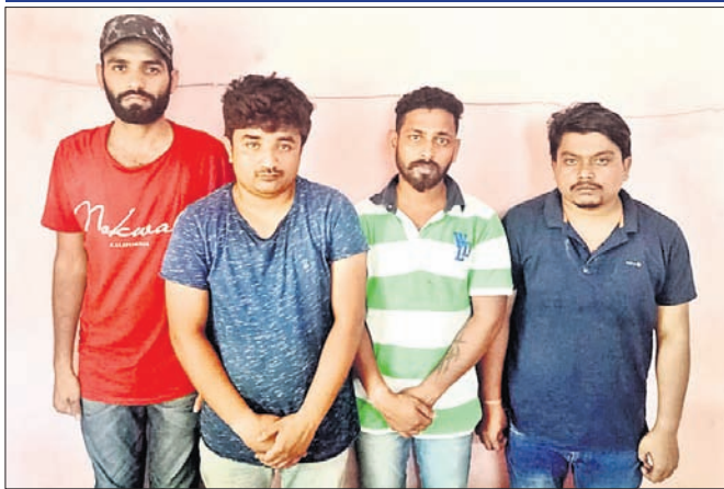
ଗିରଫ ୪ ଅଭିଯୁକ୍ତ ।

ପରୀକ୍ଷା ଅନୁଷ୍ଠିତ ହୋଇଥିଲା । ଗିରଫ ଅଭିଯୁକ୍ତ ଆଦର୍ଶ ପୁରୀ ଗୋପ ଅଞ୍ଚଳର ମୁଖ୍ୟ ଶିକ୍ଷକ ନାମରେ ପରୀକ୍ଷା ଦେଉଥିଲେ । ପରୀକ୍ଷା ପରିଚାଳନା