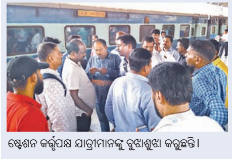
ଷ୍ଟେଶନ କର୍ତ୍ତୃପକ୍ଷ ଯାତ୍ରୀମାନଙ୍କୁ ବୁଝାଶୁଣା କରୁଛନ୍ତି।