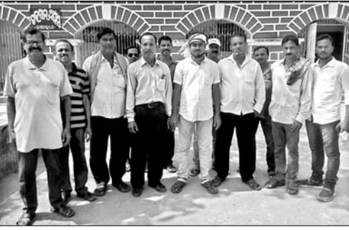
ତହସିଲ ଅଫିସକୁ ଘେରାଇ କରିଛନ୍ତି ପାନବରଜ ଗ୍ରାମବାସୀ ।

ବାତ୍ୟା ଫନାର ୧୮ ଦିନ ପରେ ବିପନ୍ନମାନଙ୍କର ସ୍ଥିତି ସୁଧୁରିଲା । କେଉଁଠି ରିଲିଫ୍ ଦେବାରେ ଅଣଦେଖା କରାଯାଇଛି ତ ଆଉ କେଉଁଠି ସର୍ବେ ରିପୋର୍ଟରେ ବିପନ୍ନଙ୍କ ନାଁ ରହିନା । ବିପନ୍ନମାନଙ୍କୁ ଅଣଦେଖା ନ କରିବାକୁ ଜିଲ୍ଲାପାଳ ନିର୍ଦ୍ଦେଶ ରହିଥିଲେ ମଧ୍ୟ ତଦନ୍ତକାରୀ ଅଧିକାରୀ ବା କର୍ମଚାରୀ କିଛି ନିର୍ଦ୍ଦେଶ ମାନ୍ୟନାହାନ୍ତି । ଏଭଳିସ୍ଥିତି ବିପନ୍ନମାନେ ନିଜର ହକ ପାଇଁ ରାଜରାସ୍ତ୍ରକୁ ଓହ୍ଲାଇ ଆନ୍ଦୋଳନାତ୍ମକ ପକ୍ଷ ଆପଣେଇବାକୁ ବାଧ୍ୟ ହୋଇଛନ୍ତି । ପ୍ରତ୍ୟହ ଜିଲ୍ଲାର ବିଭିନ୍ନସ୍ଥାନରେ ଆନ୍ଦୋଳନ ଚାଲିଛି । ସୋମବାର ଜିଲ୍ଲା ସଦର ମହକୁମାରେ ଜିଲ୍ଲାପାଳଙ୍କ କାର୍ଯ୍ୟାଳୟ ସମ୍ମୁଖରେ ସିପିଆଇ(ଏମ) ନେତୃତ୍ୱରେ ବାତ୍ୟା ବିପନ୍ନମାନେ ଗଣ ବିକ୍ଷୋଭ କରିଥିଲେ । ସେହିଭଳି ପାନବରଜ ଗାଁର ବିପନ୍ନମାନେ ଅନୁରୂପ ଭାବେ ଖୋର୍ଦ୍ଧା ତହସିଲ କାର୍ଯ୍ୟାଳୟ ସମ୍ମୁଖରେ ଧାରଣା ଦେଇଥିଲେ । ସିପିଆଇ(ଏମ) ନେତୃତ୍ୱରେ ବିପନ୍ନମାନେ ନୂଆ ବସ୍ତ୍ରାଞ୍ଚଳଠାରୁ ଶୋଭାଯାତ୍ରାରେ ବାହାରି ସହର ପରିକ୍ରମା କରି ଜିଲ୍ଲାପାଳଙ୍କ କାର୍ଯ୍ୟାଳୟଠାରେ