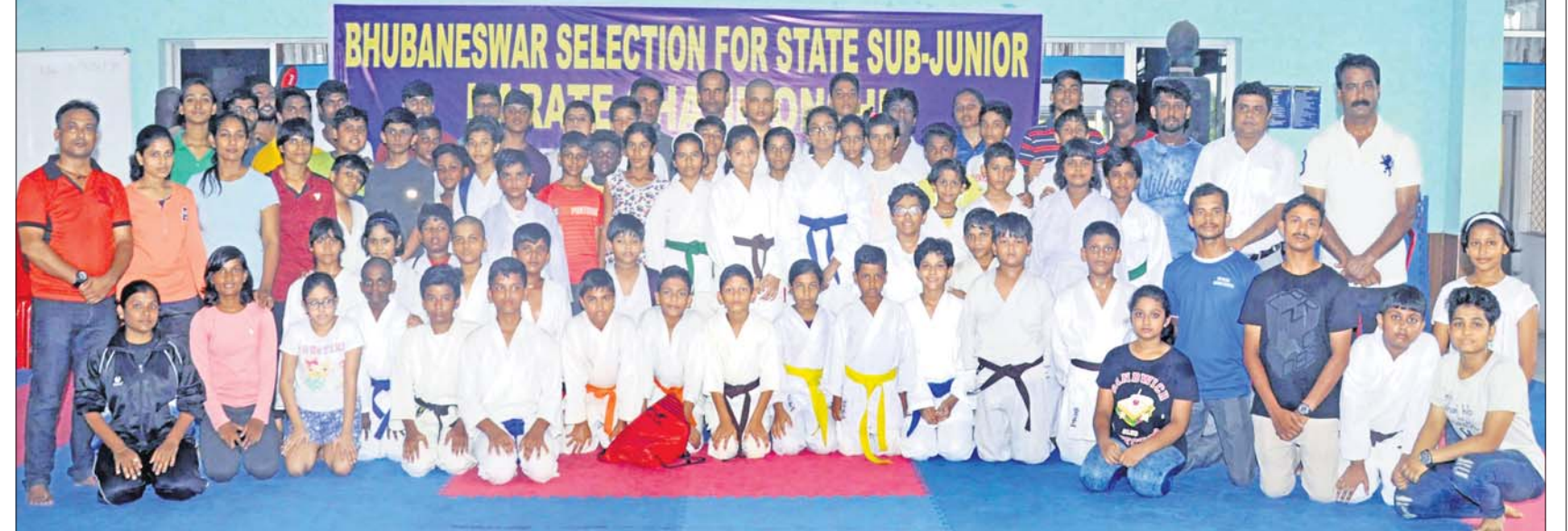
ରାଜ୍ୟ ସବ୍‌ଜୁନିୟର କରାଟେ ଚାମ୍ପିୟନଶିପ୍ ପାଇଁ ଭୁବନେଶ୍ୱର ଦଳ ମନୋନୟନ ଶିବିରରେ ଭାଗ ନେଇଥିବା କରାଟେକାମାନେ କୋଚ୍ ଓ କର୍ମକର୍ମୀଙ୍କ ସହ ।