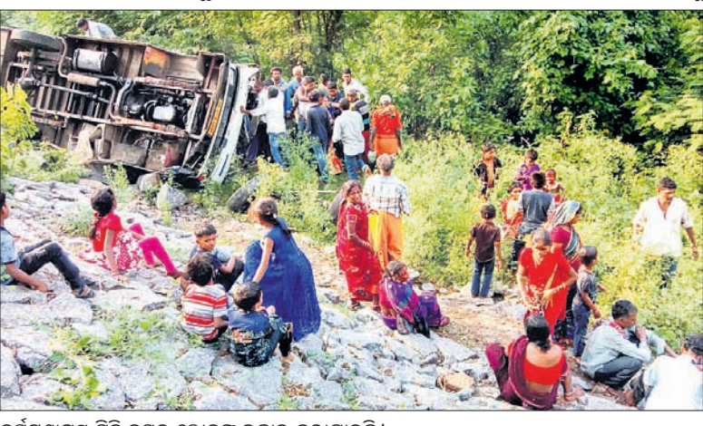
ଦୁର୍ଘଟଣାଗ୍ରସ୍ତ ମିନି ବସକୁ ଲୋକଙ୍କୁ ଉଦ୍ଧାର କରାଯାଇଛି ।