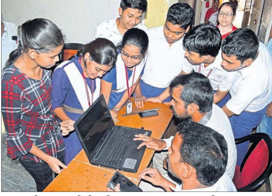
ଭୁବନେଶ୍ଵର ମୁନି-୩ ସରକାରୀ ଶିଶୁ ବିଦ୍ୟାଳୟରେ ଛାତ୍ରଛାତ୍ରୀମାନେ ପରୀକ୍ଷା କେନ୍ଦ୍ରରେ।

କଟକ ଅଧିକାରୀ, ୨୧୫୫ ମାଧ୍ୟମିକ ଶିକ୍ଷା ପରିଷଦ(ବୋର୍ଡ) ଦ୍ଵାରା ପରିଚାଳିତ ୨୦୧୯ ମାଟ୍ରିକ ପରୀକ୍ଷା ଫଳାଫଳ ପ୍ରକାଶ ପାଇଛି। ଏଥର ମୋଟ ପାସ୍ ହାର (ଉତ୍ତୀର୍ଣ୍ଣ ହେଉଥିବା ଓ ଏକ୍ସରେଗୁଲାର) ରହିଛି ୭୦.୬୮ ପ୍ରତିଶତ, ଯାହା ୨୦୧୮ର ପାସ୍ ହାରଠାରୁ ୫.୪୫ ପ୍ରତିଶତ କମ୍। ଗତବର୍ଷ ମାଟ୍ରିକ ପରୀକ୍ଷାରେ ପାସ୍ ହାର ଥିଲା ୭୬.୨୩ ପ୍ରତିଶତ। ଅନ୍ୟପକ୍ଷରେ ଏଥର ଗୋଟିଏ ବିଦ୍ୟାଳୟର