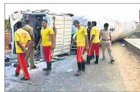
ଓଲଟି ପଡ଼ିଥିବା ଟ୍ୟାଙ୍କରକୁ ଅଗ୍ନିଶମ କର୍ମଚାରୀ ରାସ୍ତାକୁ ହଟାଇବାକୁ ଉଦ୍ୟମ କରୁଛନ୍ତି ।

ଗ୍ୟାସ୍ ଲିକ୍ ଭଳି ଦୁର୍ଘଟଣା ଘଟି ନାହିଁ । ପାରାଦୀପକୁ ରାମନଗ୍ୟାସ୍ ବୋଝେଇ କରି ଏହି ଟ୍ୟାଙ୍କର ନେପାଳ ଯାଉଥିବା ବେଳେ ଚିଲିକାପୁର ଛକ ଭାଇଭଉଣୀ ନିକଟରେ ଭାରସାମ୍ୟ ହରାଇ ଓଲଟି ପଡ଼ିଥିଲା । ଭଣ୍ଡାରିପୋଖରୀ ଅଗ୍ନିଶମ କର୍ମଚାରୀ ସେଠାରେ ପହଞ୍ଚି ଆହତ ଭ୍ରାତୃଭାଇଙ୍କୁ ଜିଲ୍ଲା ଚିକିତ୍ସାଳୟକୁ ପଠାଇଥିଲେ । ଏହି ଦୁର୍ଘଟଣା ନେଇ ରାସ୍ତାରେ ଗାଡ଼ି ଚଳାଚଳ କିଛି ସମୟ ବ୍ୟାହତ ହୋଇଥିଲା ।