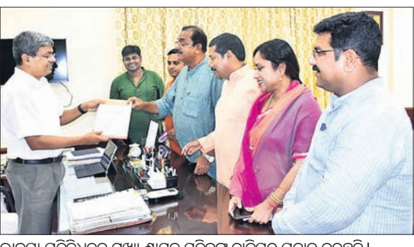
ଭାଜପା ପ୍ରତିନିଧିତ୍ୱକ ମୁଖ୍ୟ ଶାସନ ସଚିବଙ୍କୁ ବାବିପତ୍ର ପ୍ରଦାନ କରୁଛନ୍ତି ।

ଭୁବନେଶ୍ୱର, ୨୧.୫.୧୯(ବୁଧବାର) ଦୁଇଦିନ ତଳେ ରାଜ୍ୟ କ୍ୟାବିନେଟରେ ପୂର୍ବ ବିଭାଗରେ ବିନା ଚେଷ୍ଟାରେ ୫ ଲକ୍ଷ ଚଳା ନାମ ପାଇଁ କାର୍ଯ୍ୟାଦେଶ ଦିଆଯାଇ ପାରିବ ବୋଲି ନିଷ୍ପତ୍ତି ହୋଇଛି । ଏହାସହ ବାଚ୍ୟା 'ଫନା'ର ପୁନଃ ଉଦ୍ଧାର ପାଇଁ ହୋଇଥିବା ୨୦ଲକ୍ଷ ଚଳା କାର୍ଯ୍ୟ ଅଟକଳକୁ ବିଭାଜନ କରି ବିନା ଚେଷ୍ଟାରେ ଦିଆଯାଇ ପାରିବ ବୋଲି ସରକାର ନେଇଥିବା ନିଷ୍ପତ୍ତି ଦୁର୍ଭାଗ୍ୟଜନକ ବୋଲି ଭାଜପା ଅଭିଯୋଗ କରିଛି । ଭୁଷ୍ମିଚାରରେ ଲିପ୍ତ କେତେଜଣ ମୁଣ୍ଡିମେୟ ଅଧିକାରୀ ପିସି କାରବାର କରି ବିଜେଡି ନେତାଙ୍କୁ ମାଲାମାଲ କରିବା ଯୋଜନା କରି ଏଭଳି କରିଛନ୍ତି । ବାଚ୍ୟା ମୁକାବିଲା ପାଇଁ ଓ କ୍ଷତିଗ୍ରସ୍ତ ପରିବାରକୁ ଥଇଥାନ କରିବା ଲାଗି ପ୍ରଧାନମନ୍ତ୍ରୀ ନରେନ୍ଦ୍ର ମୋଦି ୧୩୪୧ କୋଟି ଚଳା ଦେଇଥିଲେ । ଏହାକୁ ଲୁଚିବା ପାଇଁ ଶାସକ ଦଳର କେତେଜଣ ନେତା ଅଣଓଡ଼ିଆ ଅଧିକାରୀମାନଙ୍କ ସହ ହାତ ମିଳାଇ ସଡ଼ଯନ୍ତ୍ର କରିଛନ୍ତି ବୋଲି ଭାଜପା ପକ୍ଷରୁ ଅଭିଯୋଗ କରାଯାଇଛି ।