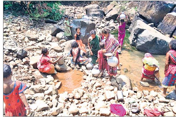
ଗ୍ରାମର ମହଲମାନେ ଝରଣାରୁ ପାଣି ସଂଗ୍ରହ କରୁଛନ୍ତି।