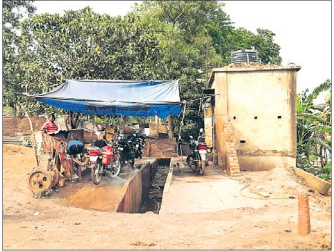
ନଦୀ କୂଳରେ ଥିବା ସର୍ଭିସିଂ ସେଣ୍ଟର।

କେନ୍ଦୁଝର ଜିଲ୍ଲା ଯୋଡ଼ା ସହରରେ ଏକ ବେଆଇନ ସର୍ଭିସିଂ ସେଣ୍ଟର କରି ଲକ୍ଷ ଲକ୍ଷ ଲିଟର ପାଣି ବ୍ୟବହାର କରିବା ସହିତ ସୁନାମଦୀର ଜଳ ପ୍ରଦୃଷ୍ଟିତ କରୁଥିବା ଅଭିଯୋଗ ହୋଇଛି।