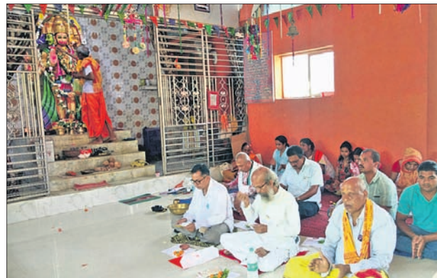
ନାକଗିରି ବିଧାୟକ ଇ. ପୁକାଡ଼ କୁମାର ନାୟକ ଓ ବାଲେଶ୍ୱର ଏମ୍ପି ପ୍ରତାପ ଚନ୍ଦ୍ର ଷଡ଼ଙ୍ଗୀ ଏବଂ ଅନ୍ୟମାନଙ୍କ ସହ ହନୁମାନ ମନ୍ଦିରରେ ପୂଜାର୍ଚ୍ଚନା କରୁଛନ୍ତି ।