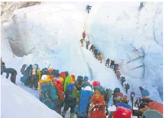
ବର୍ତ୍ତମାନ ସିଜନରେ ମାଛ ଏକତ୍ତେଷ୍ଟରେ ବି ପ୍ରାପ୍ତି ହୋଇଛି। ମେ ୨୩ ତାରିଖରେ ପର୍ବତାରୋହୀମାନଙ୍କ ଲକ୍ଷ୍ୟ ଧାଡ଼ିର ଦୃଶ୍ୟ, ଯେଉଁଠି ନ କଳ୍ପନା ଦାଖଲକର ମୃତ୍ୟୁ ଘଟିଥିଲା।