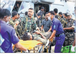
ରାଞ୍ଚି, ୨୮/୫ (ପି.ଟି.)

ଝାଡ଼ଖଣ୍ଡର ସଡ଼େଇକଳା-ଖରସୁଆଁ ଜିଲ୍ଲାରେ ନିହାଳିଆରେ ମଙ୍ଗଳବାର ସକାଳେ ଆଇଡି ବିସ୍ଫୋରଣ କରିବା ଫଳରେ ସେଇକାଟ ଦେଇ ଯାଉଥିବା ଯବାନମାନେ ଗୁରୁତର ହୋଇଛନ୍ତି। ସିଆରସିଏଫର ସ୍ୱତନ୍ତ୍ର ଜଙ୍ଗଲ ଓପରେୟାର୍ ମୁନିର୍ ସହ କୋଡ୍ରା ଓ ରାଜ୍ୟ ପୋଲିସ ବାହିନୀର କୁଚାଇ ଜଙ୍ଗଲାଞ୍ଚଳରେ ମିଳିତ କମିଟି ଅପରେଶନ ଚାଲିଥିବାବେଳେ ଏହି ବିସ୍ଫୋରଣ ହୋଇଥିଲା। ଏହାକୁ ନିବୃତ୍ତମାନେ ଅଭିଆ ଗବାରେ ଲୁଚାଇ ବିସ୍ଫୋରଣ କରିଥିବା କୁହାଯାଇଛି। ଆହତ ୧୧ ଯବାନଙ୍କ ମଧ୍ୟରେ ୮ଜଣ କୋଡ୍ରା ବାହିନୀର ହୋଇଥିବାବେଳେ ଅନ୍ୟମାନେ ରାଜ୍ୟ ପୋଲିସର ବୋଲି ଜଣାପଡ଼ିଛି। ଗୁରୁତର ଅବସ୍ଥାରେ ସେମାନଙ୍କୁ ହେଲିକପ୍ଟର ଯୋଗେ ରାଜଧାନୀ ରାଞ୍ଚିକୁ ଅଣାଯାଇ ଚିକିତ୍ସା କରାଯାଇଛି।