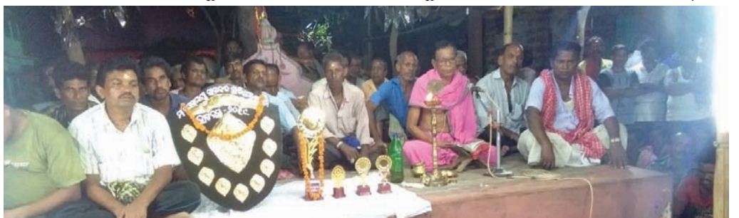
ପ୍ରତିଯୋଗିତା ସ୍ଥଳରେ ଯୋଗଦେଇଥିବା ଶ୍ରୀବାହୁ।

ଚନ୍ଦନ ପୋଖରୀ ପୂଜା ଭୋଗ ଲାଗି କରାଯାଇଥିଲା। ନଗର ପରକ୍ରମା ପରେ ଶ୍ରୀଜୀଉମାନେ ମନ୍ଦିରକୁ ପ୍ରତ୍ୟାବର୍ତ୍ତନ କରିଥିଲେ। ଶ୍ରୀଜୀଉମାନେ ଗାପଖେଳ ନିମନ୍ତେ ଚନ୍ଦନ ପୋଖରୀ ମଧ୍ୟରେ ରହିଥିବାରୁ ପରମ୍ପରା ଅନୁଯାୟୀ ସୋମବାର ଅହୋରାତ୍ର ମନ୍ଦିର ଖୋଲା ରହିଥିଲା। ମଧ୍ୟାହ୍ନ ପୂର୍ବରୁ ଶ୍ରୀଜୀଉମାନେ ମନ୍ଦିର ପ୍ରବେଶ କରିବା ଅବସରରେ ନାଟ୍ୟ ମଞ୍ଚପରେ ଜଗତୀ, ପୂଜକ ପରିଷଦ ସମସ୍ତ ତଥା ଛତିଶାଣି ନିୟୋଗ ସମସ୍ତ କାର୍ଯ୍ୟକ୍ରମ ସୁଚାରୁ ରୂପେ ପରିଚାଳନା କରିଥିଲେ। ସେହିପରି ମଙ୍ଗଳବାରଠାରୁ ବେଦସ୍ନାନ ପୂର୍ଣ୍ଣମା ପର୍ଯ୍ୟନ୍ତ ମନ୍ଦିରରେ ଭିତର ଚନ୍ଦନଯାତ୍ରା ପାଳନ କରାଯିବ।