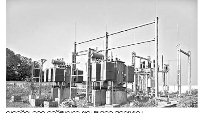
ରାଜକନିକା ବ୍ଲକ ନିର୍ଦ୍ଦଳିଆଠାରେ ଥିବା ଆୟତନ ସର୍ବ୍ୱେକ୍ଷଣ । ଛିଣ୍ଡି ପଡୁଛି ତ ଆଉ କେବେ ବିଦ୍ୟୁତ୍ ପ୍ରଦାନ ନହେବ ବାକି ବିଦ୍ୟୁତ୍ ଯୋଗାଣ ବ୍ୟାହତ ହେଉଛି । କୋଟି କୋଟି ଟଙ୍କା ବ୍ୟୟରେ ନିର୍ମାଣ ହୋଇଥିବା ବିଦ୍ୟୁତ୍ ସର୍ବ୍ୱେକ୍ଷଣ କାର୍ଯ୍ୟକ୍ଷମ କରାଯାଇ

ଭାବେ ବିଦ୍ୟୁତ୍ ଯୋଗାଇ ଦିଆଯାଉଛି । ଏହି ଘଟଣାର ପ୍ରତିବାଦ କରି ଗିରିଆ ପିନ୍ଧର ଅନ୍ତର୍ଗତ ଶତାଧିକ ଉପଭୋକ୍ତା ନିକଟରେ କେନ୍ଦ୍ରାପଡା ଜିଲ୍ଲାପାଳଙ୍କୁ ଲିଖିତ ଭାବେ ଜଣାଇଛନ୍ତି । ରାଜକନିକା ବ୍ଲକ ନିର୍ଦ୍ଦଳିଆଠାରେ ଗତ ତିନି ବର୍ଷ ଧରି ଆୟତନ ସର୍ବ୍ୱେକ୍ଷଣ କାର୍ଯ୍ୟ ଶେଷ ହୋଇଥିଲେ ମଧ୍ୟ ବିଭାଗୀୟ ଅଧିକାରୀମାନଙ୍କ ଅବହେଳାରୁ ତାହା କାର୍ଯ୍ୟକ୍ଷମ ହୋଇ ପାରୁନାହିଁ । ଆକାଶରେ ମେଘ ଉଠାଇ ସାମାନ୍ୟ ପବନ ହେଲେ ଏହି ବ୍ଲକରେ ବିଦ୍ୟୁତ୍ ସେବା ବନ୍ଦ ହୋଇଯାଏ । ଏପରି କି ଦୀର୍ଘ ୩୫ ବର୍ଷ ତଳେ ରାଜକନିକା ଅଞ୍ଚଳରେ ପୋଡା ଯାଇଥିବା ବିଦ୍ୟୁତ୍ ଖୁଣ୍ଟ, ତାର ଓ ପ୍ରାନ୍ତଦର୍ଶୀକୁ ବଦଳାଇବାକୁ ନାହିଁ । କେତେ ବେଳେ ତାର