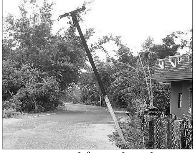
ଉତ୍ତର-ବେତନଟା ରାସ୍ତାର ବଡ଼ସାହି ଗାଁ ପୁଣ୍ଡରେ ଥିବା ବିପଦସଙ୍କୁଳ ବିଦ୍ୟୁତ୍ ଖୁଣ୍ଟ ।

ରାସ୍ତା ଉପରକୁ ନଇଁ ରହିଛି। ଫଳରେ ଚାରିଦିଗରୁ ଯାନ ଗୁଡ଼ିକ ରାସ୍ତା ତଳକୁ ଓହ୍ଲାଇ ଯିବା ଆସିବା କରୁଛନ୍ତି। ପ୍ରତ୍ୟହ ଏହି ରାସ୍ତାରେ ଶହ ଶହ ଗାଡ଼ି, ମୋଟର ସାଇକେଲ ଓ ଛାତ୍ରଛାତ୍ରୀମାନେ ଚଳୁଥିବା କରୁଛନ୍ତି। ସାମାନ୍ୟ ଅପାଦାନତା ହେବା ଲାଗି ପଦକ୍ଷେପ ନେଇ ନ ଥିବାରୁ ନିଶ୍ଚିତ ଭାବେ ଏହି ଖୁଣ୍ଟରେ ବାଡେଇ ହେବା ନିଶ୍ଚିତ। ବିଦ୍ୟୁତ୍ ବିଭାଗ ଏଥିପ୍ରତି ଦୃଷ୍ଟି ଦେଇ ନ ଥିବାରୁ ସାଧାରଣରେ ଅସନ୍ତୋଷ ଦେଖାଦେଇଛି। କୌଣସି ଅଘଟଣ ଘଟିବା ପୂର୍ବରୁ ଖୁଣ୍ଟକୁ ଅପସାରଣ କରିବା ପାଇଁ ଅଞ୍ଚଳବାସୀ ଦାବି କରିଛନ୍ତି।