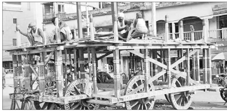
କାଠ ଅଭାବରୁ ରଥ ନିର୍ମାଣ ଅଧାରେ ଅଟକିଛି ।