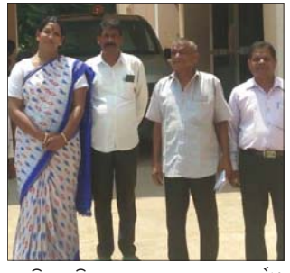
ଏସ୍‌ପିଙ୍କ ଅଫିସ ଆଗରେ ମାନବାଧିକାର କର୍ମୀ।

କରାଯାଇଥିଲା। ପୋଲିସ୍ ୧୮ ଜଣଙ୍କ ନାମରେ ମାମଲା (ନଂ.୬୨/୧୯) ରୁଜୁ କରିଥିଲା। ଏହାପରେ ମାସେ ବିତିଯାଇଥିଲେ ମଧ୍ୟ ପୋଲିସ୍ କାହାରିକୁ ରିଚର୍ଫ କରିନାହିଁ। କନକଲତାଙ୍କ ପରିବାର ପକ୍ଷରୁ ବହୁତାଳ ଥାନାରେ ଘଟଣାର ତଦନ୍ତ ସହ ଅଭିଯୁକ୍ତମାନଙ୍କୁ ରିଚର୍ଫ କରିବାକୁ ଦାବି କରାଯାଇଥିଲେ ହେଁ କୌଣସି କାର୍ଯ୍ୟାନୁଷ୍ଠାନ ନିଆଯାଇ ନାହିଁ। ଗୁରୁବାର ଭୁବନେଶ୍ୱର ରାଷ୍ଟ୍ରୀୟ ମାନବାଧିକାରର ଏକ ୪ ଜଣିଆ ଟିମ୍ ଭଦ୍ରକ ଗସ୍ତରେ ଆସି ଏସ୍‌ପିଙ୍କୁ ଭେଟି ଏହି ଘଟଣାରେ ତୁରନ୍ତ କାର୍ଯ୍ୟାନୁଷ୍ଠାନ ନେବା ପାଇଁ ଦାବି କରିଛନ୍ତି। ଏସ୍‌ପି ରାଜ୍ୟେକ୍ଷ ପଞ୍ଚିତ ଆବଶ୍ୟକ ପଦକ୍ଷେପ