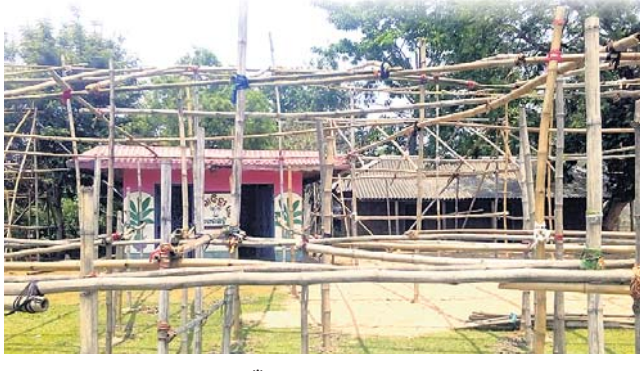
ଭଦ୍ର ନିୟନ୍ତ୍ରଣ ପାଇଁ ପୀଠରେ ବ୍ୟାରିକେଡ୍ ବନ୍ଧାଯାଇଛି।

ଭଦ୍ରକ ଜିଲ୍ଲା ବନ୍ଧ ବ୍ଲକ ଓଡ଼ିଶା ପଞ୍ଚାୟତ ଚୋଟାସାହିରେ ଥିବା ସାବିତ୍ରୀଆଡ଼ି ପୀଠ ଚଳଚଞ୍ଚଳ ହୋଇଉଠିଛି। ଆଉ ୨ ଦିନ ପରେ ସାବିତ୍ରୀ ଓଷା। ପ୍ରତିବର୍ଷ ସାବିତ୍ରୀ ବ୍ରତ ଦିନ ଭଦ୍ରକ, ବାଲେଶ୍ୱର, କେନ୍ଦୁଝର ଓ ମୟୂରଭଞ୍ଜ ଆଦି ଜିଲ୍ଲାକୁ ହଜାର ହଜାର ସଧବା ନାରୀ ଏଠାକୁ ଆସି ପୂଜାର୍ଚ୍ଚନା କରିଥାନ୍ତି। ଚଳିତବର୍ଷ ମଧ୍ୟ ସଧବାମାନଙ୍କ ସାମୂହିକ ପୂଜାର୍ଚ୍ଚନା ପାଇଁ ବ୍ୟାପକ ବ୍ୟବସ୍ଥା କରାଯାଇଛି। ଏଥିସହ ୫ ଦିନ ଧରି ଏଠାରେ ବିଭିନ୍ନ କାର୍ଯ୍ୟକ୍ରମ ଅନୁଷ୍ଠିତ ହେବ। ପ୍ରତ୍ୟହ ସନ୍ଧ୍ୟାରେ ସାଂସ୍କୃତିକ କାର୍ଯ୍ୟକ୍ରମ ପରିବେଷଣ କରାଯିବ। ଶାନ୍ତିଶୁଖାଳୀ ରକ୍ଷା ପାଇଁ ବ୍ୟାପକ ପୋଲିସ୍ ପୁରୁଷନର ବ୍ୟବସ୍ଥା କରାଯାଇଛି। ବ୍ରତ ଦିନ ସୁରୁଖୁରୁରେ କାର୍ଯ୍ୟକ୍ରମ ପରିଚାଳନା ନେଇ ପୂଜା କମିଟି ଓ ପୋଲିସ୍ ସକ୍ଷରୁ ପ୍ରସ୍ତୁତି ଜୋରସୋରରେ ଚାଲିଛି। ବ୍ରତଧାରୀ ମହିଳାମାନେ ଏଠାକୁ