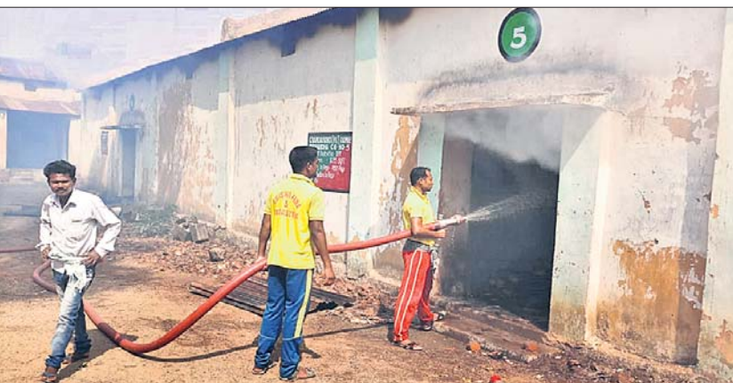
ଗୋଦାମରେ ଲାଗିଥିବା ନିଆଁ ଅଗ୍ନିଶମ କର୍ମଚାରୀ ଲିଭାଉଛନ୍ତି।

ନବରଙ୍ଗପୁର ଜିଲ୍ଲା ଚନ୍ଦ୍ରାହାଣ୍ଡି ବ୍ଲକ୍ ଅଧୀନ ଦେଓବନ୍ଧୁପୁର କେନ୍ଦ୍ରପତ୍ର ଗୋଦାମକୁ ଗୁରୁବାର ବିଳମ୍ବିତ ରାତିରେ ମାଓବାଦୀମାନେ ନିଆଁ ଲଗାଇ ଦେଇଛନ୍ତି । ଏଥିଯୋଗୁ ପ୍ରାୟ ୨ କୋଟି ଟଙ୍କାର କେନ୍ଦ୍ରପତ୍ର ଯୋଡ଼ି ପାରା ହୋଇଯାଇଛି । ଜିଲ୍ଲା କେନ୍ଦ୍ରପତ୍ର ବିଭାଗ ଚରମରୁ ଏହି ସୂଚନା ଦିଆଯାଇଛି।