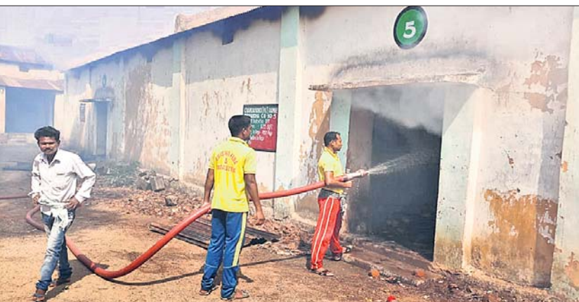
ଗୋଦାମରେ ଲାଗିଥିବା ନିଆଁ ଅଗ୍ନିଶମ କର୍ମଚାରୀ ଲିଭାଉଛନ୍ତି।

ନବରଙ୍ଗପୁର ଜିଲ୍ଲା ଚନ୍ଦ୍ରାହାଣ୍ଡି ବ୍ଲକ୍ ଅଧୀନ ଦେଓବନ୍ଧୁପୁର କେନ୍ଦ୍ରପତ୍ର ଗୋଦାମକୁ ଗୁରୁବାର ବିଳମ୍ବିତ ରାତିରେ ମାଓବାଦୀମାନେ ନିଆଁ ଲଗାଇ ଦେଇଛନ୍ତି । ଏଥିଯୋଗୁ ପ୍ରାୟ ୨ କୋଟି ଟଙ୍କାର କେନ୍ଦ୍ରପତ୍ର ଯୋଡ଼ି ପାଉଁଶ ହୋଇଯାଇଛି । ଜିଲ୍ଲା କେନ୍ଦ୍ରପତ୍ର ବିଭାଗ ଚରମରୁ ଏହି ସୂଚନା ଦିଆଯାଇଛି।