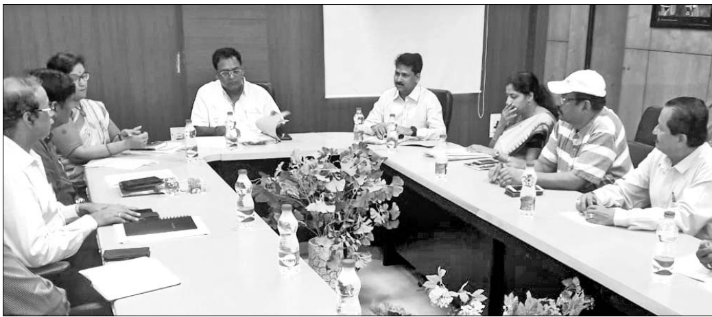
ସମୀକ୍ଷା ବୈଠକରେ ସ୍ଵାସ୍ଥ୍ୟ ଓ ପରିବାର କଲ୍ୟାଣ ମନ୍ତ୍ରୀ ନବ କିଶୋର ଦାସ ଏବଂ ବିଭାଗୀୟ ଅଧିକାରୀମାନେ ଆଲୋଚନା କରୁଥିଲେ।

ସ୍ଵାସ୍ଥ୍ୟ ଓ ପରିବାର କଲ୍ୟାଣ ବିଭାଗର ମନ୍ତ୍ରୀ ଭାବେ ଦାୟିତ୍ଵ ଗ୍ରହଣ କରିବା ପରେ ନବ କିଶୋର ଦାସ ଶୁକ୍ରବାର ବିଭାଗ ପରିବର୍ତ୍ତନ କରି ପଦାଧିକାରୀମାନଙ୍କ ସହିତ ରାଜ୍ୟର ସ୍ଵାସ୍ଥ୍ୟ ସେବା ବ୍ୟବସ୍ଥା ସମ୍ପର୍କରେ ଆଲୋଚନା କରିଛନ୍ତି।