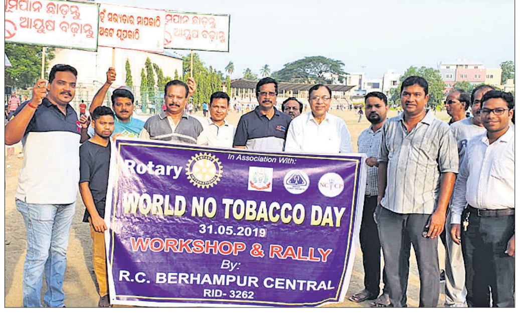
ସଚେତନତା ଶୋଭାଯାତ୍ରା ସହର ପରିକ୍ରମା କରୁଛି ।

କମିଟିର ସଭାପତି ସହ ଆଲୋଚନା କରିବାକୁ ପ୍ରତିଶ୍ରୁତି ଦେଇଥିଲେ । ଉକ୍ତ ପ୍ରତିଶ୍ରୁତି ପ୍ରକାରେ ନିର୍ବାଚନ ଆବରଣ ବିଧି ଉଠିବା ପରେ ଶୁକ୍ରବାର ମିଳିତ କ୍ରିୟାନୁଷ୍ଠାନ କମିଟି କର୍ତ୍ତୃପକ୍ଷ ଉପଜିଲ୍ଲାପାଳ ଉପସଭାରେ ସାମିଲ ହୋଇଥିଲେ । କିନ୍ତୁ ଉପଜିଲ୍ଲାପାଳ ଏ ନେଇ କମିଟିର ଓ ଜିଲ୍ଲାପାଳଙ୍କ ସହ ଆଲୋଚନା କରିବାକୁ ପ୍ରତିଶ୍ରୁତି ଦେବା ସହ ଆସନ୍ତା ଜୁନ ଶେଷ ସମ୍ପ୍ରାପ୍ତ ହେବାକୁ ଥିବା ଅଭିଯୋଗ ଦାଖଲ କରିବାକୁ ପ୍ରତିଶ୍ରୁତି ଦେଇଥିଲେ ।