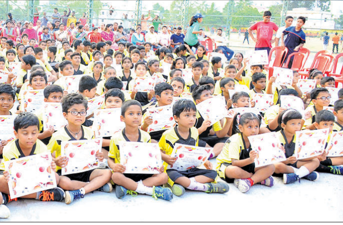
ପ୍ରାଣପତ୍ର ସହ ପ୍ରଶିକ୍ଷଣ ଶିବିରର ଖେଳାଳିମାନେ ।

କମିଟିର ସଭାପତି ସହ ଆଲୋଚନା କରିବାକୁ ପ୍ରତିଶ୍ରୁତି ଦେଇଥିଲେ । ଉକ୍ତ ପ୍ରତିଶ୍ରୁତି ପ୍ରକାରେ ନିର୍ବାଚନ ଆବରଣ ବିଧି ଉଠିବା ପରେ ଶୁକ୍ରବାର ମିଳିତ କ୍ରିୟାନୁଷ୍ଠାନ କମିଟି କର୍ତ୍ତୃପକ୍ଷ ଉପଜିଲ୍ଲାପାଳ ଉପସଭାରେ ସାମିଲ ହୋଇଥିଲେ । କିନ୍ତୁ ଉପଜିଲ୍ଲାପାଳ ଏ ନେଇ କମିଟିର ଓ ଜିଲ୍ଲାପାଳଙ୍କ ସହ ଆଲୋଚନା କରିବାକୁ ପ୍ରତିଶ୍ରୁତି ଦେବା ସହ ଆସନ୍ତା ଜୁନ ଶେଷ ସମ୍ପ୍ରାପ୍ତ ହେବାକୁ ଥିବା ଅଭିଯୋଗ ଦାଖଲ କରିବାକୁ ପ୍ରତିଶ୍ରୁତି ଦେଇଥିଲେ ।