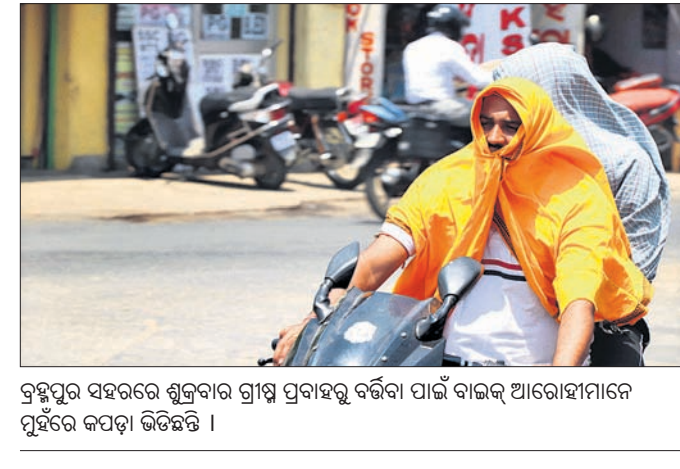
ବ୍ରହ୍ମପୁର ସହରରେ ଶୁକ୍ରବାର ଗ୍ରୀଷ୍ମ ପ୍ରବାହକୁ ବର୍ଦ୍ଧିବା ପାଇଁ ବାଲକ ଆରୋହୀମାନେ ପୂର୍ବରେ କପଡ଼ା ଭିତକରି ।

କମିଟିର ସଭାପତି ସହ ଆଲୋଚନା କରିବାକୁ ପ୍ରତିଶ୍ରୁତି ଦେଇଥିଲେ । ଉକ୍ତ ପ୍ରତିଶ୍ରୁତି ପ୍ରକାରେ ନିର୍ବାଚନ ଆବରଣ ବିଧି ଉଠିବା ପରେ ଶୁକ୍ରବାର ମିଳିତ କ୍ରିୟାନୁଷ୍ଠାନ କମିଟି କର୍ତ୍ତୃପକ୍ଷ ଉପଜିଲ୍ଲାପାଳ ଉପସଭାରେ ସାମିଲ ହୋଇଥିଲେ । କିନ୍ତୁ ଉପଜିଲ୍ଲାପାଳ ଏ ନେଇ କମିଟିର ଓ ଜିଲ୍ଲାପାଳଙ୍କ ସହ ଆଲୋଚନା କରିବାକୁ ପ୍ରତିଶ୍ରୁତି ଦେବା ସହ ଆସନ୍ତା ଜୁନ ଶେଷ ସମ୍ପ୍ରାପ୍ତ ହେବାକୁ ଥିବା ଅଭିଯୋଗ ଦାଖଲ କରିବାକୁ ପ୍ରତିଶ୍ରୁତି ଦେଇଥିଲେ ।