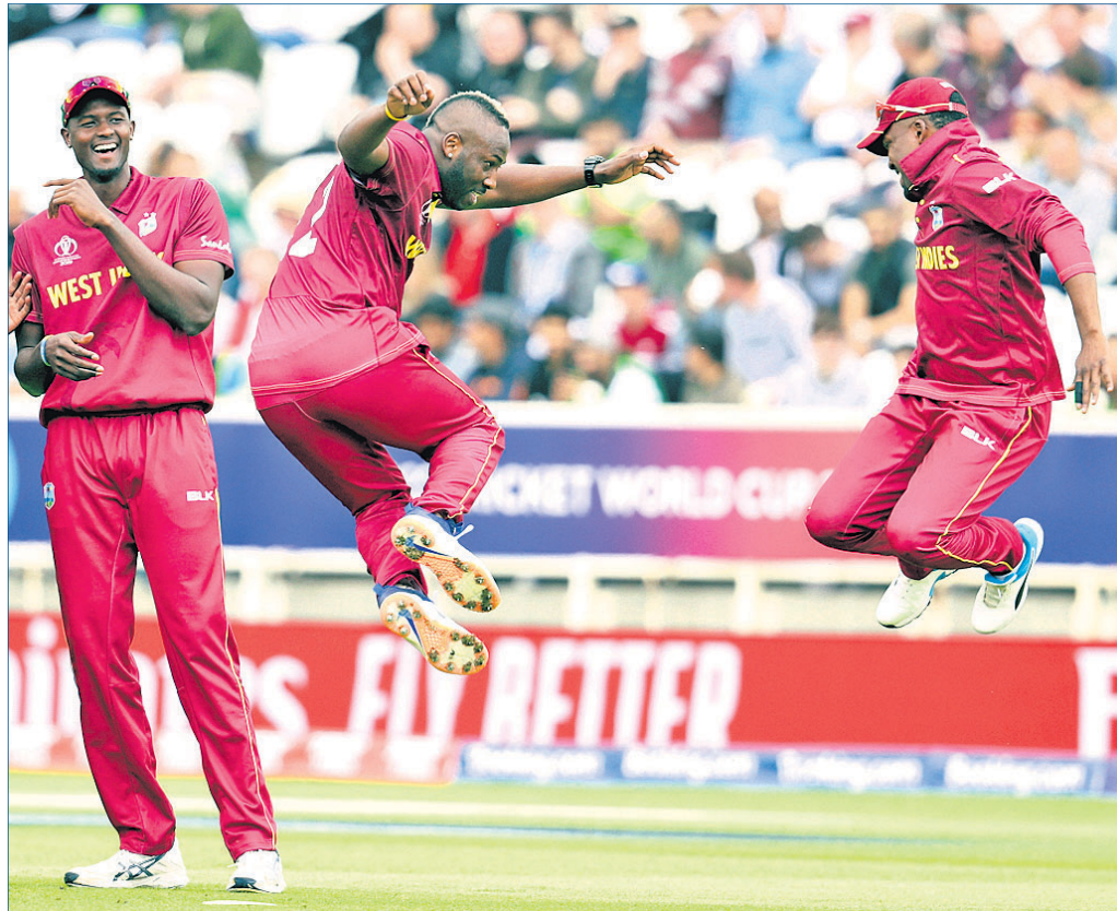
ପାକିସ୍ତାନୀୟ ହାରିସ୍ ସୋହେଲ୍ ଉଲ୍‌କେଟ୍ ନେବା ପରେ ତାହାରେ ନାଭୋଲ୍ ସହିତ ସୁସ୍ଥିତିରୁ ନୂତନ କ୍ରମେ ଫ୍ରେଷ୍ଟୁଲଟ୍ସିଜର ବୋଲର ଆଣ୍ଡେ ରସେଲ୍ । ବାମ ପାର୍ଶ୍ୱରେ ଅଇଡିଫ୍ ଫ୍ରେଷ୍ଟୁଲଟ୍ସିଜ ଅଧିନାୟକ ଜାସନ ହୋଲ୍ଡର୍ ।