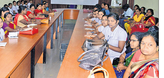
ଉପସ୍ଥିତ ନର୍ସ ଚାଲିମ୍ ଛାତ୍ରୀମାନେ ।

କମିଟିର ସଭାପତି ସହ ଆଲୋଚନା କରିବାକୁ ପ୍ରତିଶ୍ରୁତି ଦେଇଥିଲେ । ଉକ୍ତ ପ୍ରତିଶ୍ରୁତି ପ୍ରକାରେ ନିର୍ବାଚନ ଆବରଣ ବିଧି ଉଠିବା ପରେ ଶୁକ୍ରବାର ମିଳିତ କ୍ରିୟାନୁଷ୍ଠାନ କମିଟି କର୍ତ୍ତୃପକ୍ଷ ଉପଜିଲ୍ଲାପାଳ ଉପସଭାରେ ସାମିଲ ହୋଇଥିଲେ । କିନ୍ତୁ ଉପଜିଲ୍ଲାପାଳ ଏ ନେଇ କମିଟିର ଓ ଜିଲ୍ଲାପାଳଙ୍କ ସହ ଆଲୋଚନା କରିବାକୁ ପ୍ରତିଶ୍ରୁତି ଦେବା ସହ ଆସନ୍ତା ଜୁନ ଶେଷ ସମ୍ପ୍ରାପ୍ତ ହେବାକୁ ଥିବା ଅଭିଯୋଗ ଦାଖଲ କରିବାକୁ ପ୍ରତିଶ୍ରୁତି ଦେଇଥିଲେ ।