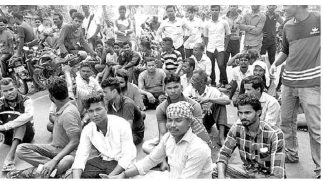
ଗୋପ-କୋଣାର୍କ ରାସ୍ତାର ତହସିଲକର୍ତ୍ତାରେ ଲୋକେ ରାସ୍ତା ଅବରୋଧ କରିଛନ୍ତି।

ବାତ୍ୟାର ୨୯ଦିନ ପରେ ବି ପୁରୀ ଜିଲ୍ଲାର ଅନେକ ଅଞ୍ଚଳ ଅକ୍ଷୟରେ ରହିଛି। ଏଥିପାଇଁ ବିଭିନ୍ନ ଗ୍ରାମରେ ଲୋକେ ଆନ୍ଦୋଳନକୁ ଓହ୍ଲାଇଛନ୍ତି। ଗୋପ ବ୍ଲକ ଅଧୀନ ବେଶାପୁର ଗ୍ରାମ ନିକଟ ଭାଗର ସାହି, ସେଣା ସାହି, ବାବାଜୀ ସାହି, ବସୁନ୍ଦରୀ ସମେତ ୧୦ଟି ଗ୍ରାମକୁ ଏ ପର୍ଯ୍ୟନ୍ତ ବିଦ୍ୟୁତ୍ ସଂଯୋଗ ହୋଇପାରିନାହିଁ। ଏହା ପ୍ରତିବାଦରେ ଶନିବାର ପୂର୍ବାହ୍ନ ୧୦ଟାକୁ ଗୋପ-କୋଣାର୍କ ରାସ୍ତାର ତହସିଲକର୍ତ୍ତାରେ ଶତାଧିକ ଲୋକେ ପ୍ରାୟ ୩୦୦ ଧରି ରାସ୍ତାରେକୋ କରୁଥିଲେ। ବିଦ୍ୟୁତ୍