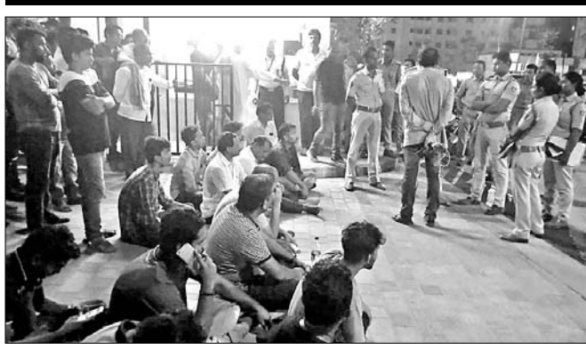
ଦେବାକୁ ଚେଷ୍ଟା କରିବେ ବୋଲି ପ୍ରତିକୃତି ଦେବା ପରେ ଆନ୍ଦୋଳନ ହଟିଥିଲା। ପୂରଣ ଅନୁଯାୟୀ, ଭଦ୍ରକ ଜିଲ୍ଲା

ତାଙ୍କୁ ଗୁଣାୟ ପୋଲିସ୍ କଳକ ବଡ଼ ନେତୃକାଳ ନେଇଥିଲେ। ସେଠାରେ ତାଙ୍କ ସ୍ୱାସ୍ଥ୍ୟାବସ୍ଥା ଜଟିଳ ହେବାକୁ ପରିବାର ଲୋକେ ତାଙ୍କୁ ଭୁବନେଶ୍ୱରର ଉଚ୍ଚ ଘରୋଇ ହସ୍ପିଟାଲରେ ଭର୍ତ୍ତି କରିଥିଲେ। ଚିକିତ୍ସା ଆରମ୍ଭ କରିବା ପରେ ଡାକ୍ତର ତାଙ୍କର ସ୍ୱାସ୍ଥ୍ୟାବସ୍ଥା ଠିକ୍ ଥିବା କହିଥିଲେ। ଗତ ୫ଦିନ ତଳେ ରିଟରଜନଙ୍କ ସ୍ୱାସ୍ଥ୍ୟାବସ୍ଥା ଅଧିକ ଖରାପ ଆଡ଼କୁ ଗତି କରୁଥିବା କହି ଆଇସିୟୁରେ ଭର୍ତ୍ତି କରାଯାଇଥିଲା। ବହୁ ଘଣ୍ଟା ପୂର୍ବରୁ ଡାକ୍ତର ମୃତ୍ୟୁ ଘଟିଥିଲେ ମଧ୍ୟ ଶନିବାର ଅପରାହ୍ନରେ ଏ ସମ୍ପର୍କରେ ହସ୍ପିଟାଲ କର୍ତ୍ତୃପକ୍ଷ ଜଣାଇଥିଲେ। ସ୍ତବ୍ଧ ଥିବା ରିଟରଜନଙ୍କ ମୃତ୍ୟୁ ଖବର ଶୁଣି ପରିବାର ଲୋକେ ଆଶ୍ଚର୍ଯ୍ୟ ହୋଇଯିବା ସହ ଡାକ୍ତରଙ୍କ ଅବହେଳାକୁ ଦାୟୀ କରିଛନ୍ତି।