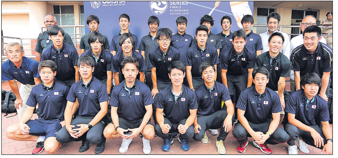
କଳିଙ୍ଗ ଷ୍ଟୁଡିଓମରେ ହେବାକୁ ଥିବା ଏଫ୍‌ଆଇଏଚ୍ ପୁରୁଷ ଫାଇନାଲ୍ ହକି ଦୁର୍ନାମେଶ୍ ଖେଳିବା ଲାଗି ରବିବାର ଭୁବନେଶ୍ୱରରେ ପହଞ୍ଚିଥିବା କାପାନ ଦଳର ଖେଳାଳିମାନେ ।