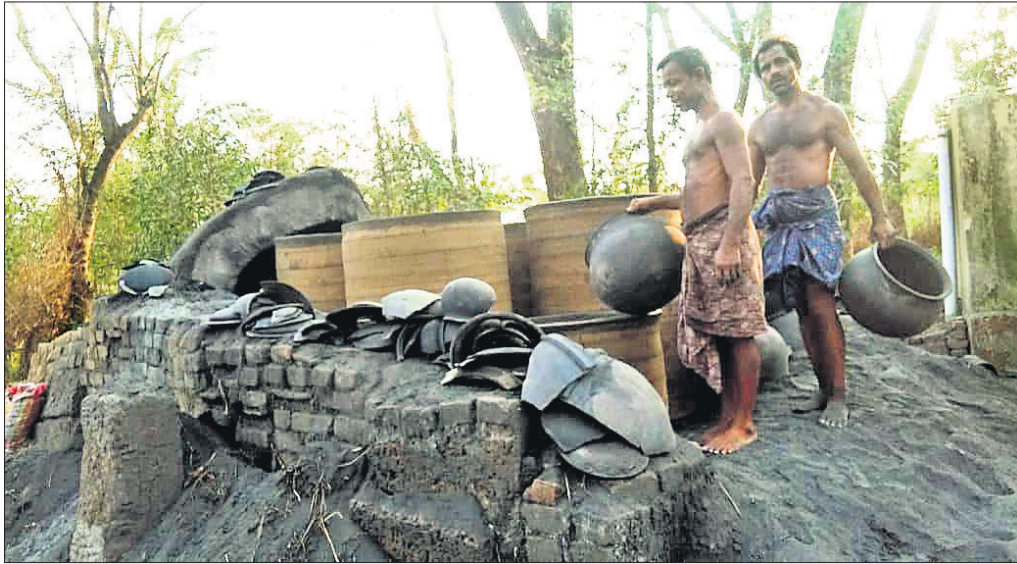
ଫନୀ ଯୋଗୁ ଭାଙ୍ଗିଯାଇଥିବା କୁସାରଙ୍କ ମାଟିହାଣ୍ଡି ଶାଳ।

ହସ୍ତଶିଳ୍ପର ବିକାଶ ପାଇଁ ପ୍ରତିବର୍ଷ ଯୋଜନା ପରେ ଯୋଜନା ପ୍ରଣୟନ କରାଯାଉଛି। ହେଲେ ଗ୍ରାମାଞ୍ଚଳରେ ଥିବା କାରିଗରଙ୍କ ନିକଟରେ ଯୋଜନାର ସୁଫଳ ପହଞ୍ଚିପାରୁ ନାହିଁ। ଯଦ୍ୱାରା ଯୋଜନା ମାଧ୍ୟମରେ କର୍ମନିଯୁକ୍ତି ସୃଷ୍ଟି ହେବା ତ ଦୂରର କଥା ଜ୍ରମଣୀ ଏହା ସଙ୍କୁଚିତ ହେବାରେ ଲାଗିଛି। ଏହାସହ ପ୍ରକଳ୍ପକାରୀ ବାଟ୍ୟା ଫନୀ ଯାଜପୁର ଜିଲାର ହସ୍ତଶିଳ୍ପ କାରିଗରଙ୍କ ବୋଝ ଉପରେ ନିଜରା ବିତ୍ତ ସମ୍ପୂର୍ଣ୍ଣ ହୋଇଛି। ଜିଲା ଶିଳ୍ପକେନ୍ଦ୍ର କାର୍ଯ୍ୟାଳୟରୁ ମିଳିଥିବା ସୂଚନା ଅନୁଯାୟୀ, ପ୍ରଥମ ପର୍ଯ୍ୟାୟରେ ଜିଲାର ୧୧୮୭୭ଜଣ ହସ୍ତଶିଳ୍ପ କାରିଗର ବ୍ୟାପକ କ୍ଷୟକ୍ଷତିରୀ ସମ୍ମୁଖୀନ ହୋଇଛନ୍ତି। ବାଟ୍ୟା ଫନୀକୁ ମାସେ ବିତିଯାଇଥିଲେ ହେଁ କ୍ଷତିଗ୍ରସ୍ତ ହସ୍ତଶିଳ୍ପ କାରିଗର ଏଯାବତ୍ କୌଣସି ସରକାରୀ ସହାୟତା ପାଇନାହାନ୍ତି। ଏପରି କି ବିଭାଗ ପକ୍ଷରୁ ସର୍ବେ କାର୍ଯ୍ୟ ଶେଷ ହୋଇ ନ ଥିବାରୁ ହସ୍ତଶିଳ୍ପ କାରିଗରଙ୍କ ମଧ୍ୟରେ ଉଦ୍‌ବେଗ ପ୍ରକାଶ ପାଇଛି।