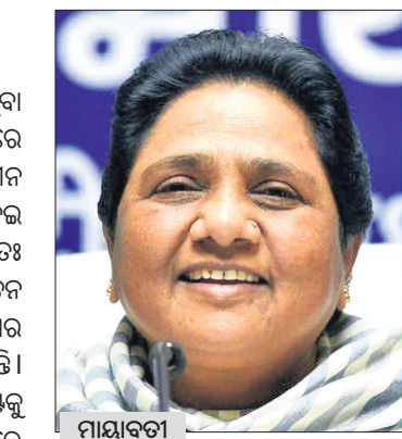
ଲକ୍ଷ୍ନୋ, ୩୩.୬: ଏସ୍ପି-ବିଏସ୍ପି ମେଣ୍ଟ ଭାଙ୍ଗିଯାଇଛି।