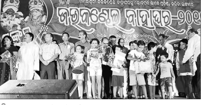
ଅତିଥିଙ୍କ ଗହଣରେ କୃତା ଛାତ୍ରଛାତ୍ରୀ।

ବାଲେଶ୍ୱରରେ ନିଆରା ଜର କଷ୍ଟେଇ ବାହାଘର ଲୋକକଳା ଓ ସଂସ୍କୃତି ପର୍ବ ପାଳିଛି।