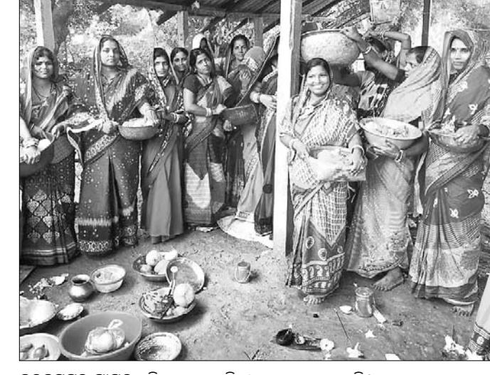
ବରହମପୁର ଗ୍ରାମର ମହିଳାମାନେ ସାବିତ୍ରୀ ବ୍ରତ ପାଳନ କରୁଛନ୍ତି।

ବାଲେଶ୍ୱର ଜିଲ୍ଲା ସୋର ଯୁବକ କଲେଜରୁ ଏଥର ଯୁକ୍ତ ୨ ବିଜ୍ଞାନ ପରୀକ୍ଷା ଦେଇଥିବା ୨୪୬ ପରୀକ୍ଷାର୍ଥୀଙ୍କ ମଧ୍ୟରୁ ୨୪୫ ଜଣ କୃତକାର୍ଯ୍ୟ ହୋଇଛନ୍ତି।