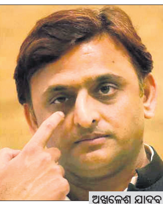
ଲକ୍ଷ୍ନୋ, ୩୩.୬: ଏସ୍ପି-ବିଏସ୍ପି ମେଣ୍ଟ ଭାଙ୍ଗିଯାଇଛି।