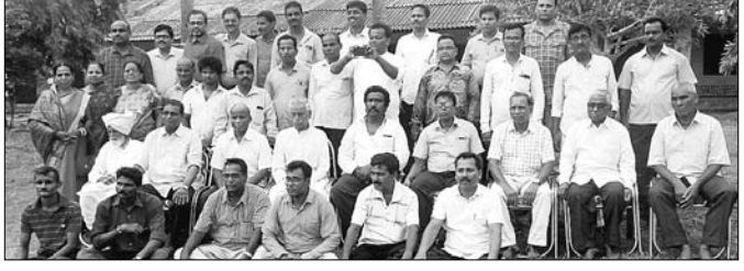
କେସି ହାଇସ୍କୁଲର ୧୯୮୬ ବ୍ୟାଚ୍ ପୁରାତନ ଛାତ୍ରଛାତ୍ରୀଙ୍କ ବହୁମିଳନ।

ଛାତ୍ରଛାତ୍ରୀମାନେ ବିଦ୍ୟାଳୟ ସମେତ ଦେଶର ଅମୁଲ୍ୟ ସମ୍ପଦ। ପ୍ରତ୍ୟେକ ପୁରାତନ ଛାତ୍ରଛାତ୍ରୀ ନିଜ ବିଦ୍ୟାଳୟର ବିକାଶ ପ୍ରତି ଧ୍ୟାନ ଦେଲେ ଶିକ୍ଷା ବ୍ୟବସ୍ଥାରେ ଉନ୍ନତି ଆସିପାରିବ।