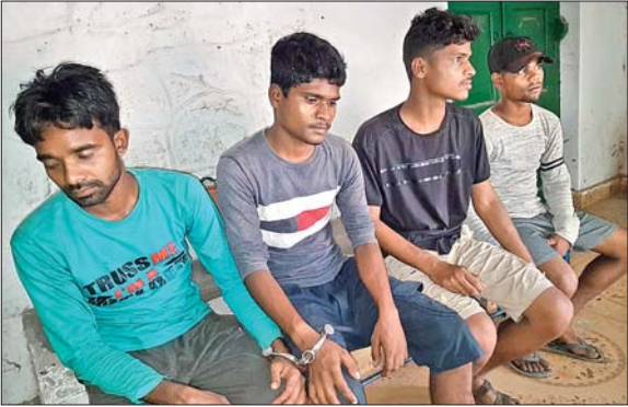
ଗିରଫ ହୋଇଥିବା ଅଭିଯୁକ୍ତମାନେ ।