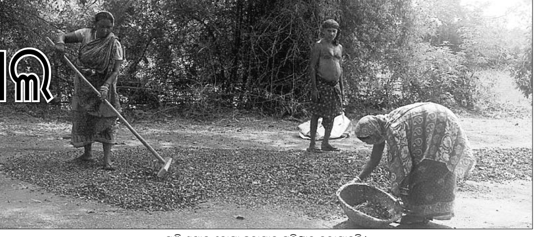
ମଞ୍ଜି ଶୁଖାଇ ବୋପା ଛତାଯାଇ ପରିଷ୍କାର କରାଯାଉଛି।

କୃଷିପଦା, ୩୬(ଡି.ଏନ-୧) ଛୁଟିପୂର୍ଣ୍ଣ ସରକାରୀ ନାତି ଯୋଗୁ ଆଦିବାସୀ ଅଧିକାଂଶ ମୟୂରଭଞ୍ଜ ଜିଲ୍ଲାରେ ଶାଳମଞ୍ଜି, ମହୁଳା ଓ କେନ୍ଦୁପତ୍ର ଭଳି ବିଭିନ୍ନ ଲକ୍ଷ୍ମୀ ବନଜାତ ଦ୍ରବ୍ୟ ସଂଗ୍ରହ ବ୍ୟବସ୍ଥା ବିପର୍ଯ୍ୟୟ ହୋଇପଡ଼ିଛି। ଆଗରୁ ଗରିବ ଆଦିବାସୀ ଜଙ୍ଗଲକୁ ବନଜାତ ଦ୍ରବ୍ୟ ସଂଗ୍ରହ କରି ଏହାକୁ ହାତ ବଜାରରେ ବିକି ଚଳୁଥିଲେ। ଏବେ ବଜାର ଫୁଲିଆ ଅଭାବରୁ ଏହାକୁ କମ୍ ଦାମରେ ବିକି ଯେମାନେ ଚୁକ୍ଚୁରାଣ ମେଣ୍ଟାଇବାକୁ ଅସମର୍ଥ ହେଉଛନ୍ତି। ଅନେକେ ବନବାସୀ ଫୁଲିଆ ବୃକ୍ଷ ଛାଡ଼ି ଭିନ୍ନ ପଛା ଖୋଜିବାକୁ ବାଧ୍ୟ ହେଉଛନ୍ତି। ଏଭଳି ଭିତରେ ଜଙ୍ଗଲରେ ବର୍ତ୍ତମାନ ଚନ୍ଦ୍ର ଚନ୍ଦ୍ର ଶାଳମଞ୍ଜି ପତି ରହି ନଷ୍ଟ ହେଉଥିବା ସୂଚନା ମିଳିଛି। ଶିମିଳାପାଳ ଅଭୟାରଣ୍ୟ ସଂରକ୍ଷଣ ମୟୂରଭଞ୍ଜ ଜିଲ୍ଲା କୃଷିପଦା ବ୍ଲକର କଳମନଡ଼ିଆ, ସରଡ଼ିଆ, ଶରତ, ନତୋ, ରାମଚନ୍ଦ୍ରପୁର, ପଦ୍ମପୋଖରୀ, ମଝିପଡ଼ିଆ, ଦେଶାନନ୍ଦସାହି, ଲାବଣ୍ୟଦେଇପୁର, ଚକ୍ରଧରପୁର, ଦେବଳା, ପୋଡ଼ିଆ ଆଦି ଅଞ୍ଚଳରେ ବିପ୍ରାଣ୍ଣ ଶାଳ ଜଙ୍ଗଲ ରହିଛି।