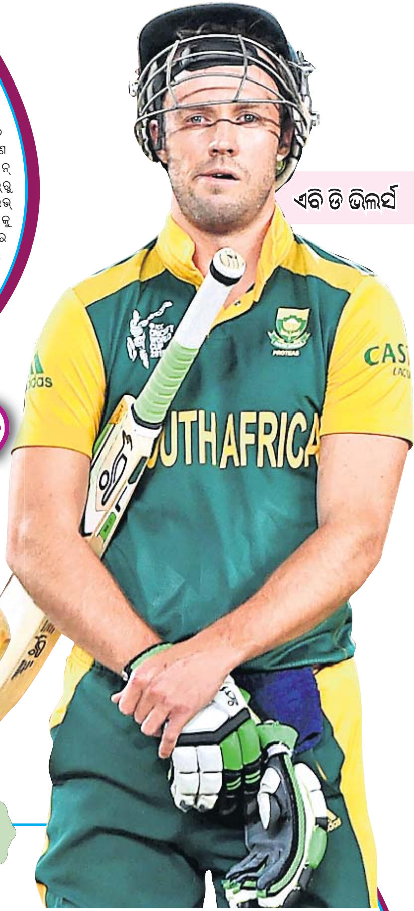
ଏବି ଡି ଭିଲର୍ସ

କ୍ରିକେଟ୍ ବିଶ୍ୱକପ୍ ଇତିହାସରେ ପ୍ରଥମ ବ୍ୟାଟ୍ସମ୍ୟାନ ଭାବେ ଦକ୍ଷିଣ ଆଫ୍ରିକାର ବିଶ୍ୱୋତ୍ତମ ବ୍ୟାଟ୍ସମ୍ୟାନ ହର୍ଶେଲ୍ ଗିଲ୍ ଗୋଟିଏ ଓଭରରେ ୬ଟି ଛକା ମାରିବାର ବିରଳ କୃତ୍ତିତ୍ୱ ହାସଲ କରିଥିଲେ । ୨୦୦୭ ବିଶ୍ୱକପ୍ରେ ନେଦରଲାଣ୍ଡ ବିପକ୍ଷ ମ୍ୟାଚ୍ରେ ଗିଲ୍ ଏହି ସଫଳତା ପାଇଥିଲେ । ପ୍ରଥମେ ବ୍ୟାଟିଂ କରି ଦକ୍ଷିଣ ଆଫ୍ରିକା ୨୯ ଓଭରରେ ୨ ଉଇକେଟ୍ ହରାଇ ୧୭୮ ରନ କରିଥିଲା । ନେଦରଲାଣ୍ଡ ଲେଙ୍ଗ୍-ସ୍ପିନ୍ନର ତାନ୍ ଭାନ୍ ବଙ୍ଗ୍ ଇନିଂସର ୩୦ତମ ଓଭର ବୋଲିଂ କରିବାକୁ ଆସିଥିଲେ । ସେତେବେଳେ ଗିଲ୍ ୩୦ ବଲ୍ ୩୨ ରନ କରି ସ୍ତ୍ରୀଜୀବ କରୁଥିଲେ । ତାନ୍ଙ୍କ ପ୍ରଥମ ଗାଟି ବଲ୍‌କୁ ଗିଲ୍ ଯଥାକ୍ରମେ ଲଙ୍ଗ୍ ଅନ୍, ସ୍ପେଙ୍ଗ୍ ବ୍ରାଉଜ୍ ଓ ଲଙ୍ଗ୍ ଅଫ୍ ଉପରେ ଲଫ୍ଟିଂ କରି ଛକା ମାରିଥିଲେ । ଏହାପରେ ୪ର୍ଥ ବଲ୍‌କୁ ତାନ୍ ଯଦ୍ଧର ପକାଇବାକୁ ଚେଷ୍ଟା କରିଥିବାବେଳେ ଏହା ଫୁଲ୍ ଟସ୍ ହୋଇଥିଲା ଏବଂ ଗିଲ୍ ଏହାକୁ ମିଡ୍ ଉଇକେଟ୍ ଉପରେ ବାଉଣ୍ଡରି ବାହାରକୁ ପଠାଇ ଦେଇଥିଲେ । ଅସହାୟ ହୋଇପଡ଼ିଥିବା ତାନ୍ଙ୍କ ପରବର୍ତ୍ତୀ ୨ଟି ବଲ୍ରେ ବିଶାଳ ଛକା କରିଥିଲେ ଗିଲ୍ । ଫଳରେ ଓଭରକୁ ୩୬ ରନ୍ ସଂଗ୍ରହ ହୋଇଥିଲା । ଜ୍ୟାକ୍ କାଲିସ୍ (୧୨୮)ଙ୍କ ଶତକ ଏବଂ ଗିଲ୍ (୪୦ ବଲ୍ ୭୨ ରନ୍) ଓ ମାର୍କ ବାଉଡର (୩୧ ବଲ୍ ୬୫ ରନ୍)ଙ୍କ ଉପଯୋଗୀ ଇନିଂସ ବଳରେ ଦକ୍ଷିଣ ଆଫ୍ରିକା ୪୦ ଓଭରରେ ୩ ଉଇକେଟ୍ରେ ୩୫୩ ରନ କରିଥିଲା । ନେଦରଲାଣ୍ଡ ୪୦ ଓଭରରେ ୯ ଉଇକେଟ୍ରେ ୧୩୯ ରନ କରିପାରିଥିଲା ।