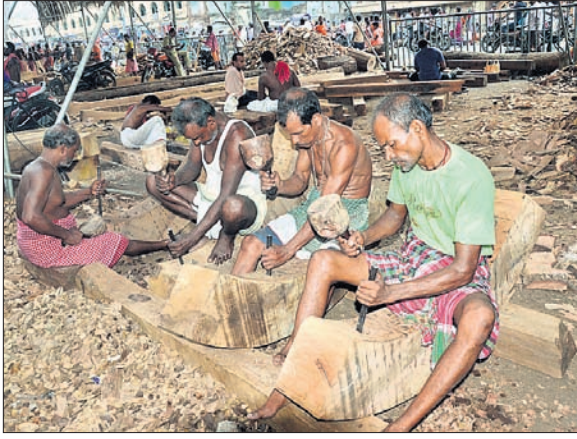
ପୁରୀ ରଥଖଳାରେ ଅରରେ ବିକଳାମୀମାନଙ୍କୁ ଚିକିତ୍ସା ଦିଆଯାଇଛି ।