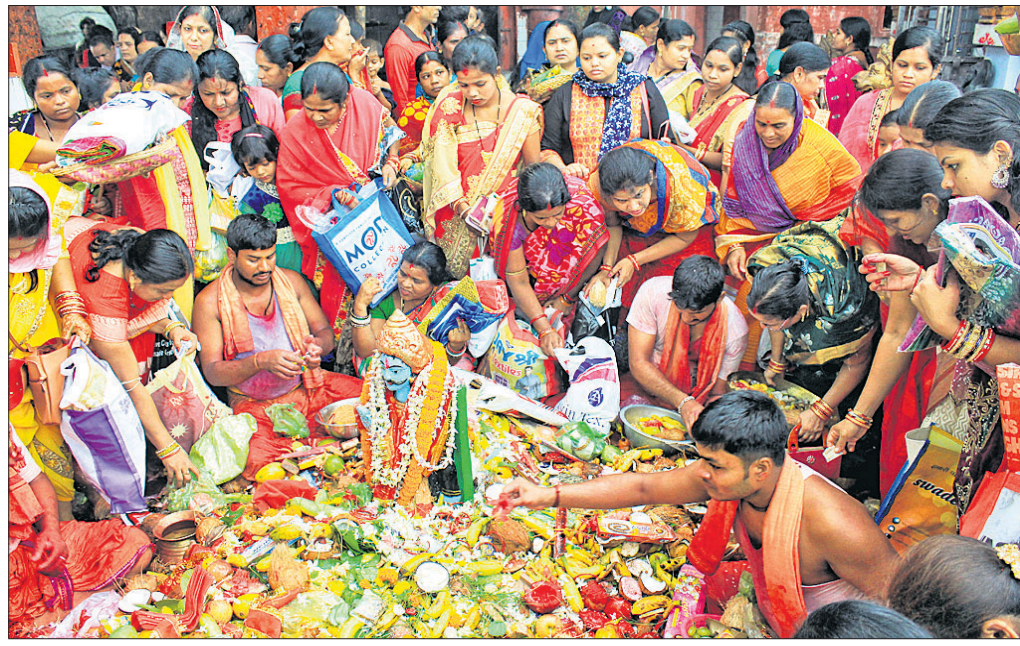
ସାବିତ୍ରୀ ଅମବାସ୍ୟାରେ ଅନୁଗୋଳ ବୁଢ଼ୀ ଠାକୁରାଣୀଙ୍କଠାରେ ମହିଳାମାନେ ପୂଜାର୍ଚ୍ଚନା କରୁଛନ୍ତି।

ସାବିତ୍ରୀ ବ୍ରତ ପାଇଁ ସୋମବାର ଅନୁଗୋଳ ସହରର ମନ୍ଦିରଗୁଡ଼ିକରେ ପ୍ରବଳ ଭିଡ଼ ହୋଇଥିଲା। ବିଶେଷକରି ମା' ବୁଢ଼ୀ ଠାକୁରାଣୀ ମନ୍ଦିରରେ ଭୋଗ ସମୟରୁ ହିଁ ବ୍ରତଧାରୀମାନେ ଲମ୍ବା ଲାଇନ ଲଗାଇ ସ୍ଵାମୀଙ୍କ ଶୁଭ ମନାସିଲେ। ଅପରାହ୍ନ ଯାଏ ମନ୍ଦିରରେ ପୂଜାର୍ଚ୍ଚନା ଚାଲିଥିଲା। ସାବିତ୍ରୀ ପାଇଁ ଗତ ଦୁଇ ଦିନ ଧରି ଅନୁଗୋଳ ସହରରେ ଯେପରି ପ୍ରବଳ ଗହଳ ପରିଲକ୍ଷିତ ହୋଇଥିଲା ଠିକ୍ ସେହିପରି ସୋମବାର ଭୋଗ ସମୟରୁ ହିଁ ମହିଳାମାନେ ନୂତନ ବସ୍ତ୍ର ପରିଧାନ କରି ଭୋଗ ଥାଳି ଧରି ମନ୍ଦିର ମୁହାଁ ହୋଇଥିଲେ। ଭିଡ଼ ଏଡ଼ାଇବା ପାଇଁ ବ୍ରତଧାରୀମାନେ ସକାଳୁ ମନ୍ଦିରରେ ପହଞ୍ଚିଥିବାରୁ ଲମ୍ବା ଲାଇନ ଦେଖିବାକୁ ମିଳିଥିଲା। ଫଳରେ ଧାଡ଼ି ଶେଷ ବେଳକୁ ପ୍ରାୟ ଅପରାହ୍ନ ୨ଟା ବାଜିଯାଇଥିଲା। ସେହିପରି କିରମମାନେ ମଦନମୋହନ ମନ୍ଦିରରେ ପୂଜାର୍ଚ୍ଚନା କରିଥିଲେ। କେଳରେ ଥିବା ମହିଳା କନ୍ୟାମାନେ ମଧ୍ୟ ସାବିତ୍ରୀ ବ୍ରତ ପାଳନ କରିଥିଲେ। ଏଥିପାଇଁ କେଳ ପରିସରରେ ଥିବା ମନ୍ଦିରରେ ସେମାନେ ଏକତ୍ର ହୋଇଥିଲେ। ବିଗତ ବର୍ଷ ଠାରୁ ଚଳିତ ବର୍ଷ ଅଧିକ ସଂଖ୍ୟକ ଶ୍ରଦ୍ଧାଳୁଙ୍କ ଭିଡ଼ ଦେଖିବାକୁ ମିଳିଥିଲା। ଏଥିପାଇଁ ମନ୍ଦିରଗୁଡ଼ିକରେ ପୋଲିସ ପକ୍ଷରୁ କଡ଼ା ସୁରକ୍ଷା ବ୍ୟବସ୍ଥା କରାଯାଇଥିଲା।