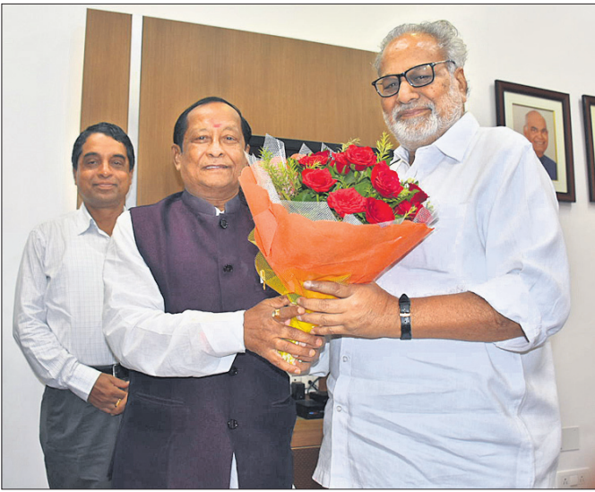
ରାଜଭବନରେ ରାଜ୍ୟପାଳ ପ୍ରଫେସର ଗଣେଶୀ ଲାଲଙ୍କୁ ସୌଜନ୍ୟମୂଳକ ସାକ୍ଷାତ୍ କରୁଛନ୍ତି ବାଚସ୍ପତି ସୂର୍ଯ୍ୟ ନାରାୟଣ ପାତ୍ର।

ଭୁବନେଶ୍ୱର, ୩।୬(ବୁଧବେ) ଓଡ଼ିଶା ଷୋଡ଼ଶ ବିଧାନସଭାର ନବନିର୍ବାଚିତ ବାଚସ୍ପତି ସୂର୍ଯ୍ୟ ନାରାୟଣ ପାତ୍ର ରାଜ୍ୟପାଳ ପ୍ରଫେସର ଗଣେଶୀ ଲାଲଙ୍କୁ ରାଜଭବନରେ ସୌଜନ୍ୟମୂଳକ ସାକ୍ଷାତ୍ କରିଛନ୍ତି। ବାଚସ୍ପତି ପାତ୍ର ବିଧାନସଭା କାର୍ଯ୍ୟ ପରିଚାଳନାରେ ରାଜ୍ୟପାଳଙ୍କ ସହଯୋଗ ଓ ମାର୍ଗଦର୍ଶନ କାମନା କରିଥିଲେ। ରାଜ୍ୟପାଳ ପ୍ରଫେସର ଲାଲ ପାତ୍ରଙ୍କୁ ଶୁଭେଚ୍ଛା ଓ ଅଭିନନ୍ଦନ ଜଣାଇବା ସହ ତାଙ୍କର ଦୀର୍ଘ ଅଭିଜ୍ଞତା ଓ ଉପଲବ୍ଧି ଗୃହ ପରିଚାଳନାରେ ବେଶ୍ ସହାୟକ ହେବ ବୋଲି ଆଶା ପ୍ରକାଶ କରିଥିଲେ। ପ୍ରାୟ ୩୦ ମିନିଟ୍ ଧରି ଆଲୋଚନାରେ ଉଭୟ ରାଜ୍ୟର ବିଭିନ୍ନ ଗୁରୁତ୍ୱପୂର୍ଣ୍ଣ ପ୍ରସଙ୍ଗ ସଂପର୍କରେ ଭାବବିନିମୟ କରିଥିଲେ। ବିଧାନସଭାର ମର୍ଯ୍ୟଦା ଓ କ୍ରିୟାଶୀଳତା ସଂପର୍କରେ ଗୁରୁତ୍ୱ ଆରୋପ କରିବାକୁ ରାଜ୍ୟପାଳ ପ୍ରଫେସର ଲାଲ ବାଚସ୍ପତିଙ୍କୁ