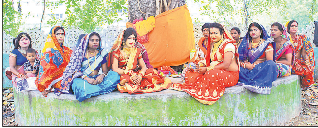
ମଦନମୋହନ ମନ୍ଦିରଠାରେ କିରମମାନେ ସାବିତ୍ରୀ ବ୍ରତ ପାଳୁଛନ୍ତି।