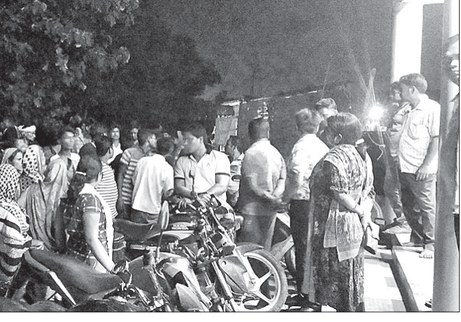
ଗ୍ରାମବାସୀ ନର୍ସିଂହୋମ ଘେରାଇ କରିଛନ୍ତି।

ଅନୁଗୋଳ ଅଧିକାରୀ, ୩୬ ଅନୁଗୋଳ ସହର ଉପକଣ୍ଠରେ ଥିବା ଏକ ନର୍ସିଂହୋମର ଶୌଚାଳୟ ପାଣି ନିକଟ ଗାଁ ମଝି ଦେଇ ଛଡ଼ାଯାଉଥିବା ବେଳେ ତାହା ଲିଙ୍ଗରାୟୋଡ଼ି ଯୋରକୁ ପ୍ରବେଶ କରୁଥିବା ଗ୍ରାମବାସୀ ଅଭିଯୋଗ କରିଛନ୍ତି। ଉକ୍ତ ଯୋରର ପାଣିକୁ ଲୋକମାନେ ପାନୀୟ ଭାବେ ବ୍ୟବହାର କରୁଥିବାରୁ ନର୍ସିଂହୋମର ଏପରି କାର୍ଯ୍ୟକୁ ନେଇ ଗ୍ରାମରେ ତୀବ୍ର