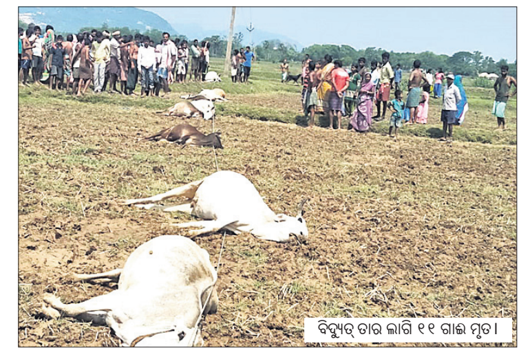
ବିଦ୍ୟୁତ୍ ତାର ଲାଗି ୧୧ ଗାଈ ମୃତ

ଉତ୍ତରପ୍ରଦେଶ ଗ୍ରାମବାସୀଙ୍କ ପକ୍ଷରୁ ରାସ୍ତାରେକୋ ସକନାଗଡ଼, ୩।୬(ଡି.ଏନ.ଏ.) ଝଡ଼ପଦନ ଓ ବର୍ଷା ଫଳରେ ରବିବାର ରାତିରେ ବାଲେଶ୍ୱର ଜିଲ୍ଲା ନାକଗିରି ଥାନା ନରସିଂହପୁର ପଞ୍ଚାୟତର ଓଲଟିଲି ଗ୍ରାମର ଗଣକମ୍ପରେ ୧୧ କେଡି ବିଦ୍ୟୁତ୍ ତାର ଛିଣ୍ଡି ପଡିଥିଲା। ଏ ବିଷୟରେ ବିଦ୍ୟୁତ୍ ବିଭାଗ କୌଶିକୀ ସୂଚନା ପାଇପାରି ନ ଥିଲା। ସୋମବାର ପୂର୍ବାହ୍ନରେ ଗଣକମ୍ପ ଚରିବା ପାଇଁ ଯାଇଥିବା ଗୋରୁପଲ ଛିଣ୍ଡି ପଡିଥିବା ବିଦ୍ୟୁତ୍ ତାର ସଂସ୍ପର୍ଶରେ ଆସିଥିଲେ। ଏଥିରେ ୧୧ଟି ଗାଈ ମୃତ୍ୟୁବରଣ କରିଛନ୍ତି। ଏଭଳି ଦୁର୍ଘଟଣାକୁ ନେଇ ସ୍ଥାନୀୟ ଅଞ୍ଚଳରେ ତୀବ୍ର ଉତ୍ତେଜନା ପ୍ରକାଶ ପାଇଛି। ଲୋକେ ଶେରଗଡ଼-ନାକଗିରି ରାସ୍ତା ଅବରୋଧ କରି ଯାତ୍ରୀମାନଙ୍କୁ ଦାବି କରିବା ସହ ବିଦ୍ୟୁତ୍ ବିଭାଗ ବିରୋଧରେ କାର୍ଯ୍ୟାଳୟର ଦାବି କରିଛନ୍ତି। ଆନ୍ଦୋଳନକାରୀ ଗ୍ରାମବାସୀ କହିଛନ୍ତି ଯେ, ସେମାନେ ସୋମବାର ପୂର୍ବାହ୍ନରେ ଦୂର୍ଘଟଣା ସମ୍ପର୍କରେ ବିଦ୍ୟୁତ୍ ବିଭାଗକୁ ଫୋନ୍ କରିଥିଲେ। କିନ୍ତୁ କେହି ଫୋନ୍