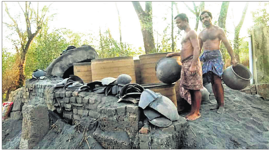
ଫନୀ ଯୋଗୁ ଭାଙ୍ଗିଯାଇଥିବା କୁସାରକ ମାଟିଆଣି ଶାଳ ।

ହସ୍ତଶିଳ୍ପର ବିକାଶ ପାଇଁ ପ୍ରତିବର୍ଷ ଯୋଜନା ପରେ ଯୋଜନା ପ୍ରଣୟନ କରାଯାଉଛି । ହେଲେ ଗ୍ରାମାଞ୍ଚଳରେ ଥିବା କାରିଗରଙ୍କ ନିକଟରେ ଯୋଜନାର ସୁଯୋଗ ପହଞ୍ଚିପାରୁ ନାହିଁ । ଯଦ୍ୱାରା ଯୋଜନା ମାଧ୍ୟମରେ କର୍ମନିଯୁକ୍ତି ସୃଷ୍ଟି ହେବା ତ ଦୂରର କଥା ଜ୍ରମଶଃ ଏହା ସଙ୍କୁଚିତ ହେବାରେ ଲାଗିଛି । ଏହାସହ ପ୍ରକାଶକରା ବାତ୍ୟା ଫନୀ ଯାଜପୁର ଜିଲାର ହସ୍ତଶିଳ୍ପ କାରିଗରଙ୍କ ବୋଧେ ଉପରେ ନିଜର ବିତ୍ତୀୟ ସମସ୍ତ ହୋଇଛି । ଜିଲାର ଶିଳ୍ପକେନ୍ଦ୍ର କାର୍ଯ୍ୟାଳୟରୁ ମିଳିଥିବା ସୂଚନା ଅନୁଯାୟୀ, ପ୍ରଥମ ପର୍ଯ୍ୟାୟରେ ଜିଲାର ୧୧୮୬ଜଣ ହସ୍ତଶିଳ୍ପ କାରିଗର ବ୍ୟାପକ କ୍ଷୟକ୍ଷତିରୀ ସମ୍ମୁଖୀନ ହୋଇଛନ୍ତି । ବାତ୍ୟା ଫନୀକୁ ମାସେ ବିତାଯାଇଥିଲେ ହେଁ କ୍ଷତିଗ୍ରସ୍ତ ହସ୍ତଶିଳ୍ପ କାରିଗର ଏଯାବତ୍ କୌଣସି ସରକାରୀ ସହାୟତା ପାଇନାହାନ୍ତି । ଏପରି କି ବିଭାଗ ପକ୍ଷରୁ ସର୍ବେ କାର୍ଯ୍ୟ ଶେଷ ହୋଇ ନ ଥିବାରୁ ହସ୍ତଶିଳ୍ପ କାରିଗରଙ୍କ ମଧ୍ୟରେ ଉଦ୍‌ବେଗ ପ୍ରକାଶ ପାଇଛି ।