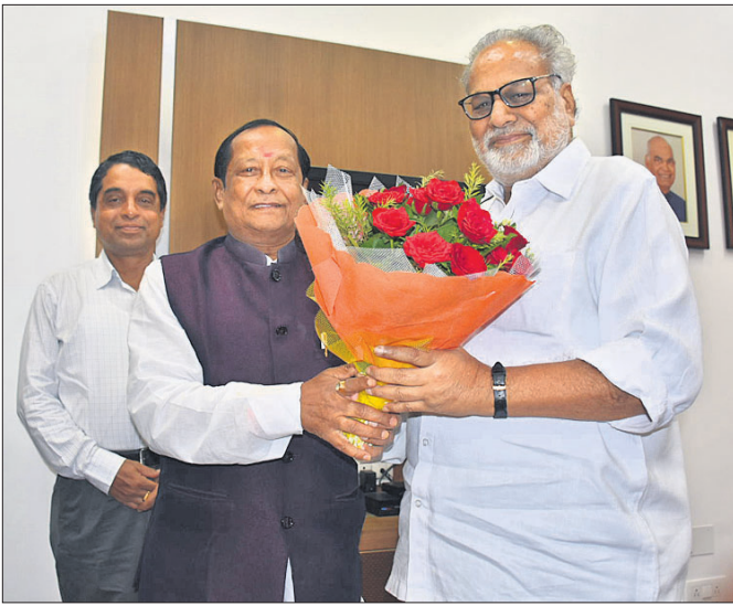
ରାଜଭବନରେ ରାଜ୍ୟପାଳ ପ୍ରଫେସର ଗଣେଶୀ ଲାଲଙ୍କୁ ସୌଜନ୍ୟମୂଳକ ସାକ୍ଷାତ୍ କରୁଛନ୍ତି ବାଚସ୍ପତି ସୂର୍ଯ୍ୟ ନାରାୟଣ ପାତ୍ର।

ଭୁବନେଶ୍ୱର, ୩।୬(ବୁଧବେ) ଓଡ଼ିଶା ଷୋଡ଼ଶ ବିଧାନସଭାର ନବନିର୍ବାଚିତ ବାଚସ୍ପତି ସୂର୍ଯ୍ୟ ନାରାୟଣ ପାତ୍ର ରାଜ୍ୟପାଳ ପ୍ରଫେସର ଗଣେଶୀ ଲାଲଙ୍କୁ ରାଜଭବନରେ ସୌଜନ୍ୟମୂଳକ ସାକ୍ଷାତ କରିଛନ୍ତି। ବାଚସ୍ପତି ପାତ୍ର ବିଧାନସଭା କାର୍ଯ୍ୟ ପରିଚାଳନାରେ ରାଜ୍ୟପାଳଙ୍କ ସହଯୋଗ ଓ ମାର୍ଗଦର୍ଶନ କାମନା କରିଥିଲେ। ରାଜ୍ୟପାଳ ପ୍ରଫେସର ଲାଲ୍ ପାତ୍ରଙ୍କୁ ଶୁଭେଚ୍ଛା ଓ ଅଭିନନ୍ଦନ ଜଣାଇବା ସହ ତାଙ୍କର ଦୀର୍ଘ ଅଭିଜ୍ଞତା ଓ ଉପଲବ୍ଧି ଗୃହ ପରିଚାଳନାରେ ବେଶ୍ ସହାୟକ ହେବ ବୋଲି ଆଶା ପ୍ରକାଶ କରିଥିଲେ। ପ୍ରାୟ ୩୦ ମିନିଟ୍ ଧରି ଆଲୋଚନାରେ ଉଭୟ ରାଜ୍ୟର ବିଭିନ୍ନ ଗୁରୁତ୍ୱପୂର୍ଣ୍ଣ ପ୍ରସଙ୍ଗ ସଂପର୍କରେ ଭାବନିମୟ କରିଥିଲେ। ବିଧାନସଭାର ମର୍ଯ୍ୟାଦା ଓ କ୍ରିୟାଶୀଳତା ସଂପର୍କରେ ଗୁରୁତ୍ୱ ଆରୋପ କରିବାକୁ ରାଜ୍ୟପାଳ ପ୍ରଫେସର ଲାଲ୍ ବାଚସ୍ପତିଙ୍କୁ