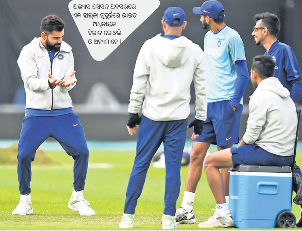
ଅଭ୍ୟାସ ସେସନ ଅବସରରେ ଏକ ହାଲୁକା ମୁହୂର୍ତ୍ତରେ ଭାରତ ଅଧିନାୟକ ବିରାଟ କୋହଲି ଓ ଅନ୍ୟମାନେ ।