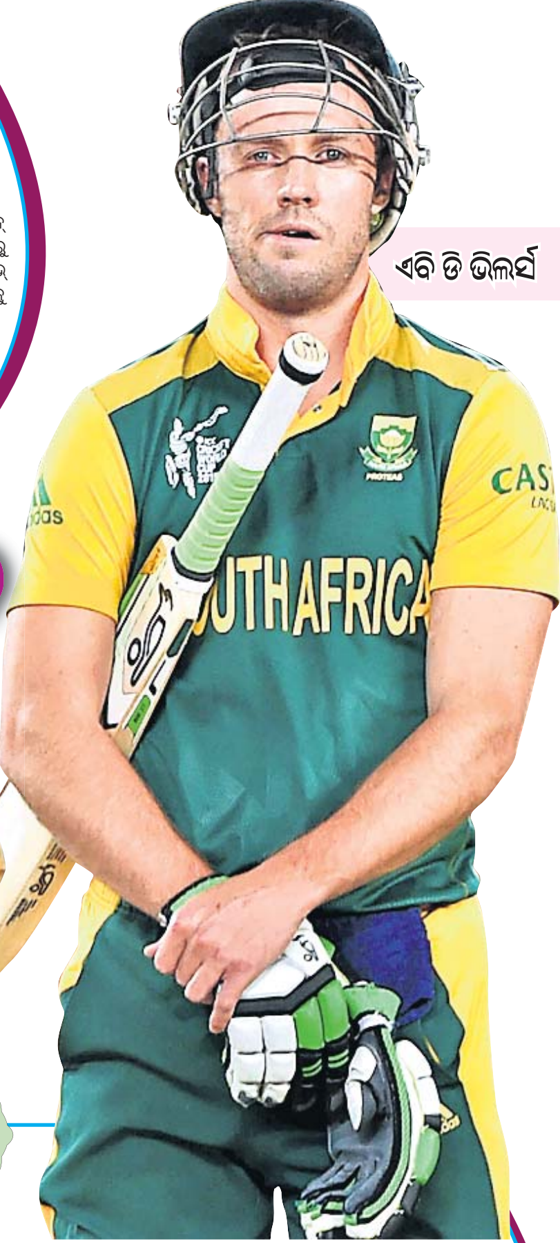
ଏବି ଡି ଭଲର୍ସ

କ୍ରିକେଟ୍ ବିଶ୍ୱକପ୍ ଇତିହାସରେ ପ୍ରଥମ ବ୍ୟାଟ୍ସମ୍ୟାନ ଭାବେ ଦକ୍ଷିଣ ଆଫ୍ରିକାର ବିଶ୍ୱୋତ୍ତମ ବ୍ୟାଟ୍ସମ୍ୟାନ ହର୍ଶେଲ ଗିରୁ ଗୋଟିଏ ଓଭରରେ ୬ଟି ଛକା ମାରିବାର ବିରଳ କୃତ୍ତି ହୋଇଥିଲେ । ୨୦୦୭ ବିଶ୍ୱକପ୍ରେ ନେଦରଲାଣ୍ଡ ବିପକ୍ଷ ମ୍ୟାଚ୍ରେ ଗିରୁ ଏହି ସଫଳତା ପାଇଥିଲେ । ପ୍ରଥମେ ବ୍ୟାଟିଂ କରି ଦକ୍ଷିଣ ଆଫ୍ରିକା ୨୯ ଓଭରରେ ୨ ଉଇକେଟ୍ ହରାଇ ୧୭୮ ରନ କରିଥିଲା । ନେଦରଲାଣ୍ଡ ଲେଫ୍-ସ୍ପିନ୍ନର ଡାନ୍ ଡାନ୍ ବଙ୍ଗ ଇନିଂସର ୩୦ତମ ଓଭର ବୋଲିଂ କରିବାକୁ ଆସିଥିଲେ । ସେତେବେଳେ ଗିରୁ ୩୦ ବଲ୍ ୩୨ ରନ୍ କରି ସ୍ତମ୍ଭକ କରୁଥିଲେ । ଡାନ୍ ବଙ୍ଗ ପ୍ରଥମ ୩ଟି ବଲ୍କୁ ଗିରୁ ଯଥାକ୍ରମେ ଲଙ୍ଗଅନ୍, ସ୍ପେର୍ ଡ୍ରାଇଭ୍ ଓ ଲଙ୍ଗ ଅଫ୍ ଉପରେ ଲଫ୍ଟିଂ କରି ଛକା ମାରିଥିଲେ । ଏହାପରେ ୪ର୍ଥ ବଲ୍କୁ ଡାନ୍ ଡାନ୍ ଉପକ୍ରମ ପକାଇବାକୁ ଚେଷ୍ଟା କରିଥିବାବେଳେ ଏହା ଫୁଲଚର୍ଚ୍ଚ ହୋଇଥିଲା ଏବଂ ଗିରୁ ଏହାକୁ ମିଡ୍ ଉଇକେଟ୍ ଉପରେ ବାଉଣ୍ଡରି ବାହାରକୁ ପଠାଇ ଦେଇଥିଲେ । ଅସହାୟ ହୋଇପଡ଼ିଥିବା ଡାନ୍ ବଙ୍ଗ ପରବର୍ତ୍ତୀ ୨ଟି ବଲରେ ବିଶାଳ ଛକା କରିଥିଲେ ଗିରୁ । ଫଳରେ ଓଭରକୁ ୩୬ ରନ୍ ସଂଗ୍ରହ ହୋଇଥିଲା । କ୍ୟାନ୍ କାଲିସ (୧୨୮)ଙ୍କ ଶତକ ଏବଂ ଗିରୁ (୪୦ ବଲ୍ ୬୨ ରନ୍) ଓ ମାର୍କ ବାଉଟର (୩୧ ବଲ୍ ୬୪ ରନ୍)ଙ୍କ ଉପଯୋଗୀ ଇନିଂସ ବଳରେ ଦକ୍ଷିଣ ଆଫ୍ରିକା ୪୦ ଓଭରରେ ୩ ଉଇକେଟ୍ରେ ୩୫୩ ରନ କରିଥିଲା । ନେଦରଲାଣ୍ଡ ୪୦ ଓଭରରେ ୯ ଉଇକେଟ୍ରେ ୧୩୯ ରନ କରିପାରିଥିଲା ।