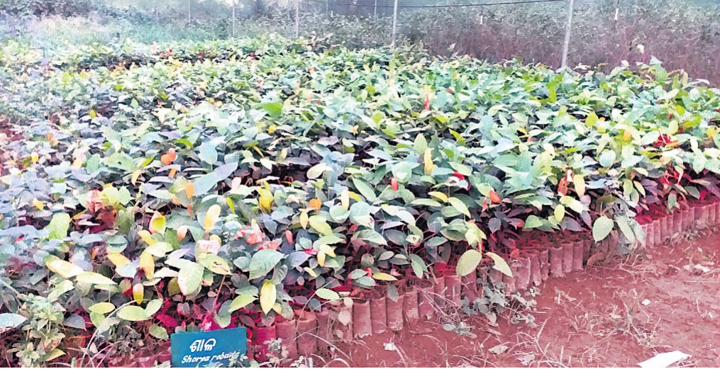
ନର୍ସରୀରେ ଥିବା ଚାରା ।

ଭଞ୍ଜନଗର, ୪୬ (ଡି.ଏନ୍.ଏ.) ଜନସଂଖ୍ୟା, ଜଳ କାରଖାନା ବୁଦ୍ଧି ଆଦି ପ୍ରମୁଖ କାରଖାନା ଦିନକୁ ଦିନ ପରିବେଶ ପ୍ରଦୂଷଣମାତ୍ରା ବଢ଼ିବାରେ ଲାଗିଛି । ଯାହାକି ଚିନ୍ତାଜନକ ବିଷୟ । ଏହାର ପୂଜାବିଳା କରିବା ନିମନ୍ତେ ଲୋକେ ସଚେତନ ହେବା ଆବଶ୍ୟକ । ଏଥିସହ ଜଙ୍ଗଲ ସୁରକ୍ଷା ଓ ନୂଆ ଜଙ୍ଗଲ ସୃଷ୍ଟି କରିବା ଜରୁରୀ । ନଚେତ ଆଗାମୀ ପିଢ଼ା ଅନେକ ଅସୁବିଧାର ସମ୍ମୁଖୀନ ହେବେ । କୁନ୍ଦ ୫ ଚାରିଖ ବିଶ୍ୱ ପରିବେଶ ଦିବସ ଭାବେ ପାଳନ କରାଯାଉଛି । ରୁଧିରା ଜଙ୍ଗଲ ଓ ପରିବେଶ ମନ୍ତ୍ରାଳୟ, ସମେତ ବିଭିନ୍ନ ଅନୁଷ୍ଠାନ ପକ୍ଷରୁ ଏହି ଦିବସ ପାଳନ କରାଯିବ । ହେଲେ ପରିବେଶ ସୁରକ୍ଷା ପ୍ରତି ଯେଉଁ ଆଗ୍ରହ ସୃଷ୍ଟି ହେବା କଥା ତାହା ହେଉନାହିଁ । ଯୋଜନାବିହୀନ ଭାବେ ଚାରୋଟିଠାରେ ହେଉଛି ଗାଧୁ ସଂପ୍ରଦାୟର ହେବାପରେ ପୁରୁଣା ଗଛ କାଟି ଦିଆଯାଇଛି । ନୂଆ ଯୋଜନାରେ ଚାରୋଟିଠାରେ ହେଉଥିଲେ ମଧ୍ୟ ଉପଯୁକ୍ତ ରକ୍ଷାକର୍ମକ୍ଷମ କରାଯାଇନାହିଁ । ଲୋକଙ୍କ ମଧ୍ୟରେ ସଚେତନତା ଅଭାବ ଏବଂ କିଛି ନ୍ୟୁନତା କର୍ମଚାରୀଙ୍କ ପାଇଁ ଯୋଜନା ଦିନହରା ହୋଇଯାଉଛି । ଯେଉଁ କର୍ମଚାରୀ ଏବଂ ଲୋକେ ନିଷ୍ପାର୍ଥକ ଭାବେ କାମ କରୁଛନ୍ତି, ସେଠାରେ ଅଧିକାଂଶ ଗଛ ସୁରକ୍ଷିତ ରହୁଛି । ଅନ୍ୟପକ୍ଷରେ ବାଟା