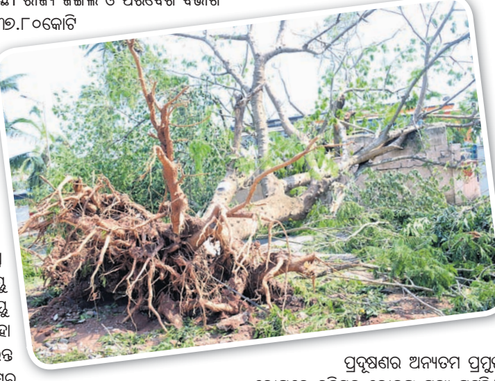
ଗଛ ବିନା ତାପମାତ୍ରା ବୃଦ୍ଧିକୁ ଅନୁଭବ କଲେଣି ବାତ୍ୟା ପ୍ରଭାବିତ ଅଞ୍ଚଳର ଲୋକେ । ବାତ୍ୟା ପରଠାରୁ ଲୋକେ ଗରମରେ ଛଟପଟ ହେଉଥିବାବେଳେ ପୃଷ୍ଠଭୂମିକୁ ଗଛ ନାହିଁ । ଛାଇ ବି ସମ୍ଭବ ପାଇନାହିଁ । ସେହିପରି ଗଛ ନ ଥିବାରୁ ବାୟୁ ପ୍ରଦୂଷଣ ମଧ୍ୟ ବୃଦ୍ଧି ପାଇବାରେ ଲାଗିଛି ।

ଗଛ ବିନା ତାପମାତ୍ରା ବୃଦ୍ଧିକୁ ଅନୁଭବ କଲେଣି ବାତ୍ୟା ପ୍ରଭାବିତ ଅଞ୍ଚଳର ଲୋକେ । ବାତ୍ୟା ପରଠାରୁ ଲୋକେ ଗରମରେ ଛଟପଟ ହେଉଥିବାବେଳେ ପୃଷ୍ଠଭୂମିକୁ ଗଛ ନାହିଁ । ଛାଇ ବି ସମ୍ଭବ ପାଇନାହିଁ । ସେହିପରି ଗଛ ନ ଥିବାରୁ ବାୟୁ ପ୍ରଦୂଷଣ ମଧ୍ୟ ବୃଦ୍ଧି ପାଇବାରେ ଲାଗିଛି । ବାୟୁ ପ୍ରଦୂଷଣକୁ ଗଛ ରୋକିଥାଏ ବୋଲି ଗାହା ସାଧାରଣ ଲୋକେ ସହଜରେ ଜାଣିପାରନ୍ତି ନାହିଁ । ତେଣୁ ଚଳିତ ବର୍ଷ ପରିବେଶ ଦିବସର ଥିମ୍ 'ବାୟୁ ପ୍ରଦୂଷଣ' । 'ଫନୀ' ଭଳି ବାତ୍ୟା ବାୟୁ ପ୍ରଦୂଷଣକୁ ଅନେକ ରୁଣ୍ଡି ବଢ଼େଇ ଦେଇଥାଏ । ଏବେ ଗାହାକୁ ଲୋକେ ଅନୁଭବ କରୁଛନ୍ତି । ଗଛର ପତ୍ର ବାୟୁରୁ ଧୂଳିକଣା ଓ ବିଷାକ୍ତ ଗ୍ୟାସକୁ ଗଣିନେଇ ପରିବେଶକୁ ସ୍ୱଚ୍ଛ କରିଥାଏ । ଫଳରେ ରାସ୍ତାକଡ଼ରେ ରହିଥିବା ଗଛଗୁଡ଼ିକର ପତ୍ର ସମ୍ପୂର୍ଣ୍ଣ ସବୁଜ ଦେଖା ନ ଯାଇ ଲକ୍ଷ୍ୟତ ଲାଲ ବା ଗେରୁଆ ରଙ୍ଗର ଦେଖାଯାଏ । କେତେ ସ୍ଥାନରେ ଲକ୍ଷ୍ୟତ କଳା ବା