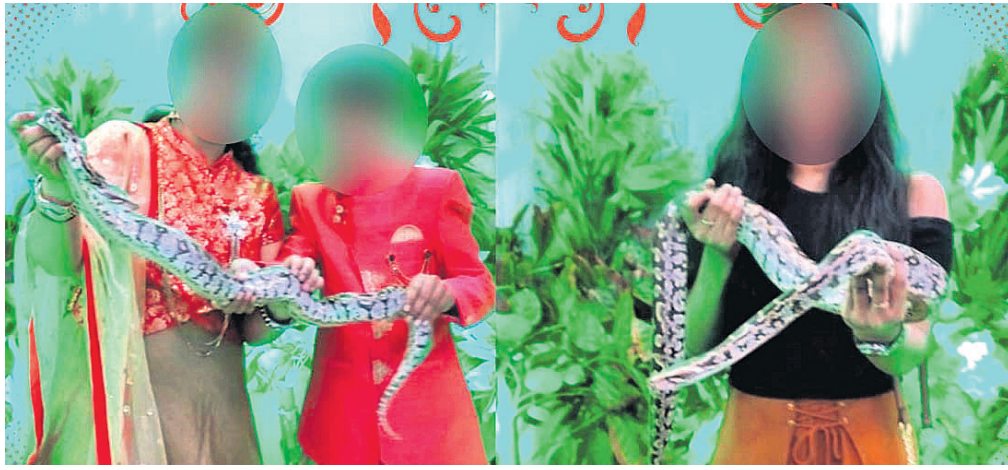
ଛୋଟ ପିଲାଙ୍କ ହାତରେ ଅଜଗର ସାପ ।

ବନ୍ୟପ୍ରାଣୀ ଏବଂ ସଂରକ୍ଷିତ ପ୍ରାଣୀମାନଙ୍କ ସୁରକ୍ଷା ଏବଂ ସଂରକ୍ଷଣ ପାଇଁ ବହୁ ଆଇନ୍ ରହିଛି । ବିଭିନ୍ନ ସରକାରୀ ଏବଂ ବେସରକାରୀ ସଂଗଠନ ମଧ୍ୟ ଏହି ଆଇନକୁ ଉଲ୍ଲଙ୍ଘନ କରୁଛି । ହେଲେ ଏହି ଆଇନକୁ ଉଲ୍ଲଙ୍ଘନ କରୁଥିବା ବ୍ୟକ୍ତି ଏବଂ ସଂଗଠନ ସଂଖ୍ୟା ମଧ୍ୟ କମ୍ ହୁଏ । ବ୍ରହ୍ମପୁରରେ ଦେଖିବାକୁ ମିଳିଛି ଏହାର ନମୁନା । ସହରର ଏକ ଇଡ଼େଫ୍ଟ ମ୍ୟାନେଜମେଣ୍ଟ କମ୍ପାନୀ ସହରବାସୀଙ୍କୁ ଆକୃଷ୍ଟ କରିବା ପାଇଁ ଏକ ଅଜଗର କାର୍ଯ୍ୟକ୍ରମ ଆୟୋଜନ କରୁଛି । କାର୍ଯ୍ୟକ୍ରମର ନାମ ରହିଛି 'ଫଟୋ ଉଇଥ୍ ଅଜଗର' (ଅଜଗର) । ଦୀର୍ଘ ଉନେକ ଦିନ ହେଲା ଏକକି ଦେଖାଇ କାର୍ଯ୍ୟକ୍ରମ ସହରର ବିଭିନ୍ନ ସ୍ଥାନରେ ଆୟୋଜନ ହେଉଛି । ହେଲେ ପ୍ରଶ୍ନାତ୍ମକ ପଦକ୍ଷେପ ନେବାକୁ ଚାହୁଁଛନ୍ତି । ତରଫରୁ ଏହାକୁ ରୋକିବା ଦିଗରେ ପଦକ୍ଷେପ କିମ୍ବା କମ୍ପାନୀ ବିରୋଧରେ କୌଣସି କାର୍ଯ୍ୟାନୁଷ୍ଠାନ ନିଆଯାଇନାହିଁ । ଫଳରେ ଏବେ ସମସ୍ତ କମ୍ପାନୀ ତରଫରୁ ଖୁଲିମଖୁଲି ଏହି କାର୍ଯ୍ୟକ୍ରମ ସମ୍ପର୍କରେ ପ୍ରଚାର କରାଯାଉଛି ।