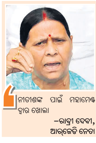
ନୀତୀଶଙ୍କ ପାଇଁ ମହାମେଣ୍ଟ ଦ୍ୱାର ଖୋଲା -ରାମ୍ରା ଦେବୀ, ଆରଜେଡି ନେତା

ସେହିପରି ହିନ୍ଦୁସ୍ଥାନୀ ଆଡ଼ାମ୍ ମୋର୍ଡା ପାଇଁ (ଏସ୍.ଏ.ଏମ୍.) ଅଧ୍ୟକ୍ଷ ତଥା ପୂର୍ବତନ ମୁଖ୍ୟମନ୍ତ୍ରୀ ଜିତେନ୍ଦ୍ରାମ ମାଞ୍ଜି ମଧ୍ୟ ନୀତୀଶଙ୍କ ଆଡ଼କୁ ଅଗ୍ରସର ହେଉଥିବା ଦେଖିବାକୁ ମିଳିଛି। ସୋମବାର ମାଞ୍ଜିଙ୍କ ଇଫ୍‌ଟାରେ ପାର୍ଟିରେ ନୀତୀଶଙ୍କ ଉପସ୍ଥିତି ଓ ପରମ୍ପରାକୁ ପ୍ରଶଂସା ଏହାର ସକ୍ଷେପ ଦେଇଛି। ଜେଡିୟୁ ମୁଖ୍ୟ ୪ ବର୍ଷ ତଳେ ତାଙ୍କୁ ଦଳକୁ ବାହାର କରିବାକୁ ନେଇ ମତଭେଦ ରହିଛି। କିନ୍ତୁ ସେବେଳୁ ରାଜନୀତିରେ ଅନେକ ପାର୍ଶି ବହିରାଢ଼ି