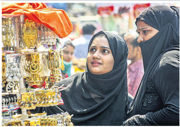
ଇନ୍-ଭଲ୍-ଫିଟର ଅଧ୍ୟବସ୍ଥିତ ପୂର୍ବରୁ ବାରାଣସୀର ଏକ ଦୋକାନରେ କିଣାକିଣି କରୁଛନ୍ତି ପୁସଲିମ୍ ମହଲ।