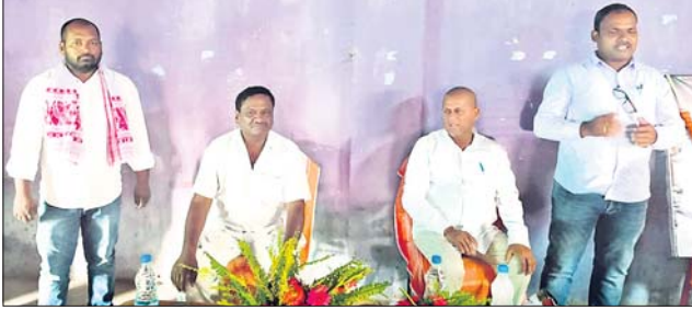
ରାଜକିଆରେ ଅନୁଷ୍ଠିତ ସମର୍ଥନ ସଭାରେ ଉପସ୍ଥିତ ଏମ୍ପି, ବିଧାୟକ ଓ ଅନ୍ୟମାନେ।

ଜି.ଉଦୟଗିରି/ଶଙ୍କରାଖୋଳ/ରାଜକିଆ, ୪.୧୬ (ଡି.ଏନ.ଏ.)