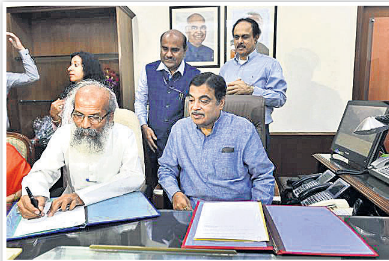
ନୂଆଦିଲ୍ଲୀରୁ ଉଦ୍ୟୋଗ ଭବନରେ ଏମ୍.ଏସ୍.ଏମ୍.ସି. ମନ୍ତ୍ରୀ ନାଟିନ ଗଡ଼କରାଙ୍କ ସହ ରାଷ୍ଟ୍ରମନ୍ତ୍ରୀ ପ୍ରତାପ ଚନ୍ଦ୍ର ଷଡ଼ଙ୍ଗୀ ମନ୍ତ୍ରଣାଳୟର ଦାୟିତ୍ୱ ଗ୍ରହଣ କରୁଛନ୍ତି।