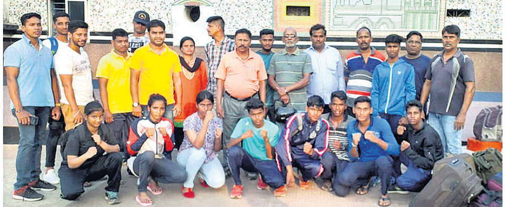
କୋଚ୍‌କ ଗହଣରେ ଖେଳାଳିମାନେ ।

ବ୍ରହ୍ମପୁର ଅଫିସ୍, ୪.୬ ଉତ୍ତରାଖଣ୍ଡର ରୁଡ଼ପୁରରେ ଆସନ୍ତା ୮ରୁ ୧୩ତାରିଖ ପର୍ଯ୍ୟନ୍ତ ଚତୁର୍ଥ ଲାଡ଼ାୟ ମୁକ୍ତ ପୁରୁଷ ଏବଂ ମହିଳା ବକ୍ସିଂ ଚାମ୍ପିୟନସ୍‌ସିପ୍ ଅନୁଷ୍ଠିତ ହେବ । ଏଥିରେ ଭାଗନେବା ପାଇଁ ଓଡ଼ିଶା ଦଳର ଚୟନ ଶିବିର ଗତ ରବିବାର, ବ୍ରହ୍ମପୁର ଷ୍ଟାଡ଼ିୟମରେ ଆୟୋଜିତ ହୋଇଥିଲା । ୧୬ଜଣିଆ ପୁରୁଷ ଏବଂ ମହିଳା ଦଳ ଚୟନ କରାଯାଇଥିବା