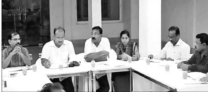
ସମାକ୍ଷା ବୈଠକରେ ପର୍ଯ୍ୟଟନ ମନ୍ତ୍ରୀ, ଜିଲାପାଳ, ଏନପି ଓ ବିଧାୟକ।