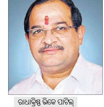
ରାଧାକ୍ରିଷ୍ଣ ଭିକେ ପାଟିଲ୍