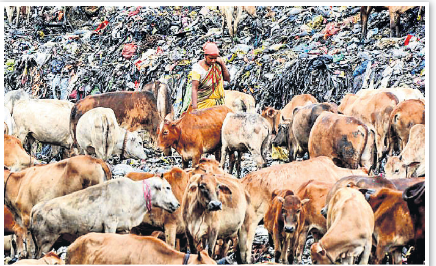
ଗୁଆହାଟୀର ବାରାଗଠିସ୍ଥିତ ଏକ ଅଧିଆ ଗବାରେ ବ୍ୟବହାରଯୋଗ୍ୟ ସାମଗ୍ରୀ ସଂଗ୍ରହ କରୁଛନ୍ତି ଜଣେ ମହିଳା।