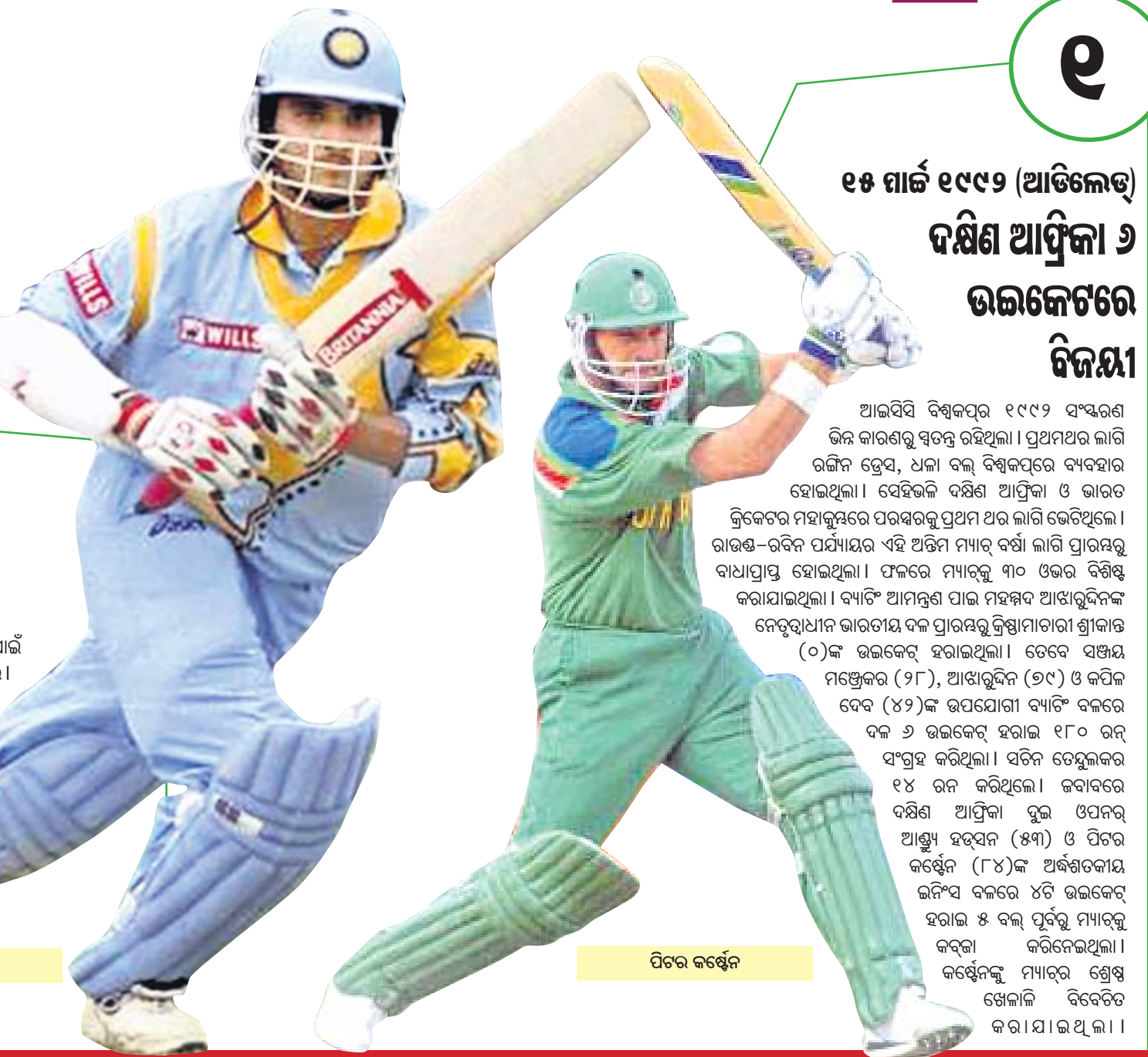
ସୌରଭ ଗାଙ୍ଗୁଲି ପିଟେ କର୍ଷେନ

୧୫ ମେ ୧୯୯୯ (ହୋଭ୍) ଦକ୍ଷିଣ ଆଫ୍ରିକା ୪ ଉଇକେଟରେ ବିଜୟୀ ସାତ ବର୍ଷର ବ୍ୟବଧାନ ପରେ ଦୁଇ ଦଳ ଲଂଲଣ୍ଡରେ ଅନୁଷ୍ଠିତ ୧୯୯୯ ବିଶ୍ୱକପରେ ପରସ୍ପରକୁ ୨ୟ ଥର ପାଇଁ ଭେଟିଥିଲେ । ଏହି ମ୍ୟାଚରେ ଚମ୍ପିୟନ୍ ଭାରତୀୟ ଅଧିନାୟକ ମହମ୍ମଦ ଆସ୍କରୁଦ୍ଦିନ ପ୍ରଥମେ ବ୍ୟାଟିଂ ନିଷ୍ପତ୍ତି ନେଇଥିଲେ । ପ୍ରାରମ୍ଭିକ ବ୍ୟାଟ୍ସମ୍ୟାନଙ୍କ ମିଳିତ ସଫଳତା ବଳରେ ଭାରତ ନିର୍ଦ୍ଧାରିତ ଓଭରରେ ୫ ଉଇକେଟ୍ ହରାଇ ୨୫୩ ରନ କରିଥିଲା । ଓପନିଂ କରିବାକୁ ଆସିଥିବା ସୌରଭ ଗାଙ୍ଗୁଲି ୯୭ ରନରେ ରନଆଉଟ୍ ହୋଇ ଶତକରୁ ବଞ୍ଚିତ ହୋଇଥିଲେ । ଅନ୍ୟମାନଙ୍କ ମଧ୍ୟରେ ସଚିନ ଚେନ୍ନୁଲକର ୨୮, ରାହୁଲ ଦ୍ରାଭିଡ଼ ୫୪, ଆଖ୍ଟାରୁଦ୍ଦିନ ୨୪, ଅଜୟ ଜାଡେଜା ୧୬ ରନ କରିଥିଲେ । ଲାଫ୍ଟ କୁଜନରକୁ ୩ଟି ଉଇକେଟ୍ ମିଳିଥିଲା । ଜବାବରେ ଦକ୍ଷିଣ ଆଫ୍ରିକା ପ୍ରାରମ୍ଭରୁ ହର୍ଶେଲ ଗିଟ୍ (୭) ଓ ଗ୍ୟାରି କ୍ରିଷ୍ଟେନ (୩)ଙ୍କ ଉଇକେଟ୍ ହରାଇଥିଲେ ମଧ୍ୟ ଜ୍ୟାକ୍ କାଲିସଙ୍କ ୯୬ ରନ ବଳରେ ୪୭.୨ ଓଭରରେ ୬ ଉଇକେଟ୍ ହରାଇ ଲକ୍ଷ୍ୟ ହାସଲ କରିଥିଲା । ଜଷ୍ଟି ରୋଡ୍ (୩୯), ମାର୍କ ବାଉଟର (୩୪) ଓ ଅଧିନାୟକ ହାସିମ କୋନ (୨୬)ଉପଯୋଗୀ ବ୍ୟାଟିଂ କରିଥିଲେ । ଭାରତୀୟ ଶ୍ରୀମାତ୍ମକ ୨ଟି ଉଇକେଟ୍ ମିଳିଥିଲା । କାଲିସଙ୍କୁ ଶ୍ରେଷ୍ଠ ଖେଳାଳି ପୁରସ୍କାର ପ୍ରଦାନ କରାଯାଇଥିଲା । ଦ୍ରାଭିଡ଼ ଏହି ଚୁନାବେଶର ସର୍ବାଧିକ ରନ୍ ସଂଗ୍ରହକାରୀ ବ୍ୟାଟ୍ସମ୍ୟାନ ରହିଥିଲେ ।