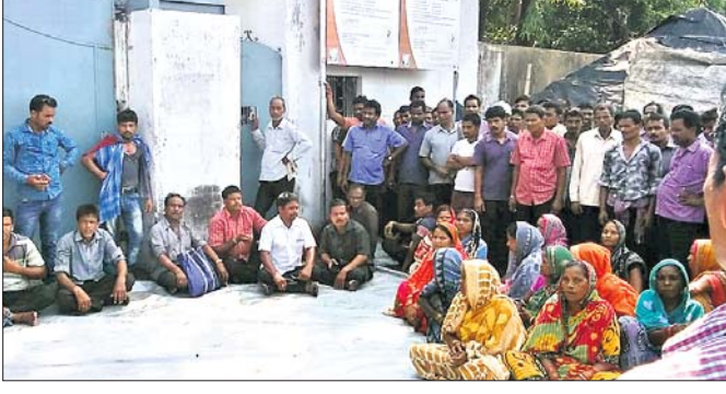
ଗୋଆ କାର୍ବନ କମ୍ପାନୀ ଆଗରେ ଧାରଣାର ଶ୍ରମିକ ଓ ଅନ୍ୟମାନେ।

ନାମ ରହିଲା ହେଉଛି ମିଲିୟନ। ରଥଯାତ୍ରାରୁ ହେବ କାର୍ଯ୍ୟକ୍ଷମ।