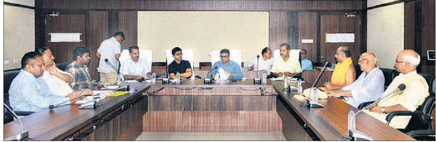
ବୈଠକରେ ଶ୍ରୀମନ୍ଦିର ପୁଣ୍ୟ ପ୍ରଶାସକ, ଜିଲ୍ଲାପାଳ ଏବଂ ଅନ୍ୟମାନେ।