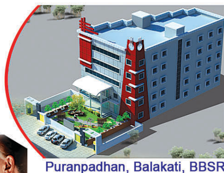
Puranpadhan, Balakati, BBSR