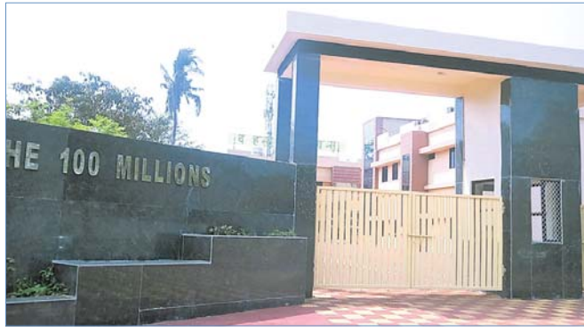
ନୂତନ ଭାବେ ନିର୍ମିତ ଅତିଥି ଭବନ ହେଉଛି ମିଲିୟନ।

ସୂଚନା ଓ ପ୍ରଯୁକ୍ତି ବିଦ୍ୟାର ପ୍ରସାର ପାଇଁ ଉନ୍ନତ ଶିକ୍ଷା ପ୍ରଦାନ କରାଯାଇଛି।