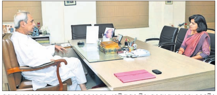
ମୁଖ୍ୟମନ୍ତ୍ରୀ ନବୀନ ପଟ୍ଟନାୟକଙ୍କ ସହ ଭୁବନେଶ୍ୱର ଏମ୍ପି ଅପରାଜିତା ଷଡ଼ଙ୍ଗୀ ଆଲୋଚନା କରୁଛନ୍ତି । ପାଇଁ ରାଜ୍ୟ ସରକାରଙ୍କ ଯାହା ଆବଶ୍ୟକ ପଦକ୍ଷେପ ଗ୍ରହଣ କରାଯାଇପାରେ ।

ଭୁବନେଶ୍ୱର ଭାଜପା ଏମ୍ପି ଅପରାଜିତା ଷଡ଼ଙ୍ଗୀ ପୁଣିଥରେ ନୂଆ ଅଞ୍ଚଳରେ କାର୍ଯ୍ୟ ଆରମ୍ଭ କରିଛନ୍ତି । ନିର୍ବାଚନ ପୂର୍ବରୁ ନିଜ ଲୋକ ସଭା ନିର୍ବାଚନପ୍ରକ୍ରିୟାକୁ ତ୍ୱରାନ୍ୱିତ କରିବା ପାଇଁ ଲୋକମାନଙ୍କୁ ବିଭିନ୍ନ ପ୍ରତିଶ୍ରୁତି ଦେଇଥିଲେ ।