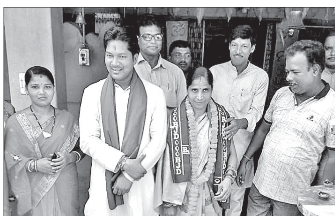
ବିଧାୟକଙ୍କ ସହ ଉପାଧ୍ୟକ୍ଷା ବ୍ଲକ ଅଧିକାରୀ ଯାଉଛନ୍ତି।