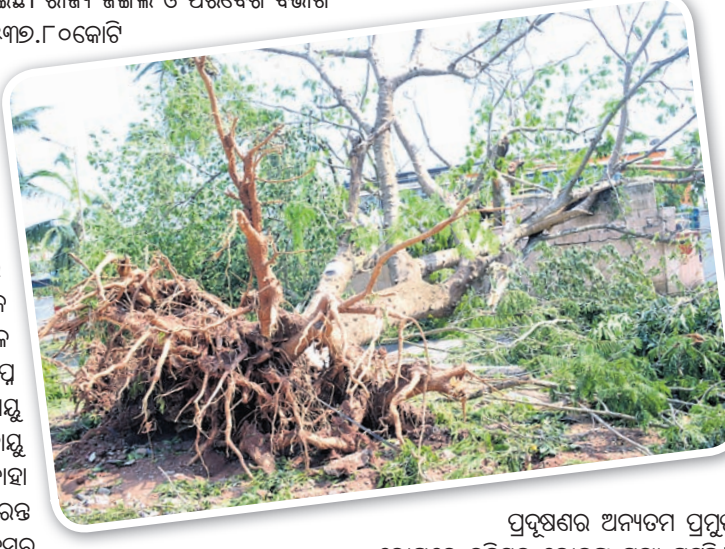
ଗଛ ବିନା ତାପମାତ୍ରା ବୃଦ୍ଧିକୁ ଅନୁଭବ କଲେଣି ବାତ୍ୟା ପ୍ରଭାବିତ ଅଞ୍ଚଳର ଲୋକେ। ବାତ୍ୟା ପରଠାରୁ ଲୋକେ ଗରମରେ ଛଟପଟ ହେଉଥିବାବେଳେ ପୃଷ୍ଠଭୂମିକୁ ଗଛ ନାହିଁ। ଛାଇ ବି ସମ୍ଭବ ପାଇନି। ସେହିପରି ଗଛ ନ ଥିବାରୁ ବାୟୁ ପ୍ରଦୂଷଣ ମଧ୍ୟ ବୃଦ୍ଧି ପାଇବାରେ ଲାଗିଛି।

ଗଛ ବିନା ତାପମାତ୍ରା ବୃଦ୍ଧିକୁ ଅନୁଭବ କଲେଣି ବାତ୍ୟା ପ୍ରଭାବିତ ଅଞ୍ଚଳର ଲୋକେ। ବାତ୍ୟା ପରଠାରୁ ଲୋକେ ଗରମରେ ଛଟପଟ ହେଉଥିବାବେଳେ ପୃଷ୍ଠଭୂମିକୁ ଗଛ ନାହିଁ। ଛାଇ ବି ସମ୍ଭବ ପାଇନି। ସେହିପରି ଗଛ ନ ଥିବାରୁ ବାୟୁ ପ୍ରଦୂଷଣ ମଧ୍ୟ ବୃଦ୍ଧି ପାଇବାରେ ଲାଗିଛି। ବାୟୁ ପ୍ରଦୂଷଣକୁ ଗଛ ରୋକିଥାଏ ବୋଲି ଚାହା ସାଧାରଣ ଲୋକେ ସହଜରେ ଜାଣିପାରନ୍ତି ନାହିଁ। ତେଣୁ ଚଳିତ ବର୍ଷ ପରିବେଶ ଦିବସର ଥମ୍ ଅଛି 'ବାୟୁ ପ୍ରଦୂଷଣ'। 'ଫନୀ' ଭଳି ବାତ୍ୟା ବାୟୁ ପ୍ରଦୂଷଣକୁ ଅନେକ ରୁଣି ବଢ଼େଇ ଦେଇଥାଏ। ଏବେ ଚାହାକୁ ଲୋକେ ଅନୁଭବରେ ଅନୁଭବ କଲେଣି। ଗଛର ପତ୍ର ବାୟୁରୁ ଧୂଳିକଣା ଓ ବିଷାକ୍ତ ଗ୍ୟାସକୁ ଗଣିନେଇ ପରିବେଶକୁ ସ୍ୱଚ୍ଛ କରିଥାଏ। ଫଳରେ ରାସ୍ତାକଡ଼ରେ ରହିଥିବା ଗଛଗୁଡ଼ିକର ପତ୍ର ସମ୍ପୂର୍ଣ୍ଣ ସବୁଜ ଦେଖା ନ ଯାଇ ଲକ୍ଷତ ଲାଲ ବା ଗେରୁଆ ରଙ୍ଗର ଦେଖାଯାଏ। କେତେ ସ୍ଥାନରେ ଲକ୍ଷତ କଳା ବା