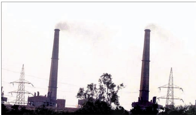
ଫସଲ ନଷ୍ଟ କରୁଛି ବିଷାକ୍ତ ଗ୍ୟାସ୍

ନବରତ୍ନ ରାଷ୍ଟ୍ରାୟତ୍ତ ଉଦ୍ୟୋଗ ନାଲକୋ ଯୋଗୁଁ ସ୍ଥାନୀୟ ଅଞ୍ଚଳବାସୀ ଅନେକ ସମୟରେ ପ୍ରଦୂଷଣରେ ଛଟପଟ ହେଉଥିବା ଅଭିଯୋଗ ହେଉଛି।