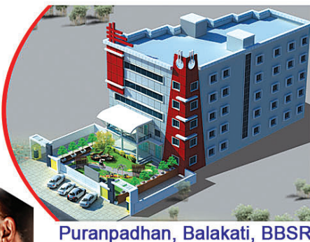
Puranpadhan, Balakati, BBSR