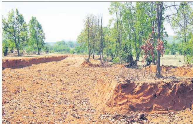
ଗଛ କଟାଯାଇ ଜଙ୍ଗଲ ଶୂନ୍ୟ।