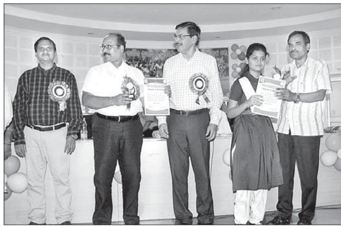
ପ୍ରଶାସନ ପକ୍ଷରୁ ଜଣେ ଛାତ୍ରୀଙ୍କୁ ସମର୍ଥନ କରାଯାଇଛି।