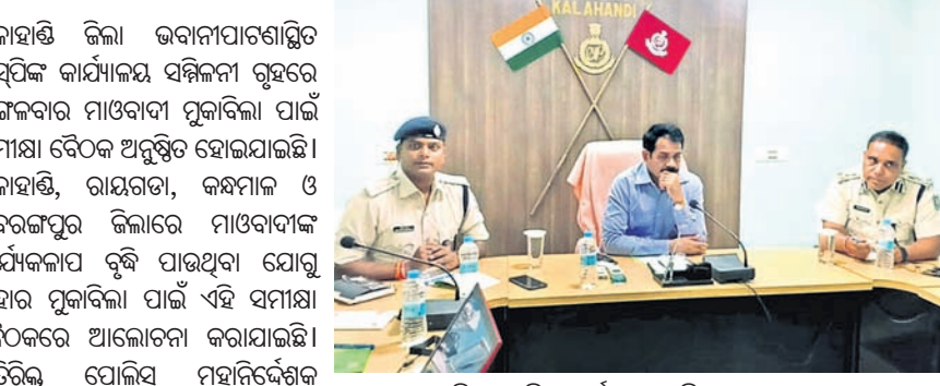
ଭବାନୀପାଟଣାରେ ଶ୍ରୀମନ୍ଦିର ମୁଖ୍ୟ ପ୍ରଶାସକଙ୍କ ସମ୍ମିଳନୀ ଗୃହଣେ ମାଓବାଦୀ ମୁକାବିଲା ପାଇଁ ସମୀକ୍ଷା ବୈଠକ।

କଳାହାଣ୍ଡି ଜିଲ୍ଲା ଭବାନୀପାଟଣାସ୍ଥିତ ଏସପିକ କାର୍ଯ୍ୟାଳୟ ସମ୍ମିଳନୀ ଗୃହଣେ ମାଓବାଦୀ ମୁକାବିଲା ପାଇଁ ସମୀକ୍ଷା ବୈଠକ ଅନୁଷ୍ଠିତ ହୋଇଯାଇଛି।