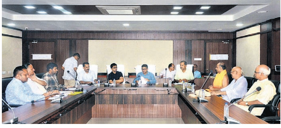
ବୈଠକରେ ଶ୍ରୀମନ୍ଦିର ମୁଖ୍ୟ ପ୍ରଶାସକ, ଜିଲାପାଳ ଏବଂ ଅନ୍ୟମାନେ।