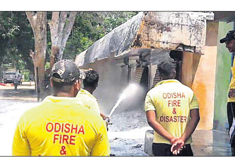
ଅଗ୍ନିଶମ କର୍ମଚାରୀ ନିଆଁକୁ ଆୟତ୍ତ କରୁଛନ୍ତି ।

ଭଦ୍ରକ ଅଫିସ୍, ୪୧୬: ଭଦ୍ରକ ସହର ବାଜପାସ୍ ବାସୀଙ୍କୁ ଆଶଙ୍କା ଥିବା ଆଭ୍ୟନ୍ତରୀଣ ମାର୍କେଟ୍ କମ୍ପ୍ଲେକ୍ସର ୩ଟି ତୁନ ଓ ଚୁଟି ଗୋଦାମରେ ମଙ୍ଗଳବାର ପୂର୍ବାହ୍ନରେ ଭୟାବହ ଅଗ୍ନିକାଣ୍ଡ ଘଟିଛି ।