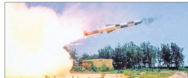
ବ୍ରହ୍ମୋସ ମିଲାଇଭ ସଫଳ ପରୀକ୍ଷଣ ।