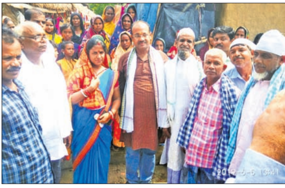
ଝିକିରିଆ ମୁଦାରକ ବସ୍ତ୍ରାବିଦ୍ୟାଳୟ ସହ ମନ୍ତ୍ରୀ।