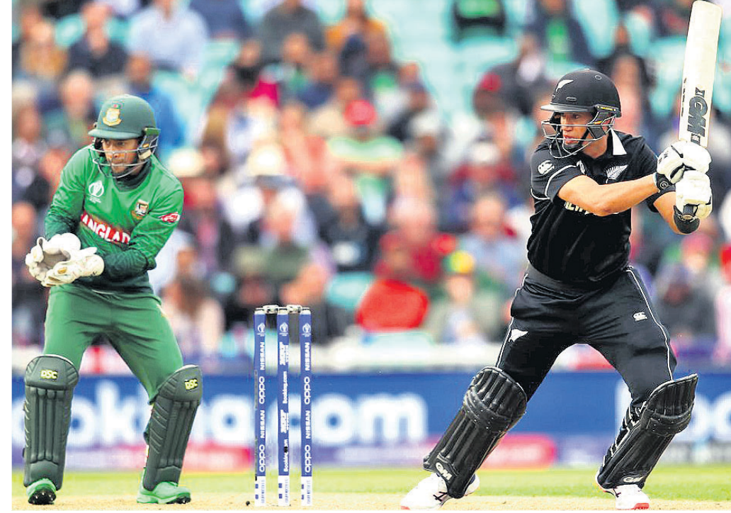
ମ୍ୟାଚ୍ ଅଫ୍ ଦି ମ୍ୟାଚ୍ ରସ୍ ଚେଲର।

ଅଷ୍ଟ୍ରେଲିଆ: ୪୯ ଓଭରରେ ୨୮୮/ଅଲଆଉଟ (କୁଲଟର ନାଲଲ-୯୨, ସ୍ଥି-୬୩, ଆଲେକ୍ସ କାରୋ-୪୫; ବ୍ରାଥଫ୍ରେଡ୍-୩/୬, ରସେଲ-୨/୪୧, କୋଟ୍ରେଲ୍-୨/୫୬, ଥୋମାସ୍-୨/୬୩)।