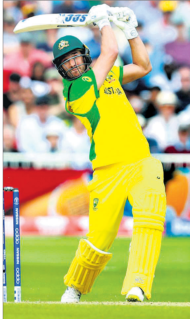
କ୍ୟାରିୟରର ଶ୍ରେଷ୍ଠ ଇନିଂସ୍ ଅବସରରେ ନାଥାନ କୁଲଟର ନାଲଲ।

ନଟିଂହାମ୍, ୬୬ (ପି.ଟି.) ଗ୍ଲାନାୟ ଟ୍ରେଣିଂକଠାରେ ଗୁରୁବାର ଖେଳାଯାଇଥିବା ଫ୍ରେଣ୍ଡ୍‌ସହିପ ବିପକ୍ଷ ଆଇସିସି ବିଶ୍ୱକପ୍ ମ୍ୟାଚରେ ଷ୍ଟିଭ୍ ବ୍ଲିଥ୍ ଓ ନାଥାନ କୁଲଟର ନାଲଲ ଅଷ୍ଟ୍ରେଲିଆକୁ ପ୍ରାରମ୍ଭିକ ବ୍ୟାଟିଂ ବିପର୍ଯ୍ୟୟରୁ ଉଦ୍ଧାର କରିଛନ୍ତି। ଚତୁର୍ଥେ ହାର ପ୍ରଥମେ ବ୍ୟାଟିଂ ପାଇଁ ଆମନ୍ତ୍ରଣ ପାଇଥିବା ଅଷ୍ଟ୍ରେଲିଆକୁ ଆରମ୍ଭରେ ଫ୍ରେଣ୍ଡ୍‌ସହିପ ଫାଷ୍ଟ ବୋଲରଙ୍କ ଶର୍ତ୍ତ ପିଟ୍ ଡେଲିଭରି ସାମ୍ରା କରିବା କଷ୍ଟସାଧ୍ୟ ହୋଇଥିଲା। ଟ୍ରେଣିଂକଠା ଗ୍ରାଉଣ୍ଡରେ ବଲ୍ ଖୁବ୍ ବାଉନୁ କରିବା ସହ ସୁଲମ୍ କରିଥିଲା। ଚୁନାମୋଖର ପ୍ରଥମ ମ୍ୟାଚରେ ଆଫଗାନିସ୍ତାନକୁ ସହକରେ ପରାସ୍ତ କରିଥିବା ଅଷ୍ଟ୍ରେଲିଆ ଏହାର ପ୍ରଥମ ୮ ଓଭର ବ୍ୟାଟିଂରେ ମାତ୍ର ୩୮ ରନରେ ୪ ଉଇକେଟ ହରାଇ ସଂକଟରେ ପଡ଼ିଥିଲା। ଆରୋନ୍ ଫିଞ୍ଚ (୬), ଡେଭିଡ୍ ଉର୍ନର (୩), ଉର୍ବମାନ ଖାକା (୧୩) ଏବଂ ଗ୍ରେନ ମାନ୍ସଫିଲ୍ଡ (୦)ଙ୍କୁ ଶାନ୍ତ କ୍ରିକ୍ ଛାଡ଼ିବାକୁ ପଡ଼ିଥିଲା। କିନ୍ତୁ