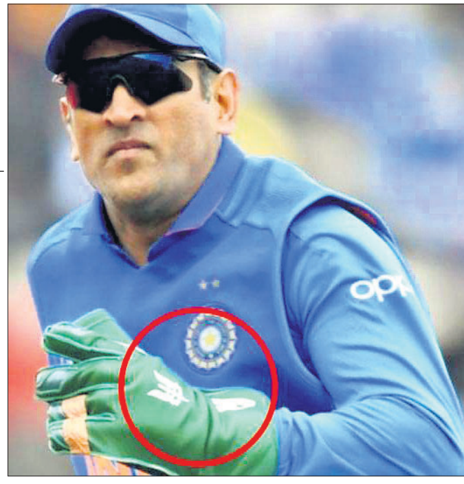
ମହେନ୍ଦ୍ର ସିଂ ଧୋନୀଙ୍କ ଗ୍ଲୋବ୍‌ରେ ଭାରତୀୟ ପାରା ଷ୍ଟେଶନାଲ ଫୋର୍ସର ପ୍ରତୀକ ରୂପରେ ଦକ୍ଷିଣ ଆଫ୍ରିକା ବିପକ୍ଷରେ

ସ୍ୱତନ୍ତ୍ର ଗ୍ଲୋବ୍ ବ୍ୟବହାର କରୁଥିବାର ଦେଖିବାକୁ ମିଳିଛି। ତାଙ୍କ ଉଇକେଟ କିଂଂ ଗ୍ଲୋବ୍‌ରେ ଦକ୍ଷିଣାପଟ୍ଟ ଚିହ୍ନ ରହିଥିଲା, ଯାହାକି ଭାରତୀୟ ପାରା ଷ୍ଟେଶନାଲ ଫୋର୍ସର ପ୍ରତୀକ। ଆଫ୍ରିକାୟ ବ୍ୟାଟ୍ସମ୍ୟାନ ଆଣ୍ଡିଲେ ଫେଲ୍‌କ୍ଲୋୟାଙ୍କୁ ଷ୍ଟ୍ରିଂ କରିବାବେଳେ ଧୋନୀଙ୍କ ଗ୍ଲୋବ୍‌ରେ ଲାଗିଥିବା ଚିହ୍ନ ସ୍ପଷ୍ଟ ଭାବେ ଦେଖାଯାଇଥିଲା। ଏଥିନେଇ ଚୁଲଟର ପ୍ରଶଂସକମାନେ ଧୋନୀଙ୍କୁ ଖୁବ୍ ପ୍ରଶଂସା କରିଛନ୍ତି। ୨୦୧୧ରେ ପୂର୍ବତନ ଭାରତୀୟ ଅଧିନାୟକଙ୍କୁ ଲୁଚିନାଶ କର୍ମରେ ମର୍ଯ୍ୟାଦା ସମ୍ମାନ ପଦବୀ ଦିଆଯାଇଥିଲା। ସେ ନିର୍ଦ୍ଦିଷ୍ଟ ସମୟ ପର୍ଯ୍ୟନ୍ତ ପାରା ରେକର୍ଡରେ ଟ୍ରେନିଂ ନେଇଥିଲେ। ଆଗ୍ରାରେ ଟ୍ରେନିଂ କୋର୍ସବେଳେ ଧୋନୀ ୫ ଥର ପାରାଲମ୍ପିକ ଜିତି କରିଥିଲେ ବୋଲି ବିଶ୍ୱାସ କରାଯାଏ। ଭାରତୀୟ ଆର୍ମି ପ୍ରତି ଥିବା ତାଙ୍କ ଭଲ ପାଇବାକୁ ଧୋନୀ ବହୁବାର ଲୋକଙ୍କ ନଜରକୁ ଆଣିଛନ୍ତି। ଚଳିତ ବର୍ଷ ଧୋନୀ ଓ ଭାରତୀୟ କ୍ରିକେଟ୍ ଦଳ ଖେଳାଳିମାନେ ଆର୍ମି କ୍ୟାମ୍ପ ପିଠି ଅଷ୍ଟ୍ରେଲିଆ ବିପକ୍ଷରେ ରାହୁଠାରେ ଖେଳିଥିଲେ।