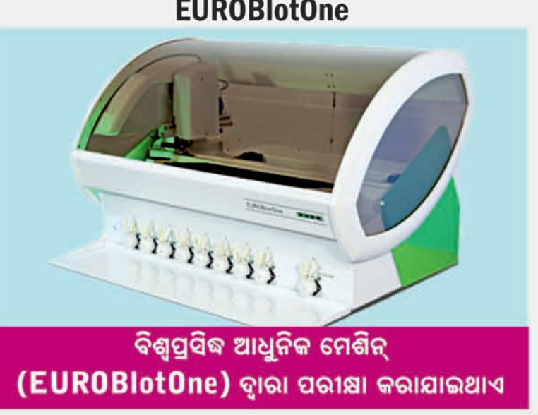
ବିଶ୍ୱପ୍ରସିଦ୍ଧ ଆଧୁନିକ ମେଶିନ୍ (EUROBlotOne) ଦ୍ୱାରା ପରୀକ୍ଷା କରାଯାଇଥାଏ

Jerath Path Labs & Allergy Testing Centre HEAD OFFICE : MUMBAI - Akruti Trade Center, A Wing, 5th Floor, MIDC, Andheri East. CORPORATE OFFICE : JALANDHAR - 14, Link Road, Adj. State Bank of India, Jalandhar