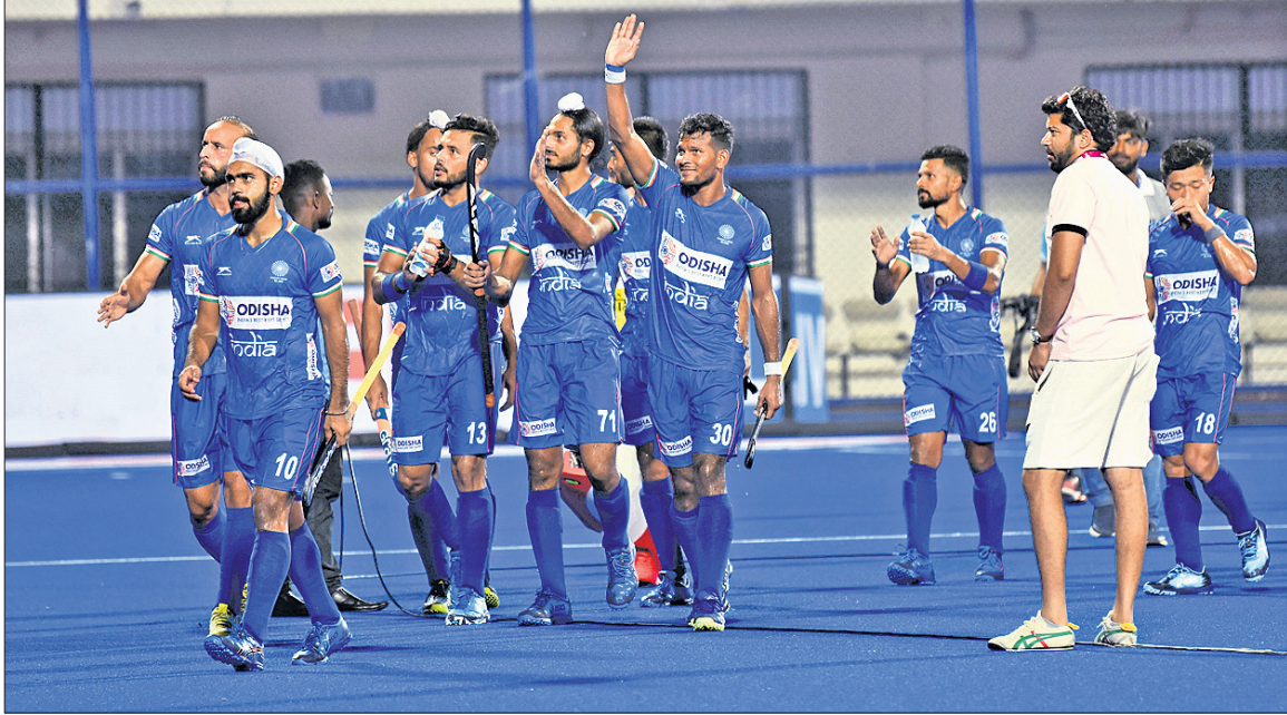
କଳିଙ୍ଗ ଷ୍ଟାଡିୟମରେ ଗୁରୁବାରଠାରୁ ଆରମ୍ଭ ହୋଇଥିବା ଏଫଆଇଏର୍ ସିରିଜ୍ ଫାଇନାଲ୍ ହକି ଟୁର୍ନାମେଣ୍ଟରେ ରୁଷିଆକୁ ୧୦-୦ ଗୋଲରେ ପରାସ୍ତ କରିବା ପରେ ଭାରତୀୟ ଦଳର ଖେଳାଳିମାନେ ଦର୍ଶକଙ୍କଠାରୁ ଅଭିନନ୍ଦନ ଗ୍ରହଣ କରୁଛନ୍ତି। (ରିପୋର୍ଟ ଖେଳ ପୃଷ୍ଠାରେ)

କିଛି ତଥ୍ୟ ମେ'ରେ ଦୈନିକ ସାରାହାରି ୧୨୨ ମିଲିଗ୍ରାମ ଯୁନିଟ୍ ବିଶ୍ୱାସ କାରବାର ହୋଇଛି। -ଇଣ୍ଡିଆନ ଏନଜି ଏକ୍ସପ୍ରେସ୍