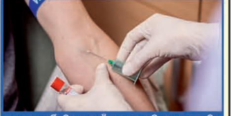
ଆଗରୁ ଆଲର୍ଜି ଚିହ୍ନଟ ପାଇଁ ବାହୁରେ ଛୁଣ୍ଡି ଦ୍ୱାରା ୨୫ ଟିକ୍ସ ଲଗାଯାଇ ଏହା ଜାଣିବାର ଚେଷ୍ଟା କରାଯାଉଥିଲା ଯେ ବ୍ୟକ୍ତିକୁ କେଉଁ ଜିନିଷ କାରଣରୁ ଆଲର୍ଜି ହେଉଛି କିନ୍ତୁ ଏବେ କେବଳ ରକ୍ତ ପରୀକ୍ଷା ଦ୍ୱାରା ହିଁ ଆଲର୍ଜିର କାରଣ ଜଣାପଡ଼ିଯାଉଛି ।