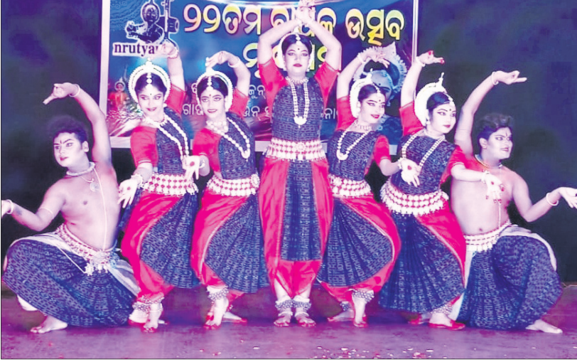
ସାଂସ୍କୃତିକ ଅନୁଷ୍ଠାନ 'ନୃତ୍ୟମ୍'ର ୨୨ତମ ବାର୍ଷିକ ଉତ୍ସବ ଅବସରରେ ଆୟୋଜିତ ସାଂସ୍କୃତିକ କାର୍ଯ୍ୟକ୍ରମ।