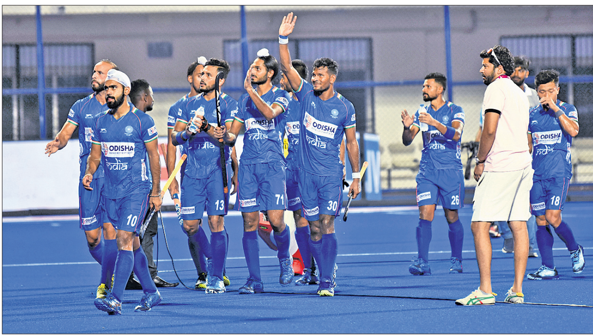
କଳିଙ୍ଗ ଷ୍ଟାଡିୟମରେ ଗୁରୁବାରଠାରୁ ଆରମ୍ଭ ହୋଇଥିବା ଏଫ୍‌ଆଇଏର୍ ସିରିଜ୍ ଫାଇନାଲ୍ ହକି ଟୁର୍ନାମେଣ୍ଟରେ ଚୁଷ୍ଟିଆକୁ ୧୦-୦ ଗୋଲରେ ପରାସ୍ତ କରିବା ପରେ ଭାରତୀୟ ଦଳର ଖେଳାଳିମାନେ ଦର୍ଶକଙ୍କଠାରୁ ଅଭିନନ୍ଦନ ଗ୍ରହଣ କରୁଛନ୍ତି। (ରିପୋର୍ଟ ଖେଳ ପୃଷ୍ଠାରେ)

ମେ'ରେ ବୈନିକ ହାରହାରି ୧୨୨ ମିଲିୟନ ଯୁନିଟ୍ ବିଦ୍ୟୁତ କାରବାର ହୋଇଛି। -ଇଣ୍ଡିଆନ ଏନକି ଏକ୍ସପ୍ରେସ୍