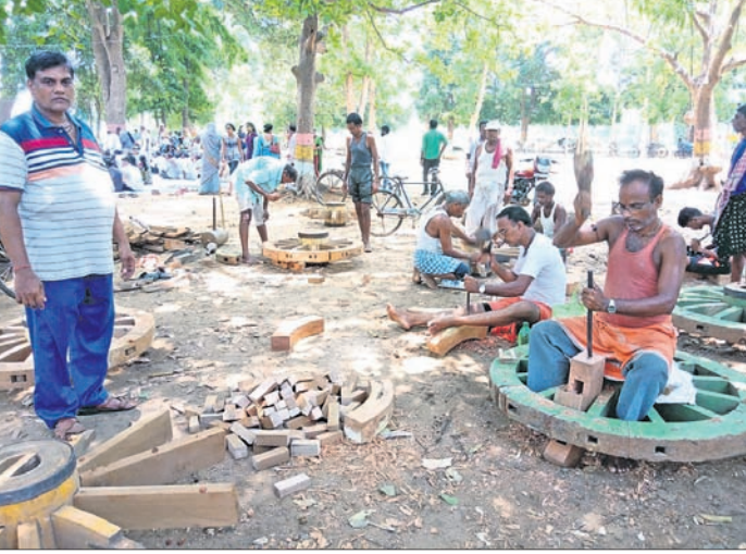
ଭୁବନ ରଥଯାତ୍ରା ପାଇଁ ସ୍ଥାନୀୟ ବୁଦ୍ଧେଶ୍ୱର ଶୈବପାଠ ନିକଟରେ ରଥକାମ ଆଗେଇ ଚାଲିଛି।