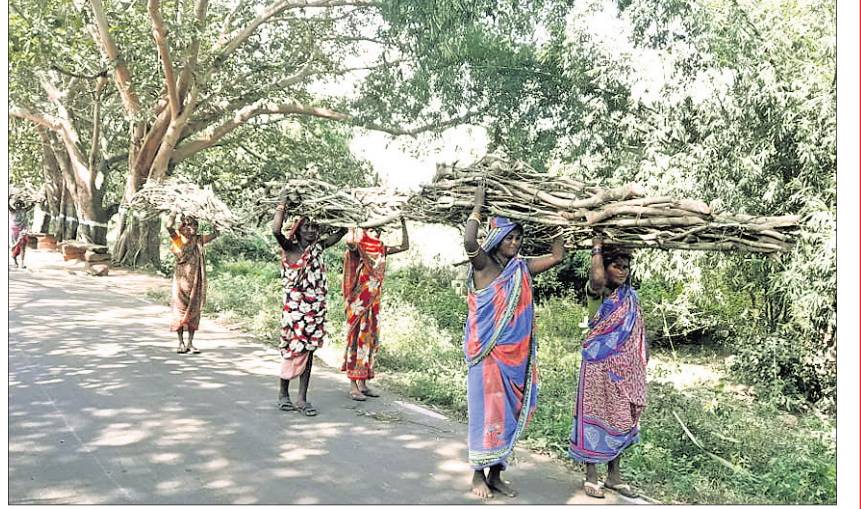
କାମାକ୍ଷାନଗର ଅଞ୍ଚଳର ମହିଳାମାନେ ଜଙ୍ଗଲକୁ କାଠ ଧରି ଫେରୁଛନ୍ତି।