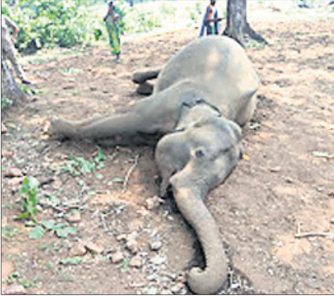
ପୂର୍ଣ୍ଣିମା ଜଳମୟ ଉଦ୍ଧାର ହୋଇଥିବା ମୃତ ହାତୀ।

ଫକୀରମୋହନ ବିଶ୍ଵବିଦ୍ୟାଳୟରେ ଜୈବ ପ୍ରଯୁକ୍ତି ବିଦ୍ୟା ବିଭାଗ ଖୋଲିବା ପରେ ନୀଳରକ୍ତ କଙ୍କଡ଼ା ଉପରେ ଅଧିକ କାର୍ଯ୍ୟକ୍ରମ ହାତକୁ ନିଆଯାଉଛି। ଜିଲ୍ଲାରେ ଥିବା ବିଭିନ୍ନ ସାମାଜିକ ଅନୁଷ୍ଠାନ ନୀଳରକ୍ତ କଙ୍କଡ଼ାଙ୍କ ସୁରକ୍ଷା ପାଇଁ ମଧ୍ୟ କାର୍ଯ୍ୟ କରୁଛନ୍ତି। ବାଲେଶ୍ଵରର ଆସୋସିଏଟେଡ ଫର୍ ବାୟୋଡାକ୍ତରସିଟି କର୍ତ୍ତବ୍ୟ ଆଣ୍ଡ ରିସର୍ଚ, ବାଲେଶ୍ଵରୀ କଳା କେନ୍ଦ୍ର, ଗୁ୍ୟ ହୋପ୍, କରକଣ୍ଠେଇ ବାହାଘର ଉତ୍ସବ କମିଟି, ବାହାବଳପୁର ନୀଳରକ୍ତ କଙ୍କଡ଼ା ସୁରକ୍ଷାମଣ୍ଡଳ ପ୍ରମୁଖ ଦେବାଙ୍ଗୁଳି ସଫୋର ବେଳେ ଏହି ବିରଳ ପ୍ରକାରି କଙ୍କଡ଼ାଙ୍କ ସୁରକ୍ଷା ଲାଗି ଜନ ସଚେତନତା ସୃଷ୍ଟି କରୁଛନ୍ତି। ଏ ଦିଗରେ ଅଧିକ ଗବେଷଣା ଲାଗି ଜାତୀୟସ୍ତରୀୟ ସାମୁଦ୍ରିକ ଗବେଷଣା କେନ୍ଦ୍ର ଖୋଲା ଯିବାକୁ ପ୍ରକୃତିପ୍ରେମୀ ଓ ବୁଦ୍ଧିଜୀବୀଙ୍କ ପକ୍ଷରୁ ଦାବି ହେଉଛି।