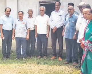
ରକ୍ତଦାତା ସଂଘର କର୍ମକର୍ତ୍ତା ।

ବାଲେଶ୍ୱର ଜିଲ୍ଲା ରକ୍ତଦାତା ସଂଘର ଆହ୍ୱାନକ୍ରମେ ସ୍ଥାନୀୟ ଶିଶୁବିଭାଗ ନିର୍ମିତ ପ୍ରାଙ୍ଗଣରେ ରବିବାର ଏକ ବୈଠକ ଅନୁଷ୍ଠିତ ହୋଇଯାଇଛି।