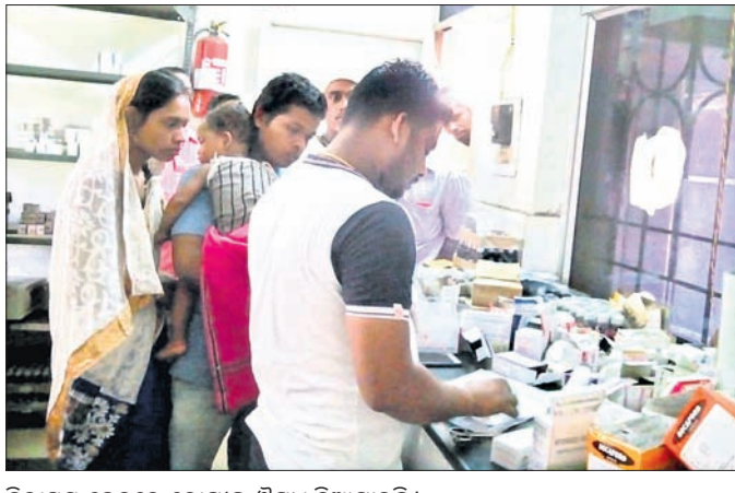
ନିରାମୟ କେନ୍ଦ୍ରରେ ରୋଗୀଙ୍କୁ ଔଷଧ ଦିଆଯାଉଛି।