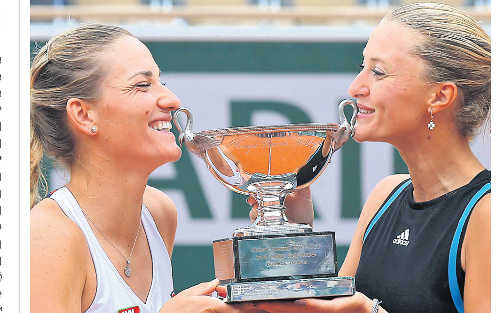
ଫ୍ରେସ୍ ଓପନ ମହିଳା ଡବଲ୍ ଚାଲଟଲ ବିଜୟିନୀ କ୍ରିଷ୍ଣିନା ମ୍ଲାଡେନୋଭିଚ୍ ଏବଂ ଚିମିଆ ବାବୋସ ।

ଏହି ଯୋଡ଼ି ୨୦୧୮ରେ ଅଷ୍ଟ୍ରେଲିଆନ ଓପନ ଜିତିଥିଲେ । ଚଳିତ ବର୍ଷ ଆରମ୍ଭରେ ବାବୋସ ଏବଂ ମ୍ଲାଡେନୋଭିଚ୍ ମେଲବୋର୍ନଠାରେ ରନସିଏସ୍ ହୋଇଥିଲେ । ମ୍ଲାଡେନୋଭିଚ୍ ୨୦୧୬ରେ କାରେଲିନ୍ ଗାସିଆଙ୍କ ସହିତ ଡାକ୍ ପ୍ରଥମ ଫ୍ରେସ୍ ଓପନ ଚାଲଟଲ ଜିତିଥିଲେ । ଆସିଆ ଡବଲ୍ ରାକ୍‌ସାଙ୍ଗରେ ସେ ଶୀର୍ଷ ସ୍ଥାନରେ ରହିବେ । ସୁଡନାୟୋଗ୍ୟ, ମ୍ଲାଡେନୋଭିଚ୍‌ଙ୍କ ବନ୍ଧୁ ଫ୍ରେସ୍ ହେଉଛନ୍ତି ଚେନିଏ ଖେଳାଳି ତୋମିନିକ୍ ଥୁମ୍ ।