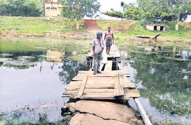
ଶନ ମନ୍ଦିରକୁ ଯିବା ପାଇଁ ଥିବା କାଠ ପୋଲ।