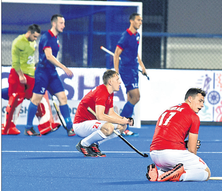
ପରାଜୟ ଗାଳିଚେ ପ୍ରିୟମାଣ ଯୋଲାଶୁ ଖେଳାଳି ।