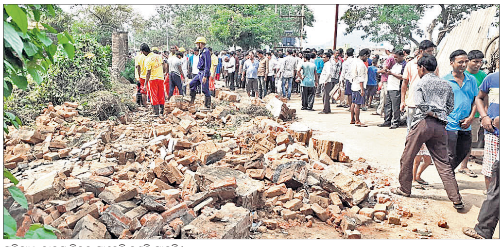
ପରିତ୍ୟକ୍ତ ରାଜସ୍ୱ ମିଲ୍ ପାଟେରି ଭୁଞ୍ଜି ଯାଇଛି।

ଦ୍ରାଚରେ ନିର୍ମିତ ଅଳ୍ପକାଳୀନ ହେଲେ ହାତୁଆମାନେ ଆଦୌ ଅଳ୍ପକାଳୀନ ନୁହେଁ। ସେଥିପାଇଁ ପ୍ରତି ସପ୍ତାହର ଶେଷ ଦିନରେ ଭାରି ଭିଡ଼ ହୁଏ ତେଜାନାଳ ଷ୍ଟେଶନ ବନ୍ଦୀ ରୋଡ଼ରେ ଥିବା ଏହି ହାତରେ। ସବୁଥର ପରି ରବିବାର ଦି ବସିଥିଲା ହାଟ। ଭଲ ବେପାର ଆଶାରେ ଆସିଥିଲେ ବ୍ୟବସାୟୀ। ଚାକା ପରିବା ନେବାକୁ ପହଞ୍ଚିଥିଲେ ଗରାଖ। କିଣା ବିକା କୋର୍ ଧରୁଥିବା ବେଳେ ହଠାତ୍ ଘଟଗଲା ଏକ ଦୁର୍ଘଟଣା। ସକାଳ ୮ଟା ୧୫ରେ ଭୁଞ୍ଜି ପଡ଼ିଲା ହାଟ ନିକଟରେ ଥିବା ଏକ ପରିତ୍ୟକ୍ତ ରାଜସ୍ୱ ମିଲ୍ ପାଟେରି, ଯାହା ତଳେ ଚପିଗଲା ୪ ବ୍ୟବସାୟୀଙ୍କ ଜୀବନ। ଏହି ଘଟଣାରେ ମୁଖ୍ୟମନ୍ତ୍ରୀ ନବୀନ ପଟ୍ଟନାୟକ ଗଭୀର ଦୁଃଖ ପ୍ରକାଶ କରିବା ସହ ମୃତକଙ୍କ ପରିବାରକୁ ୪ ଲକ୍ଷ ଟଙ୍କା ଲେଖାଏ ସହାୟତା ଘୋଷଣା କରିଛନ୍ତି। ଏଥିସହିତ ଆହତମାନଙ୍କ ଚିକିତ୍ସା ଦିନା ମୂଲ୍ୟରେ କରାଯିବ ବୋଲି ସେ କହିଛନ୍ତି। ସକାଳ ସାଢ଼େ ୭ଟାରୁ ଆରମ୍ଭ ହୋଇଥିଲା ତେଜାନାଳ ପୌର ପରିଷଦ ଅଧୀନରେ ଥିବା ଅଳ୍ପକାଳୀନ ହାଟ। ଅପରାହ୍ନ ଯାଏ ଏହା ଚାଲିବାକୁ ଥିବାରୁ ଖରାବୁ ବର୍ତ୍ତିବା ପାଇଁ କେତେଜଣ ବ୍ୟବସାୟୀ ହାଟ ପାର୍ଶ୍ୱ ତି. ହଂସରାଜ ନାମକ ଏକ ପରିତ୍ୟକ୍ତ ରାଜସ୍ୱମିଲ୍ ପାଟେରି ଛାଇରେ ବସିଥିଲେ। କିଛି ଗ୍ରାହକ ସମ୍ପୃକ୍ତ ବେପାରୀଙ୍କଠାରୁ ପରିବା କିଣୁଥିବା ବେଳେ ଏଠାରୁ ଅଧିକ ବାଜକ ସେଠାରେ ରହିଥିଲା। ଏହି ସମୟରେ ହଠାତ୍ ୪୦ ବର୍ଷ ପୁରୁଣା ଭକ୍ତ ପାଟେରି ଭୁଞ୍ଜି ପଡ଼ିଥିଲା। ଫଳରେ ଏହା ତଳେ ବସିଥିବା ସବର ଥାନା