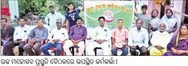
ରଜ ମହୋତ୍ସବ ପ୍ରସ୍ତୁତି ବୈଠକରେ ଉପସ୍ଥିତ କର୍ମଚାରୀ।