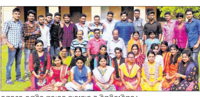
ଉତ୍ସବରେ ଉପସ୍ଥିତ ପୁରାତନ ଛାତ୍ରଛାତ୍ରୀ ଓ ଶିକ୍ଷୟିତ୍ରୀଶିକ୍ଷକ।

ରହିଆସିଛି ବୋଲି କହିଥିଲେ। ଏଥିରେ ପରବର୍ତ୍ତୀ ଦିନରେ ପରାମର୍ଶ ପ୍ରାଚୀନ କାଳରୁ