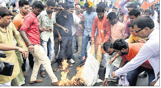
ପଶ୍ଚିମବଙ୍ଗର ହାପ୍ଡାଠାରେ ଭାଜପା କର୍ମୀମାନେ ମମତାଙ୍କ କୁଶପୁରାଣିକା ବାହ କରୁଛନ୍ତି ।

ପଶ୍ଚିମବଙ୍ଗରେ ଆଇନଶୁଖିଲା ପରିସ୍ଥିତି ଉଦ୍‌ବେଗନକର ଛୁଟିରେ ପହଞ୍ଚିବା ଓ କର୍ମୀଙ୍କୁ ହତ୍ୟା କରାଯିବା ପ୍ରତିବାଦରେ ଭାଜପା ପକ୍ଷରୁ ରାଜ୍ୟବ୍ୟାପୀ ସୋମବାର କଳା ଦିବସ ପାଳନ କରାଯାଇଛି । ଏଥିସହ ଉତ୍ତର ୨୪ ପ୍ରଗଣା ଜିଲାର ବିପିରହାଟ ସର୍ବୋଚ୍ଚତମ ଭାଜପା ପକ୍ଷରୁ ୧୨ ଘଣ୍ଟା ବନ୍ଦ ପାଳନ କରାଯାଇଛି । ବିପିରହାଟରେ ଭାଜପା କର୍ମୀମାନେ ଗାଡ଼ିମଟର ସହ ଅଟକାଇବା ସହ ରେଳରୋକୋ କରିବାକୁ ଜୀବନଯାତ୍ରା ପ୍ରଭାବିତ ହୋଇଥିଲା । ଦୁଇ ଘଣ୍ଟାକାଳ ରେଳ ଚଳାଚଳ ବନ୍ଦ ରହିଥିଲା । ପୋଲିସ୍ ଓ ରେଳଠେ ଅଧିକାରୀଙ୍କୁ ହସ୍ତକ୍ଷେପ ପରେ ରେଳ ଚଳାଚଳ ସ୍ୱାଭାବିକ ହୋଇଥିଲା । ନେଉରି, କନ୍ଦୁମାତା ପ୍ରଭୃତି ସ୍ଥାନରେ ଭାଜପା କର୍ମୀମାନେ ଗୋଟିଏ ଅବରୋଧ କରିବାକୁ ଯାନବାହନ ଚଳାଚଳ ବାଧାପ୍ରାପ୍ତ ହୋଇଥିଲା । ବିପିରହାଟରେ ଅଧିକାରୀଙ୍କୁ ଚୋକିତକାରୀ ବନ୍ଦ ରହିଥିଲା । କଳା ଦିବସ ପାଳନକୁ ପର୍ଯ୍ୟନ୍ତ କରି ଭାଜପା