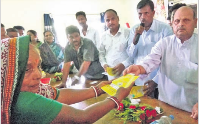
ବସ୍ତା ବିଧାୟକ ଜଣେ ହିତାଧିକାରୀଙ୍କୁ ଭତ୍ତା ପ୍ରଦାନ କରୁଛନ୍ତି।