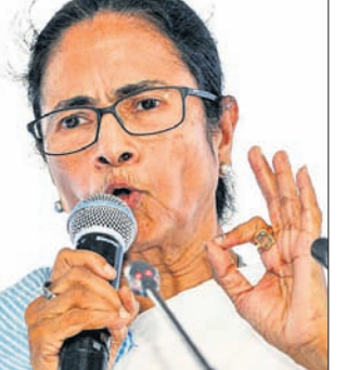
ମଧ୍ୟ ସମାନଭାବେ ଦାୟୀ ରହିବେ ବୋଲି ମମତା ସର୍ତ୍ତବାକ୍ୟଠାରେ

ପଶ୍ଚିମବଙ୍ଗ ମୁଖ୍ୟମନ୍ତ୍ରୀ ମମତା ବାନାର୍ଜୀ ରାଜ୍ୟରେ ହିଂସାକାଣ୍ଡ ଲାଗି ଭାଜପାକୁ ଦୋଷ ଦେଇଛନ୍ତି । କେନ୍ଦ୍ର ଓ ଭାଜପା କର୍ମୀମାନେ ମୁଖ୍ୟତଃ ଏଥିଲାଗି ଦାୟୀ । ରାଜ୍ୟ ସରକାରଙ୍କୁ ଗାଦିଚ୍ୟୁତ କରୁଥିବା ଭାଜପା କର୍ମୀମାନଙ୍କୁ ଦୋଷ ଦେଇଛନ୍ତି । ବିଭିନ୍ନ ସୋସିଆଲ ନେଟୱାର୍କ ଫ୍ରେଣ୍ଡସାଇଟ୍‌ରେ ଭାଜପା ମିଛ କଥା ଛାପି କୋଟିକୋଟି ଟଙ୍କା ଖର୍ଚ୍ଚକରିବା ସହ ପଶ୍ଚିମବଙ୍ଗରେ ହିଂସା ପୃଷ୍ଠି କରିବାକୁ ଚେଷ୍ଟା କରୁଛି । ଦକା ହେଲେ ରାଜ୍ୟ ସହ କେନ୍ଦ୍ର ସରକାର