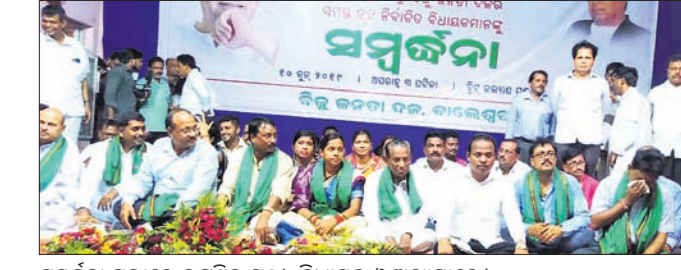
ସମ୍ବର୍ଦ୍ଧନା ସଭାରେ ଉପସ୍ଥିତ ମନ୍ତ୍ରୀ, ବିଧାୟକ ଓ ଅନ୍ୟମାନେ।