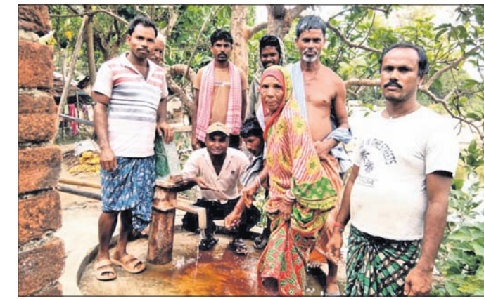
ନଳକୂପରୁ ଲୁଣି ପାଣି ବାହାରୁଥିବା ଲୋକେ ଦେଖାଉଛନ୍ତି।

ବାଲେଶ୍ୱର ଜିଲ୍ଲା ରେମୁଣା ବ୍ଲକ ଖଜାପଡା ଥାନା ଲକ୍ଷ୍ମି କଳାମାଟିଆ ପାଣି ଗ୍ରାମରେ ଥିବା ନଳକୂପରୁ ଲୁଣିପାଣି ବାହାରୁଛି। ମଧୁର ପାଣି ପାଇଁ ଗ୍ରାମୀଣ ଲୋକଙ୍କୁ ୩ କି.ମି. ଦୂର ଯିବାକୁ ପଡୁଛି। ସରକାର