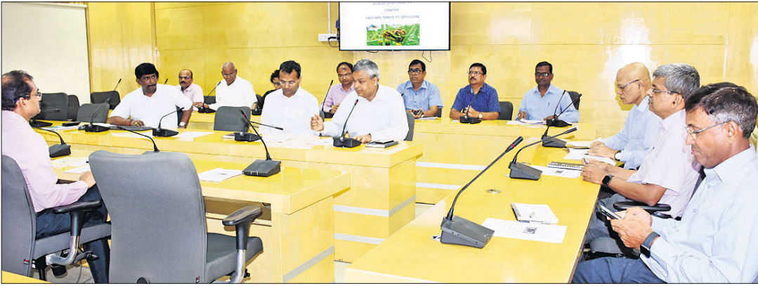
ମିଲେଟ୍ ମିଶନ ବୈଠକରେ ଉପସ୍ଥିତ ଅଧିକାରୀମାନେ।

ରାଜ୍ୟ ସରକାର ନିଜସ୍ୱ ଖାଦ୍ୟ ନିରାପଣା ଯୋଜନାରେ ଏଣିକି ରାଶନ କାର୍ଡଧାରୀଙ୍କୁ ମାଣ୍ଡିଆ ଯୋଗାଇ ଦେବେ।