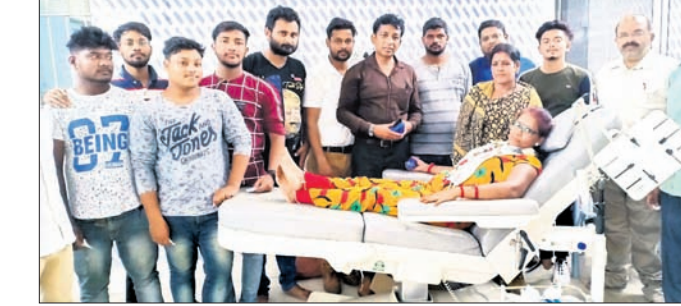
ଶିବିରରେ ଜଣେ ମହିଳା ରକ୍ତଦାନ କରୁଛନ୍ତି।