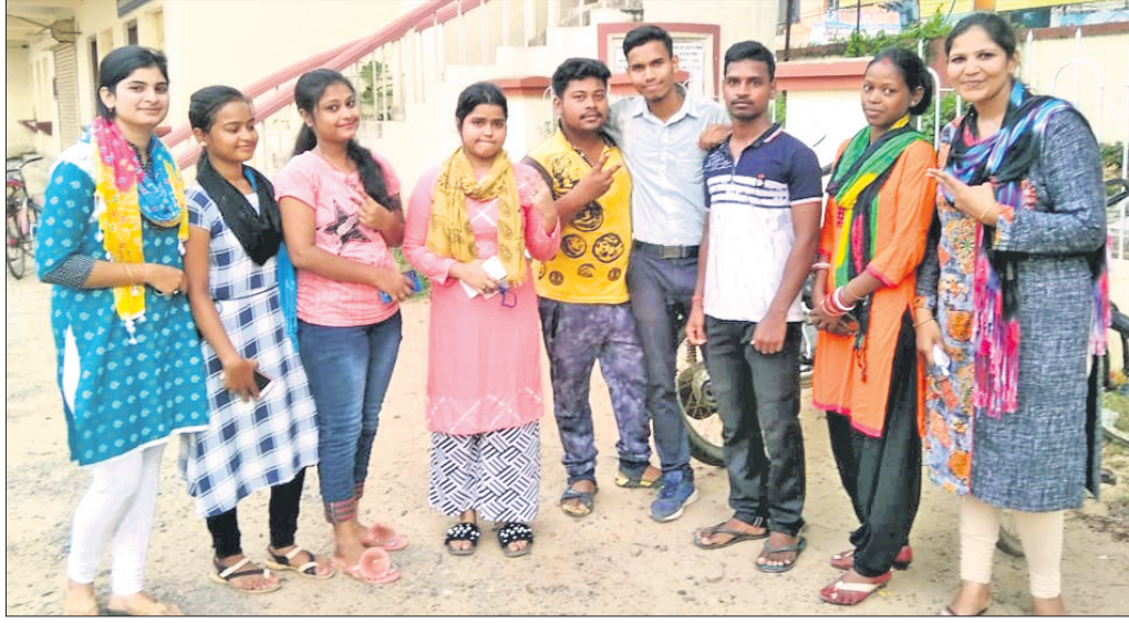
ଫଳାଫଳ ପ୍ରକାଶ ପରେ ଫକୀରମୋହନ ଛାତ୍ରାଳୟରୁ ଉତ୍ସବ ମନାଉଛନ୍ତି।