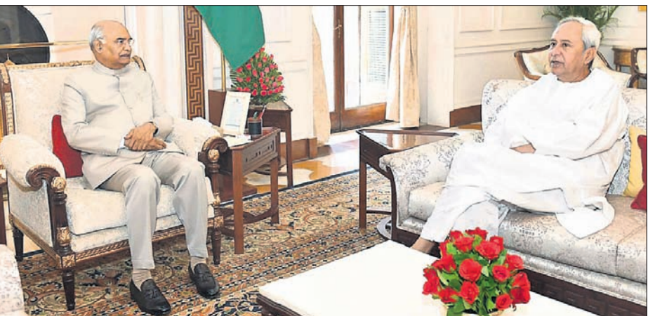
ରାଷ୍ଟ୍ରପତି ରାମନାଥ କୋବିନ୍ଦଙ୍କ ସହ ନବୀନ ପଟ୍ଟନାୟକ ଆଲୋଚନା କରୁଛନ୍ତି ।