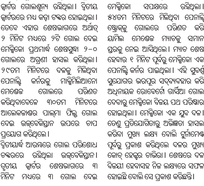
ଏକାଧିକ ସ୍କୋର ପାଇଥିଲେ ହେଁ ପ୍ରଥମ ଭାଗରେ ଖେଳିବାକୁ ନିଷ୍ଠାହୀନ...