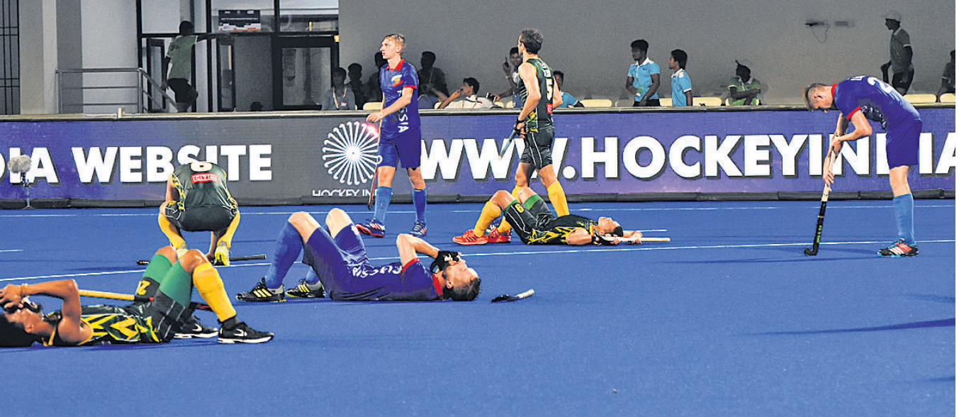
ଧୂଳି ଓ ଦୁଖର ସମାହାର: କଳିଙ୍ଗ ଖ୍ରୀତିୟମରେ ବୁଧବାର ଏଫଆଇଏଫ୍ ସିରିଜ ଫାଇନାଲ୍ ହକି ଟୁର୍ଣ୍ଣାମେଣ୍ଟର ଦ୍ୱିତୀୟ କ୍ରମେ ଖେଳାଳିଙ୍କୁ ବିଚାର କରାଯାଇଛି।