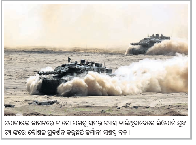
ପୋଲିସ୍‌ର କାର୍ଯ୍ୟକ୍ରମରେ ନାଟୋ ପକ୍ଷରୁ ସମରାଜ୍ୟ ସାମିଲିତାରେଲେ ଲିଓପାର୍ଟ୍ ସୂଚ୍ୟ ଟ୍ୟାଙ୍କରେ ବୈଶାକ ପ୍ରଦର୍ଶନ କରୁଛନ୍ତି କର୍ମୀମାନେ ସଶସ୍ତ୍ର ବଳ।