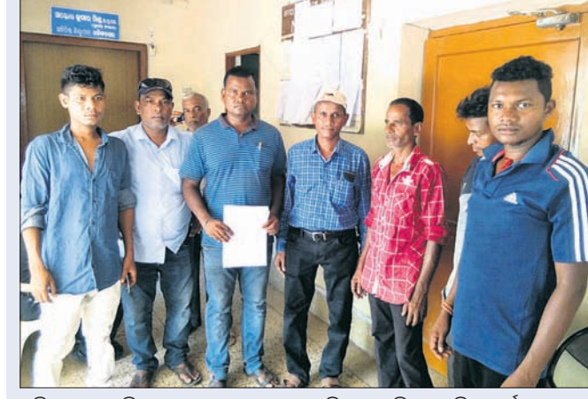
କଳିଙ୍ଗନଗର ଶିଳ୍ପାଞ୍ଚଳର କର୍ମଚାରୀ ଉପେକ୍ଷିତ ଅଭିଯୋଗ କରିଛନ୍ତି।