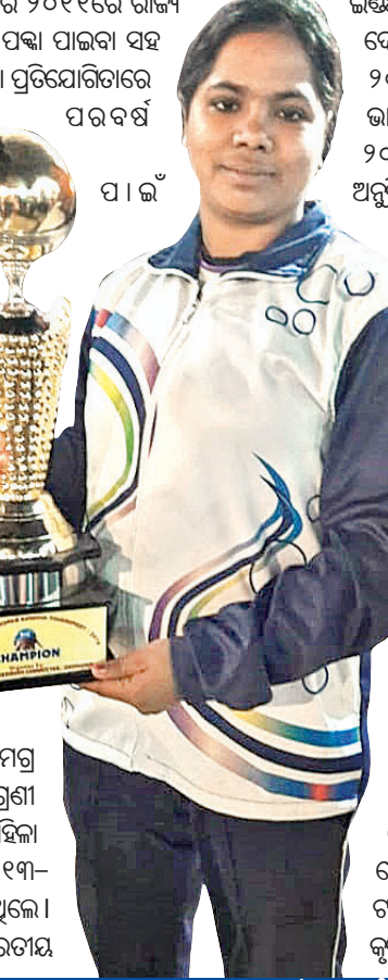
କବିତା ପ୍ରତିଭା ମନସ୍କିମାଳ ପାଇଁ ଅର୍ଥ ସାଜିଛି ଗାଧକ