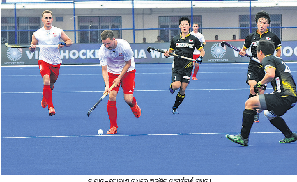
ଜାପାନ-ପୋଲାଣ୍ଡ ମଧ୍ୟରେ ଅନୁଷ୍ଠିତ ସଂଘର୍ଷପୂର୍ଣ୍ଣ ମ୍ୟାଚ୍।