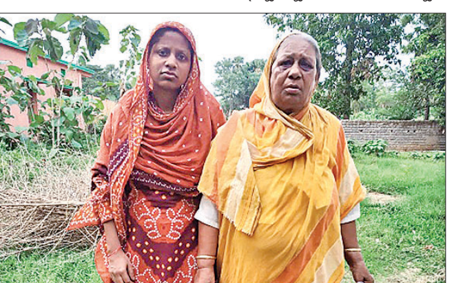
ଜମିବାଡ଼ିକୁ କେନ୍ଦ୍ରକରି ଗଣଗୋଳ ଏସପିଙ୍କୁ ଭେଟିଲେ ମା’ ଝିଅ।

କଳିଙ୍ଗନଗର ଶିଳ୍ପାଞ୍ଚଳର କର୍ମଚାରୀ ଉପେକ୍ଷିତ ଅଭିଯୋଗ କରିଛନ୍ତି। ଉପେକ୍ଷିତ କର୍ମଚାରୀ ଉପେକ୍ଷିତ ଅଭିଯୋଗ କରିଛନ୍ତି।