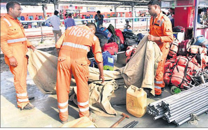
ଅହମ୍‌ମଦାବାଦରେ ଏକ୍ସିଆର୍କଏଫ୍ ଟିଏ ପକ୍ଷରୁ ପ୍ରସ୍ତୁତ ଚାଲିଛି।

ଆରବ ସାଗରରେ ବାତ୍ୟା 'ବାୟୁ' ଉତ୍ତରୁପ ଧାରଣ କରିବା ସହ ଗୁଜରାଟ ଉପକୂଳ ଆଡ଼କୁ ପୂର୍ବାଭିମୁଖରେ ଲାଗିଛି।