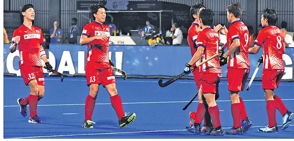
ଗୋଲ୍ ଷ୍ଟୋର ପରେ ଜାପାନ ଖେଳାଳିମାନେ ଖୁସି ମୁହୂର୍ତ୍ତରେ।