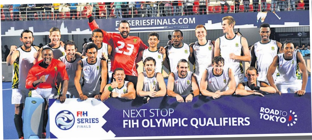
ରତ୍ନସର୍ପ ଦକ୍ଷିଣ ଆଫ୍ରିକା।