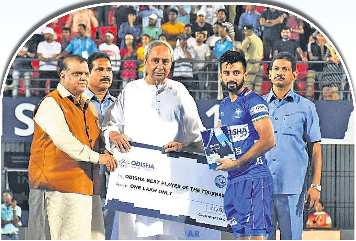
ଅନ୍ତର୍ଜାତୀୟ ହକି ଫେଡ଼େରେଶନ୍ ସଭାପତି ନରିନ୍ଦର କାଡ୍ରା ଓ ମୁଖ୍ୟମନ୍ତ୍ରୀ ନବୀନ ପଟ୍ଟନାୟକ ଭାରତୀୟ ଦଳର ଅଧିନାୟକ ମନ୍ଦ୍ରାପ୍ ସିଂହଙ୍କୁ ଶ୍ରେଷ୍ଠ ଖେଳାଳି ପୁରସ୍କାର ପ୍ରଦାନ କରୁଛନ୍ତି।

କଳିଙ୍ଗ ଷ୍ଟାଡ଼ିୟମରେ ଗତ ୬ ତାରିଖରୁ ଆରମ୍ଭ ହୋଇଥିବା ହକି ପର୍ବ ଏଫଆଇଏଚ୍ ସିରିଜ ଫାଇନାଲ୍ ଶନିବାର ଉଦ୍‌ଘାଟିତ ହୋଇଛି। ଭାରତ ଚାମ୍ପିୟନ ହେବାସହ ପୁଖବ ଅନୁଭୂତି ଲାଭ କରିଛନ୍ତି ଓଡ଼ିଶା ଦର୍ଶକ। ଚୁର୍ନାମେଣ୍ଟରେ ଅପରାଜେୟ ରହିଥିବା ଭାରତ ଫାଇନାଲରେ ଦକ୍ଷିଣ ଆଫ୍ରିକାକୁ ୫-୧ ଗୋଲରେ ହରାଇ ନିଜର ଦକ୍ଷତା ଦେଖାଇଛି। ଲଢୁଆ ଖେଳ ସହ ଦକ୍ଷିଣ ଆଫ୍ରିକା ପ୍ରଦର୍ଶନର ଛାପ ଛାଡ଼ିଥିବାବେଳେ ଏସୀୟ ଚାମ୍ପିୟନ ଜାପାନ ତୃତୀୟ ସ୍ଥାନରେ ସବୁଷ୍ଟ ହୋଇଛି।