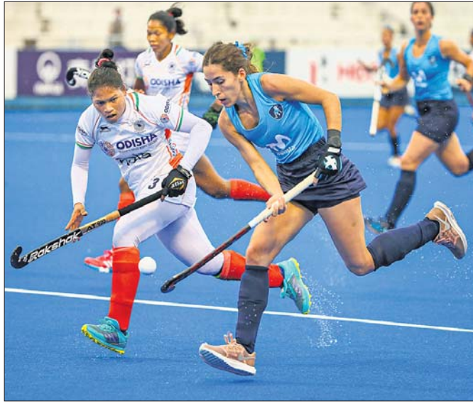
ଭାରତ ଓ ଉତ୍ତରୁପ ମଧ୍ୟରେ ଅନୁଷ୍ଠିତ ମ୍ୟାଚ୍। କୌର ସହାକୁ ଗୋଲରେ ପରିଣତ ୨-୦ରେ ଅଗ୍ରଣୀ ଲାଭ କରିଥିଲା।