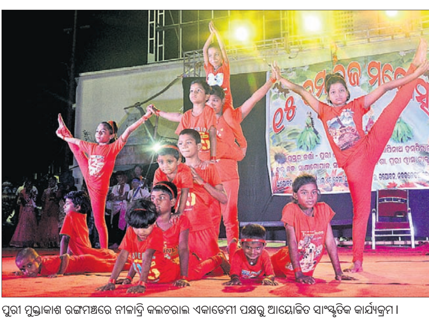
ପୁରୀ ମୁଦ୍ରାକାଶ ରଙ୍ଗମଞ୍ଚରେ ନାକାନ୍ତି କଳଚରାଳ ଏକାଡେମୀ ପକ୍ଷରୁ ଆୟୋଜିତ ସାଂସ୍କୃତିକ କାର୍ଯ୍ୟକ୍ରମ।