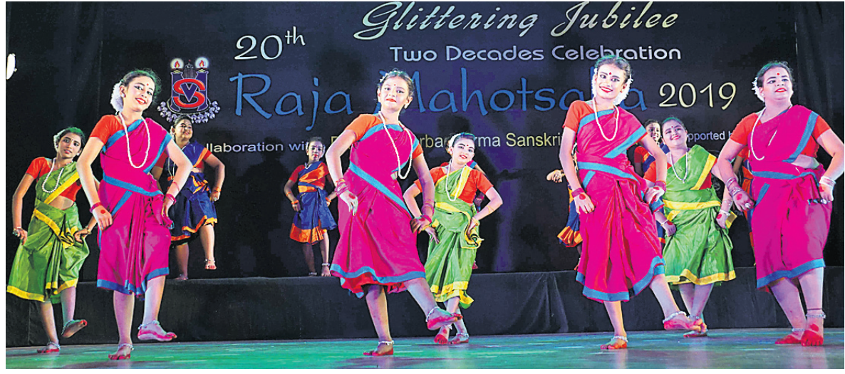
ପୁରୀ ବୁଢ଼ାମା' ଚୋଟାରେ ଶନିବାର ଅନୁଷ୍ଠିତ ରଜ ମହୋତ୍ସବରେ ଓଲଟଇଁ କଣ୍ଠଶିଳ୍ପୀ ସ୍ତ୍ରୀମାନ ସାଗର ସଙ୍ଗୀତ ପରିବେଷଣ କରୁଛନ୍ତି।