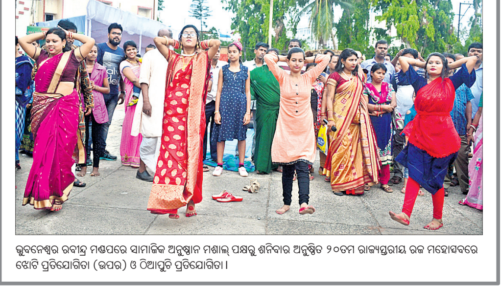
ଭୁବନେଶ୍ୱର ରବୀନ୍ଦ୍ର ମଞ୍ଚପରେ ସାମାଜିକ ଅନୁଷ୍ଠାନ ମଣ୍ଡଳ ପକ୍ଷରୁ ଶନିବାର ଅନୁଷ୍ଠିତ ୨୦୦ମ ରାଜ୍ୟସ୍ତ୍ରୀୟ ରଜ ମହୋତ୍ସବରେ ଝୋଟି ପ୍ରତିଯୋଗିତା (ଉପର) ଓ ପିଆପୁଟି ପ୍ରତିଯୋଗିତା।