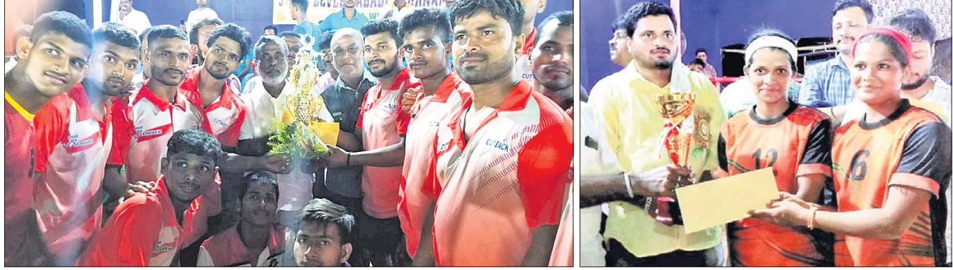
ଅତିଥିକ ଗହଣରେ ରାଜ୍ୟସ୍ତରୀୟ କବାଡ଼ି ପ୍ରତିଯୋଗିତାର ଚାମ୍ପିୟନ ପୁରୁଷ ଓ ମହିଳା ଟିମ୍।

ବ୍ୟତୀତ କର୍ମୀମାନ ଓ ପ୍ରାନ୍ତ ମଧ୍ୟ ରାଉଣ୍ଡ ୧୬କୁ ଉନ୍ନତ ହୋଇଛନ୍ତି।