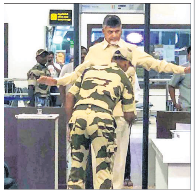
ବିଶାଖାପାଟଣା ବିମାନବନ୍ଦରେ ଶନିବାର ଆକ୍ରମଣରେ ପୂର୍ବର ମୁଖ୍ୟମନ୍ତ୍ରୀ ଏବଂ ଚନ୍ଦ୍ରାବାରୁ ନାଲଭୁଙ୍କୁ ଜଣେ ସୁରକ୍ଷା କର୍ମୀ ଯାତ୍ରା କରୁଛନ୍ତି।

ମହାରାଷ୍ଟ୍ର ମନ୍ତ୍ରୀମଣ୍ଡଳ ସମ୍ପ୍ରଦାୟର ଶିକ୍ଷା ହେବ। ରାଜଭବନରେ ପୂର୍ବାହ୍ନ ୧୧ଟାରେ ରାଜ୍ୟପାଳ ସି. ବିଦ୍ୟାସାଗର ରାଓ ନବନିଯୁକ୍ତ ମନ୍ତ୍ରୀଙ୍କୁ ଶପଥପାଠ କରାଇବେ। ମୁଖ୍ୟମନ୍ତ୍ରୀ ଦେବେନ୍ଦ୍ର ଫଡ଼ନବିସ୍ ଓ ଶିବସେନା ମୁଖ୍ୟ ଉତ୍ତର ଠାକରେ ମଧ୍ୟରେ ଏନେଇ ଆଲୋଚନା ହୋଇଛି। ଶିବସେନାକୁ ଉପମୁଖ୍ୟମନ୍ତ୍ରୀ ପଦ ମିଳିପାରେ।