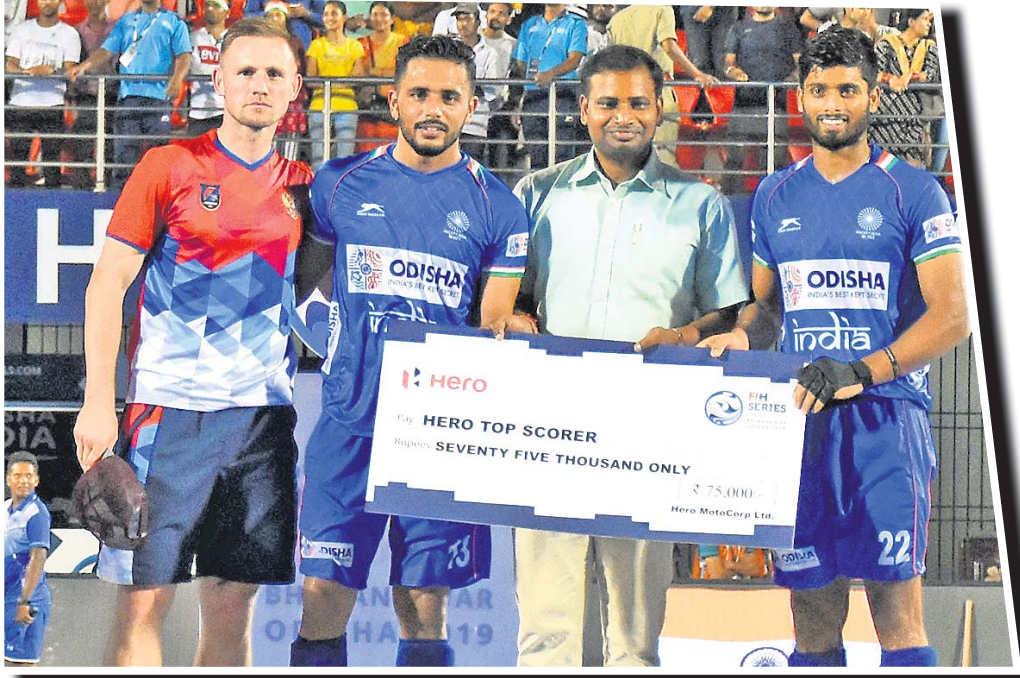
କ୍ରୀଡ଼ାମନ୍ତ୍ରୀ ଗୁଣ୍ଡାରକାନ୍ତି ବେହେରାଙ୍କ ସହ ଚୁର୍ନାମେଣ୍ଟର ଚମ୍ପିୟନ ଭାବେ ଭାରତୀୟ ଦଳର ମାନ୍ୟତା ପ୍ରଦାନ କରୁଛନ୍ତି।