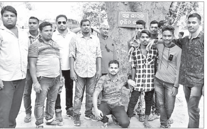
ସଫେଇ କାର୍ଯ୍ୟକ୍ରମରେ ସାମିଲ ହୋଇଥିବା ଯୁବକ ସଂଘର କର୍ମକର୍ମୀମାନେ।

ସଫେଇ କାର୍ଯ୍ୟକ୍ରମରେ ସାମିଲ ହୋଇଥିବା ଯୁବକ ସଂଘର କର୍ମକର୍ମୀମାନେ। ସଫେଇ କାର୍ଯ୍ୟକ୍ରମରେ ସାମିଲ ହୋଇଥିବା ଯୁବକ ସଂଘର କର୍ମକର୍ମୀମାନେ।