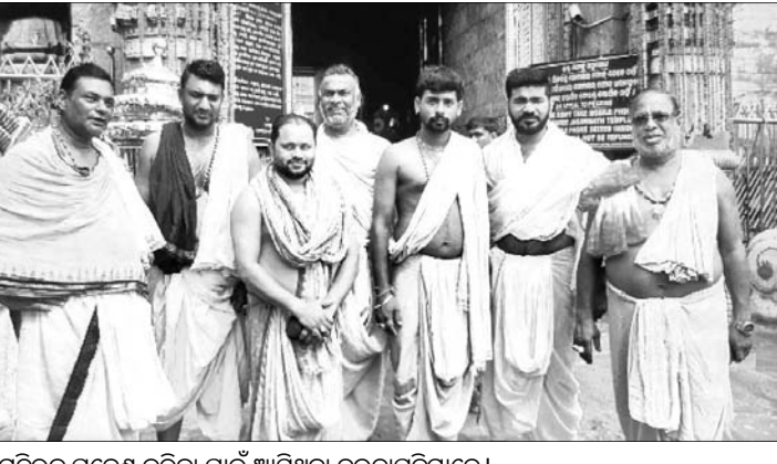
ଶ୍ରୀମନ୍ଦିରକୁ ପ୍ରବେଶ କରିବା ପାଇଁ ଆସିଥିବା ଦଇତାପତିମାନେ।