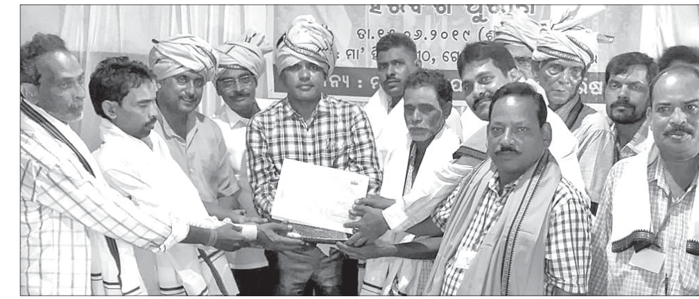
ତାଳଚେର, ୧୫/୬/୧୯ (ବି.ପ୍ର.)