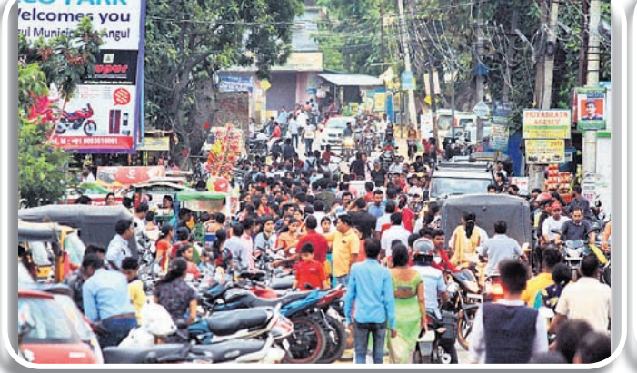
ଜକୋ ପାର୍କ ସମ୍ମୁଖ ରାସ୍ତାରେ ରଜ ମଉଜ।