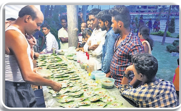
ରଜ ପାନ ଖାଇବାକୁ ଏକ ବୋକାନରେ ଅପେକ୍ଷାରତ ଗ୍ରାହକ।