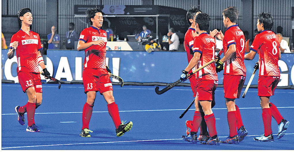
ଗୋଲ୍‌ଖୋର ପରେ ଉଲ୍ଲାସିତ ଜାପାନ ଖେଳାଳି ।