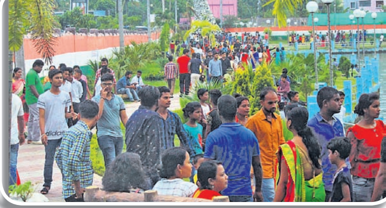
ପାର୍କ ଭିତରେ ଲୋକେ ମଜା ଉଠାଉଛନ୍ତି।