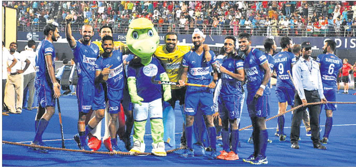
ଏସିଆଲିଗ୍‌ଏସ୍ ସିରିଜ ଫାଇନାଲ୍ ହକି ଚୁନାବଳୀରେ ଚାମିୟନ୍ ହେବା ପରେ ଭାରତୀୟ ଖେଳାଳିଙ୍କ ସେଲିକ୍ଟେସନ ।