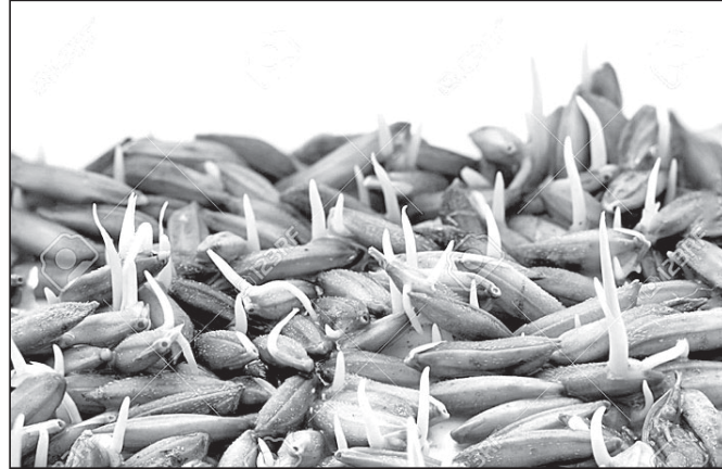
ନାମ ପଞ୍ଜୀକୃତ କରିଛନ୍ତି। ଜିଲା କୃଷି

ଅକ୍ଷୟ ତୃତୀୟାରେ ଅଷ୍ଟପୁଠି ଅନୁକୂଳ ପରେ ଚାଷ କାର୍ଯ୍ୟ ଆରମ୍ଭ କରିଦେଇଛନ୍ତି ଚାଷୀ। ଗତବର୍ଷ ଅପେକ୍ଷା ଚଳିତବର୍ଷ କ୍ଷେତ୍ରକୁ ଭଲ ଫସଲ ଅମଳ କରିବାକୁ ସେମାନେ ଆଶା ବାନ୍ଧିଛନ୍ତି। ଗତବର୍ଷ ଅନିୟମିତ ବର୍ଷା ଯୋଗୁ ଚାଷରେ ସାମାନ୍ୟ ବାଧା ଉଠୁଥିଲା। ଏପରି କି ଜିଲାର କେତେକ କୁଳରେ ମରୁଡ଼ି ଚାଷୀଙ୍କୁ କ୍ଷତିଗ୍ରସ୍ତ କରିଥିଲା। ତଥାପି ନୂଆ ଆଶା ଓ ଉତ୍ସାହ ନେଇ ଚାଷୀ ଓହ୍ଲାଇଛନ୍ତି ଜମିକୁ। ହେଲେ ଘରେ ନ ପଶୁଣୁ ଚାଳ ବାଜିବା ପରି ଚାଷ କାର୍ଯ୍ୟ ଜୋର୍ ଧରିବା ପୂର୍ବରୁ ବିହନ ଅଭାବ ଚିନ୍ତାର କାରଣ ହୋଇଛି। ଚଳିତବର୍ଷ ଅନୁଗୋଳ ଜିଲାର ପଞ୍ଜୀକୃତ ହୋଇଥିବା ଚାଷୀଙ୍କ ପାଇଁ ୧୩ ହଜାର କୂଳଖାଲ ଧାନ ବିହନ ଆବଶ୍ୟକ। କିନ୍ତୁ ବର୍ତ୍ତମାନ ପୁଞ୍ଜା ୫ ହଜାର ୮୯୦ କୂଳଖାଲ ବିହନ ମହକୁଦ ରହିଥିବା କୃଷି ବିଭାଗ ପକ୍ଷରୁ ସୁରକ୍ଷା ମିଳିଛି। ଏହାକୁ ନେଇ ଚାଷୀ ପକ୍ଷରେ ଅସନ୍ତୋଷ ଦେଖାଦେଇଛି। ସରକାରଙ୍କ ନିୟମ ଅନୁଯାୟୀ, କୃଷି ସମବାୟ ସମିତିକୁ ବିହନ ଜିରିଲେ ଚାଷୀ ସିଧାସଳଖ ସଂସ୍କୃତି ପାଇପାରିବେ। ଏ ନେଇ ଚାଷୀଙ୍କ ମନରେ ଉତ୍ତୁଣ୍ଣା ରହିଛି। ଜିଲାର ମୋଟ ୬୮ ହଜାର ୬୨୮ ଚାଷୀ ବିଭିନ୍ନ କୃଷି ସମବାୟ ସମିତିରେ