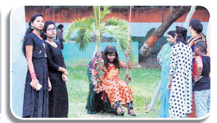
ସୁବର୍ତ୍ତୀମାନେ ବୋକିର ମଜା ନେଉଛନ୍ତି।