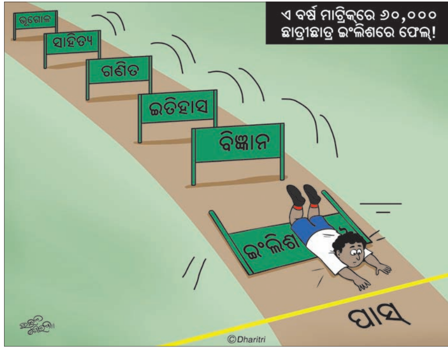
ଏ ବର୍ଷ ମାଟ୍ରିକ୍ରେ ୬୦,୦୦୦ ଛାତ୍ରଛାତ୍ରୀଙ୍କୁ ଲାଗିବ ଫେଲ!