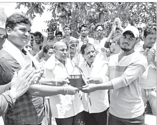
ଚାମ୍ପିୟନ ଦଳକୁ ଟ୍ରଫି ପ୍ରଦାନ କରାଯାଇଛି।