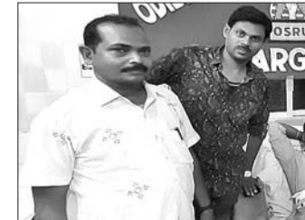
ଜିଲ୍ଲା ପ୍ରମୁଖ ଡାକ୍ତରଖାନାରେ ଅନୁଷ୍ଠିତ ରକ୍ତଦାନ ଶିବିର ।

ବରଗଡ଼-ସୋହେଲା ରାସ୍ତାର ଚକରକେନ୍ଦ୍ର ନିକଟ ଏକ ଘରୋଇ ଘାଟିନିଧିରେ କଲେଜ ପାଖରେ ଅସହାୟ ବୃଦ୍ଧଙ୍କୁ ରବିବାର ସ୍ୱେଚ୍ଛାସେବୀମାନେ ଉଦ୍ଧାର କରିଛନ୍ତି । ନିଷ୍ଠା ପରିବାରର ସ୍ୱେଚ୍ଛାସେବୀମାନେ ତାଙ୍କୁ ଉଦ୍ଧାର କରି ବରଗଡ଼ ଜିଲ୍ଲା ପ୍ରମୁଖ ଡାକ୍ତରଖାନାରେ ଭର୍ତ୍ତି କରିଛନ୍ତି । ଉଦ୍ଧାର ହୋଇଥିବା ବୃଦ୍ଧଙ୍କ ପରିଚିତ ମିଳିପାରିନାହିଁ । ନିଷ୍ଠାର ଯୋଗେ ଉଦ୍ଧାର କରାଯାଇ ଏବଂ ଅନ୍ୟମାନେ ତାଙ୍କୁ ଉଦ୍ଧାର କରିଥିଲେ ।