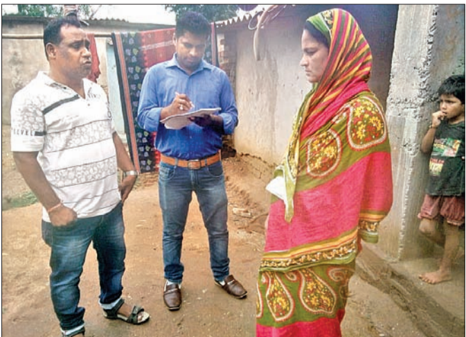
ଶିଶୁ ସୁରକ୍ଷା ଯୁନିଟ୍‌ର କର୍ମଚାରୀ ତଦ୍‌ବନ୍ଧ କରୁଛନ୍ତି।