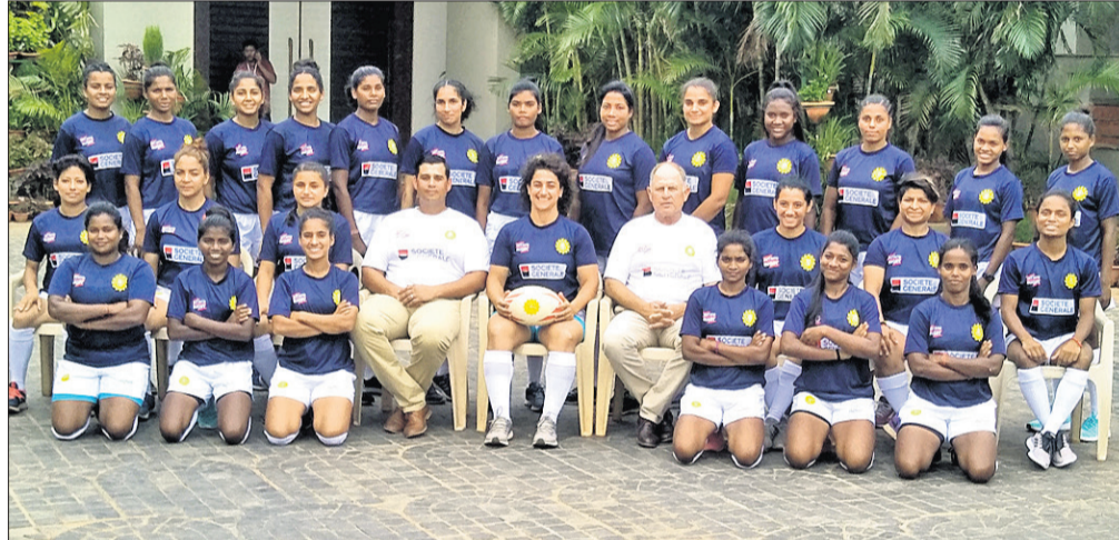
ଏସିଆ ମହିଳା ରଗ୍‌ବା ଚାମ୍ପିୟନଶିପ୍ ପାଇଁ ମନୋନୀତ ଭାରତୀୟ ଦଳ ।