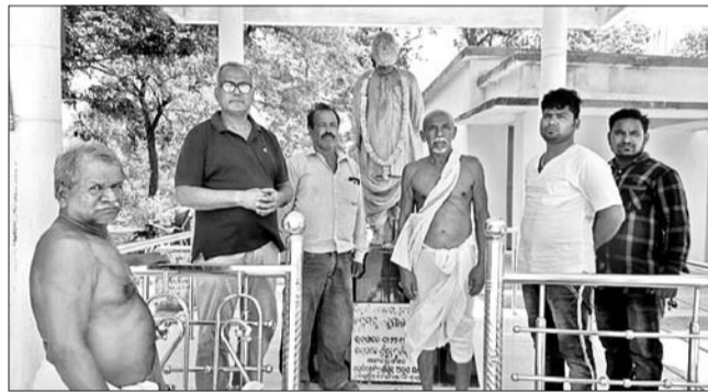
ଜନନେତା ପ୍ରସନ୍ନ ପଣ୍ଡାଙ୍କ ପ୍ରତିମୂର୍ତ୍ତିରେ ପୁଷ୍ପମାଲ୍ୟ ଅର୍ପଣ କରାଯାଇଛି।

ବାଧକ ପାଲଟିଛି। କିଏ ଚିକେଟ ହରାଇବା ଭୟରେ ପାର୍ଟି ଖୋଲୁନି ତ ଆଉ କେହି କେନ୍ଦ୍ରୀକରଣ ହୋଇ ରହିଲେ ରାଜ୍ୟର ସାମଗ୍ରିକ ବିକାଶ ସମ୍ଭବ ହେବନି। ସ୍ଵାଧୀନତାର ୭୦ବର୍ଷ ପରେ ବି ପଶ୍ଚିମ ୧୬ଶହ କି.ମି. ରାସ୍ତା ଅତିକ୍ରମ କରିବାକୁ ପଡିବ। ଦିନକୁ ୫୦କିମି ରାସ୍ତା ଅତିକ୍ରମ କରିବାକୁ ଲକ୍ଷ୍ୟ ରହିଛି। ୩୦ରୁ ୩୫ ଦିନ ମଧ୍ୟରେ ଦିଲ୍ଲୀରେ ପହଞ୍ଚି ପ୍ରଧାନମନ୍ତ୍ରୀ ନରେନ୍ଦ୍ର ମୋଦିଙ୍କୁ ଭେଟି ଦାବି ଜଣାଇବେ। ତାଙ୍କର ଦୃଢ଼ ବିଶ୍ଵାସ ରହିଛି ଯେ ପ୍ରଧାନମନ୍ତ୍ରୀ ତାଙ୍କ ଦାବିକୁ ଗୁରୁତ୍ଵ ଦେବେ। କୋଶଳ