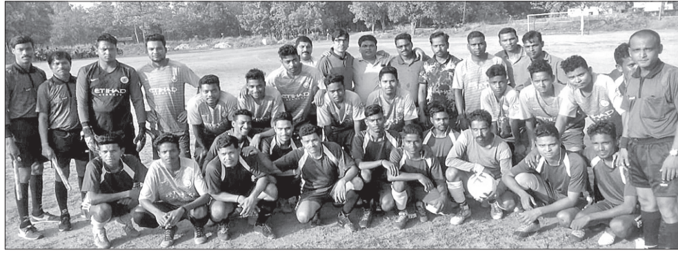
ଉଭୟ ଦଳର ଖେଳାଳିଙ୍କ ସହ ଅତିଥିମାନେ।

ଝାରସୁଗୁଡ଼ା ଜିଲ୍ଲା ଲକ୍ଷ୍ମୀନଗର କ୍ଲବ ବନ୍ଧବାହାଲ ପଞ୍ଚାୟତ ମାଝିପଡ଼ା ଖେଳପଡ଼ିଆରେ ମାଝିପଡ଼ା ଫୁଟବଲ୍ ଟିମ୍ ଓ ବନ୍ଧବାହାଲ ଭେଡେରାମକ ମିଳିତ ଆରୁକ୍ଲ୍ୟରେ ରବିବାର ଫୁଟବଲ୍ ଲିଗ୍ ଟୁର୍ନାମେଣ୍ଟ ଉଦ୍‌ଘାଟିତ ହୋଇଛି। ଏଥିରେ ୧୦ ଟିମ୍ ଆଂଶଗ୍ରହଣ କରୁଛନ୍ତି। ଆସନ୍ତା ୧୦ ତାରିଖ ପର୍ଯ୍ୟନ୍ତ ଟୁର୍ନାମେଣ୍ଟ ଚାଲିବ। ଉଦ୍‌ଘାଟନୀ ମ୍ୟାଚ୍ ଆୟୋଜକ ମାଝିପଡ଼ା ଫୁଟବଲ୍ ଟିମ୍ ଓ ବନ୍ଧବାହାଲ ୭୩ କ୍ଲବ ମଧ୍ୟରେ ଖେଳାଯାଇଥିଲା। ୭୩ କ୍ଲବ ମାଝିପଡ଼ାକୁ ୧-୦ ଗୋଲରେ ପରାସ୍ତ କରିଛି। ଉଦ୍‌ଘାଟନୀ ଉତ୍ସବରେ ବରିଷ୍ଠ