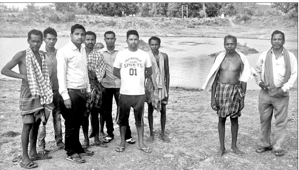
କୁର୍ମିବନ୍ଧ ନିକଟରେ ଗ୍ରାମବାସୀ।