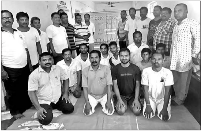
ତାଲିମ ଶିବିରରେ ଉପସ୍ଥିତ ଯୋଗ ଶିକ୍ଷକ ।