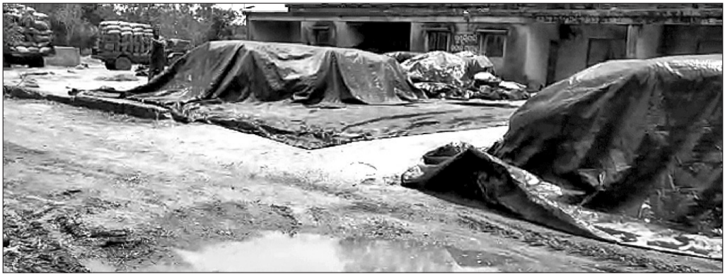
ଖୁଣ୍ଟିପାଲି ମଣ୍ଡିରେ ବିକ୍ରି ଅପେକ୍ଷାରେ ପଡ଼ି ରହିଥିବା ଧାନ ।

ବରଗଡ଼ ଜିଲ୍ଲାରେ ଖରିଫ ଧାନ ସଂଗ୍ରହ ପ୍ରକ୍ରିୟାକୁ ଆଉ ସମ୍ପାଦକ ପରେ ଦେଖିବାକୁ ଦିଆଯିବ । ଏହି ପ୍ରକ୍ରିୟାରେ ଜିଲ୍ଲାରେ ଖୋଲା ଯାଇଥିବା ମଣ୍ଡି ତଥା ଧାନକ୍ରୟ କେନ୍ଦ୍ର ଗୁଡ଼ିକରେ ଉଭୟ ଧାନ ସଂଗ୍ରହ ଓ ଉଠାଣ ଚାଲିଛି । ମାତ୍ର ପୂର୍ବରୁ ନିୟନ୍ତ୍ରିତ କାର କମିଟି(ଆରଏମସି) ଅଧୀନ ମଣ୍ଡିଗୁଡ଼ିକରେ ଧାନ ସଂଗ୍ରହ ପ୍ରକ୍ରିୟା ସ୍ୱାଭାବିକ ହୋଇପାରିନାହିଁ । ସେହିପରି ବରଗଡ଼ ଓ ଅତୀତର ଆରଏମସି ଅଧୀନ କେତେକ ମଣ୍ଡିରେ ଧାନ ଉଠାଣ ମନ୍ଦ ଗତିରେ ଚାଲୁଥିବା ଅଭିଯୋଗ ହୋଇଛି । ଏଭଳି ସ୍ଥିତିରେ ଜିଲ୍ଲାରେ ଚାଷୀ ଅପତେଷ୍ୟ ବଢ଼ିବାରେ ଲାଗିଛି । ଅପତେଷ୍ୟ ଧାନ ସଂଗ୍ରହ ପ୍ରକ୍ରିୟାରେ ଗତ ଏପ୍ରିଲ ମାସରେ ଜିଲ୍ଲାପାଳ ଅଧିକାରୀଙ୍କ ନିକଟରେ ଅନୁରୋଧ ଧାନ ସଂଗ୍ରହ କମିଟି ନିଷ୍ପତ୍ତି ଉପରେ କିଛି ପରିବର୍ତ୍ତନ କରାଯାଇଛି । ଶୁକ୍ଳବାରଠାରୁ ଜିଲ୍ଲାର କେତେକ ଧାନକ୍ରୟ କେନ୍ଦ୍ର(ପିପିସି)କୁ ନିକଟସ୍ଥ ମାର୍କେଟ ଯାର୍ଡ(ଏମଏଲ)କୁ ସ୍ଥାନାନ୍ତର କରାଯାଇଛି । ଧାନ କିଣାବିକା ପ୍ରକ୍ରିୟାରେ ଉତ୍ତମ ପରିଚାଳନା ପାଇଁ ସେଭଳି କରାଯାଇଥିବା କୁହାଯାଉଛି ।