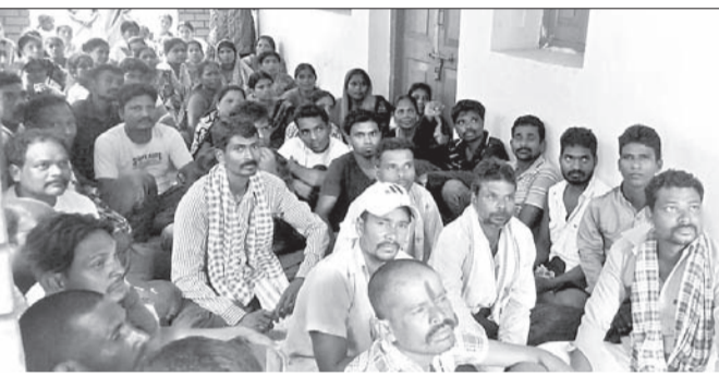
ବୈଠକରେ ଉପସ୍ଥିତ ସଫେଇ କର୍ମଚାରୀ।

ଦେବଗଡ଼ ପୌରପାଳିକାର ସଫେଇ କର୍ମଚାରୀଙ୍କ ପକ୍ଷରୁ ଏକ ଜରୁରୀକାଳୀନ ବୈଠକ ଘ୍ନାନାଥ ପ୍ରଧାନପାଠସ୍ଥିତ ପୌରପାଳିକା ତାଳକଳାକାରେ ଅନୁଷ୍ଠିତ ହୋଇଯାଇଛି। ଉକ୍ତ ବୈଠକରେ ସହରର ଶତାଧିକ ସଫେଇ କର୍ମଚାରୀ ଉପସ୍ଥିତ ରହି ନିଜର ମତାମତ ରଖିବା ସହ ବିଭିନ୍ନ ସମସ୍ୟା ନେଇ ଆଲୋଚନା କରିଥିଲେ। ସମସ୍ତଙ୍କର ସମ୍ମତ କ୍ରମେ ବୈଠକରେ ଆଲୋଚନା ହେଲା ଯେ, ଆଗାମୀ ୧୫ ଦିନ ଭିତରେ