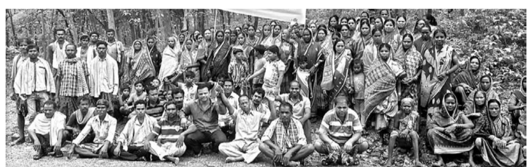
ବୋରମରା ଗ୍ରାମର ଲୋକେ ଜଙ୍ଗଲ ସୁରକ୍ଷା ପାଇଁ ଶପଥ ନେଇ ମେଳ ହୋଇଛନ୍ତି।