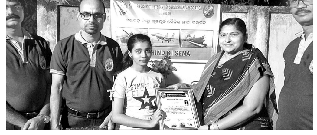
ଭୂତପୂର୍ବ ସୈନିକ ସଂଘ ପକ୍ଷରୁ କୃତାନ୍ତାତ୍ରାକୁ ସମର୍ଥନ ଜ୍ଞାପନ କରାଯାଇଛି ।