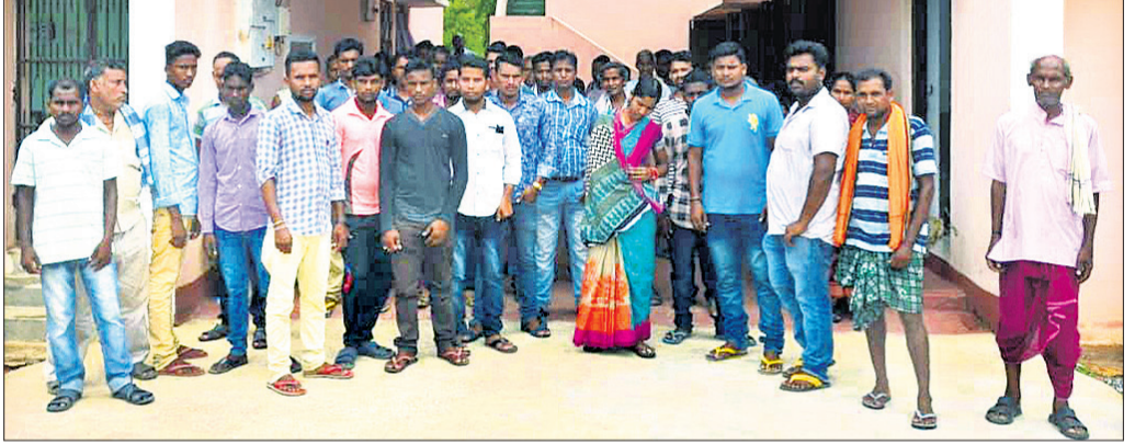
ଅଭିଯୁକ୍ତ ଗିରଫ ଦାବିରେ ବାରମହାରାଜପୁର ଏସ୍‌ପିଓଙ୍କ ଦସ୍ତଖତ୍ ଆସିଥିବା କର୍ମ୍ପାଳି ଗ୍ରାମବାସୀ।

ଝାରସୁଗୁଡ଼ା ଜିଲ୍ଲା ଲଲକେରା ଥାନା ନିର୍ମଳା ଅଞ୍ଚଳର ଜଣେ ନାବାଳିକାଙ୍କୁ ଅପହରଣ ପରେ ବଳାକ୍ତାର କରାଯାଇଥିବା ଅଭିଯୋଗ ହୋଇଛି। ଗତ ମେ' ୨୩ ତାରିଖରୁ ନାବାଳିକା ଜଣକ ନିଖୋଜ ଥିଲେ। ତାଙ୍କୁ ଅପହରଣ କରାଯାଇଥିବା ନେଇ ପରିବାର ପକ୍ଷରୁ ମେ ୨୯ରେ ଥାନାରେ ଲିଖିତ ଅଭିଯୋଗ ହୋଇଥିଲା। ଅଭିଯୋଗ ପରେ ପୋଲିସ୍ ତଦ୍‌ବିଧୀ ପ୍ରକାଶ କରି ଖୋଜାଖୋଜି କରିଥିଲା। ଶୁକ୍ରବାର ପୋଲିସ୍ ନାବାଳିକାଙ୍କୁ ଓଡ଼ିଶା ଓ ଥାନା ଅଞ୍ଚଳରୁ ଉଦ୍ଧାର କରିଛି। ଏଥିସହ ଅପହରଣ ସିଦ୍ଧାନ୍ତ ବଞ୍ଚେଇ (୨୧)କୁ ଗିରଫ କରି କୋର୍ଟଚାଲାଣ କରିଛି। ପୋଲିସ୍ ସୂଚନା ଅନୁସାରେ, ଅପହରଣ ପରେ ସିଦ୍ଧାନ୍ତ ନାବାଳିକାଙ୍କୁ ସମ୍ଭାଳିବା ପାଇଁ ଅଧିକାରୀଙ୍କୁ ଚାକିରି ଦିଆଯାଇଛି। ପରେ ଘରକୁ ଆଣି ରଖିଥିଲେ। ପୋଲିସ୍ ସିଦ୍ଧାନ୍ତକ ବିରୋଧରେ ଦଫା ୩୭୬ (୩), ୩୭୩ ଦଣ୍ଡା ଆକ୍ଟରେ ମାମଲା ରୁଜୁ କରିଛି।