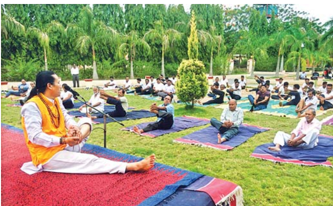
ଯୋଗଶିକ୍ଷାରେ ସାମିଲ ହୋଇଥିବା ଲୋକମାନେ।

ଜଳ ଧାରଣ କ୍ଷମତା ୬୭୦୦ ହେକ୍ଟୋମିଟର ଥିବା ବେଳେ ସର୍ବାଧିକ ଜଳସ୍ତର ୧୯୨.୬୩ ମିଟର ଓ ସର୍ବନିମ୍ନ ୧୮୨.୮୮ ମିଟର। ବର୍ତ୍ତମାନ ଏହାର ଜଳସ୍ତର ୧୮୪.୨୫ ମିଟର ରହିଛି। ଏହି ଜଳଭଣ୍ଡର ଜଳସେଚନ ବ୍ୟତୀତ ମାଲକାନଗିରି ସହରକୁ ପାନୀୟ ଜଳ ଯୋଗାଇ ଦେଉଥିବାରୁ ବର୍ତ୍ତମାନ ଛୁଟିଦିନ ଚାଷକର୍ମ ପାଇଁ ଜଳ ଯୋଗାଣ ଅସମ୍ଭବ ହୋଇପଡ଼ିଛି। ବିଶେଷ କରି ଜୁନ ୧୫ରେ ଖରିପ ଚାଷ ପାଇଁ କେନାଲରେ ଜଳ ଛଡ଼ାଯିବା କଥା। ମାତ୍ର ଜଳଭଣ୍ଡରରେ ଜଳ ଅଭାବରୁ କେନାଲରେ ଜଳ ଛଡ଼ାଯାଇପାରି ନ ଥିବା ବିଭାଗୀୟ ପୁରୁଷ ଜଣାପଡ଼ିଛି। ଏହି ସମୟରେ ଜଳ ଛଡ଼ାଗଲେ ଚାଷୀମାନେ ତଳି ପକାଇବା କାର୍ଯ୍ୟ ଆରମ୍ଭ କରିଥାନ୍ତି। ଜଳଯୋଗାଣ ହୋଇପାରୁ ନ ଥିବାରୁ ଚାଷ କାର୍ଯ୍ୟ ଆଗେଇପାରୁନାହିଁ। ଏହି ସଙ୍କଟ ହେଲେ ବିଭିନ୍ନ ଉପାୟ ଅବଲମ୍ବନ କରିବା ଜରୁରୀ ହୋଇପଡ଼ିଛି। ବିଶେଷ କରି ବର୍ଷା ଓ ନଦୀ ଜଳକୁ ସଂରକ୍ଷଣ ସହ ଗ୍ରାସ୍ତ୍ର ପ୍ରବାହ ଯୋଗୁ ଭୂତଳ ଜଳ ନିମ୍ନଗାମୀ ହୋଇଥିବାରୁ ଏହାକୁ ରୋକିବା ପାଇଁ ବହୁଳ ପରିମାଣରେ ବୃକ୍ଷରୋପଣ ଓ ପ୍ରାକୃତିକ ଜଳ ସଂରକ୍ଷଣର ଆବଶ୍ୟକତା ରହିଛି ବୋଲି ପରିବେଶବିତ୍ମାନେ ମତ ଦେଇଛନ୍ତି।