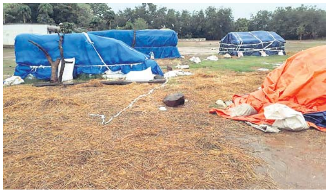
ଅଣ୍ଡାମା ମଣ୍ଡିଲ୍ଲରେ ଧାନ ଭିଜୁଛି