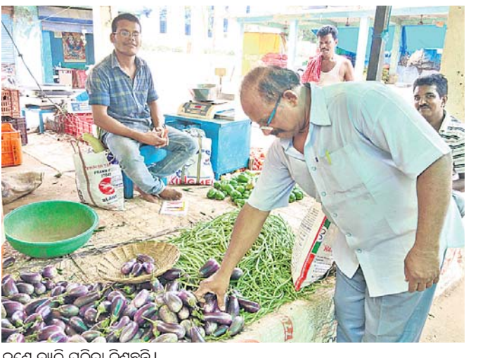
ଜଣେ ବ୍ୟକ୍ତି ପରିବା କିଣୁଛନ୍ତି।

ମାଲକାନଗିରି ଜିଲ୍ଲାର ପୋଟେରୁ ଓ ସତୀଗୁଡ଼ା ଭଳି ୨ଟି ବ୍ଲକ୍ ଓ ମଧ୍ୟମ ମାଟିବନ୍ଧ ଯୋଜନା ରହିଛି। ଏହି ମାଟିବନ୍ଧ ଯୋଜନାରେ କୃଷିକ୍ଷେତ୍ରକୁ ଜଳସେଚନର ସୁବିଧା କରାଯାଇଛି। ମାତ୍ର ଚଳିତବର୍ଷ ଗ୍ରାସ୍ତ୍ର ଋତୁରେ ପ୍ରଚଣ୍ଡ ଗୋଡ଼ାପ ପୋରୁ ଜଳାଶୟନକୁ ଜଳସ୍ତର ହ୍ରାସ ଘଟିଛି। ଏହାର ପ୍ରଭାବ କୃଷିକ୍ଷେତ୍ରକୁ ଉପରେ ପଡ଼ିଛି। ଜଳଯୋଗାଣ ବନ୍ଦ ରହିଥିବାରୁ ଖରାଦିନିଆ ପରିସରିବା ଚାଷ ହୋଇପାରିନାହିଁ। ଉଠାଜଳସେଚନ ପ୍ରକଳ୍ପକୁ ମଧ୍ୟ ଅଟକ ହୋଇପଡ଼ିଛି। ଉଠା ଜଳସେଚନ ଦ୍ୱାରା ମାଲକାନଗିରି ଚାଷୀମାନେ ଭେଣ୍ଡି, ବାଲଗଣ, ଚରଭୁଜ, କାହୁଡ଼ି, ପୋଟଳ ଆଦି ଚାଷ କରିଥାନ୍ତି। ଏହି ପରିସରିବା ବେଳେବେଳେ ପତୋଶୀ ରାଜ୍ୟକୁ ଚାଲିଯିବା ହୋଇଥାଏ। ଅନ୍ୟପକ୍ଷରେ ମାଲକାନଗିରି ଜିଲ୍ଲାକୁ କୋରାପୁଟ ଓ ଆନ୍ଧ୍ର ପ୍ରଦେଶକୁ ପରିସରିବା ଆସି ଥାଏ। ପରିସରିବା ଚାଷ ହୋଇପାରି ନ ଥିବାରୁ ମାଲକାନଗିରି ସରକାରଙ୍କୁ ମାଲକାନଗିରି ପରିବା ଦର ଆକାଶ ଛୁଆଁ