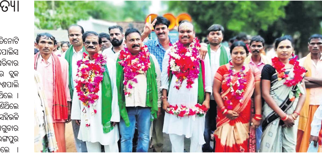
ଡାକ୍ତରୀଠାରେ ଶୋଭାଯାତ୍ରାରେ ବିଧାୟକଙ୍କ ସହ ଅନ୍ୟମାନେ ଯାଉଛନ୍ତି

ନବରଙ୍ଗପୁର ଜିଲ୍ଲାରେ ଗୋଟିଏ ଦିନରେ ତିନୋଟି ଆମ୍ବୁତ୍ୟା ଘଟିଛି। ନବରଙ୍ଗପୁର ପୋଲିସ୍ ଠାନୁରେ କଟକ କରି ବ୍ୟବହୃତ ପରେ ପରିବାର ଲୋକଙ୍କ ହସ୍ତାନ୍ତର କରିଛି।