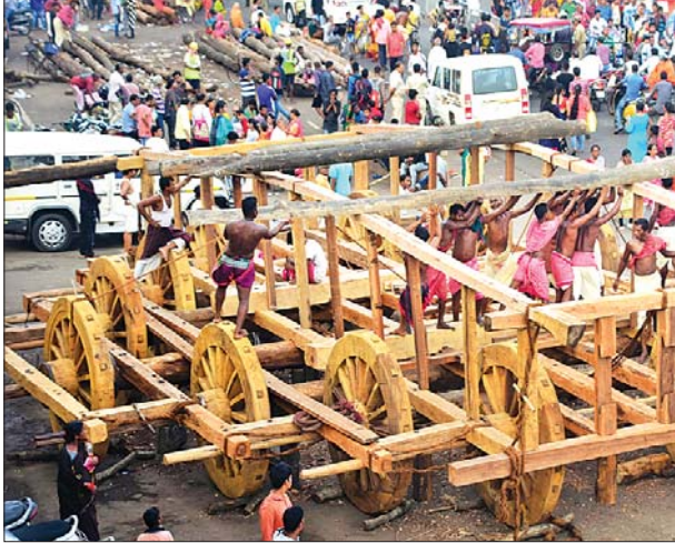
ପୁରୀ ଅଫିସ୍, ୧୬୬୭

ଅକ୍ଷୟ ତୃତୀୟାଠାରୁ ଶ୍ରୀନଗର ସମ୍ପୂର୍ଣ୍ଣ ରଥଖଳାରେ ଚାଲି ରଥଖଳା। ତିନି ମୁଖ୍ୟ ବିଶ୍ୱକର୍ମାଙ୍କ ପ୍ରତ୍ୟକ୍ଷ ତତ୍ତ୍ୱାବଧାନରେ ଚାଲି ରଥଖଳା। ଗତକାଳି ତିନି ରଥର ତଳେ ଖଞ୍ଜାଯାଇଥିବା ଦକ୍ଷା ନୟର କରାଯାଇ ଅଖ ଉପରେ ଉଠିଥିଲା। ପରେ କଣ୍ଠା ଖଞ୍ଜାଯାଇ ନିରାତି ଉଠିଥିଲା। ସୋମବାର ପବିତ୍ର ସ୍ନାନ ପୂର୍ଣ୍ଣିମା ପରମ୍ପରା ଅନୁଯାୟୀ ୪ ନାହାକା ଉଠିବ। ଏନେଇ ପ୍ରସ୍ତୁତି ସାଙ୍ଗଠନିକ ଦକ୍ଷତା ଅପେକ୍ଷା ନିର୍ଦ୍ଦିଷ୍ଟ ଗୋଷ୍ଠୀ ପ୍ରତି ଆନୁଗତ୍ୟ ରଖୁଥିବା ବ୍ୟକ୍ତିଗଣଙ୍କୁ ପୁରସ୍କୃତ କରାଯାଇଥିଲା। ଚଳିତ ଥର ସେପରି ହେବାକୁ ଯାଉଥିବାରୁ ଆଗକୁ ଯୁବ ବର୍ଗ ବିଜେଡି ପ୍ରତି ବିପୁଳ ହୋଇପାରିବ ବୋଲି କେତେକଣ ରାଜନୈତିକ ବିଶ୍ଳେଷକ ମତ ଦେଇଛନ୍ତି।