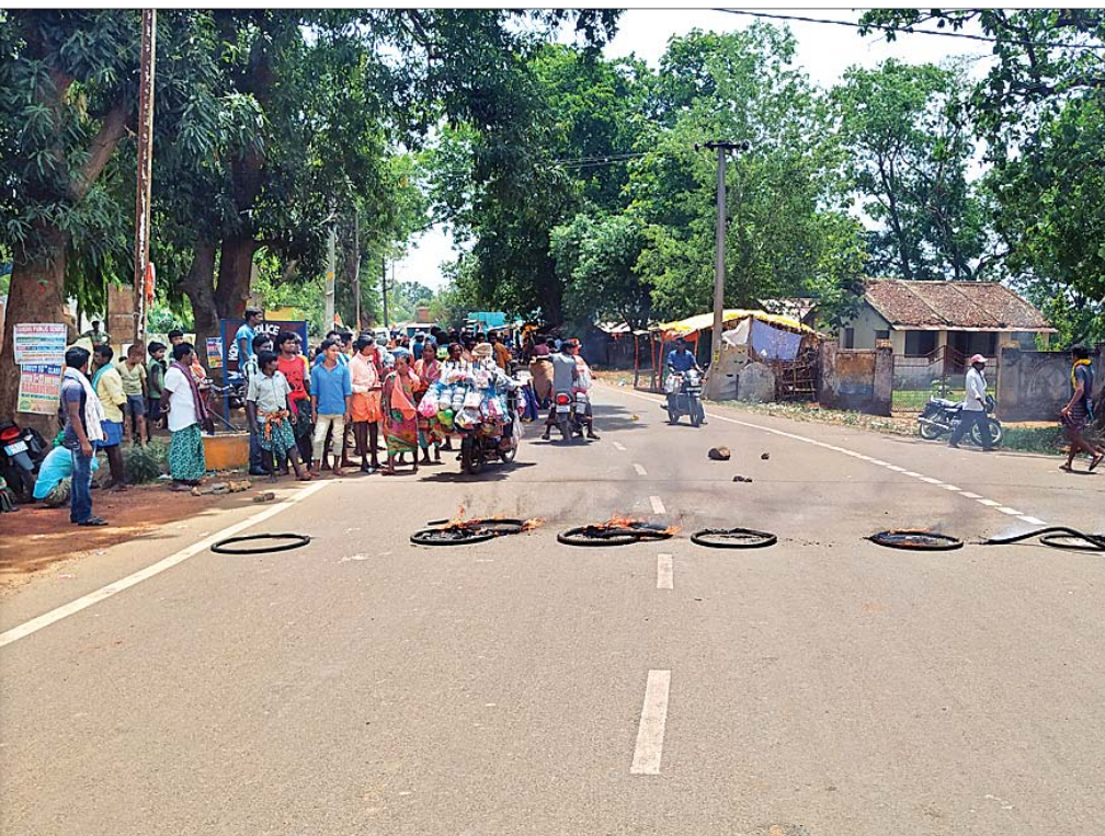
ଗ୍ରାମବାସୀ ଚାନ୍ଦିନୀକାଳି ରାସ୍ତାଚୋକୋ କରୁଛନ୍ତି ।