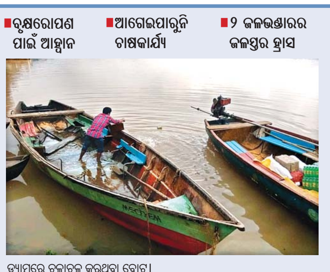
ତ୍ୟାମ୍ବରେ ଚଳାଚଳ କରୁଥିବା ବୋର୍ଟ।

ଜୁନ ୧୬ରେ ବିଶ୍ୱ ଅନାବୃଷ୍ଟି ଓ ମନୁଡ଼ି ପ୍ରତିରୋଧ ଦିବସ ପାଳନ ହେବାକୁ ଯାଉଛି। ଏହି ଦିବସ କୃଷକମାନଙ୍କ ପାଇଁ ସବୁଠାରୁ ଗୁରୁତ୍ୱପୂର୍ଣ୍ଣ ଦିବସ। ବିଭିନ୍ନ କୃଷିଜନିତ ଖାଦ୍ୟଶସ୍ୟ ଉତ୍ପାଦନରେ ଜଳର ଆବଶ୍ୟକତା ଅପରିହାର୍ଯ୍ୟ। ଜଳ ବିନା କୃଷିକାର୍ଯ୍ୟ ଅସମ୍ଭବ। ଯେଉଁ ଦେଶ ଏବଂ ରାଜ୍ୟରେ କୃଷକମାନଙ୍କ ପାଇଁ ଉତ୍ତମାନ୍ତରଣ ବର୍ଷା ନ ହୁଏ ସେହି ଦେଶରେ ଖାଦ୍ୟଠାରୁ ଆରମ୍ଭ କରି ଆର୍ଥିକ ଓ ସାମାଜିକ ବିକାଶରେ ବାଧା ସୃଷ୍ଟି ହୋଇଥାଏ। ଫଳରେ ଜୀବନଗତରେ ଖାଦ୍ୟ ପାଇଁ ହାହାକାରୀ ପଡ଼ିଥାଏ। ବର୍ତ୍ତମାନ ପରିବେଶ ପ୍ରଦୂଷଣ ଯୋଗୁ ନିୟମିତ ବୃଷ୍ଟିପାତ ନ ହେବାରୁ ଏହାର ପ୍ରଭାବ ଜୀବଜଗତ ଉପରେ ପଡ଼ୁଛି। ଅନାବୃଷ୍ଟି ଓ ମନୁଡ଼ିକୁ କିପରି ପ୍ରତିରୋଧ କରିହେବ ସେ ନେଇ ସାରା ବିଶ୍ୱ ଚିନ୍ତିତ। ଏଥିପାଇଁ ପ୍ରତିବର୍ଷ ଜୁନ ୧୬କୁ ବିଶ୍ୱ ଅନାବୃଷ୍ଟି ଓ ମନୁଡ଼ି ପ୍ରତିରୋଧ ଦିବସ ରୂପେ ପାଳନ କରାଯାଉଛି। ଚଳିତ ବର୍ଷ ମୌସୁମୀ ବର୍ଷା ବିଳମ୍ବ ହୋଇଥିବାରୁ ଚାଷୀ କାର୍ଯ୍ୟରେ ଅଗ୍ରଗତି ହୋଇପାରିନାହିଁ। ଫଳରେ ମାଲକାନଗିରି ଜିଲ୍ଲାର ଚାଷୀ ଚିନ୍ତାରେ ରହିଛନ୍ତି। ଶତକଡ଼ା ୯୦