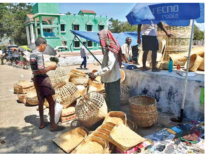
ହାଟରେ ପସରା ମେଲାଣି ଗ୍ରାହକଙ୍କ ଅପେକ୍ଷାରେ ବ୍ୟବସାୟୀ।

ଗଜପତି ଜିଲାର ଆଦିବାସୀ ଅଧିକାଂଶ ଅଞ୍ଚଳରେ ଦିନେ ସାମ୍ବାହିକ ହାଟର ବେଶ୍ ଚାହିଦା ରହିଥିଲା। କେଉଁ କାଳରୁ ଅଞ୍ଚଳବାସୀ ଏହା ଉପରେ ନିର୍ଭର କରିଆସୁଥିଲେ। ମାତ୍ର ସମୟର ପରିବର୍ତ୍ତନ ସହ ଏହି ପାରମ୍ପରିକ ସାମ୍ବାହିକ ହାଟର ଚାହିଦା ଧିରେ ଧିରେ କମିବାରେ ଲାଗିଛି।