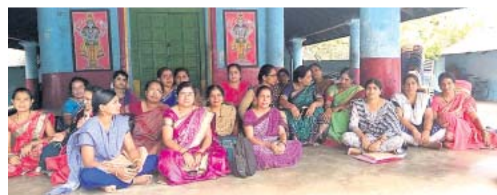
ଜିଲ୍ଲା ଆଇସିଡିଏସ୍ ସୁପରଭାଇଜର ସଂଘ ବୈଠକରେ ବିରୋଧ ପ୍ରଦର୍ଶନ କରାଯାଇଛି।

ବିଭିନ୍ନ ଯୋଜନାରେ ଦୁର୍ନୀତି କରିବା ସହ ଚଳା ବେକାରୁ ଉଦ୍ଧାର କରି ସିଡିପିଓ ମହାପାତ୍ର ଗତ ମଙ୍ଗଳବାର ସୁପରଭାଇଜର ନିର୍ଯ୍ୟାତନା ସାହୁଙ୍କୁ ମାନସିକ ନିର୍ଯ୍ୟାତନା ଦେଉଥିବା ଯୋଗୁ ସେ ଅଚେତ ହୋଇଯାଇଥିଲେ। ଚିକିତ୍ସାଳୟରେ ଭର୍ତ୍ତି କରାଯିବା ପରେ ତାଙ୍କର ଚେତା ଫେରିଥିଲା। ରବିବାର ବୈଠକରେ ଏଭଳି ଅଭିଯୋଗ ଉଠିବା ସହ ସୁପରଭାଇଜର ସଂଘର କର୍ମୀମାନଙ୍କୁ ନିର୍ଯ୍ୟାତନା ଦେଉଥିବା ସମ୍ବନ୍ଧରେ ସୁପରଭାଇଜର ମିଳିତ ଭାବେ ଜିଲ୍ଲାପାଳ ସାହୁ ଅଭିଯୋଗ ରଖିଥିଲେ। ଉକ୍ତ ବୁକର ଅନ୍ୟ ବୁକରଙ୍କ ସୁପରଭାଇଜର ଘଟଣା ସତ୍ୟ ବୋଲି କହିବା ସହ ସେମାନଙ୍କୁ ମଧ୍ୟ ନିର୍ଯ୍ୟାତନା ଦିଆଯାଉଥିବା ପ୍ରକାଶ କରିଥିଲେ। ସଂଘ ପକ୍ଷରୁ ସୁପରଭାଇଜର