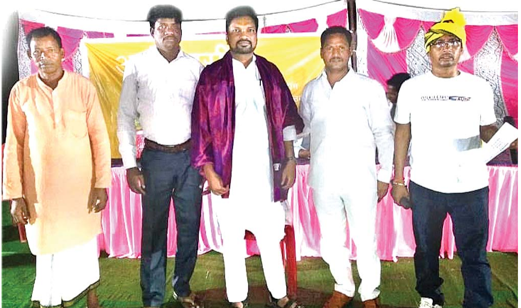
ପାଣ୍ଠାନ ଉଦ୍‌ଯାପନରେ ଯୋଗଦେଇଥିବା ଅତିଥିମାନେ।