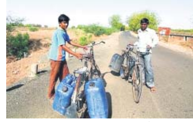
ହାଟପଦା ସାହିର ଲୋକେ ବଡ଼ ଜାରିକିନ୍ ଧରି ପାଣି ଆଣିବା ପାଇଁ ଦୂରକୁ ଯାଉଛନ୍ତି।

ଦଶମକ୍ରମର ବୁକ୍ ହାଟପଦା ସାହିରେ ଚାଣଖରା ସାଙ୍ଗକୁ ଖାଣ୍ଡି ପବନ ସହ ପାଣି ସମସ୍ୟା ଲୋକଙ୍କୁ ହତସ୍ତ କରୁଛି। ଉତ୍ତରକଳ୍ପ ଗାଁ ସ୍ଥିତ ତ୍ୟାମରେ ଜଳପୁର କମିଟି ସହ କେନାଲରେ ମଧ୍ୟ ପାଣି ଆସୁନାହିଁ। ଫଳରେ ହାଟପଦା ସାହିରେ ଥିବା ୩ଟି ନଳକୂପ ଏବଂ କୂଅର ପାଣି ଶୁଖିବାକୁ ଲାଗିଲାଣି। ଏହା ଉପରେ ୩୦ ପରିବାର ନିର୍ଭର କରନ୍ତି। ଶୁକ୍ରବାର ସାମ୍ବାହିକ ବ୍ୟବସାୟ ପାଇଁ ଆହୁଡ଼ିବା ଲୋକେ ମଧ୍ୟ ଏଠାରେ ଶୋଷଣ ମୋକ୍ଷଣ। ୩ ମାସରୁ ଉର୍ଦ୍ଧ୍ୱ ହେବ କେନାଲରେ ପାଣି ଶୁଖିଯିବା ଯୋଗୁ ଲୋକଙ୍କୁ ବୁଝାଏ ପାଣି ମଧ୍ୟ ମିଳିବା କଷ୍ଟକର ହୋଇପଡୁଛି। ବାଧ୍ୟହୋଇ ସେମାନେ ନିକଟସ୍ଥ ନଦୀ ଝରଣା ଏବଂ ଶିବ ମନ୍ଦିର ନିକଟସ୍ଥ ସାଲକ୍ରିୟା କଲୋନୀରେ ଥିବା ଏକ