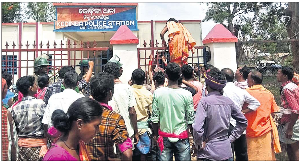
ଉତ୍ସାହ ଲୋକମାନେ କୋଡିଙ୍ଗା ଥାନା ଗେଟ୍ ଉପରେ ଚଢ଼ି ଭିତରକୁ ଯାଉଛନ୍ତି ।

ନବରଙ୍ଗପୁର/କୋଡିଙ୍ଗା/ପାପଡ଼ାହାଣ୍ଡି, ୧୬.୬.୧୯(ବି.ପ୍ର./ଡି.ଏନ.-୪)