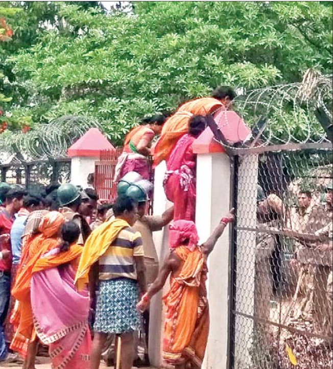
ମହିଳାମାନେ ଥାନା ରେଟ ଡେଇଁ ଭିତରକୁ ପଶୁଛନ୍ତି ।