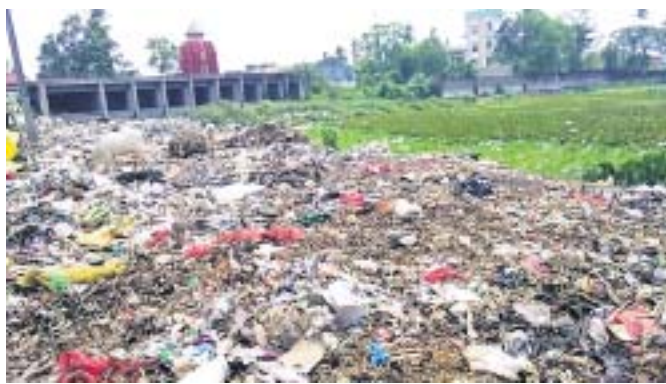
ଆବର୍ଜନାପୂର୍ଣ୍ଣ କଚେରି ପୋଖରୀ ।

ପଞ୍ଚାମୃତ କଚେରି ପୋଖରୀ ଏବେ ତୃଷ୍ଣାମାର୍ତ୍ତ ପାଲଟିଛି । ଫଳରେ ଅସଂଖ୍ୟକର ପରିବେଶ ସ୍ୱାସ୍ଥ୍ୟକୁ ମଶାବଂଶ ବୃଦ୍ଧି ପାଇବାରେ ଲାଗିଛି ।