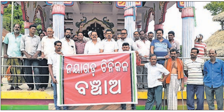
ମନ୍ଦିର ପରିସରରେ ତିନିକଳ ବନ୍ଦ ଅପିଏ କର୍ମକର୍ମୀ।

ନୟାଗଡ଼ ଜିଲ୍ଲା ସଦର ବ୍ଲକ ପାଣିପୋଇଳାଠାରେ ଥିବା ତିନିକଳ ବିକ୍ରି ନେଇ ଗୁଜବ ପ୍ରଚାର ହେବା ପରେ ଏବେ ଜିଲ୍ଲାସାରା ଗୋଟିଏ ଚର୍ଚ୍ଚା। କିପରି ଏହାର ସୁରକ୍ଷା ହେବ ବା ତିନିକଳ ଖୋଲିବ। ଏଥିପାଇଁ କୃଷକଙ୍କଠାରୁ ଆରମ୍ଭ କରି ସାଧାରଣ ଜନତା, ନେତା ସବୁ ଏକାଠି ହୋଇଛନ୍ତି। ସୂଚନାଯୋଗ୍ୟ ଜିଲ୍ଲାର ଥିବା ଏକମାତ୍ର ଏହି ତିନିକଳ ଝବର୍ଷ ହେଲା ବନ୍ଦ ହୋଇପଡ଼ିଥିବା ବେଳେ ଏହାକୁ ଗୁଜରାଟର ଏକ କମ୍ପାନୀ କିଣି ନେଇଥିବା ନେଇ ଆଲୋଚନା ହେଉଛି। ହେଲେ ଏ ନେଇ ପ୍ରଶ୍ନାତ୍ମକ ପାଖରେ କୌଣସି ଖବର ନ ଥିବା କୁହାଯାଇଛି।