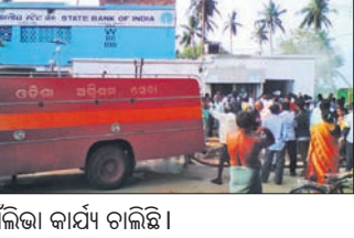
ନିଆଁଲାଗି କାର୍ଯ୍ୟ ଚାଲିଛି।

ଡେରାବିଶ, ୧୬।୬ (ସ.ପ୍ର.) ଡେରାବିଶ ରୁକ୍ମିଣୀ ଚାନ୍ଦୋଳସ୍ଥିତ ଭାରତୀୟ ଷ୍ଟେଟ୍ ବ୍ୟାଙ୍କରେ ରବିବାର ଅପରାହ୍ଣରେ ନିଆଁ ଲାଗି କେତେକ ବୈଦ୍ୟୁତିକ ସାମଗ୍ରୀ ପୋଡ଼ି ଯାଇଛି। ସୋମବାର ବ୍ୟାଙ୍କ ଖୋଲିବା ପରେ ପ୍ରକୃତ କ୍ଷୟକ୍ଷତିର ବିପର୍ଯ୍ୟୟ ଜଣାପଡ଼ିବ ବୋଲି କେତେକ ବୈଦ୍ୟୁତିକ ସାମଗ୍ରୀ ପୋଡ଼ି ଯାଇଛି। ସୋମବାର ବ୍ୟାଙ୍କ ଖୋଲିବା ପରେ ପ୍ରକୃତ କ୍ଷୟକ୍ଷତିର ବିପର୍ଯ୍ୟୟ ଜଣାପଡ଼ିବ ବୋଲି କେତେକ ବୈଦ୍ୟୁତିକ ସାମଗ୍ରୀ ପୋଡ଼ି ଯାଇଛି। ସୋମବାର ବ୍ୟାଙ୍କ ଖୋଲିବା ପରେ ପ୍ରକୃତ କ୍ଷୟକ୍ଷତିର ବିପର୍ଯ୍ୟୟ ଜଣାପଡ଼ିବ ବୋଲି କେତେକ ବୈଦ୍ୟୁତିକ ସାମଗ୍ରୀ ପୋଡ଼ି ଯାଇଛି।