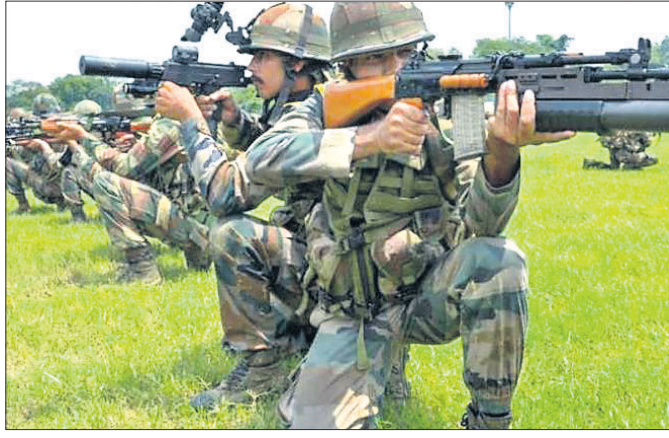
ଉତ୍ତରପୂର୍ବୀଞ୍ଚଳର ଅନେକ ଉଗ୍ରପନ୍ଥୀ ସଂଗଠନର ଶିବିର ଧ୍ୱଂସ ହୋଇଥିଲା। ପଡ଼ୋଶୀ ଦେଶ ମ୍ୟାନମାର ଭାରତର ଅନ୍ୟତମ ପ୍ରତିରକ୍ଷା ସହଯୋଗୀ।