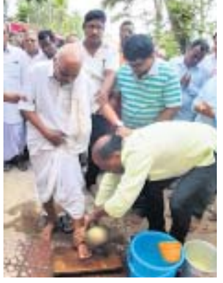
ଗୁରୁଙ୍କ ପାଦ ଧୋଇଛନ୍ତି ବିଧାୟକ ।

ରକ୍ତ ପବନ ଶେଷଦିନରେ ରାଜନଗର ବିଧାୟକ ଧ୍ରୁବ ଚରଣ ସାହୁଙ୍କ ଦ୍ୱାରା ଗୁରୁପୂଜନ କାର୍ଯ୍ୟକ୍ରମ ଅନୁମୋଦନ ପାଇଁ ଉଦ୍‌ଘାଟନା ସୃଷ୍ଟି କରିଛି । ରାଜନଗର ବ୍ଲକ ଓଡ଼ିଆ ପଞ୍ଚାୟତ ଜଗନ୍ନାଥପୁର ଶାସନ ନୋଡାଲ ଶିକ୍ଷା ନିକେତନ ପରିସରରେ ପୁରାତନ ଛାତ୍ରାହାରୀଙ୍କ ପକ୍ଷରୁ ଏହି କାର୍ଯ୍ୟକ୍ରମ ଆୟୋଜନ କରାଯାଇଥିଲା ।