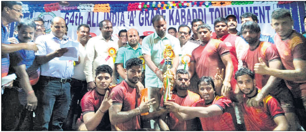
ଅତିଥି ଚାମ୍ପିୟନ ଟିମକୁ ପୁରସ୍କୃତ କରୁଛନ୍ତି।

ଯାଜପୁର ଜିଲ୍ଲା ରଘୁଲପୁର ବ୍ଲକ୍ ଖଣ୍ଡିତର କବାଡି ଷ୍ଟୁଡିୟମରେ ୪ଦିନ ଧରି ଚାଲିଥିବା ୧୪ତମ ସର୍ବଭାରତୀୟ ଏ ଗ୍ରେଡ୍ ପୁରୁଷ ଓ ରାଜ୍ୟସ୍ତରୀୟ ମହିଳା କବାଡି ପ୍ରତିଯୋଗିତା ରବିବାର ରାତିରେ ଉଦ୍‌ଯାପିତ ହୋଇଯାଇଛି। ମହିଳା ବିଭାଗ ଫାଇନାଲ ମ୍ୟାଚ୍‌ରେ କଟକ କବାଡି ଦଳ ୨୧-୧୬ ଯାକ୍‌ରେ ଓଡ଼ିଶା ପୋଲିସ୍ କବାଡି ଦଳକୁ ପରାସ୍ତ କରି ଚାମ୍ପିୟନ ହୋଇଛି। ସେହିପରି ପୁରୁଷ ବିଭାଗର ଫାଇନାଲ ମ୍ୟାଚ୍‌ ଆଦର୍ଶ କ୍ଲବ- ଦିଲ୍ଲୀ ଓ ଆୟକର ବିଭାଗ- ଗୁଜୁରାଟ ମଧ୍ୟରେ ଅନୁଷ୍ଠିତ ହୋଇଥିଲା। ଉକ୍ତ ମ୍ୟାଚ୍‌ରେ ଦିଲ୍ଲୀ ୫୦-୪୩ ଯାକ୍‌ରେ ଗୁଜୁରାଟ ଦଳକୁ ପରାସ୍ତ କରି ଟ୍ରଫି- ୨୦୧୯ ହାତେଇବାରେ ସକ୍ଷମ ହୋଇଛି। ରବିବାର ରୁନିମେଣ୍ଟରେ ୧୦ଟି ମ୍ୟାଚ୍‌ ଅନୁଷ୍ଠିତ ହୋଇଥିଲା। ଏ ସବୁ ମ୍ୟାଚ୍‌ ମଧ୍ୟରୁ ମହିଳା ବିଭାଗର ପ୍ରଥମ ସେମିଫାଇନାଲ ମ୍ୟାଚ୍‌ ଓଡ଼ିଶା ପୋଲିସ୍ ଓ ଆଦର୍ଶ ଦଳ ମଧ୍ୟରେ ଅନୁଷ୍ଠିତ ହୋଇଥିଲା। ଓଡ଼ିଶା ପୋଲିସ୍ ଏକତରଫା ଭାବେ ୩୦ ଯାକ୍‌ ବ୍ୟବଧାନରେ ପରାସ୍ତ କରି ଫାଇନାଲକୁ ପ୍ରବେଶ କରିଥିଲା। ୨ୟ