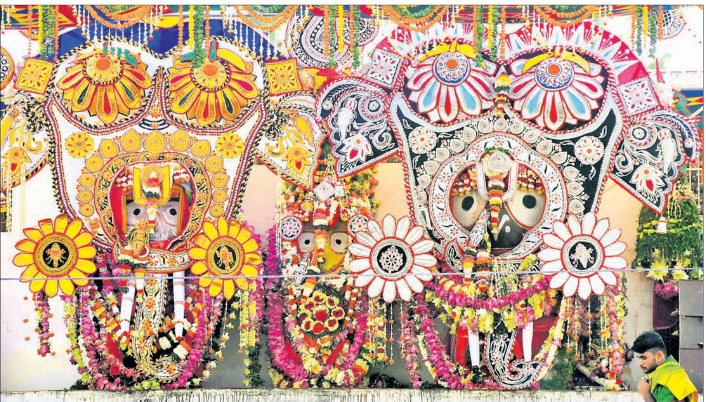
ହାତୀବେଶରେ ସଜିତ ହୋଇଛନ୍ତି ବାଲୁଦିଆଁ