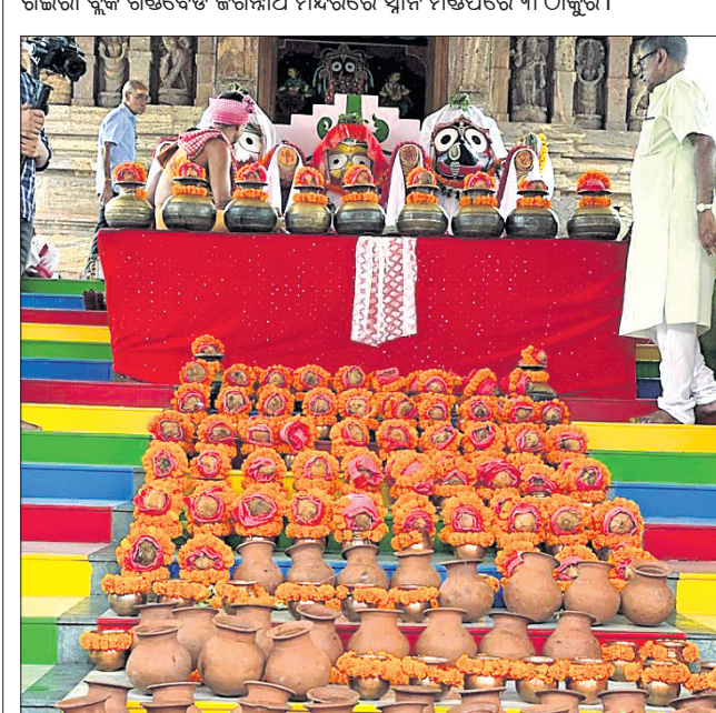
ରେପୁଣା ଲମାମାଠାରେ ସ୍ନାନମଣ୍ଡପରେ ଶ୍ରୀକାଉଳ।