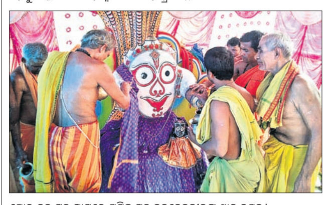
ସୋର ବ୍ଲକ ଗୁଡ଼ ଗ୍ରାମରେ ପ୍ରସିଦ୍ଧ ଗୁଡ଼ ବକଦେବକାଉଳ ସ୍ନାନ ଉତ୍ସବ।