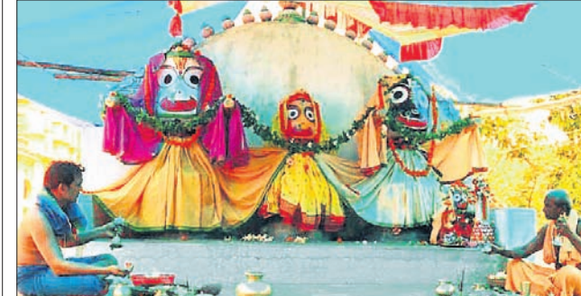
ବାହାନବା ବ୍ଲକର ପଥରପେଣ୍ଡ ଜଗନ୍ନାଥ ମନ୍ଦିର।