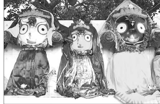
ବାରିପଦା: ସ୍ନାନବେଦୀରେ ତିନି ଠାକୁର ।