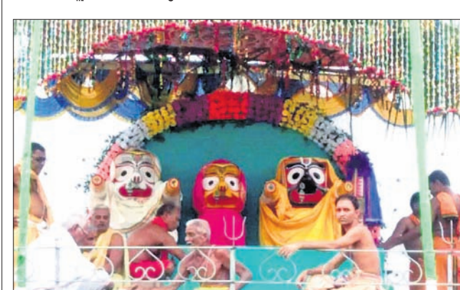
କଳେଶ୍ୱର ବ୍ଲକ ଛପିକାଠାରେ ଶ୍ରୀକାଉଳ ସ୍ନାନ ଉତ୍ସବ।