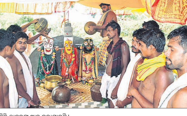
ତିନି ଠାକୁରଙ୍କୁ ସ୍ନାନ କରାଯାଇଛି।