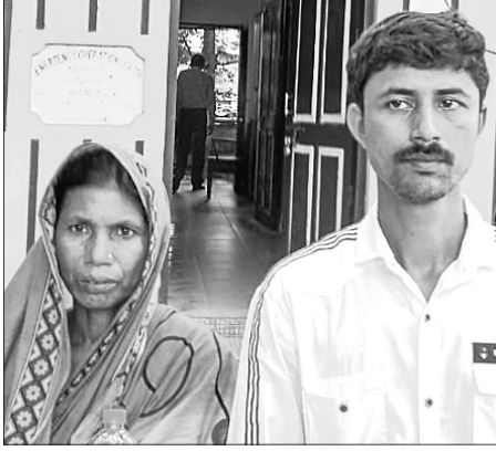
ଜିଲ୍ଲାପାଳଙ୍କ ଅଭିଯୋଗ କରିବାକୁ ଆସିଥିବା ମା' ପୁଅ।

ଏହି ଯୋଜନାରେ ତାଙ୍କର ପ୍ରାୟ ଅର୍ଥ ଅଧ୍ୟାୟ ଆକାଉଣ୍ଟକୁ ଯାଜୁଆ ଦିଆଯାଇଛି।