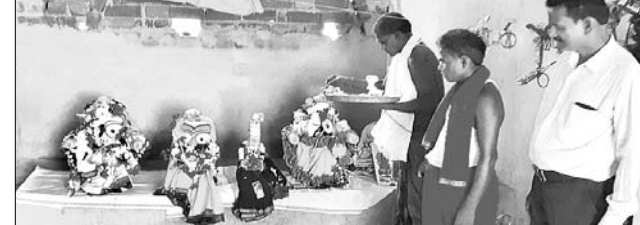
ଖୁଣ୍ଟା: ଠାକୁରଙ୍କ ସ୍ନାନନୀତି କରାଯାଇଛି ।