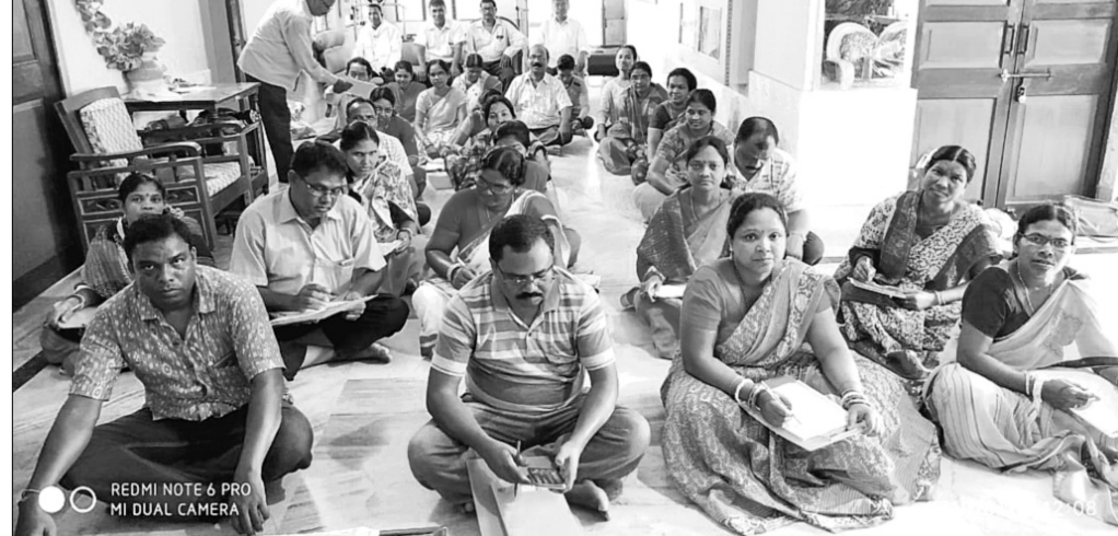
ବାରିପଦା: ପରୀକ୍ଷାର୍ଥୀମାନେ ପରୀକ୍ଷା ଦେଉଛନ୍ତି ।