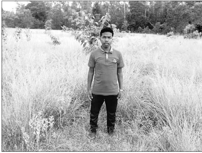
ସବାଇ ଘାସ ଚାଷ କରିଥିବା ଚାଷୀ ।

ସହୁଥିବାକୁ ଧୀରେ ଧୀରେ ଚାଷଠାରୁ ଦୂରରେ ଯାଇଛନ୍ତି । ସବାଇଘାସ ଅମଳ ହେବା ପୂର୍ବରୁ ମୂଳରେ ଉଚ୍ଚ ପ୍ରତିଷ୍ଠିତ ଲାଗିବା ଦ୍ୱାରା ଘାସ ନଷ୍ଟ ହେଉଛି । ଏପରିକି ଘାସରେ ଏକ ପ୍ରକାର ପୋକ ଲାଗିଲେ ଚାଷୀର ଅଗ୍ରଭାଗ ଲାଲ ହୋଇ ପୋତିଯିବା ସମ୍ଭବ ହୋଇଯାଏ । ଫଳରେ ସେହି ଘାସର ଚାହିଦା କମିଯାଇଥାଏ । ଲୋକମାନେ ପରିଷ୍କାର ପରିଚ୍ଛନ୍ନ ଘାସକୁ ହାତ ବଢ଼ାଉଛନ୍ତି କିନ୍ତୁ ନେଇ ଘରେ ବସି ଦଉଡ଼ି ବୋଲିଥାନ୍ତି । ବିଶେଷ କରି ଗରିବ ବିତା ବାନ୍ଧି ରଖାଯାଇଥାଏ । ଘାସର ଆବଶ୍ୟକତା ବଢ଼ିଲେ ବ୍ୟବସାୟୀମାନେ ଚାଷୀଙ୍କଠାରୁ କୁଳଖଣ୍ଡ ଦରରେ କିଣି ନିକଟସ୍ଥ ହାତ ବଢ଼ାଉଛନ୍ତି ବୁଝି କରିଥାନ୍ତି । ବର୍ତ୍ତମାନ ଏହି ଚାଷ କରି ଚାଷୀ କ୍ଷତି