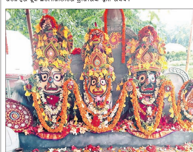
ଖଇରା ବ୍ଲକ ରଞ୍ଜିତେବେ ଜଗନ୍ନାଥ ମନ୍ଦିରରେ ସ୍ନାନ ମଣ୍ଡପରେ ମା ଠାକୁର।