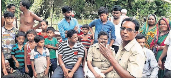
ପୋଲିସ୍ ତଦନ୍ତ କରୁଛି।

ଭଦ୍ରକ ଗ୍ରାମାଞ୍ଚଳ ଥାନା ଅନ୍ତର୍ଗତ ରାହାଞ୍ଜା ମଠସାହି ଛକ ନିକଟରେ ରବିବାର ରାତିରେ ୨ ଜଣ ଲୁଚେରା ଫାଙ୍କା ଗୁଳି ଚାଳନା କରି ଲୁଚି ଉଦ୍ୟମ କରିଛନ୍ତି। ଏହି ସମୟରେ ନମ୍ବର ବିହୀନ ବାଇକ୍ ସହ ୨ ଲୁଚେରା ନିକଟସ୍ଥ ପୋଖରୀରେ ଖସିପଡ଼ିଥିଲେ। ସେମାନଙ୍କୁ କାନ୍ଦୁ କରିବାକୁ ଗ୍ରାମବାସୀ ଉଦ୍ୟମ କରିଥିଲେ ମଧ୍ୟ ଅନ୍ଧାରର ପୁରୋଗ ନେଇ ଖସି ଯାଇଥିଲେ। ଖବର ପାଇ ରାତିରେ ପୋଲିସ୍ ପହଞ୍ଚି ପ୍ରାଥମିକ ତଦନ୍ତ କରି ଥାନାକୁ ନେଇଥିଲା। ପୋଖରୀ ନିକଟରେ ପଡ଼ିଥିବା ଲୁଚେରାଙ୍କ ବସ୍ତୁକ ଜମା ଦେଇଛନ୍ତି। ଏ ନେଇ ଗ୍ରାମାଞ୍ଚଳ ଥାନା ପୋଲିସ୍ ଏକ ମାମଲା(ନଂ. ୩୦୬/୧୯) ରୁଜୁ କରି ଘଟଣାର ତଦନ୍ତ ଚଳାଇଛି।