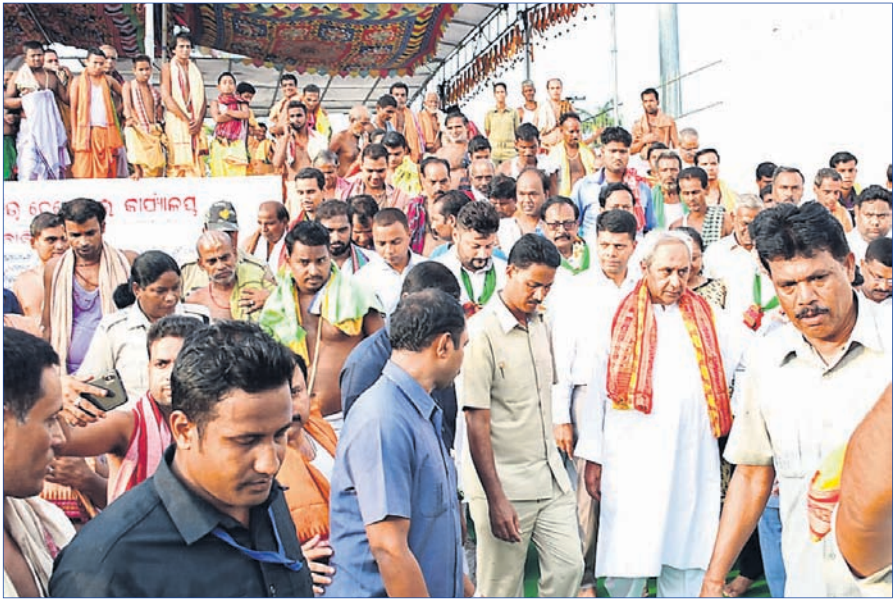
ଶ୍ରୀବଳଦେବଜୀଉଙ୍କୁ ସ୍ନାନମଣ୍ଡପରୁ ମୁଖ୍ୟମନ୍ତ୍ରୀ ଦର୍ଶନ ସାରି ଫେରୁଛନ୍ତି।

କେନ୍ଦ୍ରାପଡ଼ା ଜିଲ୍ଲା ଭୁବନା ଶ୍ରେଣୀଧର ଶ୍ରୀ ବଳଦେବଜୀଉଙ୍କୁ ସ୍ନାନମଣ୍ଡପରୁ ମୁଖ୍ୟମନ୍ତ୍ରୀ ନବୀନ ପଟ୍ଟନାୟକ ଦର୍ଶନ କରିଛନ୍ତି।