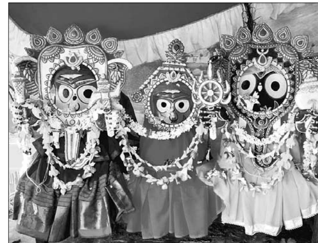
ବିଶୋଇ: ଗଜାନନ ବେଶରେ ତିନି ଠାକୁର ଭକ୍ତଙ୍କୁ ଦର୍ଶନ ଦେଉଛନ୍ତି ।

ଦ୍ୱିତୀୟ ଶ୍ରୀକ୍ଷେତ୍ର ମୟୂରଭଞ୍ଜ ଜିଲ୍ଲା ବାରିପଦା ଜଗନ୍ନାଥ ମନ୍ଦିରରେ ସୋମବାର ସ୍ନାନଯାତ୍ରା ଅନୁଷ୍ଠିତ ହୋଇଯାଇଛି । ସୋମବାର ଭୋର ୪ ଟା ସମୟରେ ମହାପ୍ରଭୁ ପହଞ୍ଚି ହୋଇ ସ୍ନାନ ମଣ୍ଡପକୁ ଆସିଥିଲେ । ୫ ଟା ବେଳେ ଗଜା ଦେବୀଙ୍କୁ ଆବାହନ ପରେ ମହାପ୍ରଭୁମାନଙ୍କ ସ୍ନାନ ନୀତି ଆରମ୍ଭ ହୋଇଥିଲା । ତିନି ପୂଜକ ସଙ୍କଳ୍ପ କରିବା ପରେ ୧୦୮ କଳସ ଜଳରେ ମହାପ୍ରଭୁଙ୍କ ମହାସ୍ନାନ କରାଯାଇଥିଲା । ସ୍ନାନ ପରେ ଚନ୍ଦନ ଲାଗି କରାଯାଇ ଫୁଲ ଚୁଲିଆ ବେଶରେ ଠାକୁରମାନଙ୍କୁ ସଜା ଯାଇଥିଲା । ସୂର୍ଯ୍ୟପୂଜା, ଦ୍ୱାରପାଳ ପୂଜା ଓ ଅବକାଶ ନୀତି ପରେ ଶାହାଶମେଳା ଆରମ୍ଭ ହୋଇଥିଲା । ଠାକୁରଙ୍କ ଦର୍ଶନ ଲାଗି ମନ୍ଦିର ପରିସରରେ ଶ୍ରଦ୍ଧାଳୁଙ୍କ ଭିଡ଼ ପରିଲକ୍ଷିତ ହୋଇଥିଲା ।