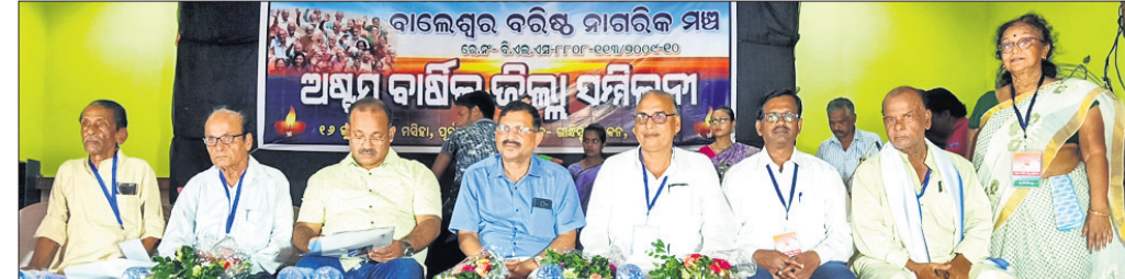
ବରିଷ୍ଠ ନାଗରିକ ମଞ୍ଚର ଅଷ୍ଟମ ବାର୍ଷିକ ଜିଲ୍ଲା ସମ୍ମିଳନୀରେ ମଞ୍ଚାସୀନ ଅତିଥି।