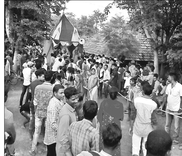
ଶ୍ରଦ୍ଧାଳୁମାନେ ରଥ ବାଣ୍ଟୁଛନ୍ତି ।

ପରି ପୂଜା ପାଲଟେ । ସମସ୍ତ 'କ୍ଷେତ୍ର'ରେ ଦିଅଁମାନେ ଅଣସର ଘରେ ରହି ସୋମାନେ ପଟଦିଅଁରେ ବିଷ୍ଣୁ ମହେଶ୍ୱର ଓ ଶକ୍ତି ରୂପରେ ପୂଜା ପାଲଟାନ୍ତି । ହେଲେ ଏହି ଗ୍ରାମର ଜଗନ୍ନାଥ ମନ୍ଦିରରେ ନିଆରା ପରମ୍ପରା ତିନି ଠାକୁର ନିଜ ନିଜ ରୂପରେ ପୂଜା ପାଆନ୍ତି । ଫଳରେ ସ୍ନାନ ପୂର୍ଣ୍ଣିମା ଦିନ ଠାକୁ ନବ ଯୌବନ ଦର୍ଶନ ପର୍ଯ୍ୟନ୍ତ ଏଠାରେ ଭକ୍ତଙ୍କ ଭିଡ଼ ଲାଗି ରହିଥାଏ । ଏଠାରେ ଅନ୍ୟ ଏକ ବିଶେଷତ୍ୱ ରହିଛି ପ୍ରଣାମନ ଦୃଷ୍ଟିକୁ ଆସିପାରୁ ନାହିଁ । ମାତ୍ର ଦେବସ୍ନାନ ପୂର୍ଣ୍ଣିମାରେ ରଥଯାତ୍ରା ଦେଖିବାକୁ ଆଖପାଖ ଅଞ୍ଚଳର ବହୁ ଶ୍ରଦ୍ଧାଳୁଙ୍କ ଭିଡ଼ ଲାଗିଥାଏ ।