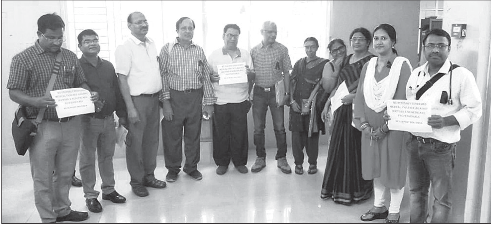
ଡାକ୍ତରଙ୍କ କଳାବ୍ୟାଜ ପିନ୍ଧି ପ୍ରତିବାଦ।