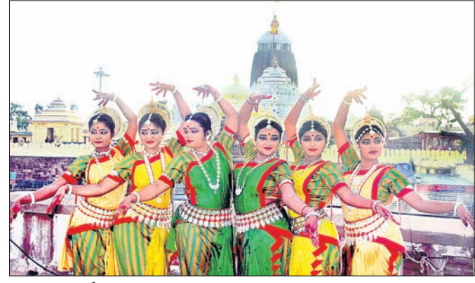
ଦେବସ୍ନାନ ପୂର୍ଣ୍ଣିମା ଅବସରରେ ଶ୍ରୀକ୍ଷେତ୍ରରେ ଶିଳ୍ପୀ ଓଡ଼ିଶା ନୃତ୍ୟ ପରିବେଷଣ।