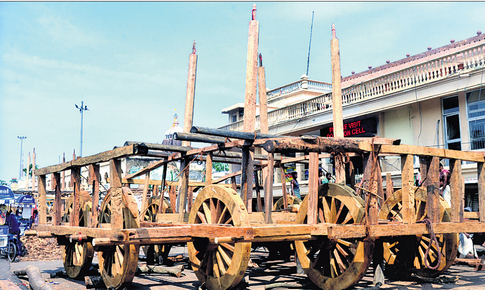
ପୁରୀ ଅଫିସ, ୧୭।୬-

ସୋମବାର ପବିତ୍ର ଦେବସ୍ନାନ ପୂର୍ଣ୍ଣିମାରେ ତିନିରଥର ୪ ନାହାକା ଉଠିଛି। ଅକ୍ଷୟତୃତୀୟା ଠାରୁ ଶ୍ରୀମନ୍ଦିର ସମ୍ମୁଖ ମଙ୍ଗଳାବାର କୋର୍ଟ ବାଲୀକା କରାଯିବ ବୋଲି ପୋଲିସ୍ ସୂଚନା ଦେଇଛି।