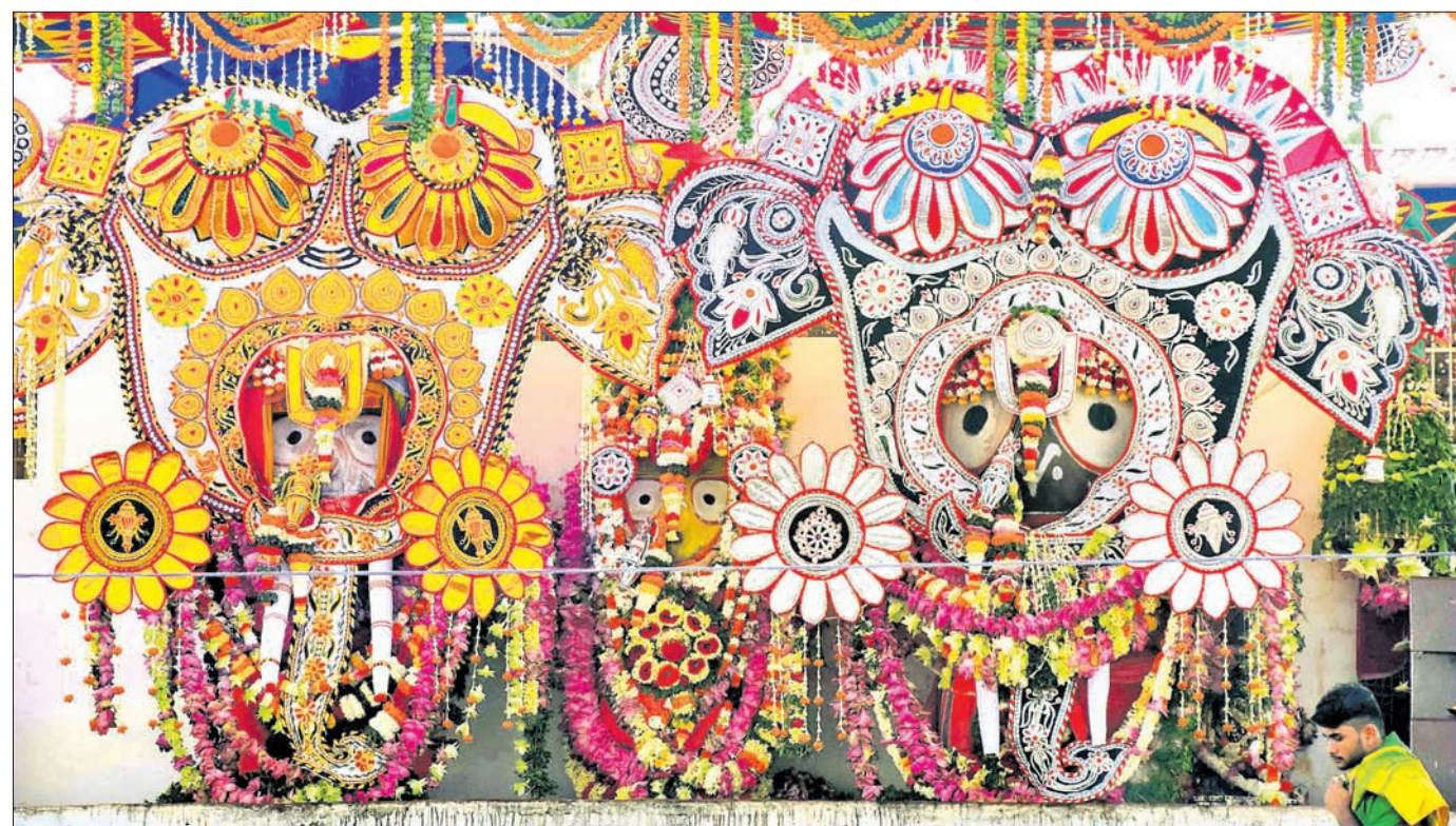
ହାତୀବେଶରେ ସଜ୍ଜିତ ହୋଇଛନ୍ତି ବାଲୁଦିଆଁ।

ଟେନିସରେ ଅନୁଷ୍ଠିତ ଆଇସିସି ବିଶ୍ୱକପ୍ ମ୍ୟାଚରେ ଶତକ ହାସଲ କରି ଖେଳୁଛନ୍ତି ବିପକ୍ଷରେ ବାଲାଦେଶକୁ ବିଜୟୀ କରାଇଛନ୍ତି ଶାନ୍ତି-ଅଲ-ହାସନ।