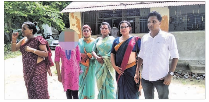
କିନ୍ତୁ ସଂଘ ସଦସ୍ୟଙ୍କ ସହ ନାବାଳକ।

ଅନୁଗୋଳ ଜିଲ୍ଲା କଲିୟରା ଥାନା ଅଞ୍ଚଳର ଜଣେ ନାବାଳକଙ୍କୁ କେହି ଅପହରଣ କରି ନେଇଥିବା ଗତ ମାସ ୨୪ ତାରିଖରେ ଆନାରେ ଅଭିଯୋଗ ହୋଇଥିଲା। ପୋଲିସ ଏ ନେଇ ଏକ ମାମଲା ଚଳୁ କରୁଛି ସହ ତଦନ୍ତ ଆରମ୍ଭ କରିଥିଲା। ତଳିତମାସ ୧୫ ତାରିଖରେ କଲିୟରା ପୋଲିସ ସମ୍ପୃକ୍ତ ନାବାଳକଙ୍କୁ ଭୁବନେଶ୍ୱରର କିନ୍ତୁ ବସ୍ତୁ ଉଦ୍ଧାର କରିଥିଲା। ରବିବାର ତାଙ୍କୁ ତାଳଚେର ଏସ୍ପିକେଏମ୍ କୋର୍ଟରେ ହାଜର ପରେ କୋର୍ଟ ସମ୍ପୃକ୍ତ ନାବାଳକଙ୍କୁ ଜିଲ୍ଲା ଶିଶୁ ମଙ୍ଗଳ ସମିତି(ସିଡିଏସ୍)ଙ୍କ ନିକଟକୁ ପଠାଇ ଦେଇଥିଲେ। କିନ୍ତୁ ସୋମବାର ଏହି