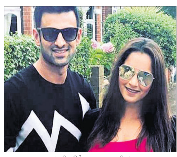
ସ୍ତ୍ରୀ ସାନିଆ ମିର୍ଜାଙ୍କ ସହ ସୋଏବ ମଲିକ।

ଚଳିତ ବିଶ୍ୱକପ୍ରେ ଭାରତ ବିପକ୍ଷ ହାଲଦୋଳରେ ମ୍ୟାଚ୍ରେ ପରାସ୍ତ ହେବାପରେ ପାକିସ୍ତାନ କ୍ରିକେଟରଙ୍କୁ ଏବେ ନିଜ ଦେଶକୁ ଚାଲିଆଣୁ ସମାଲୋଚନାର ଶିକାର ହେବାକୁ ପଡ଼ିଛି। ଏପରିକି କେତେକ ପ୍ରଶଂସକ ସୋଏବ ଆଲି ମିତିଆରେ ଖରାପ ଭାଷା ପ୍ରୟୋଗ କରି ଖେଳାଳିଙ୍କୁ ଗାଳି କରିଥିବାର ରିପୋର୍ଟ ପ୍ରକାଶ ପାଇଛି। ପାକିସ୍ତାନର ବିଭିନ୍ନ ଗଣମାଧ୍ୟମ ମଧ୍ୟ ଖେଳାଳିଙ୍କୁ ସମାଲୋଚନା କରିବାକୁ ପଛାଇ ନାହାନ୍ତି। ଖେଳାଳିଙ୍କ ଫିଲ୍ଡିଂ ସମୟ, ମ୍ୟାଚ୍ ପୂର୍ବଦିନ ପାର୍ଟି କରିବା ଆଦି ବିଷୟକୁ ନେଇ ଖେଳାଳିଙ୍କୁ ଗଣମାଧ୍ୟମରେ ଦ୍ରବ୍ୟ ଭର୍ଷଣ କରାଯାଇଛି। ଭାରତ ବିପକ୍ଷ ମ୍ୟାଚ୍ ପୂର୍ବଦିନ ଦଳର ବରିଷ୍ଠ ଖେଳାଳି ସୋଏବ ମଲିକ ଓ ତାଙ୍କ ସ୍ତ୍ରୀ ସାନିଆ ମିର୍ଜାଙ୍କ ସମେତ କିଛି