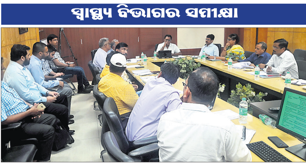
ସଚିବାଳୟରେ ଅନୁଷ୍ଠିତ ସମୀକ୍ଷା ବୈଠକରେ ଉପସ୍ଥିତ ମନ୍ତ୍ରୀ ନବକିଶୋର ଦାସ, ବିଭାଗୀୟ ଅଧିକାରୀ ଓ ଅନ୍ୟମାନେ।

ସ୍ୱାସ୍ଥ୍ୟ ଓ ପରିବାର କଲ୍ୟାଣ ବିଭାଗର ଏକ ସମୀକ୍ଷା ବୈଠକ ମଙ୍ଗଳବାର ସଚିବାଳୟରେ ଅନୁଷ୍ଠିତ ହୋଇଥିଲା।