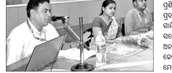
ତପସ୍ୱିନୀ ପ୍ରୋକ୍ସାଇଡରେ ଅନୁଷ୍ଠିତ ଶିବିରରେ ଉପସ୍ଥିତ ଅଧିକାରୀ।