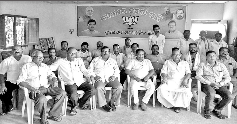
ଭାଜପା କାର୍ଯ୍ୟାଳୟରେ ଭେଟିଭେଟି ଭାଜପାର ବିଧାୟକଙ୍କ ସମେତ ବଳୀୟ ନେତା ଉପସ୍ଥିତ ।

ଚାଷୀଙ୍କ ସମସ୍ୟା ନେଇ ନବ ନିର୍ବାଚିତ ଚଳସରା ବିଧାୟକ ଭୋଇଙ୍କ ଅଧିକାରୀଙ୍କ ସମେତ ଭାଜପା କାର୍ଯ୍ୟାଳୟରେ ଏକ ବୈଠକ ଅନୁଷ୍ଠିତ ହୋଇଥିଲା ।