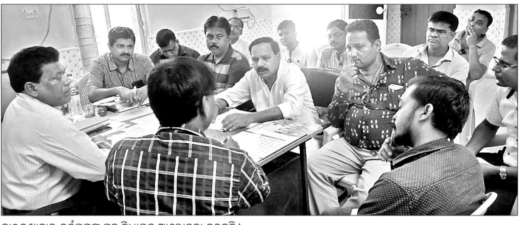
ଡାକ୍ତରଖାନାରେ କର୍ତ୍ତବ୍ୟତା ସହ ବିଧାୟକ ଆଲୋଚନା କରୁଛନ୍ତି।