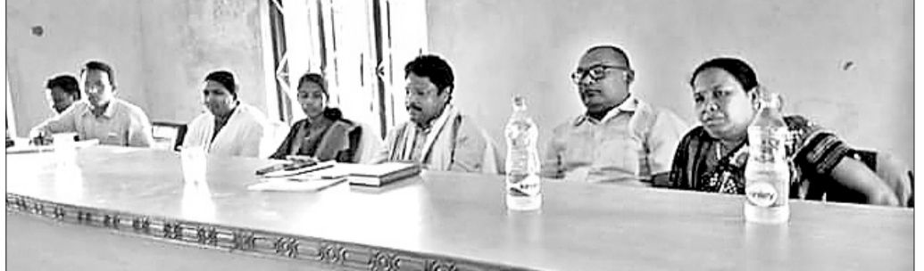
ଆଗଲପୁର ବ୍ଲକ ସଭାଗୃହଠାରେ ବ୍ଲକର ଉନ୍ନୟନମୁକ୍ତ କାର୍ଯ୍ୟର ସମୀକ୍ଷା ବୈଠକରେ ବିଧାୟକ ଓ ସରକାରୀ ଅଧିକାରୀମାନେ।