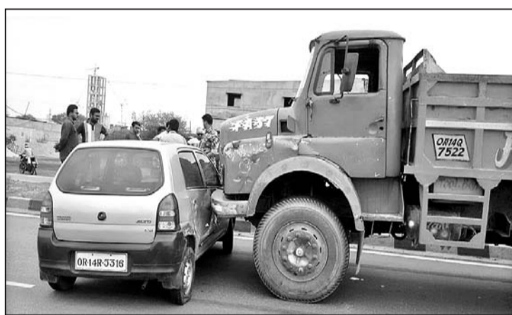
କାରକୁ ଧକ୍କା ଦେଇଛି ତମ୍ପର ।

ରାଜଗାଙ୍ଗପୁର ସହରରେ ଏକ ଅଲଟୋ କାରକୁ ଏକ ତମ୍ପର ଧକ୍କା ଦେବା ଫଳରେ ଗାଡ଼ିଟିର ବିଭିନ୍ନ ଅଂଶ ବଦି ଯାଇଛି ।