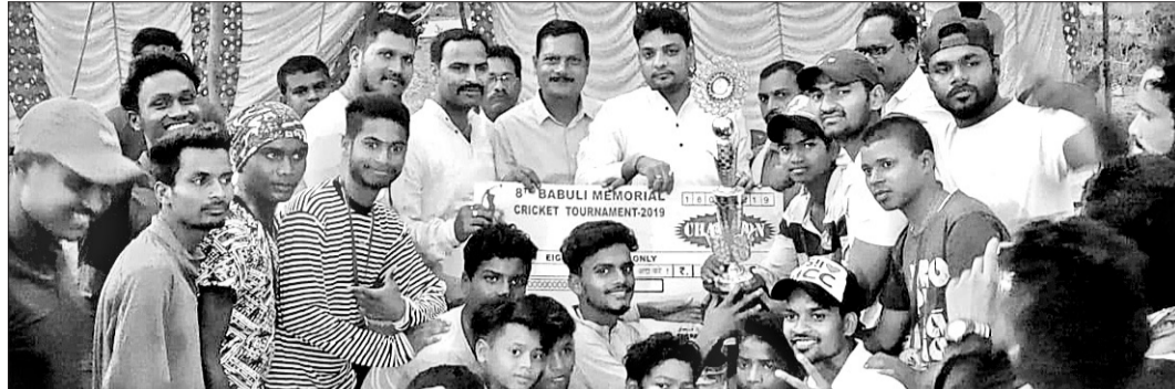
ଫାମିଲିୟର ଦଳକୁ ଅଭିଯୋଗ ପୂରଣ କରିବା ପାଇଁ ଆରସିଏମ୍‌ଏସ୍ ଦଳ ଚାଳନା...