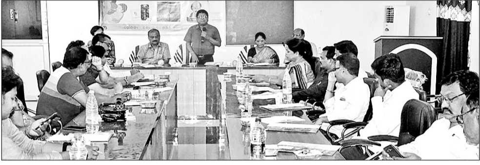
ମ୍ୟାଲେରିଆ, ଡେଙ୍ଗୁ ଓ ଡାଇରିଆ ସଚେତନତା କାର୍ଯ୍ୟକ୍ରମର ଶୁଭାରମ୍ଭ ଅବସରରେ ଅନୁଷ୍ଠିତ ବୈଠକରେ ଉପସ୍ଥିତ ଅତିଥି।