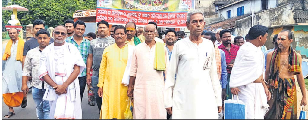
ସେବାୟତମାନେ ପଦଯାତ୍ରାରେ ଯାଉଛନ୍ତି।