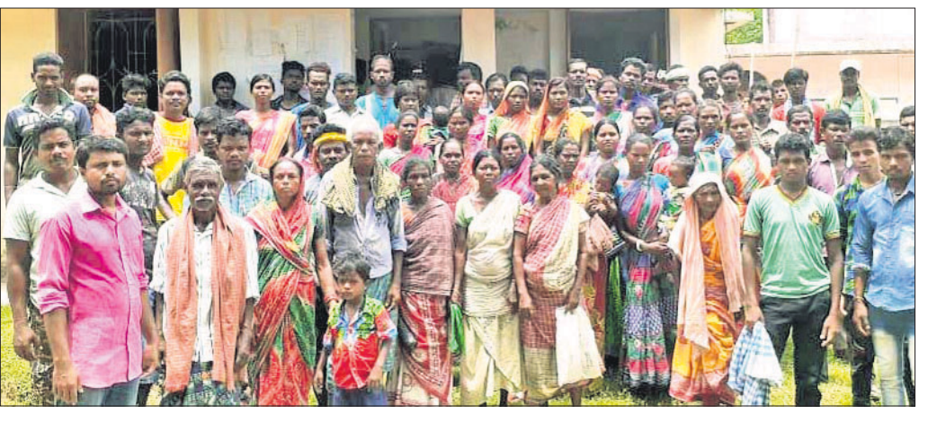
ରାଧିଆ ରାଜସ୍ଵ ନିରୀକ୍ଷକ କାର୍ଯ୍ୟାଳୟ ସମ୍ମୁଖରେ ଭୂମିହୀନମାନେ।

ଘରତ୍ୟ ହ ପକା ରୁରନ୍ଦ ଯୋଗାଇ ଦେବା ଦାବିରେ ଶତାଧିକ ଭୂମିହୀନ ଆଦିବାସୀ ପରିବାର ରୂପବାର ଭଦ୍ରକ ତହସିଲ ଅଧୀନ ରାଧିଆ ରାଜସ୍ଵ ନିରୀକ୍ଷକ କାର୍ଯ୍ୟାଳୟକୁ ଘେରାଇ କରିଥିଲେ।