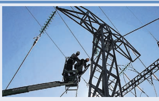
ବିଦ୍ୟୁତ୍ ପୁନରୁଦ୍ଧାର ଆଉ ୬ ମାସ ଲାଗିବ

ଭୁବନେଶ୍ୱର, ୧୯୬(ବୁଧବେଳା) ବାଟ୍ୟା 'ଫନା'କୁ ଦେହମାସ ପୂରିଗଲାଣି । ଏବେ ବି ପୁରୀ ଜିଲାର ଅନେକ ଅଞ୍ଚଳରେ ବିଦ୍ୟୁତ୍ ସଂଯୋଗ ହୋଇପାରିନାହିଁ । ସହରାଞ୍ଚଳକୁ ବାଦ୍ ଦେଲେ ଗାଁ ଗଣ୍ଡା ଅବସ୍ଥା କହିଲେ ନ ସରେ । ପୁରୀ ଜିଲାରୁ ସମ୍ପୂର୍ଣ୍ଣ ବିଦ୍ୟୁତ୍‌କରଣ କରିବାକୁ ଆହୁରି ୬ ମାସ ଲାଗିଯିବ ବୋଲି କାର୍ଯ୍ୟରେ ନିଯୋଜିତ କଣ୍ଟ୍ରୋଲରମାନେ କହୁଛନ୍ତି । ରାଜ୍ୟର କଣ୍ଟ୍ରୋଲରମାନଙ୍କୁ ତରାଇ ଧମକାଇ ବିଦ୍ୟୁତ୍ ପୁନରୁଦ୍ଧାର କାର୍ଯ୍ୟ କରାଯାଉଛି । ଲାଇସେନ୍ସ ନାହିଁ ଯୋଗେ ସେମାନେ ଅଣକୃଷକା ଶ୍ରମିକମାନଙ୍କୁ ନେଇ କାମରେ ଲଗାଉଛନ୍ତି । ଫଳରେ ଉତ୍ତମ ବିଦ୍ୟୁତ୍ କାର୍ଯ୍ୟ ହୋଇପାରୁନାହିଁ । ଏଥିସହିତ ଅନେକ ଦୁର୍ଘଟଣା ଘଟି ପ୍ରାଣହାନି ହେଉଛି ।