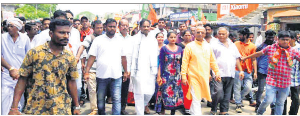
ଚିହିଡ଼ି ବଜାରରେ ଭାଙ୍ଗିପାର ବିକ୍ଷୋଭ ଶୋଭାଯାତ୍ରା।

ଭଦ୍ରକ ଜିଲ୍ଲା ଚିହିଡ଼ି ଥାନା ଅଧୀନ ଦୌଳତପୁର ପଞ୍ଚାୟତରେ ମଦମୃତ୍ୟୁ ଘଟଣାରେ ପୋଲିସ୍ ମୁଖ୍ୟ ଅଭିଯୁକ୍ତଙ୍କ ଗିରଫ କରିବାରେ ବିଫଳ ହୋଇଛି।