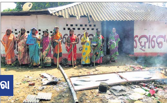
ମହିଳାମାନେ ମଦ ବୋତଲ ଭାଙ୍ଗି ନିଆଁ ଲଗାଉଛନ୍ତି।

ବାଲେଶ୍ଵର ଜିଲ୍ଲା ଖଜୁରା ବଜାରଠାରୁ ୧କି.ମି. ଦୂର କୋଟିଆକୋଇଲିଠାରେ ସୋର-କୁପାରୀ ରାସ୍ତା କଡ଼ରେ ଥିବା ଏକ ଭାବା ଉପରେ ଗୁମାସ୍ତା ତାଳ ମହୁରି ଗ୍ରାମର ମହିଳାମାନେ ସଂଘୀତ ହୋଇ ଚଢ଼ାଉ କରି ମଦ ବୋତଲ ଭାଙ୍ଗିଛନ୍ତି। ଭାବାରେ ଅସାମାଜିକ ଲୋକଙ୍କ