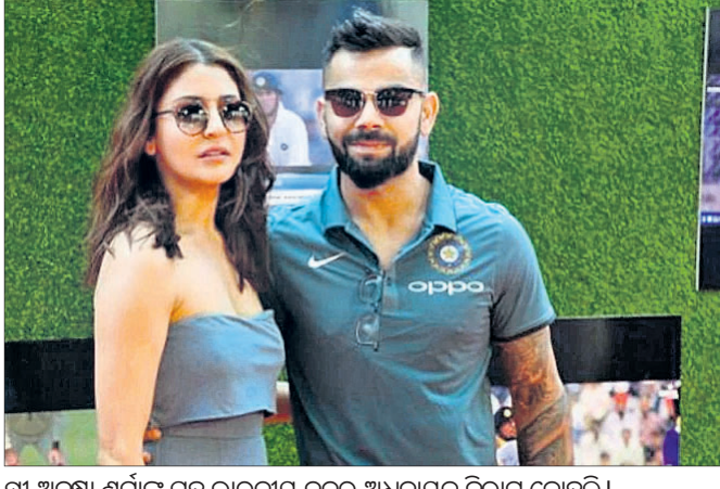
ସ୍ତ୍ରୀ ଅଶ୍ୱିନୀ ଶର୍ମାଙ୍କ ସହ ଭାରତୀୟ ଦଳର ଅଧିକାରୀଙ୍କ ବିରାଟ କୋହଲି । ହୋଇଛି । ଭାରତୀୟ କ୍ରିକେଟ୍ ଅନୁପାୟୀ ଭାରତୀୟ ଦଳର ସଦସ୍ୟ କଣ୍ଠୋଳ ବୋର୍ଡ (ସିସିଆଇ) ଓ ଅଫିସିଆଲ ସହ ପରିବାରବର୍ଗ

ଭାରତୀୟ କ୍ରିକେଟ୍ ଦଳର ଅଧିକାରୀଙ୍କ ବିରାଟ କୋହଲି ଓ ତାଙ୍କ ପତ୍ନୀ ଅଶ୍ୱିନୀ ଲଣ୍ଡନରେ ଦେଖିବାକୁ ମିଳିଛନ୍ତି । ଭାରତୀୟ ଦଳ ଅତି ସହଜରେ ପାକିସ୍ତାନକୁ ହରାଇ ଦେଇଥିଲା । ୨୨ ତାରିଖରେ ଖେଳାଯିବାରୁ ଥିବା ଆଫଗାନିସ୍ତାନ ବିପକ୍ଷ ମ୍ୟାଚ୍ ପୂର୍ବରୁ ଭାରତୀୟ ଦଳ ନିକଟରେ ଆଉ ଦୁଇ ଦିନ ରହିଛି । ଏଥିଯୋଗୁ ଦଳୀୟ ସଦସ୍ୟଙ୍କୁ ଟ୍ରେନ୍ ଦିଆଯାଇଛି । କୋହଲି ଓ ଅଶ୍ୱିନୀ (ବିରୁଷା) ଲଣ୍ଡନ ଷ୍ଟିର୍ରେ ବୁଲୁଥିବାର କିଛି ଫଟୋ ସୋସିଆଲ ମିଡିଆରେ ଭାଇରାଲ ହୋଇଛି । ଭାରତୀୟ କ୍ରିକେଟ୍ ଅନୁପାୟୀ ଭାରତୀୟ ଦଳର ସଦସ୍ୟ କଣ୍ଠୋଳ ବୋର୍ଡ (ସିସିଆଇ) ଓ ଅଫିସିଆଲ ସହ ପରିବାରବର୍ଗ