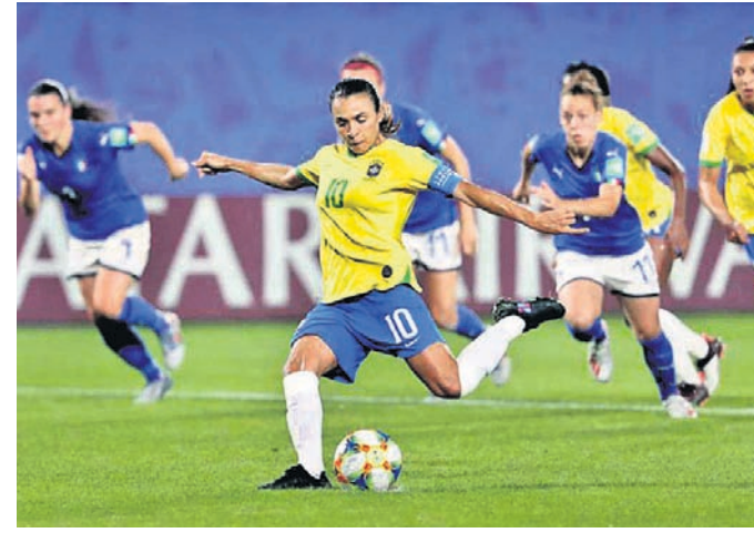
ଫିମା ବିଶ୍ୱକପରେ ସର୍ବାଧିକ ଗୋଲ ଖେଳିବା ବ୍ରାଜିଲ ମାର୍ଟା।