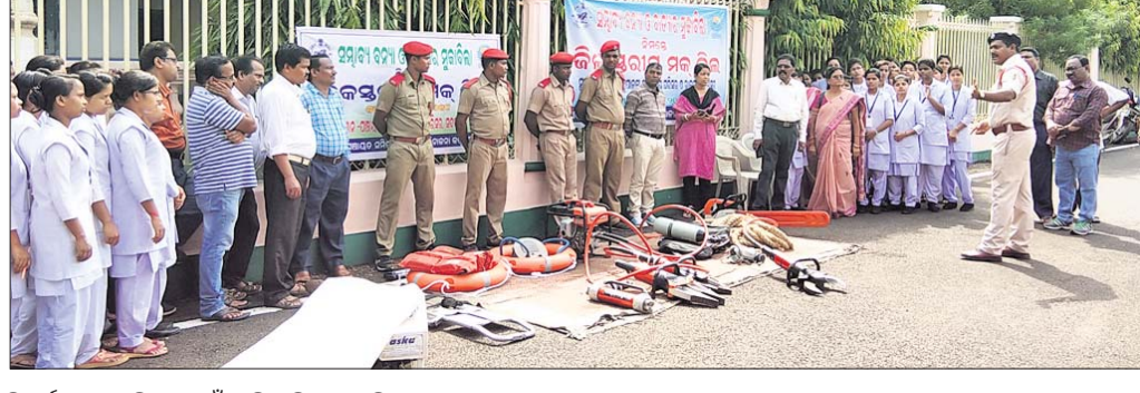
ବିପର୍ଯ୍ୟୟ ମୁକାବିଲା ପାଇଁ ଗାଲିମ ଦିଆଯାଇଛି ।

କେନ୍ଦୁଝର/ ଝୁମ୍ପୁରା, ୧୯୬୭(ସ.ପ୍ର./ ଡି.ଏନ.ଏ.)