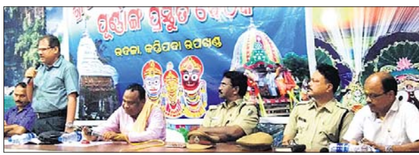
ପ୍ରସ୍ତୁତି ବୈଠକରେ ମହାସାଧନ ପ୍ରଶାସନିକ ଅଧିକାରୀ ଓ ଅନ୍ୟମାନେ ।

ଭଦ୍ରା, ୧୯୬୬ (ଡି.ଏନ.ଏ): ଭଦ୍ରାଠାରେ ଅନୁଷ୍ଠିତ ହେବାକୁ ଥିବା ରଥଯାତ୍ରାକୁ ଶାନ୍ତିଶୃଙ୍ଖଳାରେ ଶେଷ କରିବା ଲାଗି ଭଦ୍ରା ଜିଲ୍ଲା ସମିଳନୀ କକ୍ଷରେ ରୁଧିରାଳ ବୃକ୍ଷ ସମିଳନୀ ପ୍ରସ୍ତୁତି ବୈଠକ ଅନୁଷ୍ଠିତ ହୋଇଯାଇଛି ।