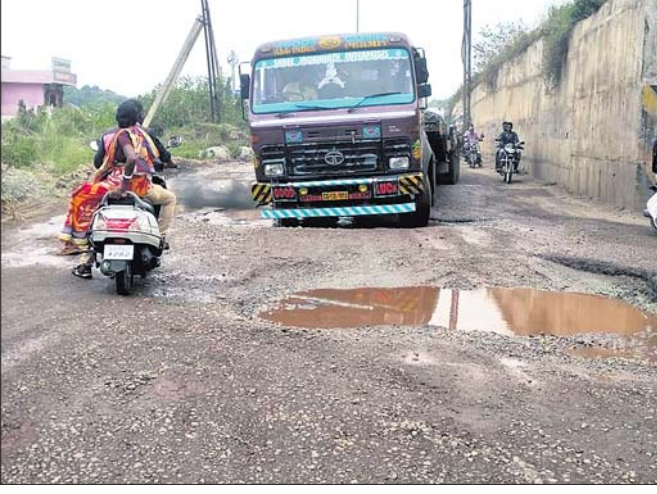
ବାଲିଆଗୋଡା ସର୍ଭିସ ରୋଡ ରାସ୍ତାର ଦୁର୍ଘଟଣା ।

କେନ୍ଦୁଝର ଜିଲାର ଲାଲପଲ୍ଲୀ ଲୋକସଭା ୨୦ ନମ୍ବର ଜାତୀୟ ରାଜପଥ ମାରାମତି ଅଭାବକୁ ଶୋଚନୀୟ ହୋଇପଡ଼ିଛି । ଏହାକୁ ଜିଲାର 'ଜୀବନରେଖା' କୁହାଯାଉଥିବା ବେଳେ ବିଭିନ୍ନ ସ୍ଥାନରେ ଦୁର୍ଘଟଣା ଘଟି ଧନଜୀବନ ହାନୀର କାରଣ ସାଜିଛି । ମୃତ୍ୟୁପତ୍ର ପାଳିଥିବା ରାଜପଥ ସମସ୍ୟା ପ୍ରତି କାହାରି ନଜର ନ ଥିବା କୁହାଯାଉଛି । ଏହି ଜାତୀୟ ରାଜପଥକୁ ୪ ଲେନ ବିଶିଷ୍ଟ କରାଯାଇଥିଲେ ମଧ୍ୟ ବିଭିନ୍ନ ସ୍ଥାନରେ କାମ ଅଧିକାଂଶ ଅଧିକାଂଶ ହୋଇ ପଡ଼ିଯାଇଛି । ଏସବୁ ସ୍ଥାନରେ ସର୍ବଦା ଦୁର୍ଘଟଣା ଘଟୁଥିଲେ ମଧ୍ୟ କାମ ଶେଷ କରାଯାଉନାହିଁ । ବିଭାଗୀୟ ଅଧିକାରୀ ରାସ୍ତାରେ ଏକାଧିକ ସ୍ଥାନରେ ଟୋଲ ଗେଟ୍ ବସାଇ ଅର୍ଥ ଆଦାୟରେ ବ୍ୟସ୍ତ ରହୁଥିବା ଲକ୍ଷ୍ୟ କରାଯାଉଛି । ପାଣିକୋଇଲି ଠାରୁ ରିମ୍ପୁଲି ପର୍ଯ୍ୟନ୍ତ ଏବଂ କେନ୍ଦୁଝରଠାରୁ ଆନନ୍ଦପୁର ପର୍ଯ୍ୟନ୍ତ ଅନେକ ସ୍ଥାନରେ ଟୋଲ ଓ ରାସ୍ତା କାମ ଶେଷ ହୋଇନାହିଁ । ଫଳରେ ସମସ୍ତ ଗାଡ଼ି ସେଠାରେ ଗୋଟିଏ ପାର୍ଶ୍ୱ ରାସ୍ତା ଦେଇ ଯିବା ଆସିବା କରୁଛି । ଗତ ଏପ୍ରିଲ ମାସ ପୁଣ୍ୟ ଜିଲାର ବିଭିନ୍ନ ରାସ୍ତାରେ ୫୬ଟି ଦୁର୍ଘଟଣା ଘଟି ୩୦ ଜଣଙ୍କ ଜୀବନ ଯାଇଛି । ୩୨ ଜଣ ଗୁରୁତର ଓ ୫୯ ଜଣ ସାମାନ୍ୟ ଆହତ ହୋଇଛନ୍ତି । ତନ୍ମଧ୍ୟରୁ