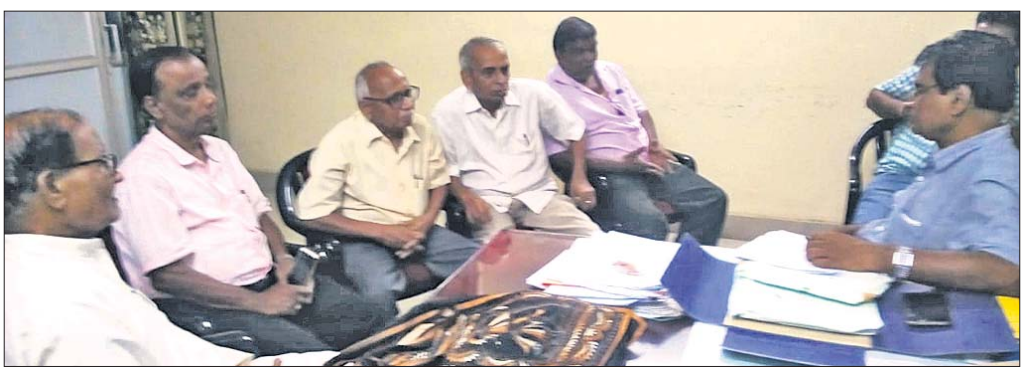
କ୍ରିୟାନୁଷ୍ଠାନ କମିଟି ପ୍ରତିନିଧି ଏକ ଅଧିକାରୀଙ୍କ ସହ ଆଲୋଚନା କରୁଛନ୍ତି।