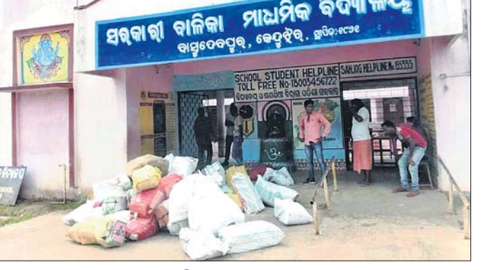
ଗ୍ରାମବାସୀଙ୍କ ଦ୍ୱାରା ଉଦ୍ଧାର ହୋଇଥିବା ପୁସ୍ତକ ।