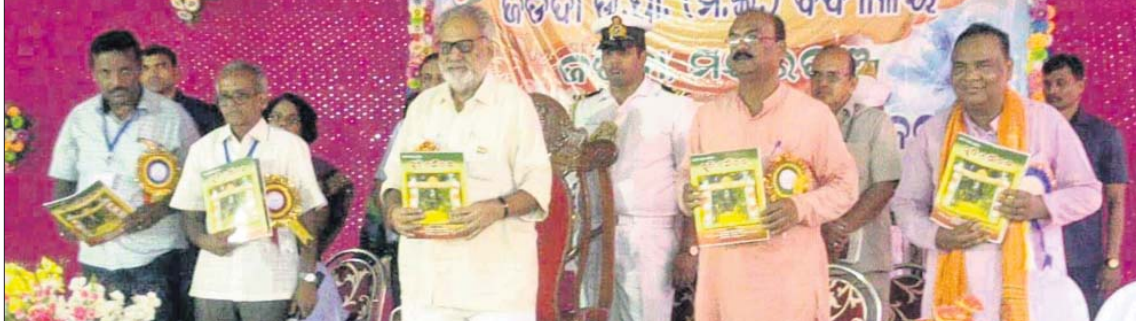
ସୁବର୍ଣ୍ଣ ଜୟନ୍ତୀ ଉତ୍ସବରେ ଉପସ୍ଥିତ ରାଜ୍ୟପାଳ ପ୍ରଫେସର ଗଣେଶ ଲାଲ ଓ ଅନ୍ୟମାନେ ।

କସ୍ତିପଦା, ୧୯୬୬ (ଡି.ଏନ.ଏ): ଆମେ ମାନେ ଶିକ୍ଷିତ ହେଲେ ମଧ୍ୟ ଶିକ୍ଷାଭିମାନୀ ହେବା ଭୁଲି ନୁହେଁ । ଏହି ଆର୍ଯ୍ୟଭୂମି ତପୋଭୂମି ଭାବେ ବର୍ଷ ଯୁଗେ ମାନବ ଖ୍ୟାତିଲାଭକରେ ସୁରେ ଥିବେ ଉଦ୍ଭାସିତ ହୋଇଛି ।