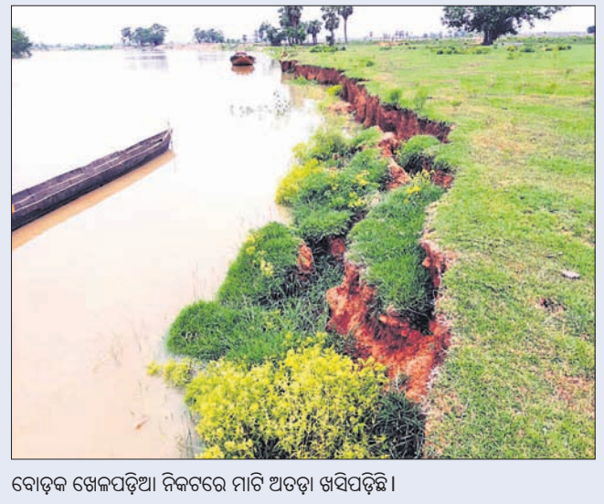
ବୋଡ଼କ ଖେଳପଡ଼ିଆ ନିକଟରେ ମାଟି ଅତଡ଼ା ଖସିପଡ଼ିଛି।

ଏହି ଅଞ୍ଚଳରେ ବର୍ଷ ବର୍ଷ ଧରି କାମ କରୁଥିବା କେତେକ ଠିକାଦାର ଜଳସେଚନ ବିଭାଗର ହାତବାରିସା ସାଜି ନଦୀବନ୍ଧ ନିର୍ମାଣ କାମ କରୁ ନ ଥିବା ବୋଡ଼କ ଅଧିକାରୀ ଅଭିଯୋଗ କରିଛନ୍ତି।