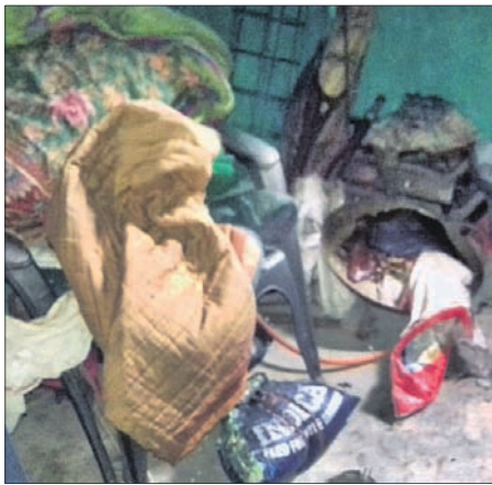
ପୋତି ଯାଇଥିବା ଘର।