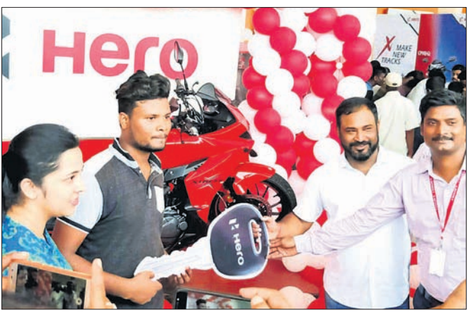
ଜଣେ ଶ୍ରେଣୀକର୍ତ୍ତା ବାଇକ୍ ଚାପି ପ୍ରଦାନ କରାଯାଇଛି।

ଭଦ୍ରକ ଅଫିସ୍, ୧୯୮୬: ଭଦ୍ରକ ବଜାରରେ ରୂପବାର ହିରୋ ମୋଟୋକର୍ପ ଲିମିଟେଡ଼ର ଅତ୍ୟାଧୁନିକ ଖାନକୋଶଳରେ ନିର୍ମିତ ଏକ୍ସପ୍ରେସ୍ ୨୦୦ଏସ୍, ଏକ୍ସପ୍ରେସ୍ ୨୦୦ ଓ ଏକ୍ସପ୍ରେସ୍ ୨୦୦ଟି ନାମରେ ଗତି ବାଇକ୍ ସହିତ ମାଏଷ୍ଟ୍ରେ ୧୨୫ ଇଡିଏଲ୍ ସ୍କୁଟର ବଜାର ପ୍ରବେଶ କରିଛି।