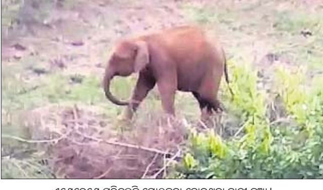
ଏଣେତେଣେ ଚାରିପଟେ ଖୋଜୁଛି ମା'କୁ ହାତୀ ଛୁଆ।

କେନ୍ଦୁଝର, ୧୯/୬ (ସ.ପ୍ର./ଡି.ଏନ.ଏ.) କେନ୍ଦୁଝର ବନଖଣ୍ଡ ଭୂୟାଁ ଓ ଜୁଆଙ୍ଗ ପାଟ ବନାଞ୍ଚଳ କାଞ୍ଚିପାଣି ଜଙ୍ଗଲରେ ଗୋଠରେ ଥିବା ମା'ଠାରୁ ଅଲଗା ହୋଇ ବାଟବଣା ହୋଇ ଏଣେତେଣେ ଚାରିପଟେ ଖୋଜୁଥିବା ଏକ ହାତୀ ଛୁଆ ମା ପାଖକୁ ଯାଇ ନ ଥିବାରୁ ବନ ବିଭାଗକୁ ନାକେଦମ ହେବାକୁ ପଡ଼ିଛି। ହାତୀ ଛୁଆଟି ମା' ପାଖକୁ ଯାଇ ନ ପାରି ଏଣେତେଣେ ଖୋଜୁଥିବା ଜଣାପଡ଼ିଛି। ହାତୀ ଛୁଆର ବୟସ ଦେଢ଼ ବର୍ଷ ହେବ ବୋଲି କୁହାଯାଇଛି। ସେ ଗତ ମଙ୍ଗଳବାର ମା'ଠାରୁ ଅଲଗା ହୋଇ ବୁଲୁଥିବା ଗୁମାସ୍ତା ଲୋକ ଦେଖିବା ପରେ ବନ ବିଭାଗକୁ ଜଣାଇଥିଲେ। ହାତୀଟି କିଛି ଖିଆପିଆ କରୁ ନ ଥିବାରୁ ବନ ବିଭାଗ କର୍ମଚାରୀଙ୍କ ପାଇଁ ଚିନ୍ତା କାରଣ ହୋଇଛି। ତାର କୌଣସି କ୍ଷତି ନ ହେବ ସେ ନେଇ ବନ ବିଭାଗ ପକ୍ଷରୁ ୧୫ ଜଣିଆ ଏକ ଟ୍ଵାଣ୍ଟି ଗଠନ କରି ନଜର ରଖିବା ସହ ମା' ହାତୀ ପାଖକୁ ଫେରାଇବା ପାଇଁ ଉଦ୍ୟମ ଚଳାଇଛନ୍ତି। ଚିତି ହାତୀ ବିଶିଷ୍ଟ ଏକ ଦଳକୁ ବେଳେ ସେମାନେ ଅନ୍ୟ ଅଞ୍ଚଳକୁ ଚାଲିଯାଉଥିବାରୁ ବନ ବିଭାଗ ଚିନ୍ତାରେ ରହିଛନ୍ତି। ଏସମ୍ପର୍କରେ ବନାଞ୍ଚଳ ଅଧିକାରୀ ମୁକ୍ତିକାନ୍ତ ପରିଡ଼ା କହିଛନ୍ତି ଯେ, ଉକ୍ତ ରେଞ୍ଜରେ ୩/୪ଟି ଗୁପ୍ତରେ ୪୫ ହାତୀ ବିଚରଣ କରୁଛନ୍ତି। ସେମାନଙ୍କ ମଧ୍ୟରୁ ୬ ଜଣିଆ ଗୁପ୍ତରୁ ଏହି ହାତୀଟି ଅଲଗା ହୋଇ ବୁଲୁଛି। ହାତୀଟି ବଡ଼ ଅଛି ଏବଂ ନିଜେ ଖାଇ ପିଇ ପାରୁଛି। ତେଣୁ ସମସ୍ୟା ନାହିଁ। ତଥାପି ଏହାର ଗତିବିଧି ଉପରେ ନଜର ରଖାଯାଇଛି।