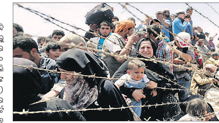
ଗହାନ୍ କିଛି ଅଂଶ ସୁନ୍ଦରୀୟାରୁ ନିପୋର୍ଟରେ ଗ୍ଲାନ ପାଇଛି।

ଭେନିଜୁଏଲାରୁ ୪ ନିୟୁତରୁ ଅଧିକ ଲୋକ ଦେଶ ଛାଡ଼ିଥିବା ସେଠାକାର ସରକାରଙ୍କ ପାଖରେ ଥିବା ତଥ୍ୟରୁ ଜଣାପଡ଼ିଛି। ନିକଟରେ ବିଶ୍ୱରେ ଏହା ସର୍ବାଧିକ ବିସ୍ଥାପନ ସମସ୍ୟା ବୋଲି ଜଣାଯାଇଛି।