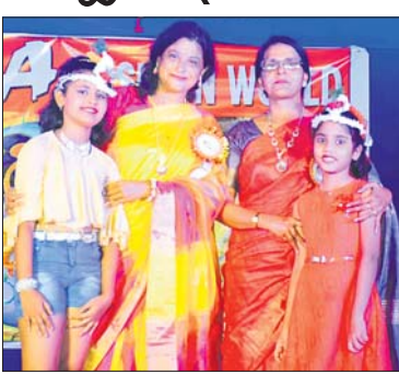
କୃତୀ ପ୍ରତିଯୋଗୀଙ୍କୁ ଅତିଥିମାନେ ପୁରସ୍କୃତ କରୁଛନ୍ତି ।

ବାରିପଦା ଅଫିସ, ୧୯୬୬: ବାରିପଦା ସହର ଅଧିକା ମିନିରସ୍ଥିତ ତିନିକୋଶି ପାଠିଆରେ ଗତ ୧୩ ତାରିଖରୁ ଗୁରୁଜ୍ଞ ଡ୍ୟାନ୍ସ ଏକାଡେମୀ ଆଣ୍ଡ ଭିଜୁଆଲ ଏକାଡେମୀ ପାସ୍ତୁ ଅନୁଷ୍ଠିତ ରଜ ମଉଜ କାର୍ଯ୍ୟକ୍ରମ ଉଦ୍‌ଯାପିତ ହୋଇଯାଇଛି ।