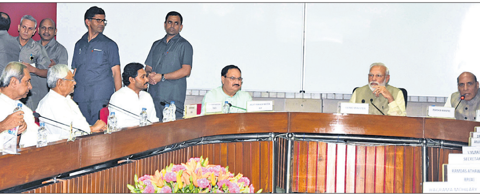
ସର୍ବକାଳୀନ ବିଧାନସଭା (ବାମରୁ) ଓଡ଼ିଶା ମୁଖ୍ୟମନ୍ତ୍ରୀ ନବୀନ ପଟ୍ଟନାୟକ, ବିହାର ମୁଖ୍ୟମନ୍ତ୍ରୀ ନୀତୀଶ କୁମାର, ଆନ୍ଧ୍ରପ୍ରଦେଶ ମୁଖ୍ୟମନ୍ତ୍ରୀ ଡି.ଏ. କରନ୍‌ମୋହନ ରେଡ୍ଡୀ, ଭାରତୀୟ କାର୍ଯ୍ୟକାରୀ ସଭାପତି ଜେ.ପି. ନନ୍ଦା, ପ୍ରଧାନମନ୍ତ୍ରୀ ନରେନ୍ଦ୍ର ମୋଦି ଏବଂ ପ୍ରତିରକ୍ଷାମନ୍ତ୍ରୀ ରାଜନାଥ ସିଂ

ପାର୍ଲିମେଣ୍ଟ ହାଉସ୍‌ରେ ଆୟୋଜିତ ବିଧାନସଭାରେ ମୁଖ୍ୟମନ୍ତ୍ରୀ ନବୀନ ପଟ୍ଟନାୟକ ଯୋଗଦେଇ କହିଛନ୍ତି, ବାରମ୍ବାର ସର୍ବକାଳୀନ ନିର୍ବାଚନ କରାଯିବା ଦ୍ୱାରା ବିକାଶର ଗତି ଏବଂ ସଂସ୍କାର ସହଯୋଗିତା ପ୍ରଭାବିତ ହେଉଛି। ତେଣୁ ଲୋକ ସଭା ନିର୍ବାଚନ ସହିତ ରାଜ୍ୟ ବିଧାନସଭାକୁ ନିର୍ବାଚନ ଭାବେ କରାଇବା ପାଇଁ ପ୍ରଧାନମନ୍ତ୍ରୀଙ୍କ ପରିକଳ୍ପନାକୁ ସେ ସମର୍ଥନ କରୁଛନ୍ତି। ସେହିପରି ମହାତ୍ମା ଗାନ୍ଧୀଙ୍କ ୧୫୦ତମ ଜୟନ୍ତୀ ପାଳନ ଅବସରରେ ଭାରତୀୟ ସମ୍ପ୍ରଦାୟର ମୁଖ୍ୟବନ୍ଧୁରେ 'ଅହିଂସା'