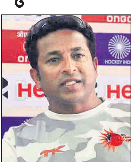
ପୂର୍ବରୁ ମଧ୍ୟ ଜୁଡ୍ ଅଧୀନରେ ଭାରତର ପ୍ରଦର୍ଶନ ଉପାହଜନକ ନ ଥିଲା। ଗତ ବର୍ଷ ସୁଲତାନ ଅଫ୍ ହକି ଟୋର୍ଣ୍ଣାମେଣ୍ଟରେ ଭାରତର ପ୍ରଦର୍ଶନ ଅତ୍ୟନ୍ତ ଉପଯୁକ୍ତ କରିବେ। ଏହି ଟୁର୍ଣ୍ଣାମେଣ୍ଟରେ ଭାରତର ପ୍ରଦର୍ଶନ ଅତ୍ୟନ୍ତ ଉପଯୁକ୍ତ କରିବେ।

ସ୍ୱାଭାବିକ ପଦକ୍ଷେପ ବୋଲି ହକି ଇଣ୍ଡିଆ ପ୍ରତ୍ନୁ ଜଣାପଡ଼ିଛି। ଚଳିତ ମାସ ପ୍ରାରମ୍ଭରେ ଅନୁଷ୍ଠିତ ହକି ଟିମ୍ ଟୋର୍ଣ୍ଣାମେଣ୍ଟରେ ଭାରତ ଅଷ୍ଟ୍ରେଲିଆଠାରୁ ୦-୪ ଗୋଲରେ, ନେଦରଲାଣ୍ଡଠାରୁ ୨-୩, ସ୍ପେନଠାରୁ ୧-୩ ଏବଂ ଗ୍ରେଟ୍ ବ୍ରିଟେନଠାରୁ ୧-୨ ଗୋଲରେ ପରାଜିତ ହୋଇଥିଲା।