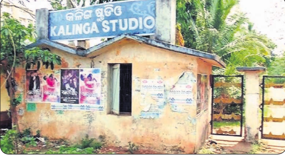
କଳିଙ୍ଗ ଷ୍ଟୁଡିଓ ବନ୍ଦ ହେବାର ପଛପଟେ ମୋଡ୍ ଥିବା ମୁହାଁଣି

ବନାଇବ, ତାହା ହିଁ ପ୍ରଶ୍ନକାରୀ। ମହାବାତ୍ୟା ପରେ