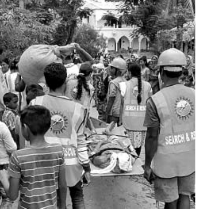
ବାତ୍ୟା ଆଶ୍ରୟସ୍ଥଳୀରେ ମକ୍ତୂଳ କାର୍ଯ୍ୟକ୍ରମର ଏକ ଦୃଶ୍ୟ।

ପଟ୍ଟାମୁଣ୍ଡା ବ୍ଲକର ବିଭିନ୍ନ ବାତ୍ୟା ଓ ବନ୍ୟା ଆଶ୍ରୟସ୍ଥଳୀରେ ମକ୍ତୂଳ କାର୍ଯ୍ୟକ୍ରମ