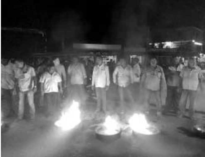
ଟାୟାର ଜାଳି ପ୍ରତିବାଦରେ ଉଦ୍ଘାଟନ କରାଯାଇଛି।