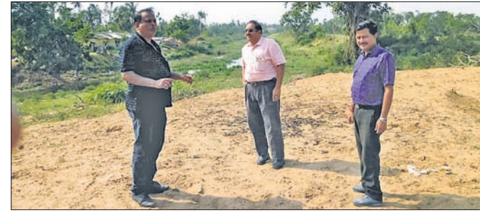
ଜଗତ୍ସିଂହପୁର ବିଭାଗ ମୁଖ୍ୟମନ୍ତ୍ରୀ ଓ ଅନ୍ୟ ଅଧିକାରୀମାନେ ନଦୀବନ୍ଧ ପରିଦର୍ଶନ କରୁଛନ୍ତି ।

ପୌରାଧିକ୍ଷ ଓ ବିଧାୟକଙ୍କ ମଧ୍ୟରେ ଶୀଳତୟୁଦ୍ଧ ଆରମ୍ଭ