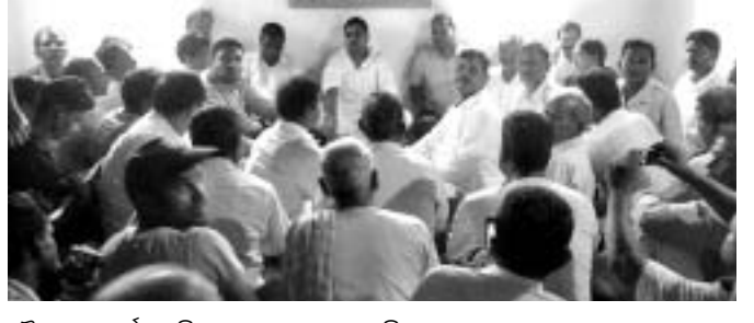
ରାଜନଗର କଂଗ୍ରେସର ମାନସ ମନ୍ତ୍ରିତ ବୈଠକର ଏକ ଦୃଶ୍ୟ।

ରାଜନଗର ବ୍ଲକ କଂଗ୍ରେସ କାର୍ଯ୍ୟାଳୟରେ ବୁଧବାର କଂଗ୍ରେସର ମାନସ ମନ୍ତ୍ରିତ ବୈଠକ