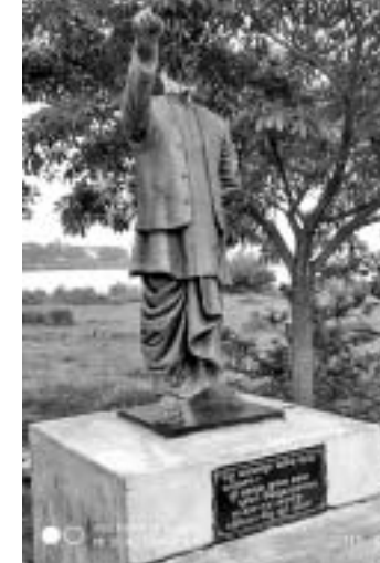
ପ୍ରତିମୂର୍ତ୍ତିର ଉଦ୍ଘାଟନ କରାଯାଇଛି।

ପ୍ରବାଦକୁ ପୂର୍ବରୁ ପଢାଉଥିବା ପ୍ରତିମୂର୍ତ୍ତି ଉଦ୍ଘାଟନ କରାଯାଇଛି।