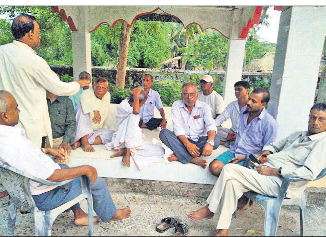
ରଥଯାତ୍ରା ପ୍ରସ୍ତୁତି ବୈଠକରେ ଉପସ୍ଥିତ କର୍ମକର୍ତ୍ତା ।

ଏରସିଆ ସରକାରକୁମ୍ଭାଙ୍ଗିତ ଜଗନ୍ନାଥ ମନ୍ଦିର (ବ୍ରଜ କିଶୋର ଦେବ)ଙ୍କ ରଥଯାତ୍ରା ପାଇଁ ବୁଧବାର ଏକ ପ୍ରସ୍ତୁତି ବୈଠକ ଅନୁଷ୍ଠିତ ହୋଇଛି ।