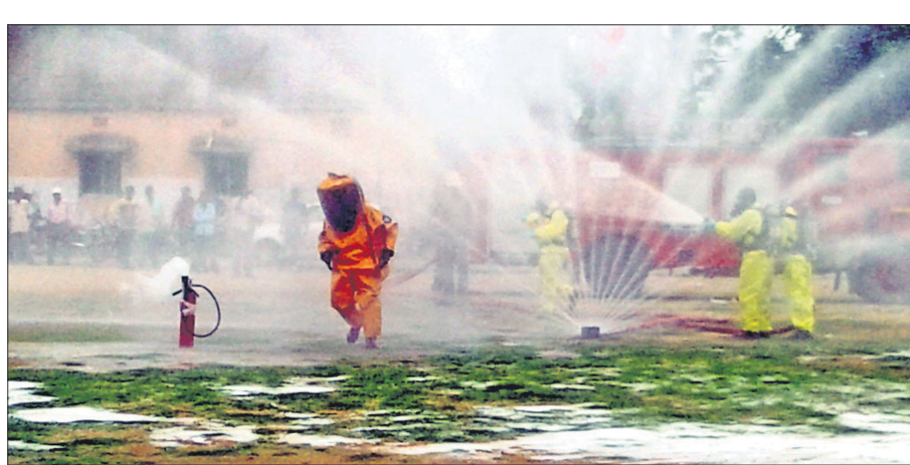
ଜିଲାସ୍ତରୀୟ ମକଡୁଲିରେ ଅଗ୍ନିଶମ ବିଭାଗ ପକ୍ଷରୁ ଉଦ୍ଧାର କୌଶଳ ପ୍ରଦର୍ଶନ କରାଯାଇଛି ।