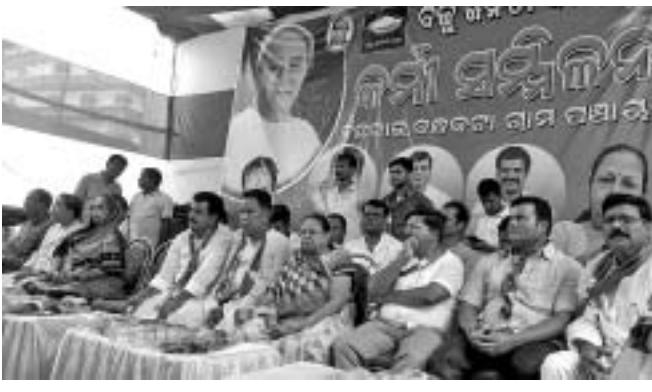
ସମ୍ମିଳନୀରେ ବିଜେଡିର କର୍ମୀମାନଙ୍କୁ କେନ୍ଦ୍ରୀୟ କର୍ମୀ ସମ୍ମିଳନୀରେ ଭାଗନେବାକୁ ନିମନ୍ତ୍ରଣ କରାଯାଇଛି।

ମାନ୍ଦ୍ରାଜ, ୧୯।୬(ଡି.ଏନ.ଏ.): ମାନ୍ଦ୍ରାଜ ବ୍ଲକର ୬ ଗୋଟି ପଞ୍ଚାୟତ ପାଟକୁରା ନିର୍ବାଚନମଣ୍ଡଳରେ ରହିଛି।