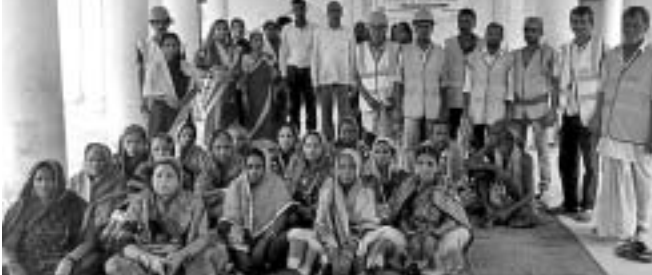
ରାଜନଗର ଅଞ୍ଚଳର ୪୫ ବାତ୍ୟା ଆଶ୍ରୟସ୍ଥଳୀରେ ମକ୍ତୂଳ ଅବସରରେ ସେବାୟତମାନେ।

୧୯୯୯ ମହାବାତ୍ୟା ଓ ୨୦୦୬ରେ ପରିଚାଳନା କମିଟି ପକ୍ଷରୁ ମକ୍ତୂଳ ମାଧ୍ୟମରେ ସେଚେତନତା କରାଯାଇଛି।