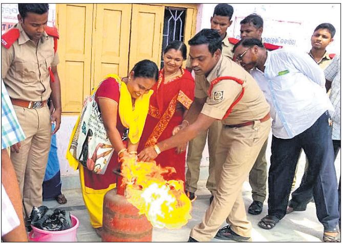
ଅଜନଞ୍ଜିତ କର୍ମୀଙ୍କୁ ନିଆଁ ଲିଭାଇ କୌଶଳ ଶିଖାଯାଇଛି ।

ଲୋକେ ରାହାଲେ ଅନେକ ବିପଦକୁ ଚାଲି ଦିଆଯାଇ ପାରିବ । ଏଥିପାଇଁ ସଚେତନତା ଜରୁରୀ । କେଉଁ ସମୟରେ କି ପ୍ରକାର ପ୍ରତିକାରାତ୍ମକ ପଦକ୍ଷେପ ଗ୍ରହଣ କରିବାକୁ ପଡିବ ସେ ବିଷୟରେ ଲୋକେ ସର୍ବନିମ୍ନ ଜ୍ଞାନ ଆହରଣ କରିବା ଆବଶ୍ୟକ ।