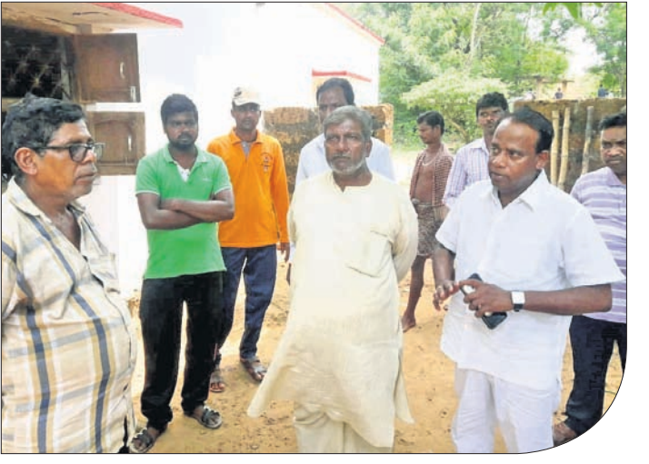
ଭାଜପା ନେତା ଶତ୍ରୁଘ୍ନ ଜେନା ଶୋକସତ୍ତ୍ୱ ପରିବାରକୁ ଭେଟି ଆଲୋଚନା କରୁଛନ୍ତି।