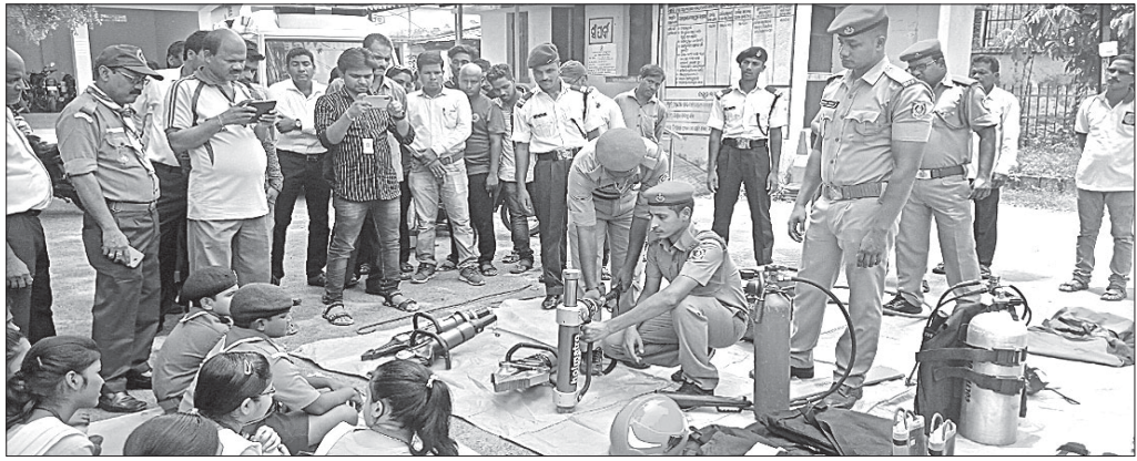
ଛାତ୍ରାଛାତ୍ରୀଙ୍କୁ ମକଡୁଲ ମାଧ୍ୟମରେ ସମ୍ଭାବ୍ୟ ବନ୍ୟାବାତ୍ୟାର ମୁକାବିଲା ସମ୍ପର୍କରେ ସଚେତନ କରାଯାଇଛି।

ଆରମ୍ଭ ହେଲାଣି ପ୍ରାୟ ମୌସୁମୀ ବର୍ଷ। ସପ୍ତାହକ ମଧ୍ୟରେ ସାରା ରାଜ୍ୟକୁ ମୌସୁମୀ ଛୁଇଁବ ବୋଲି ପାଣିପାଗ ବିଭାଗ ପକ୍ଷରୁ ସୂଚନା ଦିଆଯାଇଛି। ବର୍ଷା ଋତୁରେ ସମ୍ଭାବ୍ୟ ବନ୍ୟାବାତ୍ୟାର ମୁକାବିଲା କରିବାକୁ ପ୍ରଶାସନ ମଧ୍ୟ ତତ୍ପର ହୋଇ ଉଠିଛି।