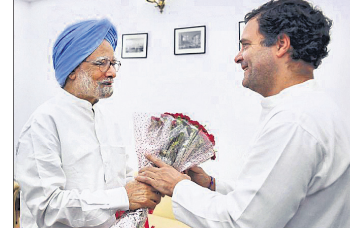
ପୂର୍ବତନ ପ୍ରଧାନମନ୍ତ୍ରୀ ମନମୋହନ ସିଂ ନୂଆଦିଲ୍ଲୀରେ କଂଗ୍ରେସ ଅଧକ୍ଷ ରାଷ୍ଟ୍ର ଗାନ୍ଧୀଙ୍କୁ ତାଙ୍କ ୪୯ତମ ଜନ୍ମଦିବସରେ ପୁଲଟୋଡ଼ା ଦେଇ ଅଭିନନ୍ଦନ ଜଣାଇଛନ୍ତି।