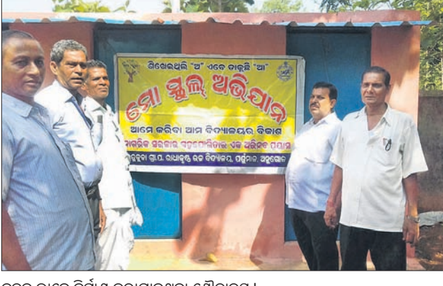
ନୂତନ ଭାବେ ନିର୍ମାଣ କରାଯାଇଥିବା ଶୌଚାଳୟ।

କିଶୋରନର ବୁକ୍ ଉତ୍କଳା ପଞ୍ଚାୟତ ପାଳିକାଙ୍କୁ ଉକ୍ତ ବିଦ୍ୟାଳୟ ପଞ୍ଚୁଳାକରେ ମୋ ସ୍କୁଲ ଅଭିଯାନରେ ଏକ ଶୌଚାଳୟ ନିର୍ମାଣ କରାଯାଇଛି। ୫୦ ହଜାର ବ୍ୟୟରେ ନିର୍ମିତ ଏହି ଶୌଚାଳୟ ଶୌଚାଳୟ ଫରକା କେଲ ରୁଧିର କାଟନାଶକ ପରିସରରେ ଏକ ବୈଠକ ବସିଥିଲା।