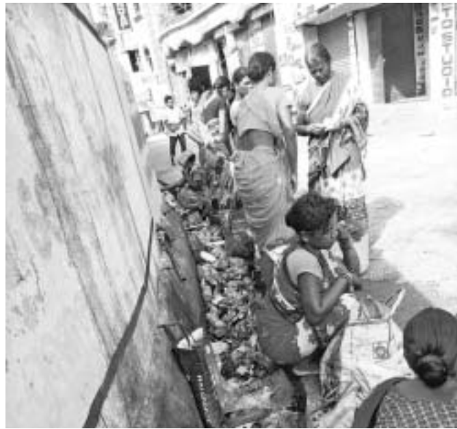
ଆବର୍ଜନାପୂର୍ଣ୍ଣ ଡ୍ରେନ୍ ଉପରେ ମହିଳାମାନେ ବସି ବେପାର କରୁଛନ୍ତି।

ଆଗକୁ ବର୍ଷା ଆସୁଛି। ସେଥିପାଇଁ ସମସ୍ୟ ବନ୍ୟା, ବାଟ୍ୟା ପାଇଁ ପ୍ରଶାସନ ପକ୍ଷରୁ ପ୍ରସ୍ତୁତି ଆରମ୍ଭ ହୋଇଛି। ସମସ୍ତ ବିଭାଗକୁ ଆବଶ୍ୟକ ପଦକ୍ଷେପ ନେବାକୁ କୁହାଯାଇଛି। ବନ୍ୟା ମୁକାବିଲା ଓ ବନ୍ୟା ପରିସ୍ଥିତି ସମ୍ବନ୍ଧୀୟ ପଦକ୍ଷେପ ନେବାକୁ କୁହାଯାଇଛି। କିନ୍ତୁ ଅନ୍ୟାନ୍ୟ କେନ୍ଦୁଝର ଜିଲା ମୁଖ୍ୟାଳୟ ପୌରାଞ୍ଚଳରେ ଡ୍ରେନେଜ ଅବସ୍ଥା ଦେଖିଲେ କିପରି ପ୍ରସ୍ତୁତି ଚାଲିଛି ବେଶ୍ ଅନୁମାନ କରିହେବ। କେନ୍ଦୁଝର ସହରରେ ପ୍ରବଳ ବର୍ଷା ହେଲେ ବିଭିନ୍ନ ସାହି ଓ ବସ୍ତିରେ କୃତିମ ବନ୍ୟା ପରିସ୍ଥିତି ସୃଷ୍ଟି ହୋଇଥାଏ। ଭୁନେଜ ବ୍ୟବସ୍ଥା ସୁଦୃଢ଼ ନ ଥିବାରୁ ଜଳ ନିଷ୍କାସନ ହୋଇ ନ ପାରି ରାସ୍ତା ଉପରେ ଗରୁଥିବା ବେଳେ ଘରବାଡ଼ିରେ ପଶୁଥିବାରୁ