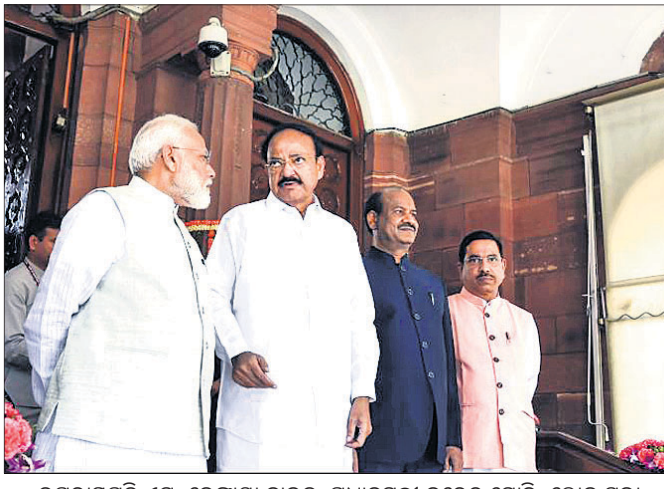
ଉପରାଷ୍ଟ୍ରପତି ଏମ୍. ଭେଙ୍କାୟା ନାଲଡୁ, ପ୍ରଧାନମନ୍ତ୍ରୀ ନରେନ୍ଦ୍ର ମୋଦି, ଲୋକ ସଭା ବାଚସ୍ପତି ଓଏମ୍. ଶିଂ ଏସ୍‌ଏସ୍‌ଏସ୍‌ କ୍ୟାପାର ମନ୍ତ୍ରୀ ପ୍ରହ୍ଲାଦ କୋଷ୍ଠା ପାର୍ଲିମେଣ୍ଟରେ ରାଷ୍ଟ୍ରପତି ରାମନାଥ କୋବିନ୍ଦଙ୍କୁ ଅପେକ୍ଷା କରିଛନ୍ତି।

ରାଷ୍ଟ୍ରପତି ରାମନାଥ କୋବିନ୍ଦ ଗୁରୁବାର ପାର୍ଲିମେଣ୍ଟର ସେଣ୍ଟ୍ରାଲ ହଲରେ ଉଭୟ ଗୃହର ସଦସ୍ୟମାନଙ୍କ ମିଳିତ ଅଧିବେଶନକୁ ଉଦ୍‌ଘୋଷଣା ଦେଇ ଏକକାଳୀନ ନିର୍ବାଚନ ସମୟର ଆବଶ୍ୟକତା ବୋଲି କହିଛନ୍ତି। ଦେଶର ବିଭିନ୍ନ ଭାଗରେ ବାରମ୍ବାର ନିର୍ବାଚନ ଫଳରେ ବିକାଶ ପ୍ରକ୍ରିୟା ବାଧାପ୍ରାପ୍ତ ହେଉଥିବାରୁ ଏମ୍‌ପିମାନେ 'ଗୋଟିଏ ଦେଶ ଗୋଟିଏ ନିର୍ବାଚନ' ପ୍ରସ୍ତାବ ଉପରେ ଗୁରୁତ୍ୱର ସହ ଚିନ୍ତା କରିବା ପାଇଁ ସେ ଆହ୍ୱାନ ଦେଇଛନ୍ତି। ଏକକାଳୀନ ନିର୍ବାଚନ ଲାଗି ବୁଧବାର ପ୍ରଧାନମନ୍ତ୍ରୀ ନରେନ୍ଦ୍ର ମୋଦି ସର୍ବଦଳୀୟ ଦୈନିକ ଡାକିଥିଲେ। ଏଥିରେ ଅଧିକାଂଶ ଦଳର ନେତା ପ୍ରଧାନମନ୍ତ୍ରୀଙ୍କ ପ୍ରସ୍ତାବକୁ ସମର୍ଥନ କରିଛନ୍ତି। ଲୋକ ସଭା ନିର୍ବାଚନ ସହ ରାଜ୍ୟ ବିଧାନସଭାଗୁଡ଼ିକର ନିର୍ବାଚନ ଏକସଙ୍ଗେ କରାଗଲେ ଦେଶର ବିକାଶ ପ୍ରକ୍ରିୟା ଦ୍ରୋଣିତ ହେବା ସହ ଦେଶବାସୀଙ୍କ ହିତସାଧନ ହୋଇପାରିବ ବୋଲି ରାଷ୍ଟ୍ରପତି କହିଛନ୍ତି। ଆତଙ୍କବାଦ ପ୍ରସଙ୍ଗରେ ସାରା ବିଶ୍ୱ ଭାରତ ପଛରେ ଛିଡ଼ାହୋଇଛି। ଜୈଶ୍-ଇ-ମହମ୍ମଦ (ଜେଇଏମ୍) ସଂଗଠନର ମୁଖ୍ୟ ମାୟୁଦ ଆଖରଙ୍କୁ ବିଶ୍ୱ ଆତଙ୍କବାଦୀ ଘୋଷଣା କରାଯିବା ଏହାର ପ୍ରମାଣ ବୋଲି ରାଷ୍ଟ୍ରପତି