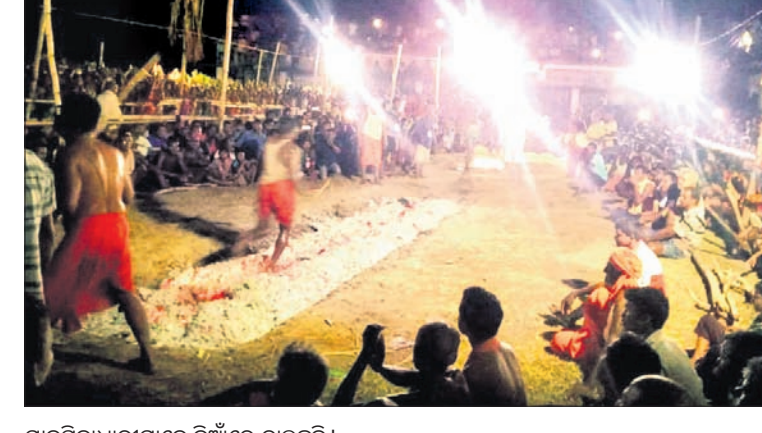
ମାନସିକଧାରୀମାନେ ନିଆଁରେ ଚାଲୁଛନ୍ତି ।