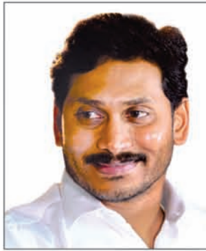
ଶ୍ରୀ ଓ.ଏସ୍. ଜଗନମୋହନ ରେଡ୍ଡୀ ମାନ୍ୟବର ମୁଖ୍ୟମନ୍ତ୍ରୀ, ଆନ୍ଧ୍ରପ୍ରଦେଶ

ବିଶ୍ୱର ସର୍ବବୃହତ୍ ବହୁ-ସ୍ତରୀୟ, ବହୁ-ଉଦ୍ଦେଶ୍ୟୀୟ ଉଠା ଜଳସେଚନ ଯୋଜନା ଭାରତର ଗର୍ବ ଏବଂ ତେଲେଙ୍ଗାନା ପାଇଁ ବରଦାନ