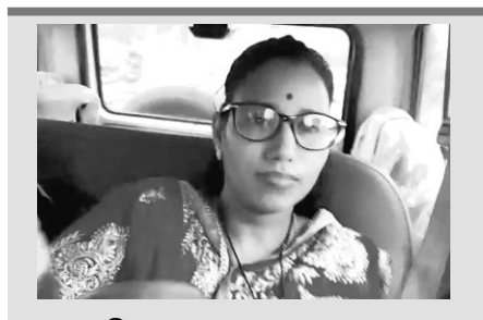
ପୋଲିସ୍ ଜବରଦସ୍ତ ଉଠାଇନେଲା ପୋଲିସ୍ କମିଶନରଙ୍କୁ ଅଭିଯୋଗ ଜଣାଇଲେ ନ୍ୟାୟ ନ ମିଳିଲେ ଆତ୍ମହତ୍ତ୍ୱ ଦେବାକୁ ଚେତାବନା

୧୨ ତାରିଖ ରାତିରେ ମଧ୍ୟ ସମାନ ଘଟଣା ଘଟିଥିଲା। ଏ ସମ୍ପର୍କରେ ଅନୁଭବଙ୍କୁ ଜଣାଇବା ପାଇଁ ମହିଳା ଖବରଦାତା ସମ୍ପର୍କୀତ ତାଙ୍କ ବାସଭବନକୁ ଯାଇଥିଲେ। ହେଲେ ସେଠାରେ ଅନୁଭବ ତାଙ୍କୁ ଗାଳିଗୁଳାକ କରିବା ସହ ତାଙ୍କ ଉପରକୁ ଛେପ ପକାଇଥିଲେ। ଏପରିକି ସ୍ତ୍ରୀ ବର୍ଷା ପ୍ରିୟଦର୍ଶିନୀ ମଧ୍ୟ ତାଙ୍କୁ ଗାଳିଗୁଳାକ କରିଥିବା ନେଇ ଆନାରେ ଅଭିଯୋଗ କରିଥିଲେ। ସେତେବେଳେ ଏମ୍ପି ଅନୁଭବ ମହାତ୍ତ୍ୱିକ ମହିଳାଙ୍କ ଅଭିଯୋଗକୁ ସମ୍ପୂର୍ଣ୍ଣ ମିଛ ବୋଲି କହିଥିଲେ।