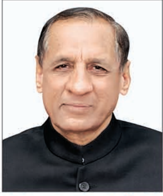
ଶ୍ରୀ ଇ.ଏସ୍.ଏଲ୍. ନରସିଂହନ୍ ମାନ୍ୟବର ରାଜ୍ୟପାଳ, ତେଲେଙ୍ଗାନା ଓ ଆନ୍ଧ୍ରପ୍ରଦେଶ