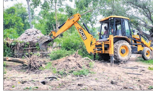
କେସିବ ଦ୍ୱାରା କବରଦଖଳ ଉଦ୍ଧେବ କରାଯାଇଛି ।