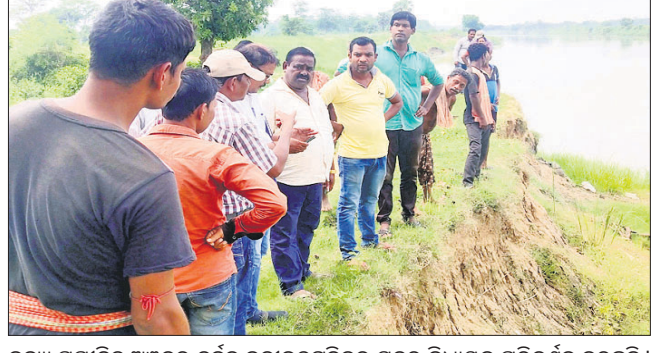
ବନ୍ୟା ପ୍ରତିରୋଧ ଅଞ୍ଚଳର ଦୁର୍ବଳ ନଦୀବନ୍ଧକୁ ପରିଦର୍ଶନ କରୁଛନ୍ତି।

ବାଲେଶ୍ୱର ଅଫିସ, ୨୦୧୭ ବାଲେଶ୍ୱର ସଦର ବିଧାନସଭା ନିର୍ବାଚନ ଅଞ୍ଚଳର ଦଳ ଗୁଡ଼ିକର ବନ୍ୟା ପ୍ରତିରୋଧ ଅଞ୍ଚଳର ଦୁର୍ବଳ ନଦୀବନ୍ଧକୁ ପରିଦର୍ଶନ କରି ସ୍ଥାନୀୟ ଲୋକଙ୍କୁ ଶାନ୍ତ କରିବା ପାଇଁ ଗୁରୁତ୍ୱ ଦେଇଛନ୍ତି। ଆଗାମୀ ବର୍ଷା ଋତୁରେ ବନ୍ୟା ସମ୍ଭାବ୍ୟ ହେବାରୁ ଯଥା ସମ୍ଭବ ଉପାୟ ଗ୍ରହଣ କରିବାକୁ ଅଞ୍ଚଳର ଲୋକଙ୍କୁ ଅନୁରୋଧ କରାଯାଇଛି।