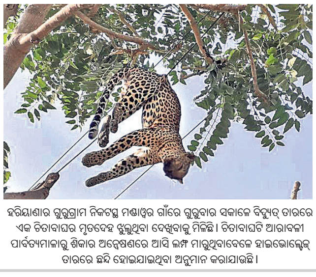
ହରିୟାଣାର ଗୁରୁଗ୍ରାମ ନିକଟସ୍ଥ ମଣ୍ଡାଡ଼ର ଗାଁରେ ଗୁରୁବାର ସକାଳେ ବିଦ୍ୟୁତ୍ ତାରରେ ଏକ ଚିତାବାଘର ମୃତଦେହ ଝୁଲୁଥିବା ଦେଖିବାକୁ ମିଳିଛି। ଚିତାବାଘଟି ଆରାବକୀ ପାର୍ବତ୍ୟମାଳାରୁ ଶିକାର ଅନୁଷ୍ଠାନରେ ଆସି କାମ ମାଗୁଥିବାବେଳେ ହାତଭୋଲେଇ ତାରରେ ଛଦି ହୋଇଯାଇଥିବା ଅନୁମାନ କରାଯାଇଛି।