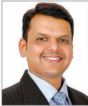
ଶ୍ରୀ ଦେବେନ୍ଦ୍ର ପ୍ରତନବିସ୍ ମାନ୍ୟବର ମୁଖ୍ୟମନ୍ତ୍ରୀ, ମହାରାଷ୍ଟ୍ର