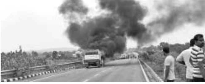
ଜଳୁଥିବା ପିକ୍ ଅପ୍