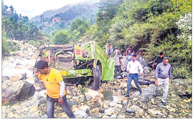
ଅଗ୍ନିହୋତ୍ରୀ ଘଟଣାସ୍ଥଳରେ ପହଞ୍ଚି ତଦନ୍ତ ଆରମ୍ଭ କରିଛନ୍ତି। ଆବଶ୍ୟକତା ଅଧିକ ଯାତ୍ରୀ ବସ୍‌ରେ ଯାତ୍ରା କରିବା ଓ ବୁଲାଇ

ହିମାଚଳ ପ୍ରଦେଶର କୁଲୁ ଜିଲ୍ଲାରେ ଏକ ଘରୋଇ ବସ୍ ୫୦୦ ଫୁଟ ତଳକୁ ଖସିପଡ଼ିବାରୁ ଏଥିରେ ଥିବା ଯାତ୍ରୀଙ୍କ ମଧ୍ୟରୁ ୨୫ଜଣଙ୍କ ପ୍ରାଣହାନି ଘଟିଛି। ଅନ୍ୟ ୩୫ ଜଣ ଆହତ ହୋଇ ନିକଟସ୍ଥ ହସ୍ପିଟାଲରେ ଚିକିତ୍ସିତ ହେଉଥିବା ଜଣାପଡ଼ିଛି। ବସ୍‌ରେ ପାଖାପାଖି ୬୦ରୁ ଊର୍ଦ୍ଧ୍ୱ ଯାତ୍ରୀ ଥିଲେ। ବଞ୍ଚିଥିବା ସହରରୁ ଗଡ଼ୁଆରି ଅଞ୍ଚଳକୁ ଯାଉଥିବା ଏହି ବସ୍‌ଟି ପାର୍ବତ୍ୟାଞ୍ଚଳରେ ଭାରସାମ୍ୟ ହରାଇ ଏକ ଖାତରେ ଖସି ପଡ଼ିଥିଲା। ଏବେ ଉଦ୍ଧାର କାର୍ଯ୍ୟ ଚାଲିଥିବାବେଳେ ମୃତ୍ୟୁସଂଖ୍ୟା ବୃଦ୍ଧିବା ଆଶଙ୍କା କରାଯାଇଛି। କୁଲୁ ଏସ୍‌ପି ଶାନ୍ତିନା