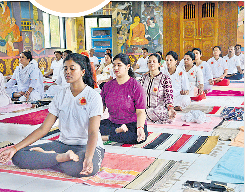
ଅନ୍ତର୍ଜାତୀୟ ଯୋଗ ଦିବସ ପାଇଁ ଗୁରୁବାର ପ୍ରୟାଗ ପକ୍ଷରୁ ଭୁବନେଶ୍ୱର ବୁକ ମିନିଓରେ ଅନୁଷ୍ଠିତ ଅଭ୍ୟାସ କାର୍ଯ୍ୟକ୍ରମ।