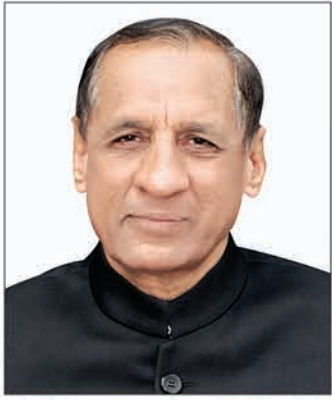
ଶ୍ରୀ ଇ.ଏସ୍.ଏଲ୍. ନରସିଂହନ୍ ମାନ୍ୟବର ରାଜ୍ୟପାଳ, ତେଲେଙ୍ଗାନା ଓ ଆନ୍ଧ୍ରପ୍ରଦେଶ