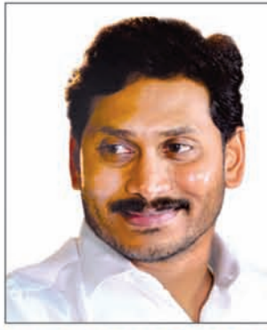
ଶ୍ରୀ ଓ.ଏସ୍. ଜଗନ୍ନାଥ ରେଡ୍ଡି ମାନ୍ୟବର ମୁଖ୍ୟମନ୍ତ୍ରୀ, ଆନ୍ଧ୍ରପ୍ରଦେଶ

ବିଶ୍ୱର ସର୍ବବୃହତ୍ ବହୁ-ସ୍ତରୀୟ, ବହୁ-ଉଦ୍ଦେଶ୍ୟୀୟ ଉଠା ଜଳସେଚନ ଯୋଜନା ଭାରତର ଗର୍ବ ଏବଂ ତେଲେଙ୍ଗାନା ପାଇଁ ବରଦାନ