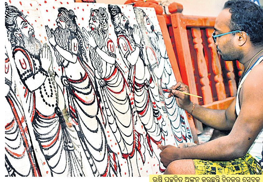
ରଷି ପଟ୍ଟଚିତ୍ର ଅଙ୍କନ କରୁଛନ୍ତି ଚିତ୍ରକର ସେବକ