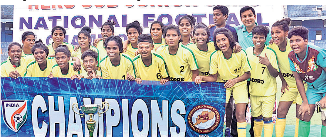
ଚୂର୍ଣ୍ଣ ସହ ଚାମ୍ପିୟନ ଝାଡ଼ଖଣ୍ଡର ଖେଳାଳିମାନେ।