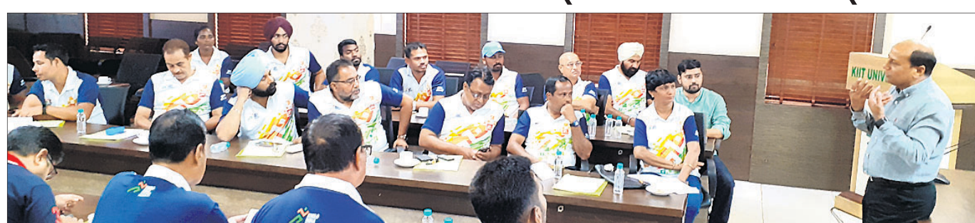
ପ୍ରଶିକ୍ଷଣ ଶିବିରରେ ଅଂଗ୍ରହଣ କରିଥିବା ହକି କୋର୍ଟ୍ କର୍ମୀଶାଳାରେ।